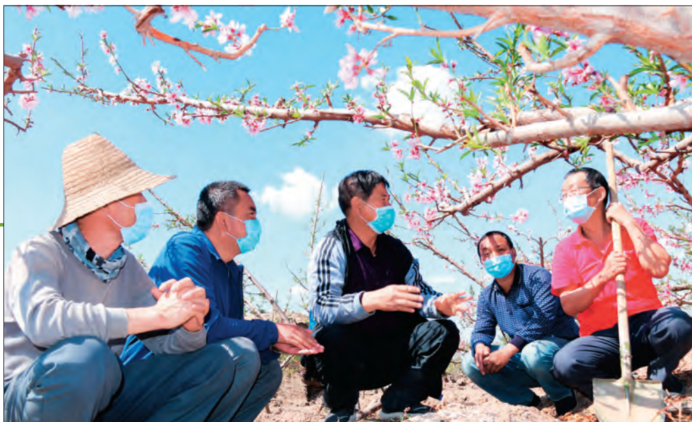
昌吉市自然资源局驻二工村“访惠聚”工作队邀请林业技术专家为果农培训林果技术。