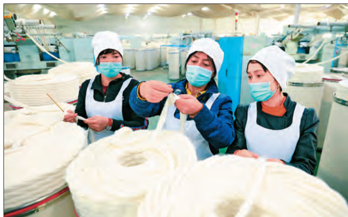
▲乌苏市用足用好纺织服装产业发展优惠政策,建立扶贫车间,帮助村民在家门口就业增收。