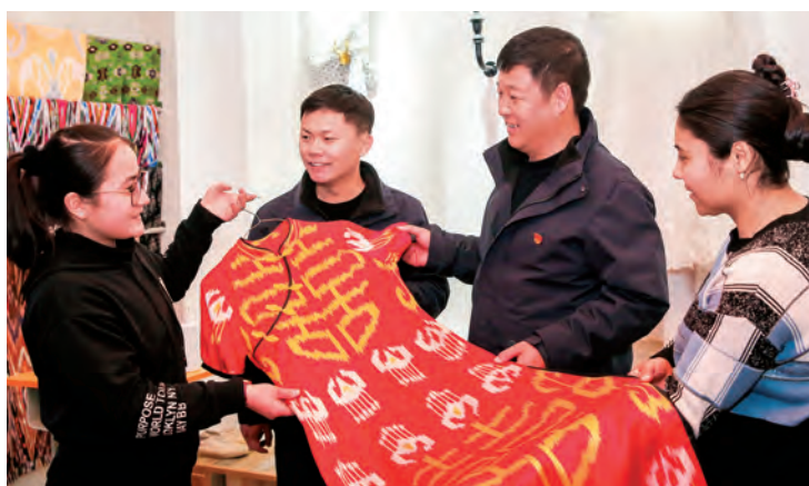
▲和田地区构建“县有龙头企业、乡有规模企业、村有卫星工厂、户有小作坊”就业布局,帮助群众致富奔小康。