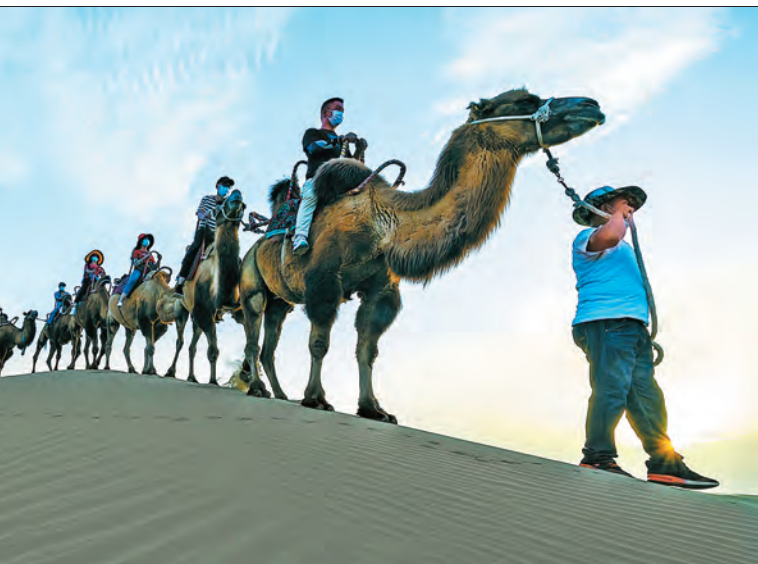
带动群众吃上“旅游饭”。图为尉犁县罗布人村寨景区,游客骑骆驼游沙漠。