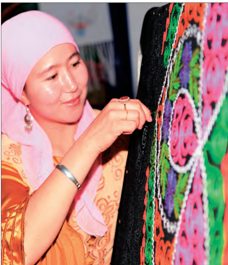
▲布尔津县以村党支部为引领,通过“一村一品、一户一策”精准扶贫,创出 26 个村品牌,惠及 7 万多名群众。