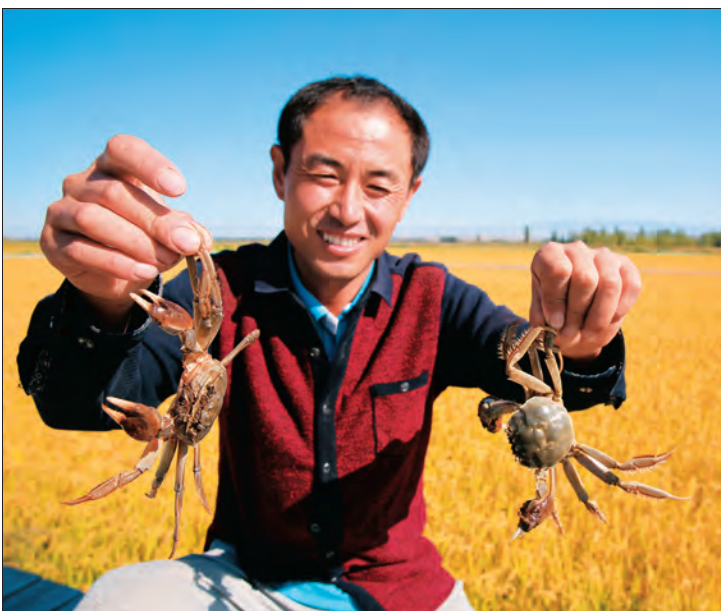
▲由江苏省对口支援伊犁州前方指挥部牵线,察布查尔县引进“稻蟹共作”种植技术,拓宽村民增收渠道。