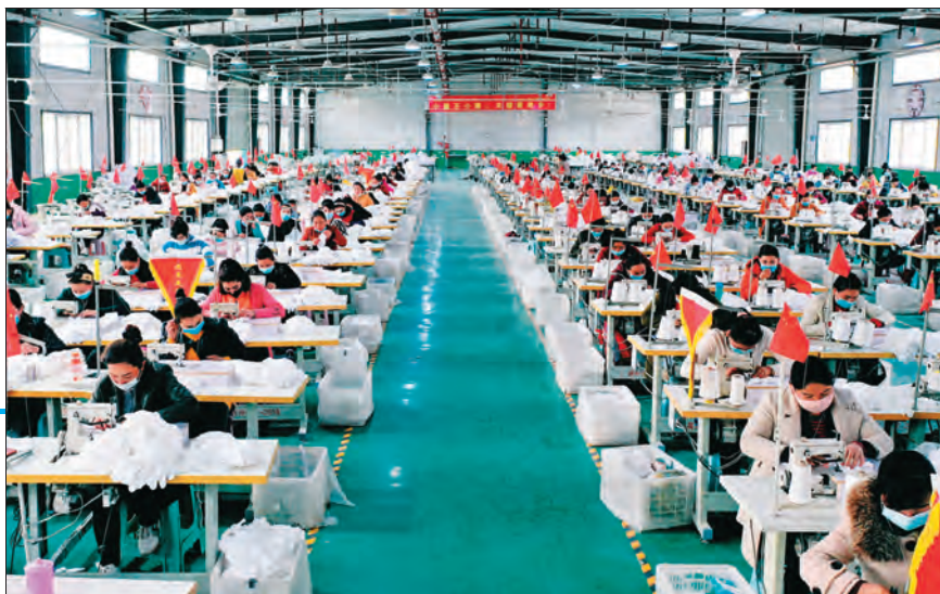
山东省对口援疆工作前方指挥部创新“总部+千家万户”就业模式,破解企业招工难、群众就业难问题。