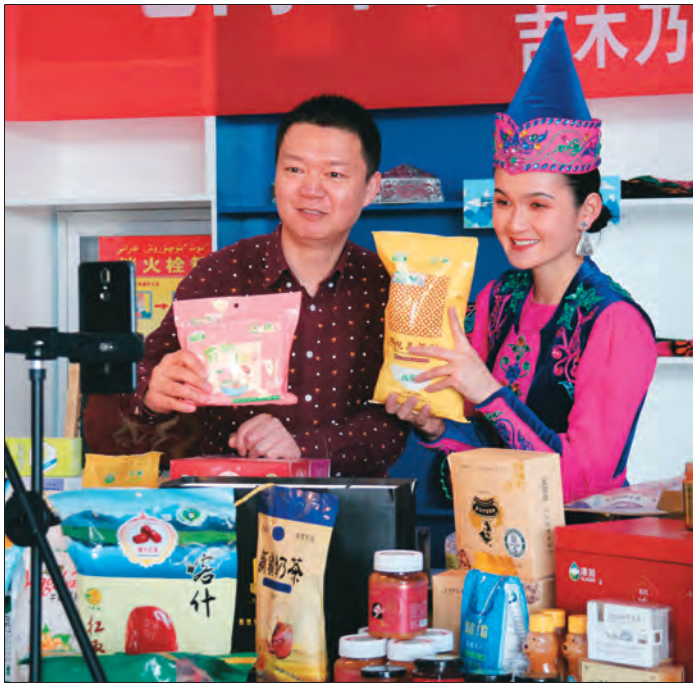
▲吉木乃县通过网络直播,推介农特产品,助推产销对接。