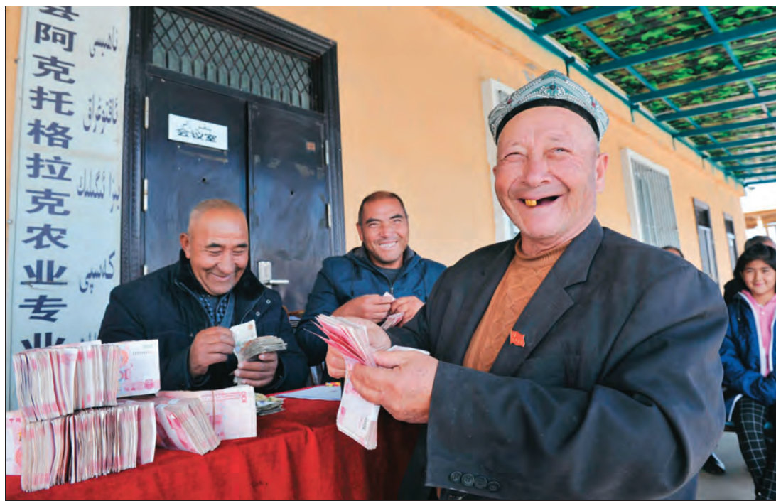
▲自治区农机局驻巴楚县阿克托格拉克村“访惠聚”工作队推动成立农业专业合作社,引领农业生产转型升级、带领村民致富。图为合作社社员领到土地流转费。