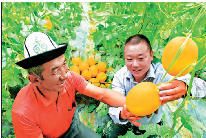
▲克孜勒苏柯尔克孜自治州把发展现代设施农业和现代科学技术结合起来,带领农牧民走上科技致富道路。图为阿合奇县农牧业科技示范园技术人员指导村民种植甜瓜。