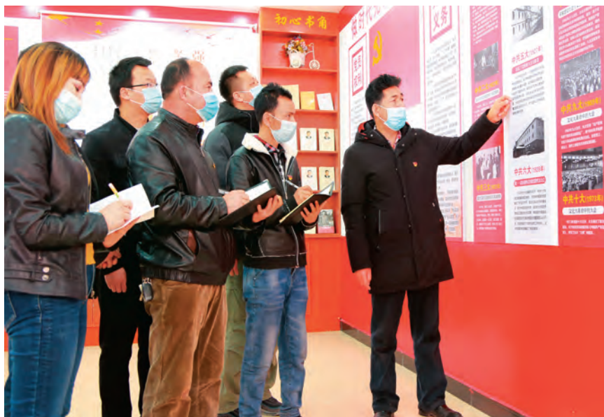
拜城县开展“党旗映天山”主题党日活动,党员干部参观党史图片展。