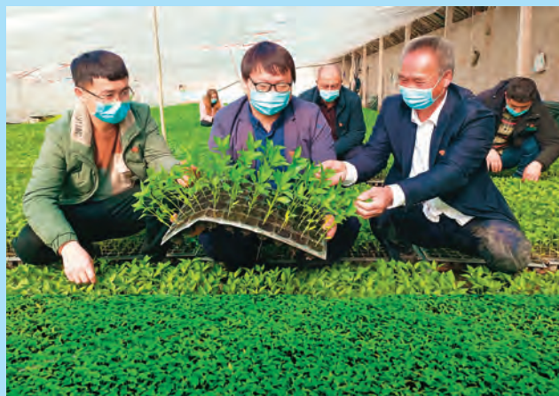
新疆和静县选派优秀年轻干部到基层一线实践锻炼，帮助年轻干部提升能力素质。图为90后村党支部书记深入田间地头访民情。