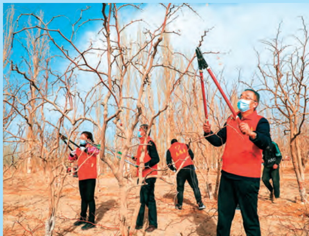
新疆且末县组织驻村工作队队员、村干部、农牧民党员成立党员志愿服务队,对枣农进行枣树管理指导。

新疆富蕴县结合县域经济社会发展需要,探索与期满援疆干部和专业技术人员建立“智援富蕴”长效机制。通过与受援单位座谈了解、摸底调研,梳理出本地较为急需紧缺和高层次人才需求,将具有中级职称以上的42名教育、医疗和农业产业化期满援疆专业技术人员特聘为“顾问”,签订智援富蕴长期合作协议,以个人或团队形式开展远程交流分享、研讨咨询和技术攻关活动,延续“1+X”师徒帮带,实现“人才不为我有,但为我用”。(张遂春)