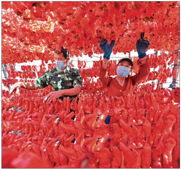
▲巴里坤县三塘湖镇发展特色产业助增收。