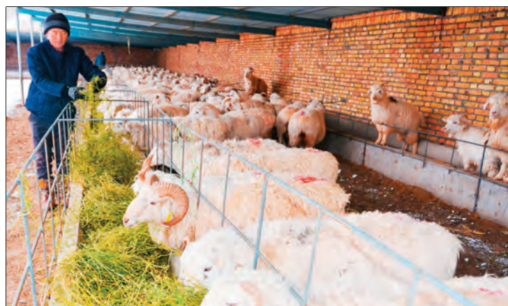
▲塔城市也门勒乡沃布逊村党支部帮助牧民引进优良品种,扩大养殖规模,助力增收。