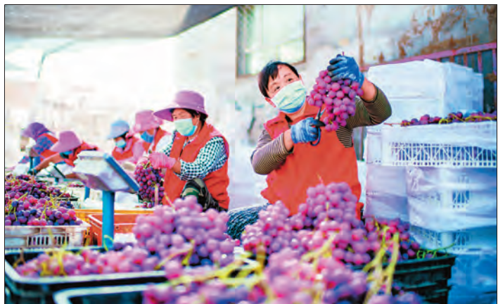
▲昌吉市打造“合作社+贮藏保鲜+统一销售”产业链,带动农民增收致富。图为该市大西渠镇玉堂村葡萄保鲜合作社的社员分拣葡萄。