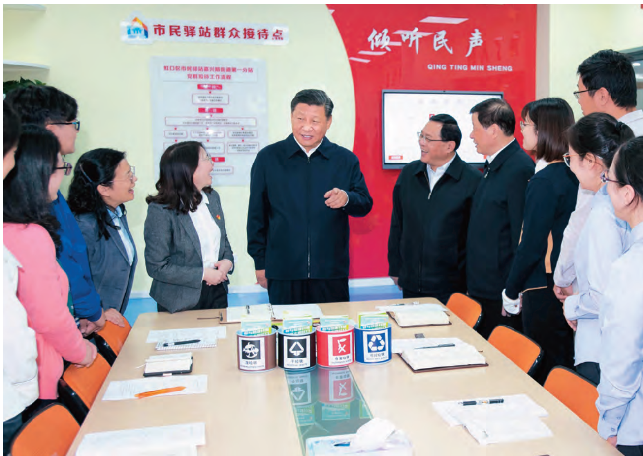
2018年11月6日至7日,中共中央总书记、国家主席、中央军委主席习近平在上海考察。这是6日上午,习近平在虹口区市民驿站嘉兴路街道第一分站,同几位正在交流社区推广垃圾分类的做法的年轻人亲切交谈。

社会主义现代化国家,是一个始终需要高度重视的重大课题。历史是最好的教科书,也是最好的清醒剂。我们党领导社会主义法治建设,既有成功经验,也有失误教训。特别是十年内乱期间,法制遭到严重破坏,党和人民付出了沉重代价。“文化大革命”结束后,邓小平同志把这个问题提到关系党和国家前途命运的高度,强调“必须加强法制。必须使民主制度化、法律化”。正反两方面的经验告诉我们,国际国内环