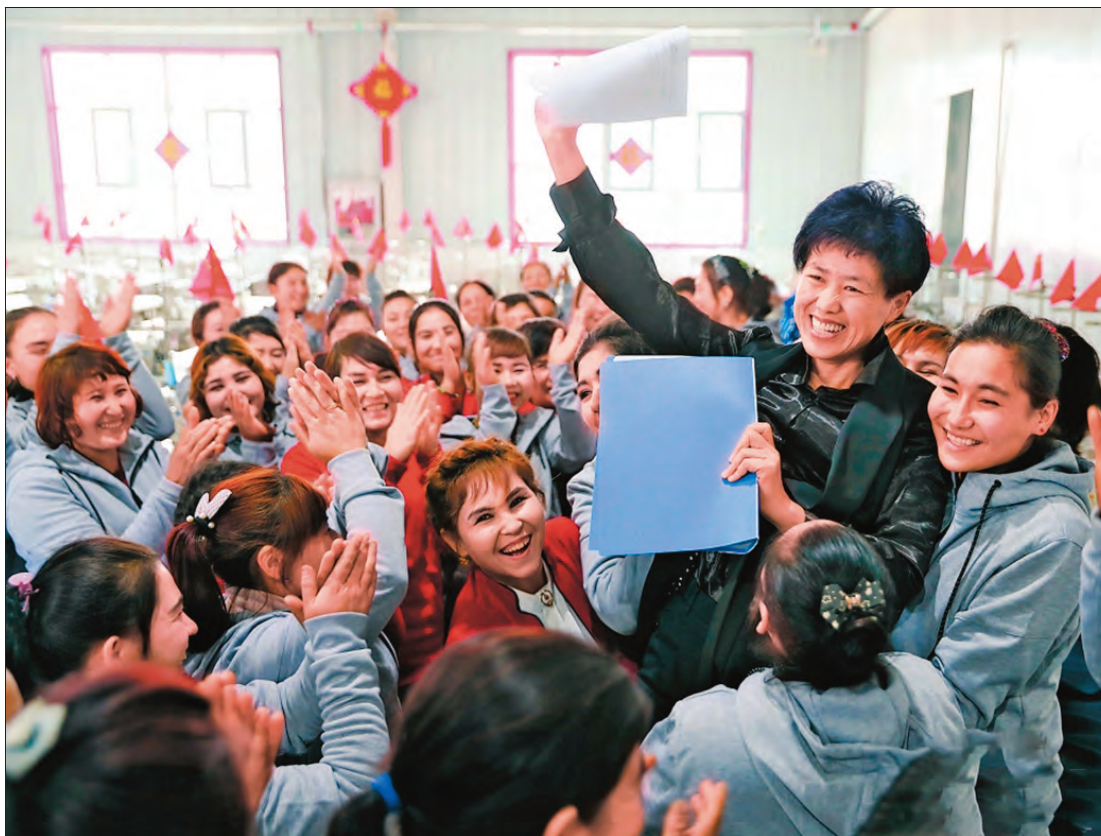
◀叶城县想方设法增加就业,做到家家有门路、人人有事干、月月有收入。图为一家纺织企业向员工宣布签订1亿元订单的喜讯。