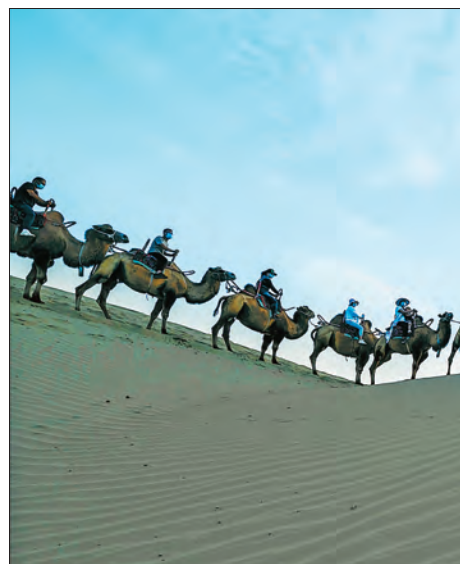
▲巴音郭楞蒙古自治州发展旅游产业,带动

草长莺飞,春和景明。新疆各级党组织充分发挥政治优势、组织优势和群众工作优势,团结带领党员干部群众凝心聚力再出发,同群众想在一起、干在一起,扎实做好巩固拓展脱贫攻坚成果同乡村振兴有效衔接,用勤劳的双手创造幸福生活。