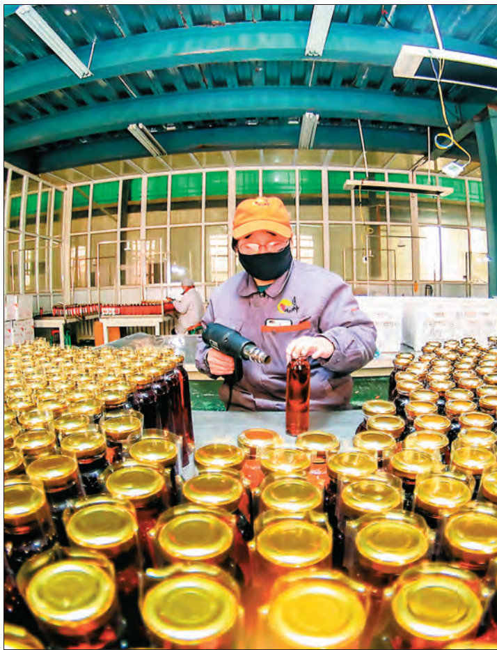
▲精河县延伸枸杞产业链,吸纳村民就业增收。