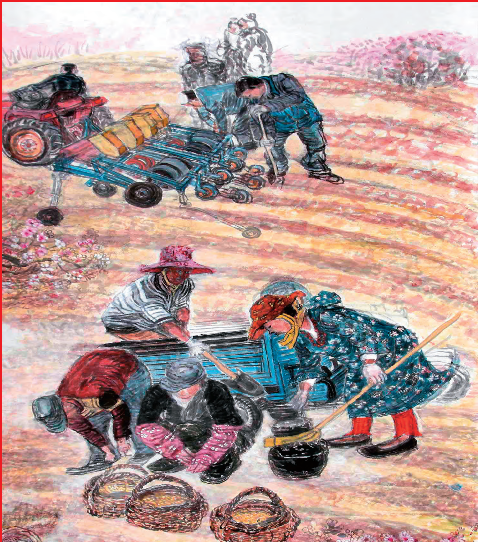
“奋进·决胜”新疆画院脱贫攻坚主题美术作品选 —— 《第一书记们》 作者 / 娜乌拉·加汗

近年来,新疆各级党组织积极选派优秀干部到村担任第一书记,在脱贫攻坚的主战场上勇于担当、甘于奉献,充分发挥“领头雁”作用,奋力推进脱贫攻坚同乡村振兴有效衔接,让群众过上幸福生活。