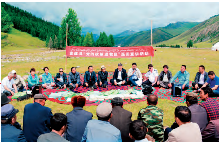
富蕴县“马丁别克宣讲团”深入牧区,在牧民中宣讲。