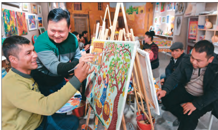
▲阿瓦提县成立农民画专业合作社,推进农民画向产业化转型,促进村民增收。