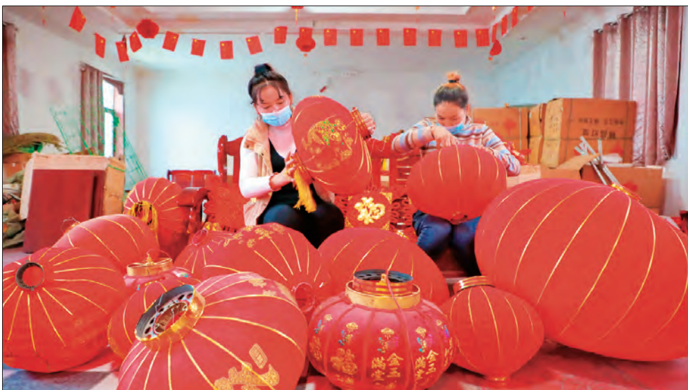
▲库车市立足乡村传统手工技艺,大力发展合作社和村办企业,带动村民在家门口实现就业增收。