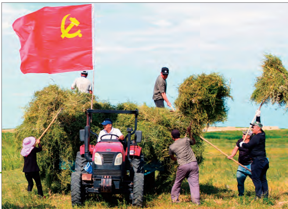
福海县委组织部党员干部为群众办实事。