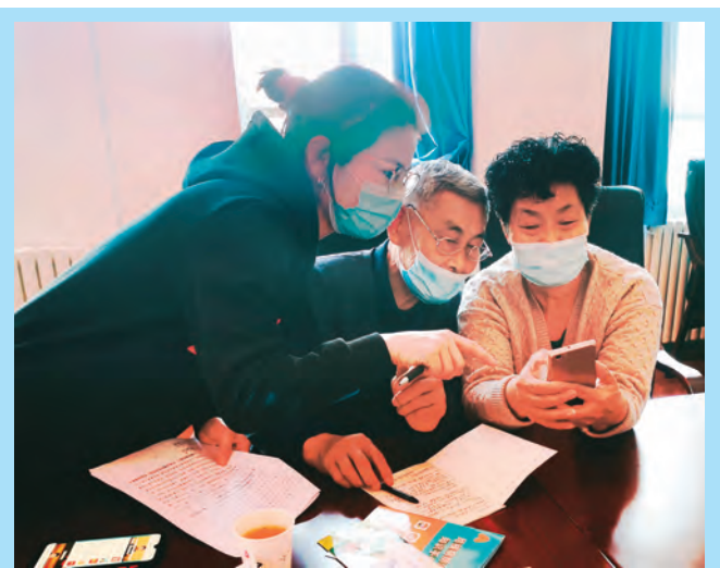
新疆巩留县举办退休干部学习应用智能手机专题培训,让退休干部充分享受智能新生活。 □解慧娟/摄

山东省聊城市东昌府区在领导机制、招才育才、服务保障上精准发力,进一步激发了人才创新创业活力。成立了由党政主要负责同志为组长的人才工作领导小组,把人才工作纳入全区科学发展综合考核,促进人才工作各项目标任务落实。出台《关于实施“才兴东昌”行动,建设新时代人才聚集高地的若干措施(试行)》,构建“引、育、用、留”人才制度体系。实施“水城优才”优秀青年人才引进计划,启动“归雁兴聊”人才回引工程。与济南大学、聊城大学等签署校地战略合作协议,在山东大学、北京外国语大学等建立“双一流”人才引育工作站。完善引进人才“一站式”服务平台建设,为每一名来区创业的高层次人才或人才工程候选人配备“用才企业+驻地镇街+主管科局”的工作专班,在待遇享受、人才工程申报、业务指导等方面提供全流程、点对点的“店小二”式服务。 (芦宪会)