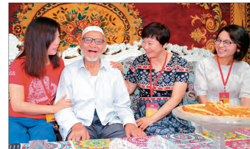
克拉玛依市社区“孝老爱亲”服务队定期到高龄老人家中送温暖、送服务。

此前，她对自家周边的环境不是很满意：流动商贩占道经营，绿化带里时常有纸箱、饮料瓶……2019年10月，街道党工委联合各相关部门开展拉网式隐患排查，对辖区城市治理的顽疾精准施策，共同发力，曾让石卫红头疼不已的问题在年底得到了根治，环境优美、秩序井然的新景象呈现在