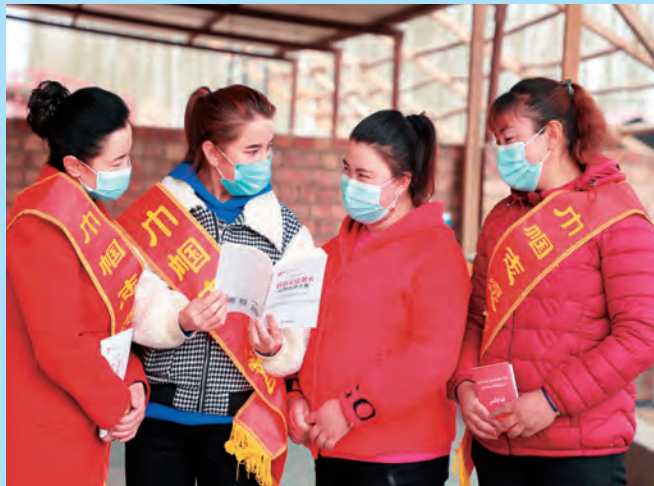
新疆库尔勒公路管理局且末分局驻且末县奥依亚依拉克镇奥依亚依拉克村“访惠聚”工作队中帼志愿者给妇女宣传婚姻家庭法律知识。

照“结业不毕业”原则,持续对村级干部培训进行跟踪问效,县委组织部干部每月定期下村,通过“教着干、带着干、帮着干”等方式,切实提升村级干部解决实际问题的能力。截至目前,培训覆盖135人次。 (于娇娇)