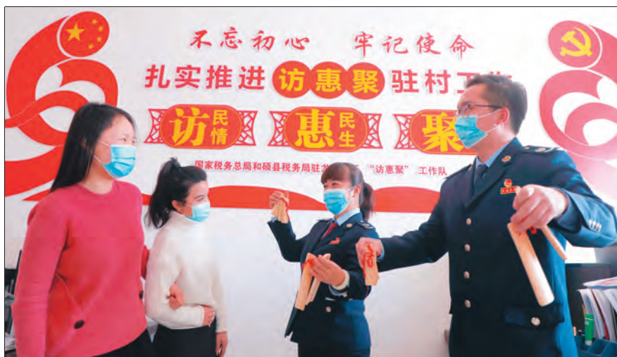
国家税务总局和硕县税务局驻龙驹社区“访惠聚”工作队,通过快板形式宣传党的十九届五中全会精神和第三次中央新疆工作座谈会精神。

他于2015年牵头成立了蔬菜专业合作社。为突出党组织示范引领作用,哈尔乌苏村和蔬菜专业合作社成立联合党支部,带领合作社助力乡村振兴。驻村工作队还联合村“两委”实施“双培双带”工程,把党员培养成致富带头人,把致富带头人培养成党员,先后有25名种植、养殖能手递交了入党申请书,培养党员致富带头人6名,3人进入了村“两委”班子,为发展村集体经