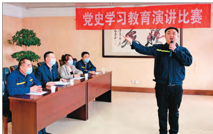
▲新疆中油化工集团有限公司党支部开展党史学习教育演讲比赛，抒发爱党爱国情怀。