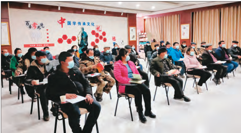
▲新疆维吾尔自治区工业和信息化厅驻麦盖提县吐曼塔勒村“访惠聚”工作队组织全村党员参观红色文化展览馆,追寻党与人民风雨同舟、生死与共的红色记忆。

新疆各地各级党组织认真学习贯彻习近平总书记重要讲话精神,开展形式多样的党史学习教育,通过举办党史教育培训、专题党课、党史知识问答等活动,回顾中国共产党建党百年的光辉历程,推动党史学习教育高质量开展,使党史学习教育深入群众、深入基层、深入人心。