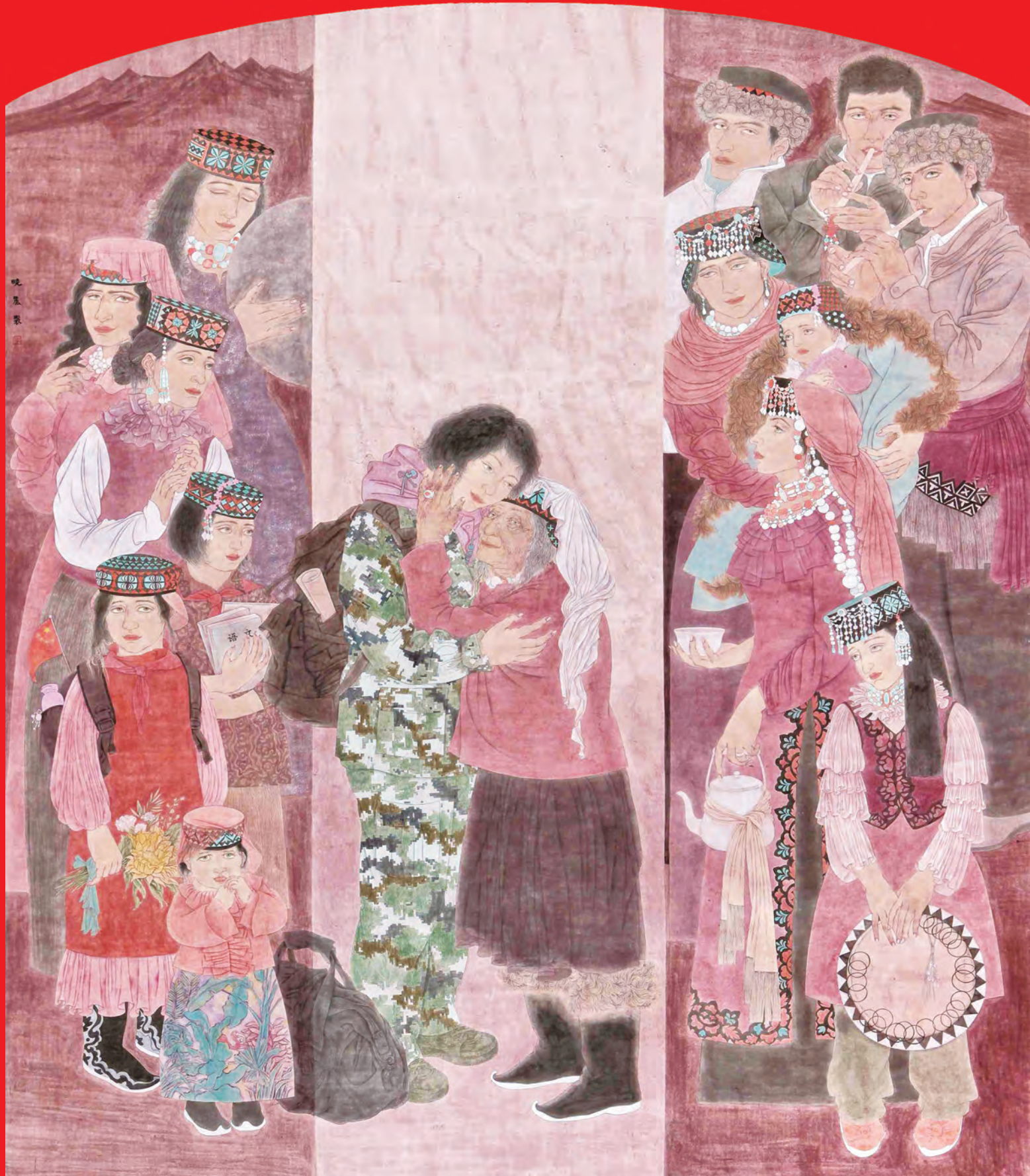
“奋进·决胜”新疆画院脱贫攻坚主题美术作品选 ——《援疆大爱》 作者/褚晓莉

同心接力支援,助推新疆发展。2016-2020年,19个援疆省市累计投入援疆资金766.77亿元以上,实施援疆项目8540个,80%以上援疆资金投入民生领域和基层,实施了一大批重点民生项目,极大改善了受援地基础设施和群众生产生活条件。