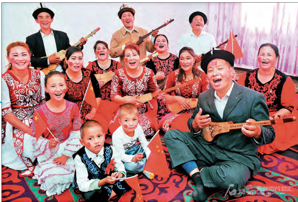
阿克陶县昆仑佳苑社区的居民欢聚一堂歌颂幸福生活。