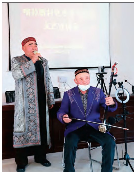
▲阿勒泰地区布尔津县基层党组织纷纷组建党史学习教育宣讲队，以阿肯弹唱等喜闻乐见的形式开展党史学习教育。