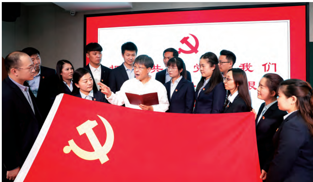
乌鲁木齐益博仟叶教育有限公司党支部开展党史学习教育专题党课。

随着经济社会结构的深刻变化，新疆乌鲁木齐市非公有制经济组织和社会组织(以下简称“两新”组织)如雨后春笋不断涌现。“两新”组织在推动创新、增加就业、改善民生等方面发挥着重要作用，成为拉动乌鲁木齐市经济增长的“新引擎”。