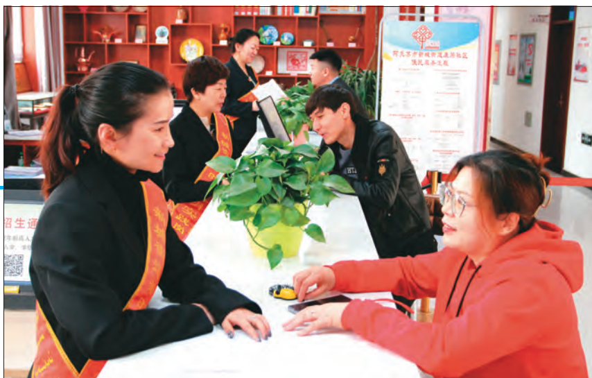
阿克苏市新城街道康居社区便民服务站工作人员正在为群众办理业务。

小区整合不是易事,旧改启动之初,首先面临的就是群众的“心墙”难解。祥和里小区能在短时间内解决这一问题,关键是社区党组织发挥领导核心作用,将前期工作做细,瞄准靶心,精准把握居民所想所需。为把好事办好,社区全覆盖走访了祥和里小区居民,先后两次发放调查问卷,多次组