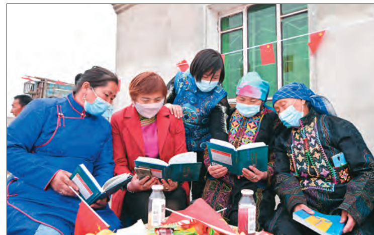
▲塔城地区和布克赛尔蒙古自治县文化体育广播电视和旅游局组织乌兰牧骑宣讲队进牧区向基层群众开展党史学习教育。 □何承强 / 摄