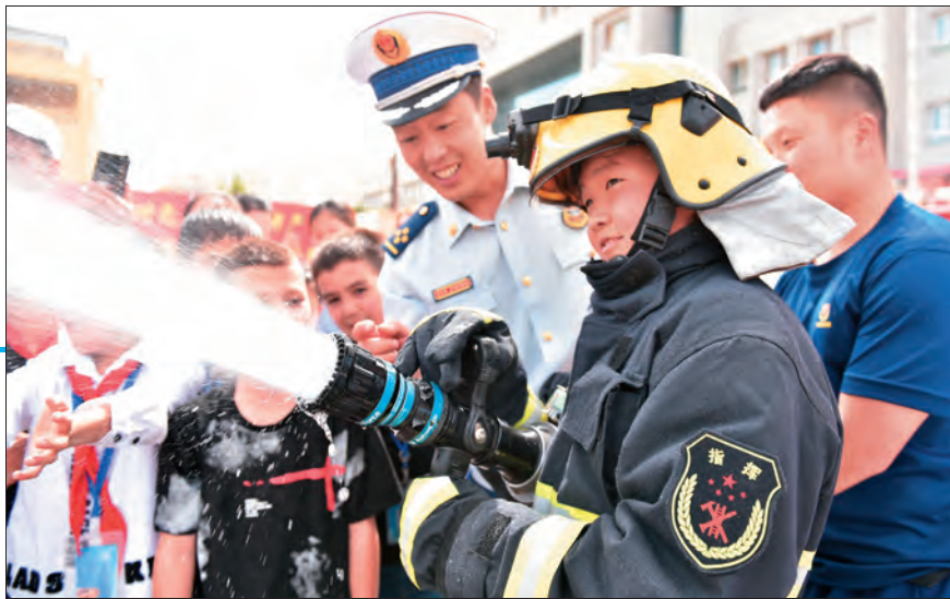
阿图什市消防救援大队消防员为该市前进路社区群众讲解消防常识。