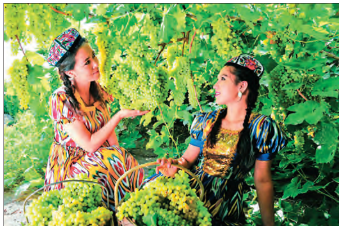
葡萄产业成为吐鲁番旅游业的一张靓丽名片。