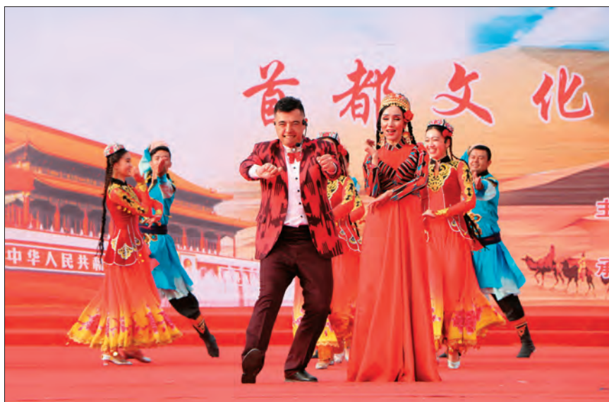
北京市援疆和田指挥部组织的“我们的中国梦·中华文化耀和田”首都文化月演出活动在新疆和田市启动。

2020 年，北京市援疆和田指挥部继续加大产业援疆力度，投入援疆资金 2.8 亿余元，实施产业援疆项目 23 个，并设立 300 万元招商引资专项经