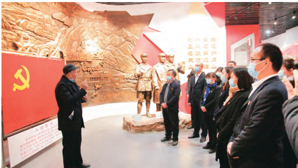
新源县委组织部党员干部在“红军纪念馆”聆听老党员讲党史。