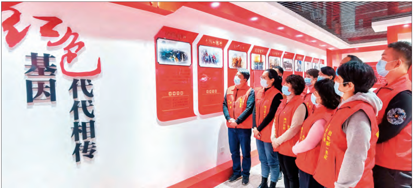
▲乌鲁木齐市沙依巴克区和田街片区管委会组织党员赴红色教育基地开展“学党史、悟思想、忆初心”主题活动。

庆祝中国共产党成立100周年 The 100th Anniversary of the Founding of The Communist Party of China