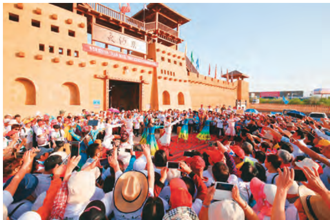
游客在吐鲁番交河驿门前观看歌舞演出。