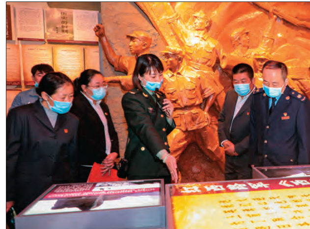
▲国家税务总局哈密市税务局组织党员到红军西路军进疆纪念馆开展“学党史、守初心、铸税魂”主题活动。