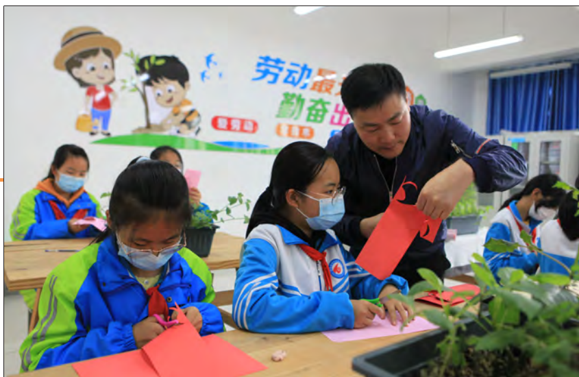
浙江文艺名家开展优秀传统文化进阿克苏校园活动。

百店”升级版工程中，注意加强线下销售渠道不断扩面增点，增加线上渠道，加快数字赋能，在天猫、京东、微信等平台累计开设网店73家。据统计，2020年通过“十城百店”线上线下渠道销售阿克苏地区、兵团第一师农产品23.8万吨，销售额达35.8亿元，同比增长98%。同时，浙江省援疆指挥部还积极推进浙江省直机关、地市级机关、国企等单位消费帮扶。2020年，浙江省各级机关直接采购阿克苏地区和兵团第一师农产品金额达1.2亿元，