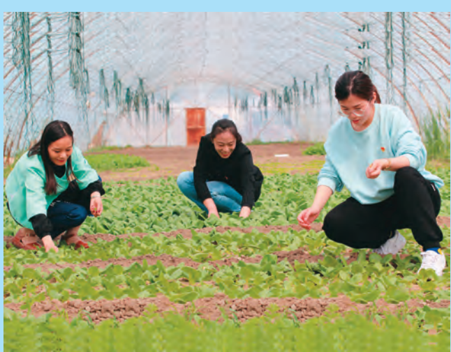
新疆福海县福海镇党员干部在人民路社区良种场蔬菜大棚内帮助群众除草护苗。