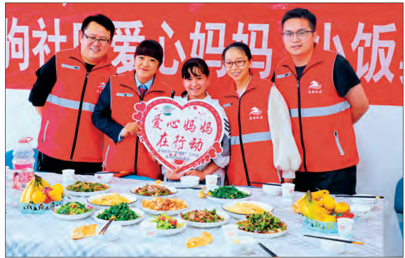
▲巴音郭楞蒙古自治州和硕县龙驹社区成立“爱心妈妈”志愿服务队，为父母外出的孩子提供“小饭桌”服务。