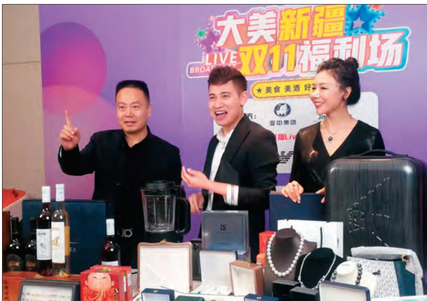
新疆亚中集团所属亚中商城开展直播带货,探索传统产业适应现代市场发展之路。

哪里有党组织,哪里就有凝聚力。2017 年 4 月,亚中集团建材有限公司新厂区开工建设。当时,建材行业市场