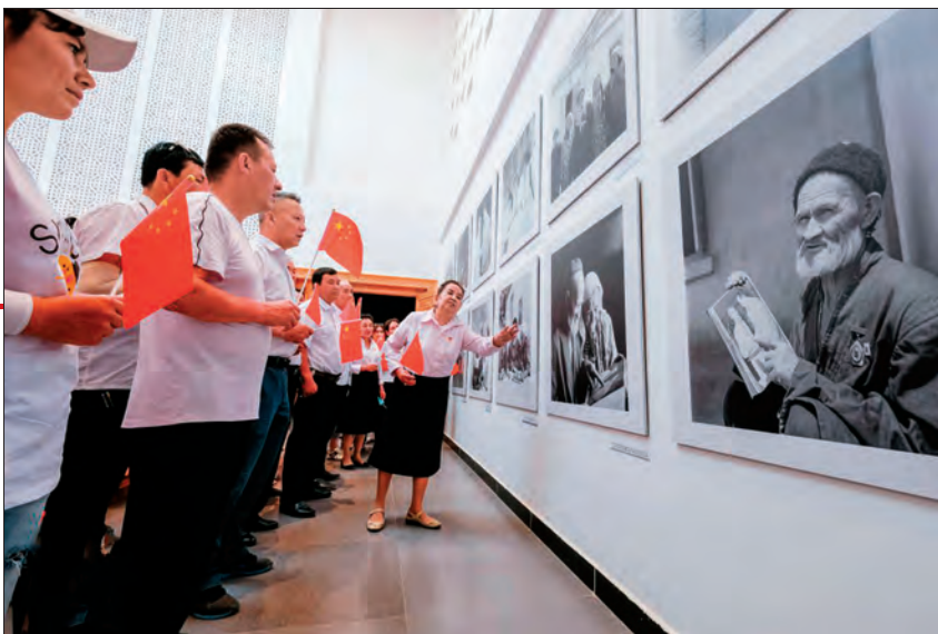
于田县先拜巴扎镇党员干部在库尔班·吐鲁木纪念馆参观。