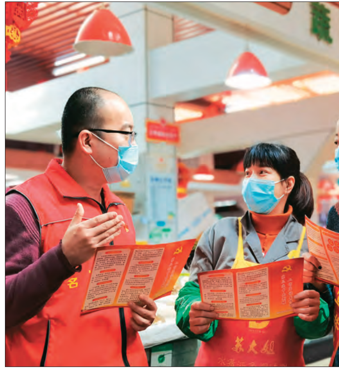
▲乌鲁木齐市沙依巴克区和田街片区党员干部走上街头宣讲党的惠民政策。