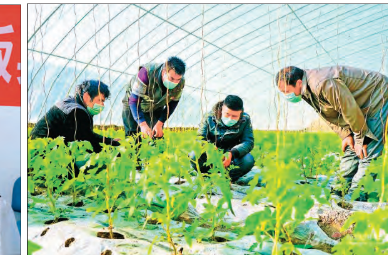
▲ 阿克苏地区库车市组织百余名农技“土专家”成立志愿服务队,到基层开展送技术活动。