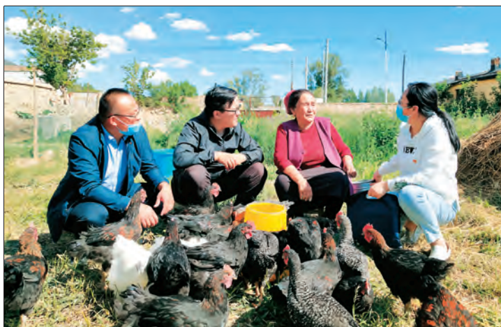
▲ 阿勒泰地区阿勒泰市农业农村局选派科技特派员对农户开展技术帮扶,帮助群众增收致富。