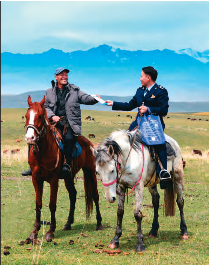
▲国家税务总局昭苏县税务局推出便民实招，成立“马背宣讲队”把惠民政策送到农牧民手中。

党史学习教育开展以来，新疆维吾尔自治区各级党组织结合实际，扎实开展“我为群众办实事”实践活动。全区各级党员干部深入群众、深入基层，开展形式多样的为民服务办实事活动，在天山南北汇聚起建设美丽新疆、共圆祖国梦想的磅礴力量。