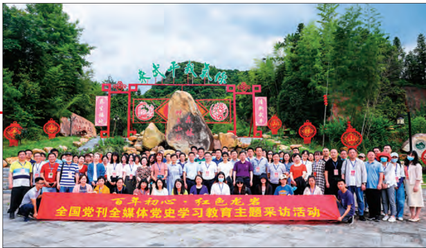
5月18日至20日，“百年初心·红色龙岩”全国党刊全媒体党史学习教育主题采访活动在福建省龙岩市圆满举行。

“红”土地书写“绿”文章，红色基因催生绿色发展。到2020年底，龙岩市已建成国家园林城市、国家森林城市，森林覆盖率达79.39%，林下经济经营面积1010万亩，实现产值220亿元；建成森林旅游景点景区332处，实现总产值41亿元……生态高颜值、发展高质量，红色龙岩书写了新时代绿色发展的亮丽答卷。