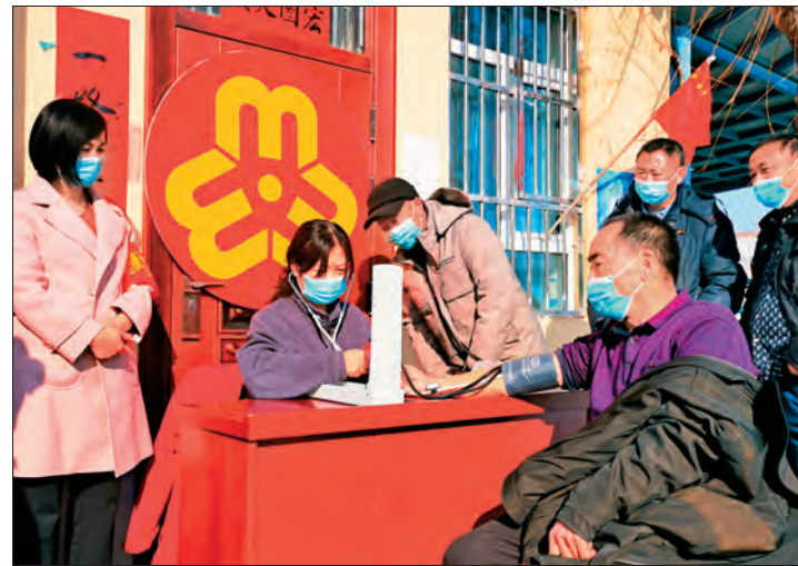
▲ 塔城地区额敏县人民医院驻加尔布拉克农场下大渠村“访惠聚”工作队开展“学党史,守初心,送健康”大型义诊活动。