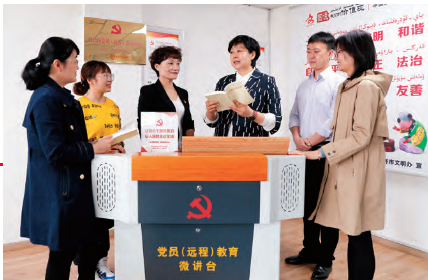
在乌鲁木齐高新技术产业开发区(新市区)锦域社区党员(远程)教育站点,党员干部们交流学习体会。

4月16日,在乌鲁木齐经济技术开发区(头屯河区)科技园社区的党群服务中心,中亚北路片区党工委组织辖区各社区“访惠聚”驻社区工作队队员前来开展党史学习教育。在党史陈列馆,“中共一大到十九大”的党史教育展板,深深吸引了工作队队员们的目光。“100年来,我们党带领全国各族人民,战胜各种艰难险阻,取得了从积贫积弱到实现全面小康的伟大成就……”