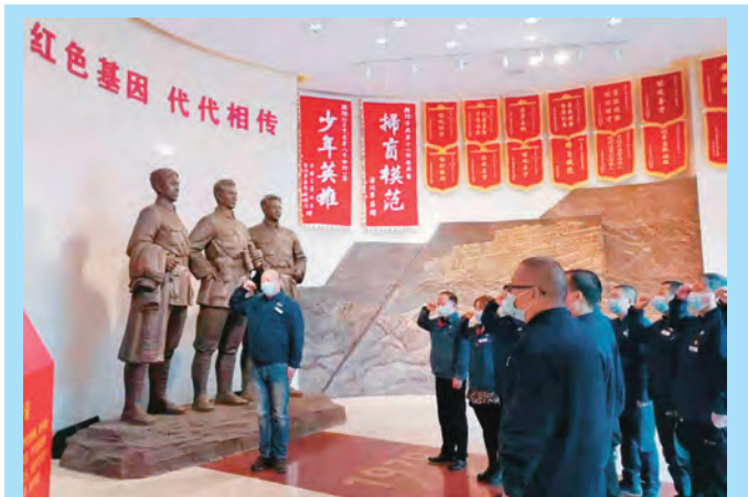
新疆乌鲁木齐水业集团排水公司党支部组织党员干部在新疆军区某红军师军事历史博物馆缅怀先烈,重温入党誓词。