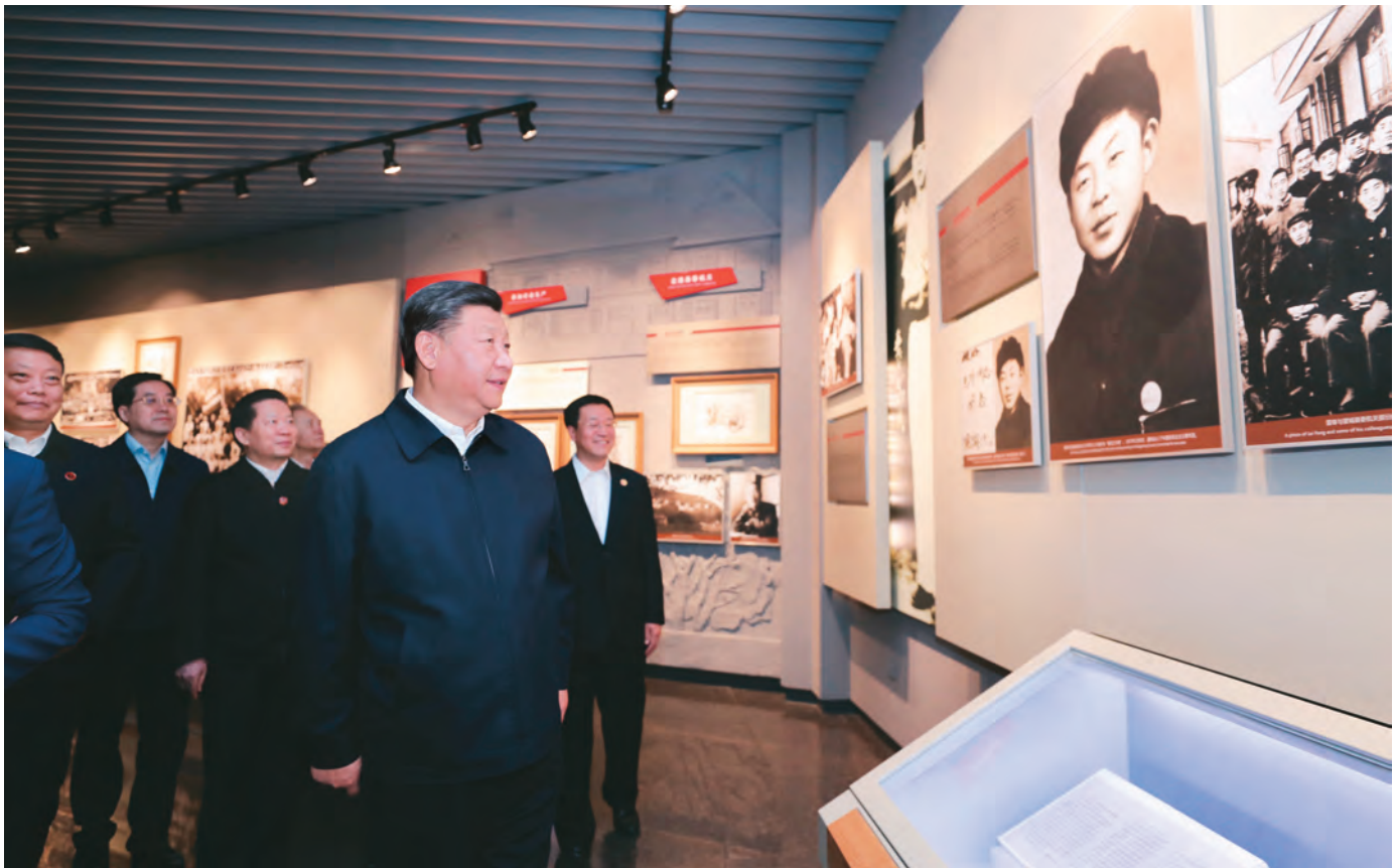
2018年9月25日至28日,中共中央总书记、国家主席、中央军委主席习近平在东北三省考察,主持召开深入推进东北振兴座谈会。这是28日上午,习近平在辽宁抚顺市参观雷锋纪念馆。