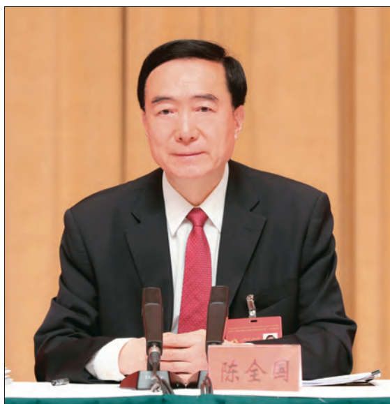
7月4日，中国共产党新疆维吾尔自治区第九届委员会第十二次全体会议在乌鲁木齐举行。自治区党委书记陈全国讲话。