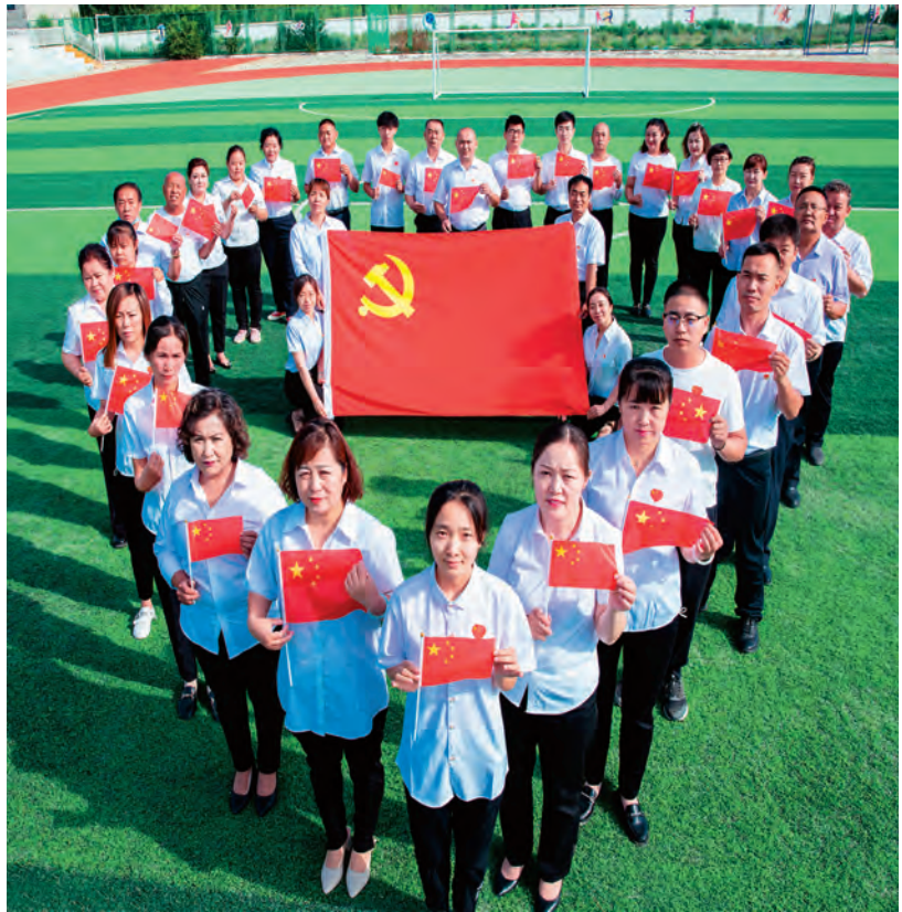
▲塔城市新城街道爱国社区党支部开展“党旗映天山”主题党日活