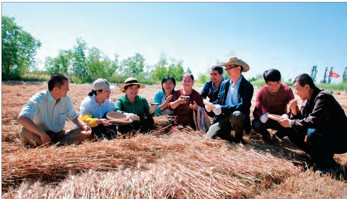
新疆维吾尔自治区市场监督管理局驻阿图什市松他克乡温吐萨克村“访惠聚”工作队帮助村民抢收小麦。