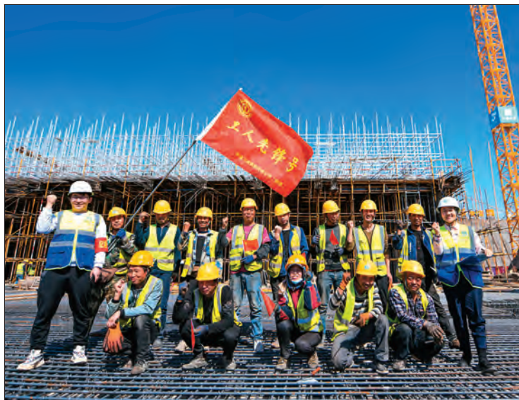
▲中建三局集团有限公司(新疆)乌鲁木齐机场改扩建项目党支部成立“工人先锋号”,以优质工程为建党百年献礼。