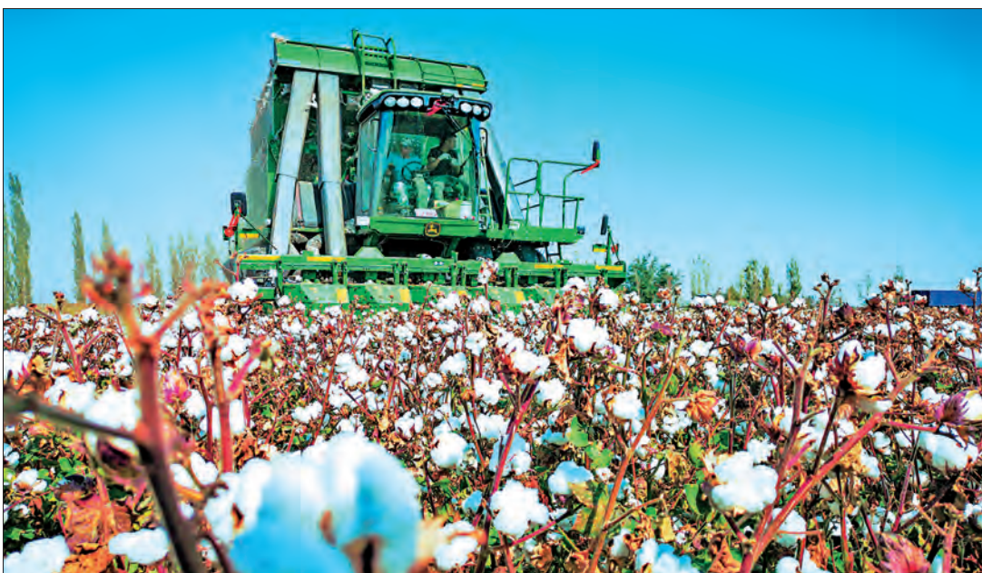
新疆不断提升农机作业现代化水平,持续助推棉花产业高质量发展。图为昌吉州玛纳斯县大型采棉机采收现场。

2.加强党的作风建设。新疆和平解放后,在党中央统一部署下,先后开展了三次整党整风运动。改革开放后,落实《中共中央关于整党的决定》,从1984年1月到1987年4月,全区56.1万余名党员分6批自上而下进行了整党。1992年开始重点整治侵害群