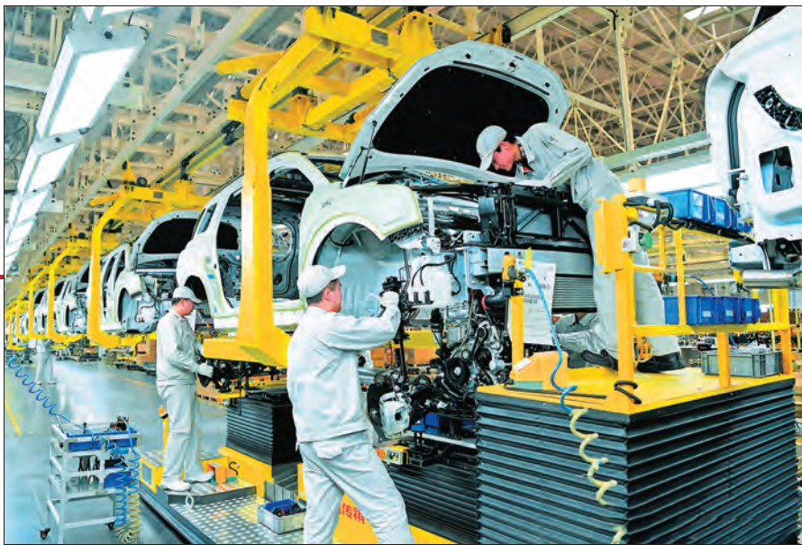
近年来,新疆汽车产业保持良好发展势头,汽车工业调整和转型升级加快,实现产销两旺。图为广州汽车集团乘用车有限公司新疆分公司生产车间。

3.恢复和发展国民经济。新疆和平解放后,大力恢复和发展农业、畜牧业、手工业等产业,农产品产量远超解放前历史最高水平,新疆由百业凋零转变为百业初兴。到1965年,国民收