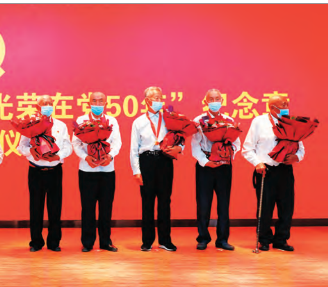
□李慧敏 / 摄