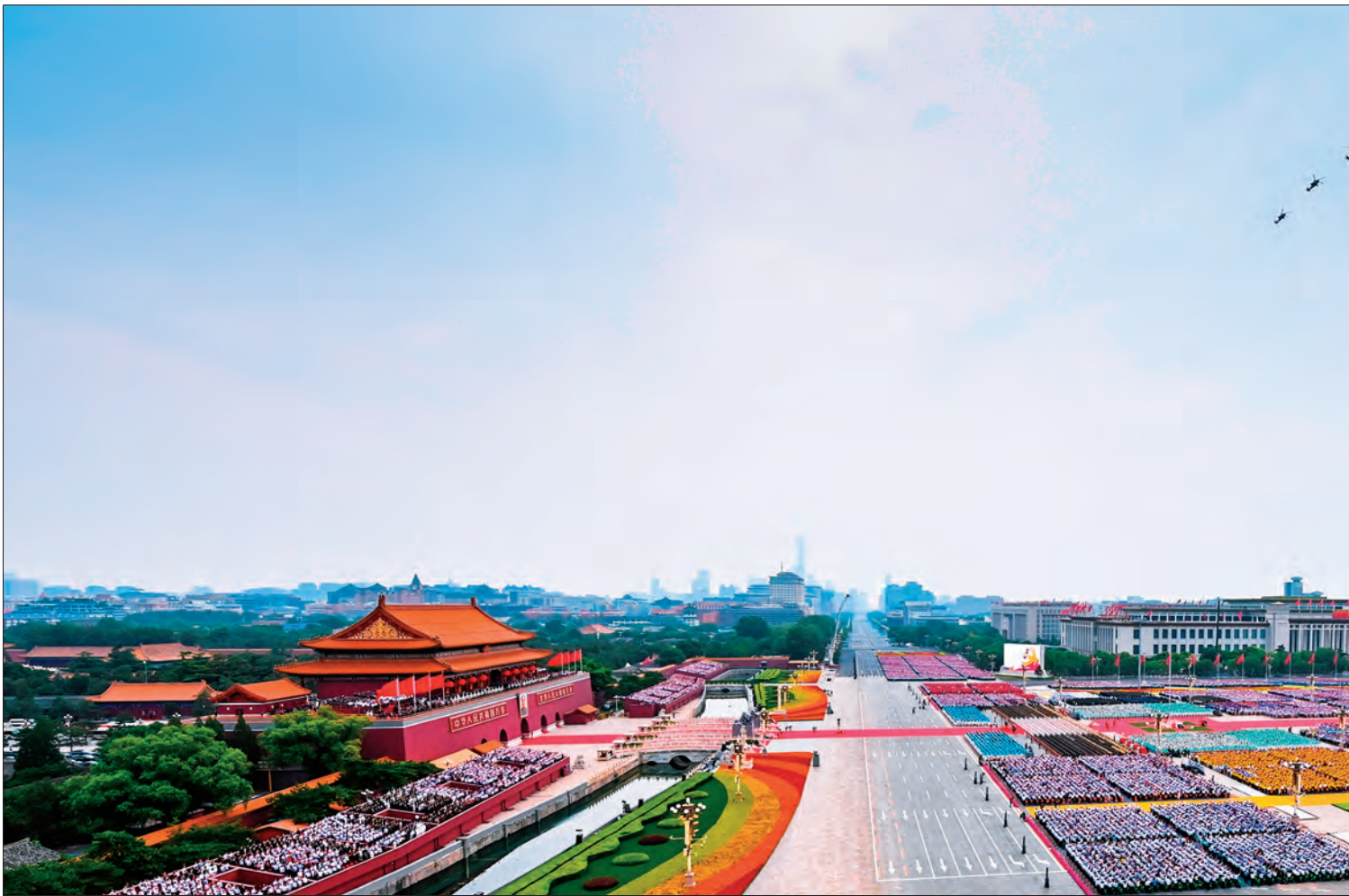
2021年7月1日,庆祝中国共产党成立100周年大会在北京天安门广场隆重举行。

中华民族拥有在 5000 多年历史演进中形成的灿烂文明,中国共产党拥有百年奋斗实践和 70 多年执政兴国经验,我们积极学习借鉴人类文明的一切有益成果,欢迎一切有益的建议和善意的批评,但我们绝不接受“教师爷”般颐