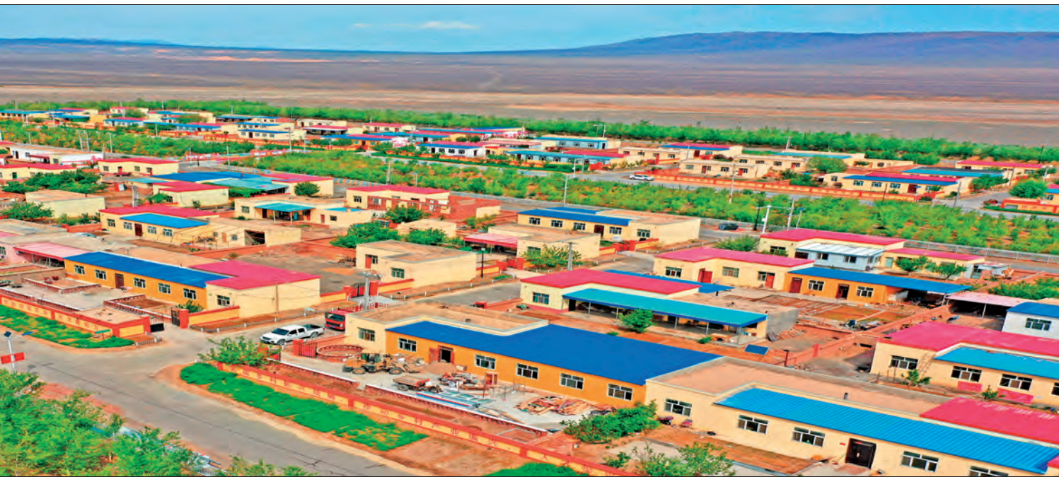
新疆伊吾县下马崖乡持续推进巩固拓展脱贫攻坚成果同乡村振兴有效衔接,乡村面貌焕然一新。