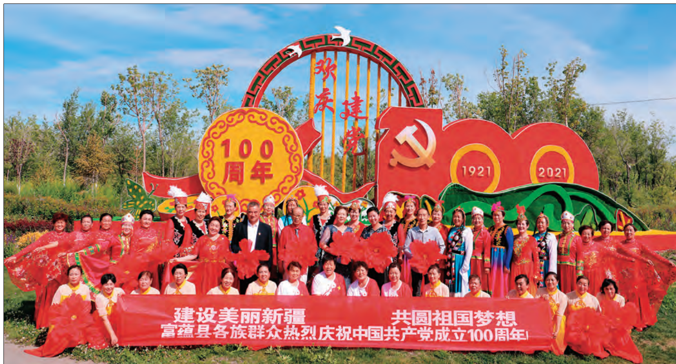
▲富蕴县老党员开展“建设美丽新疆·共圆祖国梦想”慰问演出活动,庆祝中国共产党成立100周年。