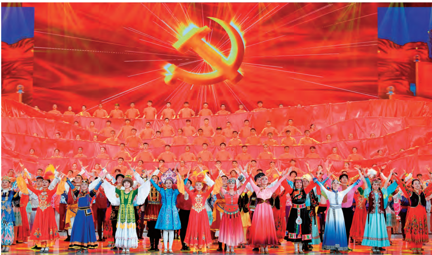
▲6月28日,新疆维吾尔自治区庆祝中国共产党成立100周年主题文艺晚会《光辉历程》在新疆人民会堂举行。 □韩亮/摄