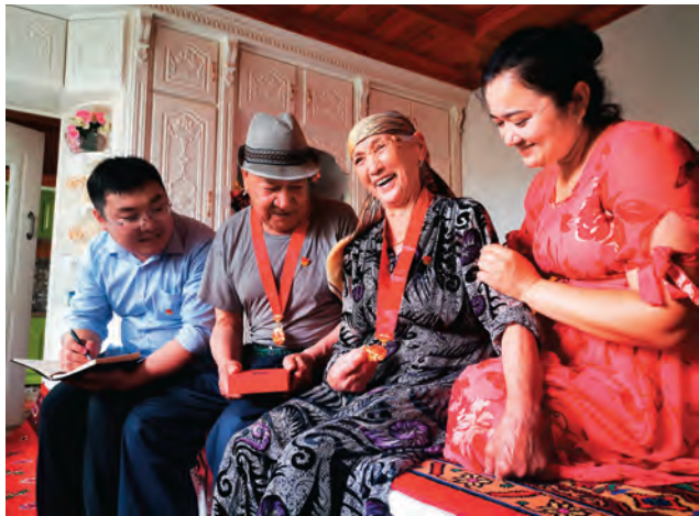
▲伊宁市开展慰问老党员、困难党员活动,为老党员送去组织的亲切关怀。 □王 婷 / 摄