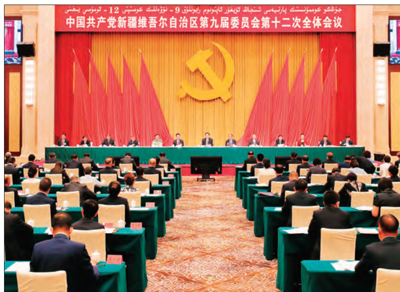
7月4日，中国共产党新疆维吾尔自治区第九届委员会第十二次全体会议在乌鲁木齐举行。图为大会会场。