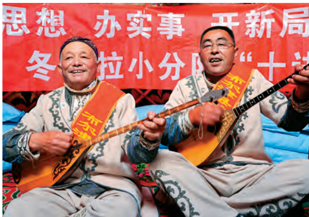
▲布尔津县成立“石榴籽宣讲团”“冬不拉小分队”,深入牧区宣讲党的百年光辉历程。