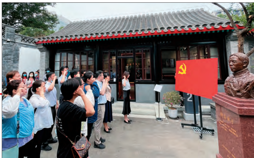
在京报馆旧址(邵飘萍旧居),党员重温入党誓词。

百年风雨兼程,百年风华正茂。党刊作为党的新闻事业的重要组成部分,党和人民的喉舌,百年来始终坚守共产党人的初心使命,高扬马克思主义理论旗帜,宣传党的主张、反映群众呼声,在党的各个历史时期发挥了重要的作用。在实现第二个百年奋斗目标新的赶考之路上,党刊工作者要从党的百年历史中、伟大的建党精神中汲取奋进力量,坚守党刊使命,积极推进内容创新,实现高质量发展,奋力推动党刊事业迈向新征程,为全面建成社会主义现代化强国的目标、实现中华民族伟大复兴的中国梦提供坚强有力的舆论支撑。 [责任编辑:朱振陆]