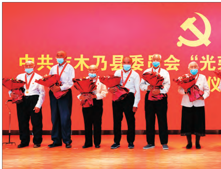
▲吉木乃县举行“光荣在党 50 年”纪念章颁发仪式。