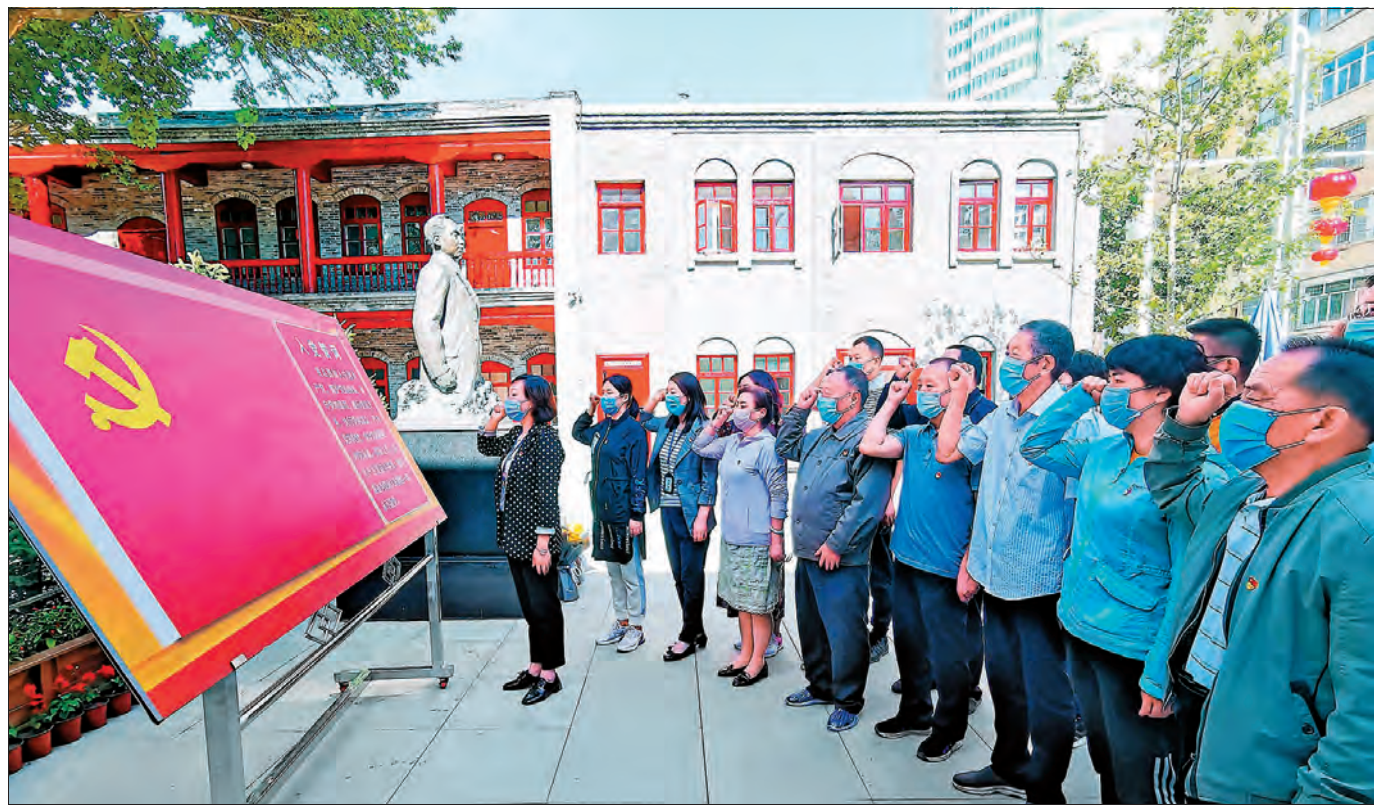
乌鲁木齐市天山区五星路西社区党员干部赴毛泽民故居开展主题党日活动。

3.健全完善党的组织制度。制定出台落实中央《关于建立健全地方党委、部门党组(党委)抓基层党建工作责任制的意见》《关于进一步做好新形