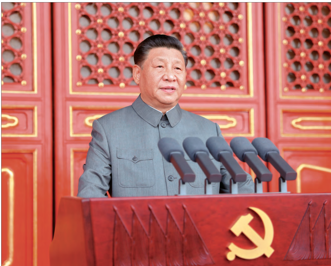
2021 年 7 月 1 日, 庆祝中国共产党成立 100 周年大会在北京天安门广场隆重举行。中共中央总书记、国家主席、中央军委主席习近平发表重要讲话。