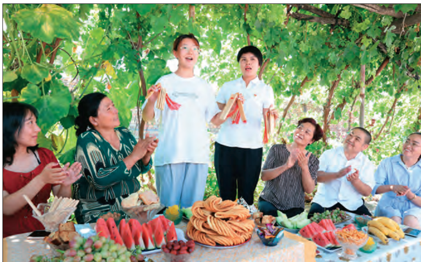
乌苏市教育和科学技术局驻百泉镇普尔塔村“访惠聚”工作队与村民开展“民族团结一家亲”联谊活动。

2020年初,昌吉回族自治州文化体育广播电视和旅游局“访惠聚”驻村工作队来到木垒哈萨克自治县东城镇中兴村后,发现村里党支部连一个像样的活动室、会议室都没有,在工作队的努力下,300平方米的党群服务活