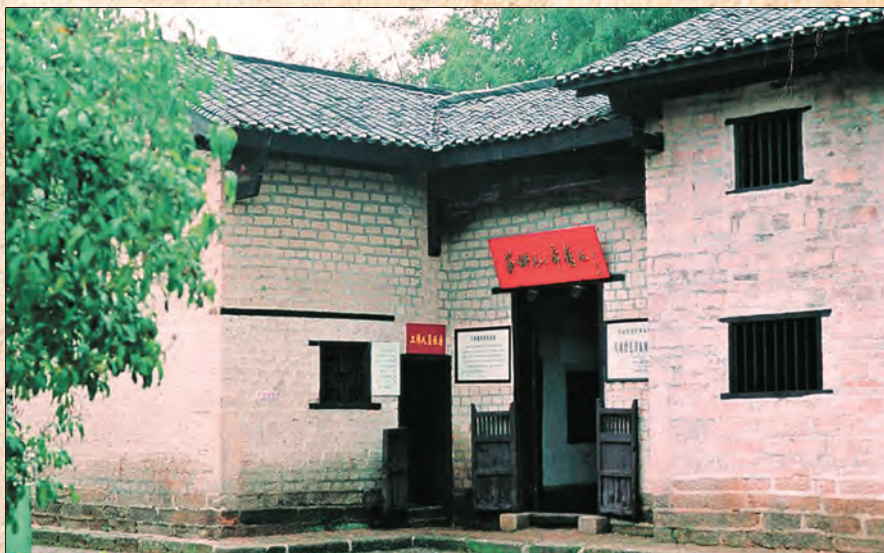
图为修缮后的八角楼。

1928年11月，毛泽东在八角楼给中央写了一个报告，这个报告就是后来收入《毛泽东选集》的《井冈山的