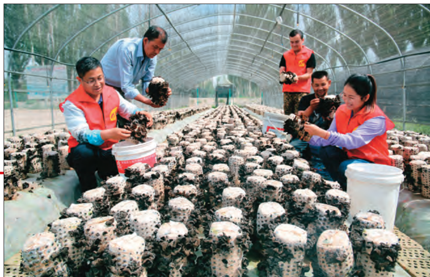
温宿县托乎拉乡金华新村党员志愿者帮助农户采摘黑木耳。