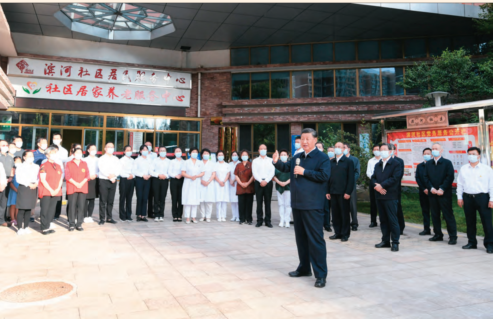
8月23日至24日,中共中央总书记、国家主席、中央军委主席习近平在河北省承德市考察。这是24日下午,习近平在承德市高新区滨河社区考察时,同社区居民亲切交流。