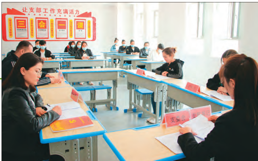
喀什市委党校打造情景模拟课堂，提升村干部和村级后备力量能力素质。