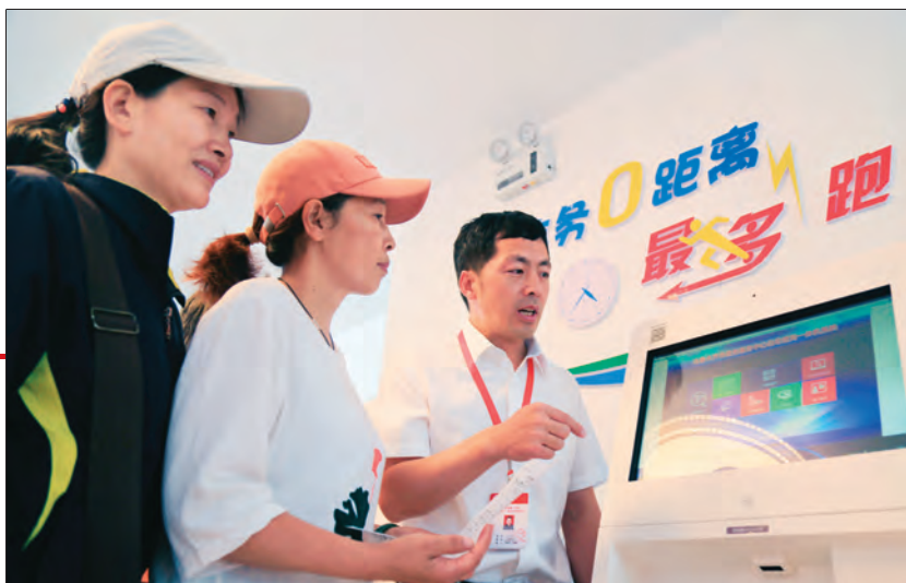
乌鲁木齐市沙依巴克区国道社区干部“零距离”服务居民。

党建引领是基层治理有魂、有序、有力、有效的保障。沙区不断健全完善“街道党工委、社区党组织、网格党支部、楼栋党小组、双联户(十户联保)”五级组织体系,打牢城市基层党建的组织基础,延伸党在基层的服务管理触角。同时,推动社区与辖区单位共驻