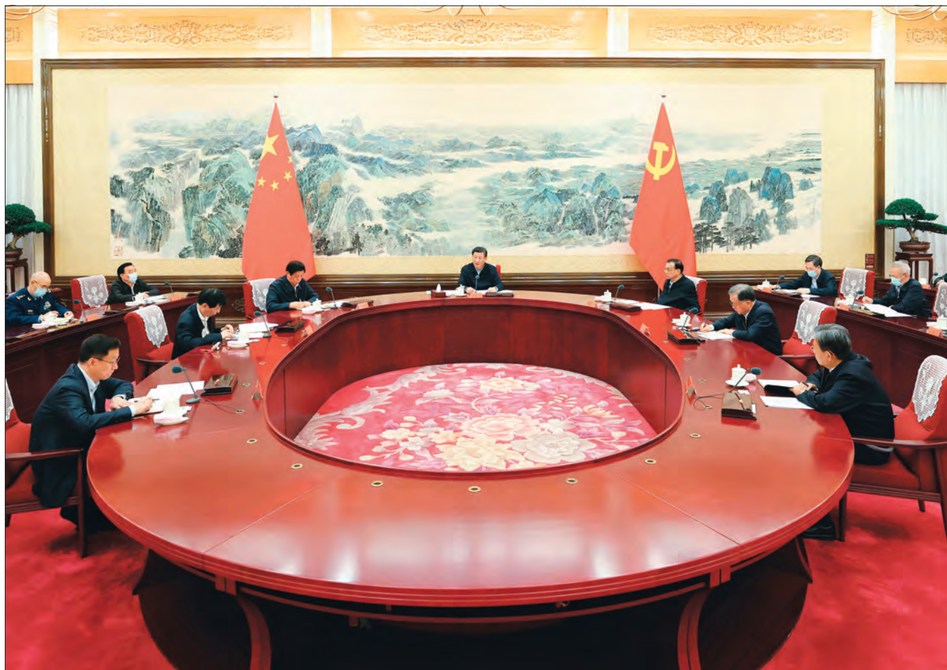
2020年12月24日至25日,中共中央政治局召开民主生活会,中共中央总书记习近平主持会议并发表重要讲话。