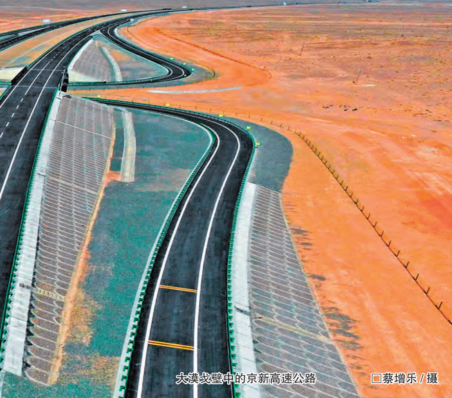
大漠戈壁中的京新高速公路