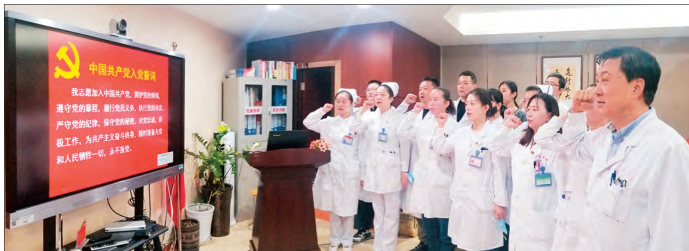
新医大附属肿瘤医院乳腺甲状腺外科党支部开展主题党日活动，重温入党誓词，激发奋进力量。