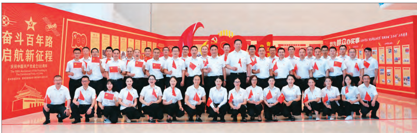
博州党委组织部开展“党旗映天山”主题党日活动中，使组工干部牢记初心使命，争取更大光荣。