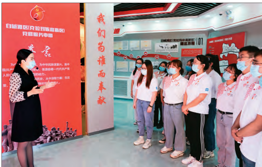
克拉玛依市白碱滩区(克拉玛依高新区)党员干部在党群服务中心聆听老一辈石油人的奋斗故事。

克拉玛依市各级党组织深入学习贯彻习近平总书记“七一”重要讲话精神,认真贯彻《中国共产党党员教育工作条例》,挖掘当地红色教育资源,开展内容丰富、形式多样的党史学习教育,取得实实在在的成效,为推动克拉玛依市经济社会高质量发展凝聚强大动力。