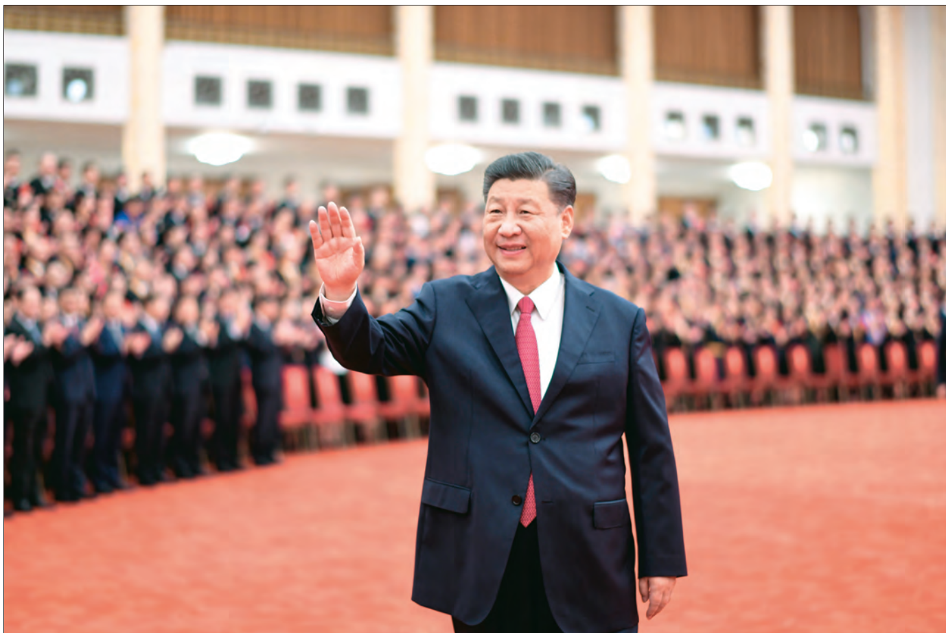
2021年6月29日,庆祝中国共产党成立100周年“七一勋章”颁授仪式在北京人民大会堂金色大厅隆重举行。这是习近平在颁授仪式前会见全国“两优一先”表彰对象时,向大家挥手致意。