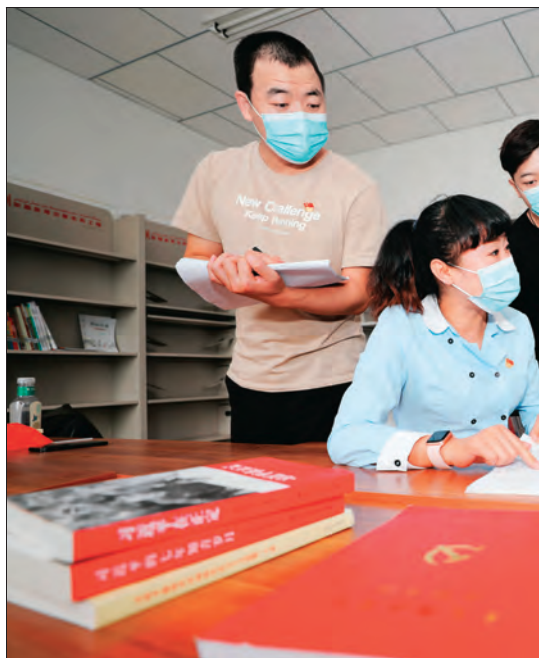
昌吉市三工镇南头工村村干部向后备力量

“问渠那得清如许?为有源头活水来。”昌吉州坚持“优中选优”原则,大力实施“千名大学生赴基层”储才专项行动,将1039名到村工作大学生全部纳入村级后备力量进行培养。按照每个村4~6名的标准储备村级后备力量。充分发挥党组织审核把关作用,实行个人自荐、党员群众推荐、乡镇党委和村党支部推荐相结合,打破身份、行业、地域界限,采取内部挖潜、外地回引等措施,以40周岁以下具有高中及以上文化程度优秀青年为主,重点从到村工作大学生、致富带头人、合作社和产业协会负责人、外出务工经商返乡人员、退役军人等符合条件的优秀分子中推荐选拔,真正把思想政治