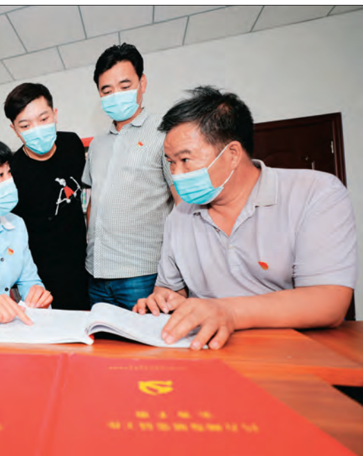
备力量传授工作经验。