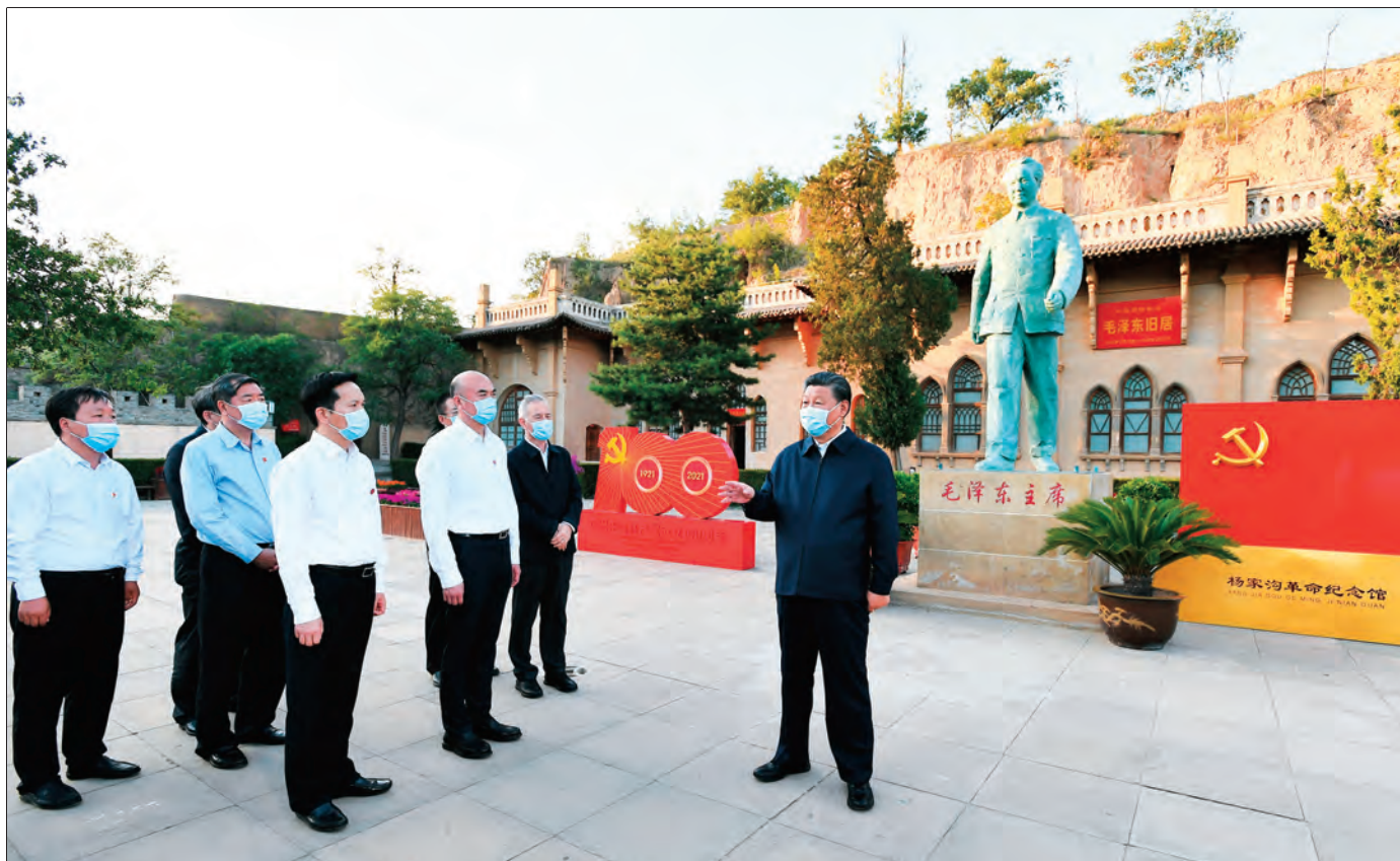
2021年9月13日至14日,中共中央总书记、国家主席、中央军委主席习近平在陕西省榆林市考察。这是13日下午,习近平在米脂县杨家沟革命旧址考察。

生、不可替代的珍贵资源,保护是首要任务。要本着对历史负责、对人民负责的态度,深入开展红色资源专项调查,加强红色遗址、革命文物保护工作,统筹好抢救性保护和预防性保护、本体保护和周边保护、单点保护和集群保护等。二是要开展系统研究。统筹研究力量,强化研究规划,积极开展革命史料的抢救、征集和研究工作,加强革命历史研究,深入挖掘红色资源背后的思想内涵,准确把握党的历史发展的主题主线、主流本质,旗帜鲜明反对和抵制历史虚无主义。三是要打造精品展陈。坚持政治性、思想性、艺术性相统一,把好导向、聚焦主题,用史实说话,着力打造高质量精品展陈,增强表现力、传播力、影响力,生动传播红色文化。四是要强化教育功能。围绕革命、建设、改革各个历史时期的重大事件、重大节点,研究确定一批重要标识地,讲好党的故事、革命的故事、英雄的故事,彰显时代特色,使之成为教育人、激励人、塑造人的大学校。要设计