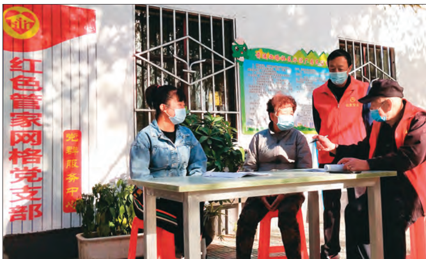
哈密市伊州区丽园街道前进西路社区红色管家网格党支部征求居民意见。

前进西路社区党总支坚持把党的组织优势转化为基层治理优势,充分发挥网格党支部的战斗堡垒作用和党员的先锋模范作用,注重发现和培养政治强、有能力、群众基础好的老党员担任“红色管家”、党员中心户长,定期