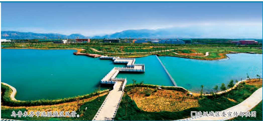
乌鲁木齐市达坂城区风景。