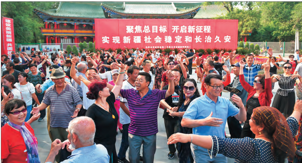
各族群众在乌鲁木齐市人民公园载歌载舞,抒发爱党爱国爱疆情怀。