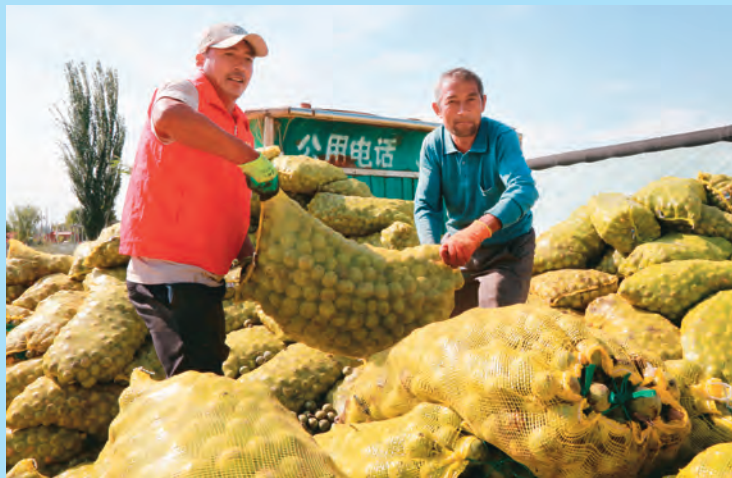
新疆阿瓦提县财政局驻塔木托格拉克镇玉斯屯克阿特勒村“访惠聚”工作队组织党员志愿服务队帮助村民采收核桃。