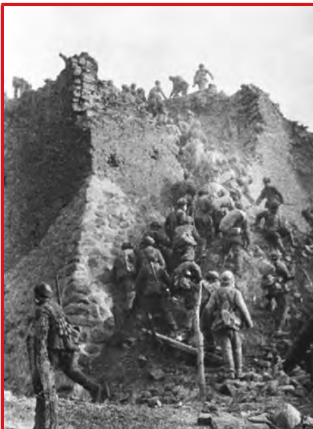
1948年11月29日至1949年1月31日,人民解放军东北野战军、华北野战军发起平津战役,在历时64天的战役中,歼敌和改编国民党军队52万多人,古城北平和平解放。图为1948年12月,人民解放军攻上新保安城头。

根据中央军委的指示,东北野战军主力自1948年11月起隐蔽入关,突然包围唐山、塘沽、天津的国民党军队。11月29日,东北、华北人民解放军发起平津战役,华北军区第二、第三兵团和东北野战军先遣兵团,相继向平绥路平张段及张家口外围的国民党守军发起进攻。12月12日起,东北野战军陆续到达平津前线,完成对平、津、塘之敌的战略包围和战役分割。随后按“先打两头、后取中间”的原则发起攻击,连克新保安、张家口部分傅作义部主力。在天津守敌拒绝投降后,我军于1949年1月14日发起强大总攻,历经29小时激战,全歼守敌13万人,解放天津。孤守北平的20余万敌军完全陷入绝境。经过人民解放军和