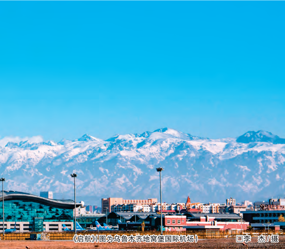
《启航》(图为乌鲁木齐地窝堡国际机场)