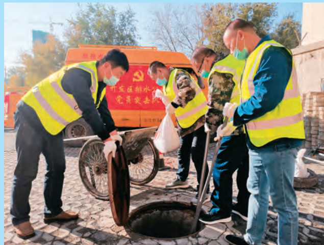
新疆乌鲁木齐水业集团开发区排水公司党员突击队为民疏通下水管道。