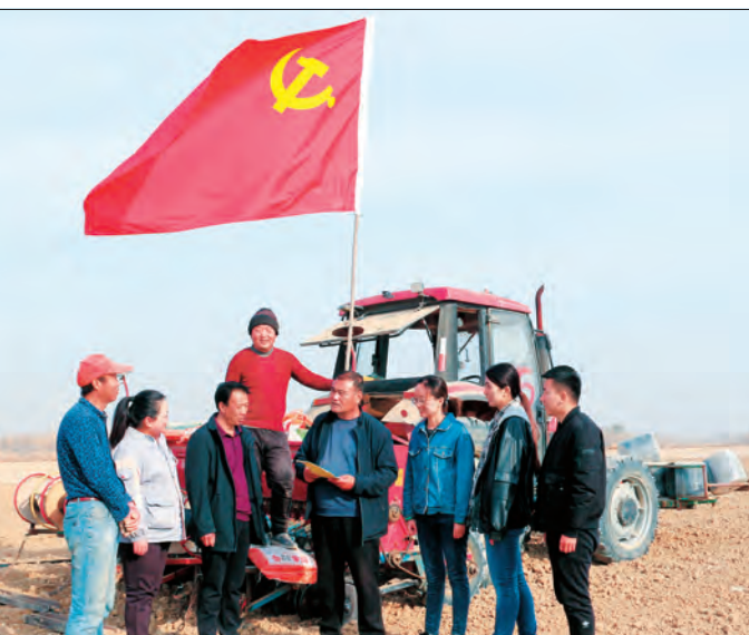
①库车市党员干部深入基层与各族群众一起学习党代会精神。