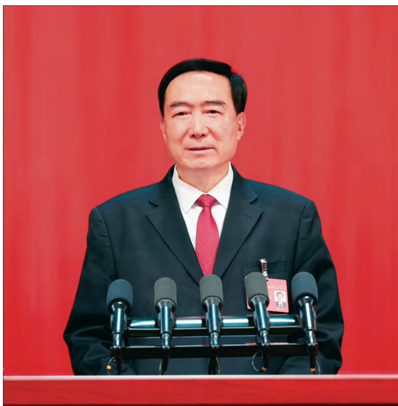
10月21日,中国共产党新疆维吾尔自治区第十次代表大会在新疆人民会堂开幕。 陈全国代表中共新疆维吾尔自治区第九届委员会向大会作报告。

本刊讯 团结奋斗开启新征程,砥砺奋进谱写新篇章。中国共产党新疆维吾尔自治区第十次代表大会10月21日上午在新疆人民会堂开幕。