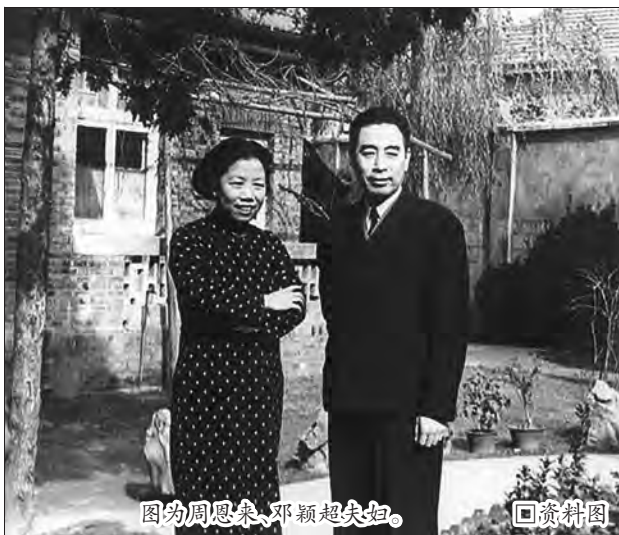
图为周恩来、邓颖超夫妇。