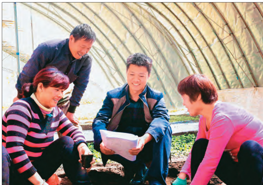
昭苏县党员干部深入基层宣讲党的惠民政策。

布尔津县各级党组织在开展“我为群众办实事”实践活动中，组织270余名党员志愿者为县域内离退休党