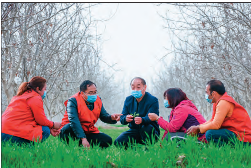
麦盖提县五一林场邀请农技人才开展冬小麦田间管理技术指导。

近年来,喀什地区着眼做大做强乡村特色产业,统筹本地区及援疆省市人才资源,采取兼职聘用、顾问指导、培训讲学等方式柔性引才、精准引才,选派1千余名科技特派员送技术