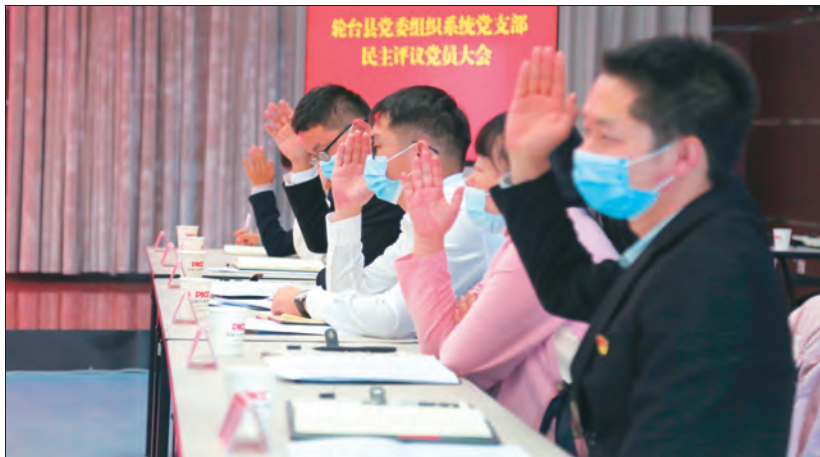
新疆轮台县委组织系统党支部开展民主评议党员。

民主评议党员是加强党的建设的一项重要制度,也是党支部从严治党,加强党员教育、管理和监督的一项经常性的活动,一般每年进行一次。民主评议党员工作是在党委领导下,以党支部为单位有计划、有步骤地进行的,时间一般相对集中。《中国共产党支部工作条例(试行)》规定,党支部一般每年开展1次民主评议党员,组织党员对照合格党员标准、对照入党誓词,联系个人实际进行党性分析。