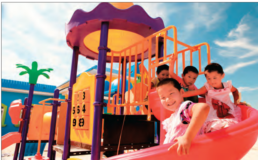
哈太村的孩子们在新建的游乐场快乐玩耍。

组织强了，人心也齐了。2020年疫情防控期间，村党支部带领党员干部群众组织志愿服务队迎难而上，奋战在抗击疫情的第一线，全力守护人