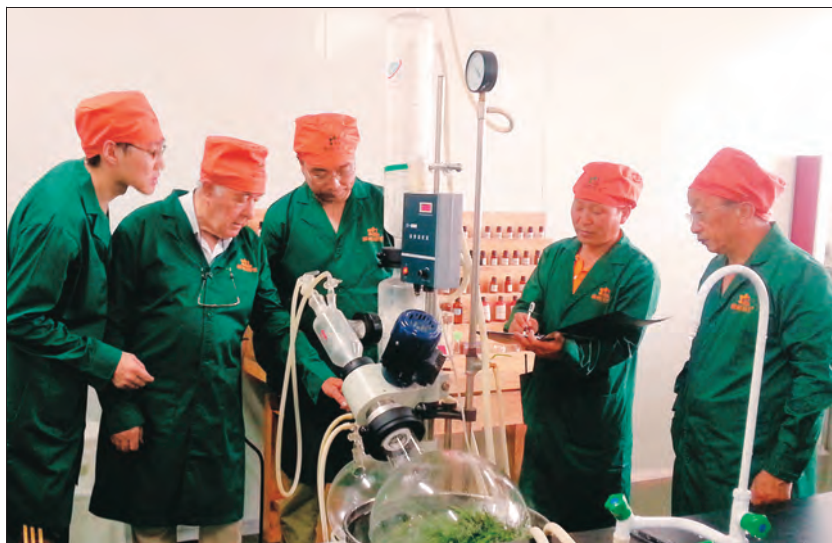
霍城县薰衣草产业特聘专家指导企业员工优化精油提取技术。