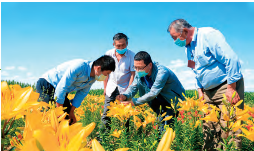
吉林省农科院哈巴河县试验站邀请农业专家传授百合种植技术。