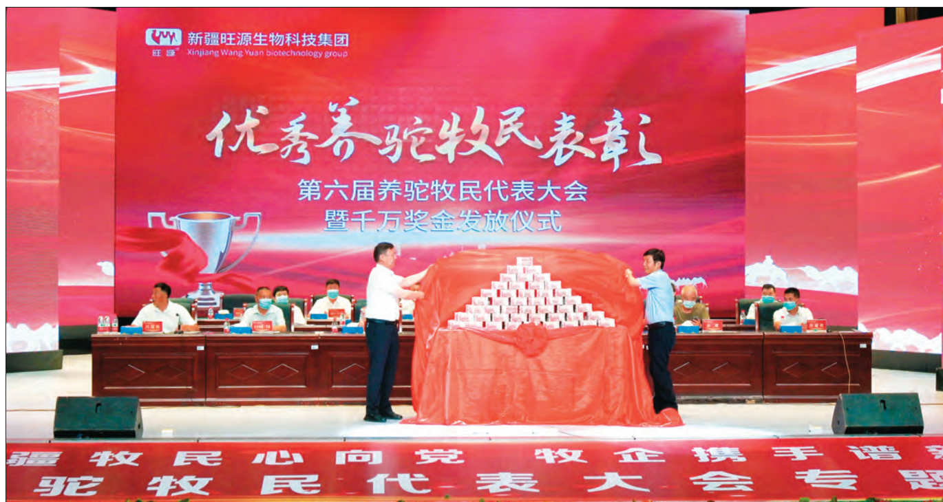
旺源集团党支部表彰优秀养驼牧民。

为攻克驼奶保鲜技术难题，旺源集团成立了以党员为骨干的科研攻坚小组，不断尝试着用各种方法做试验，