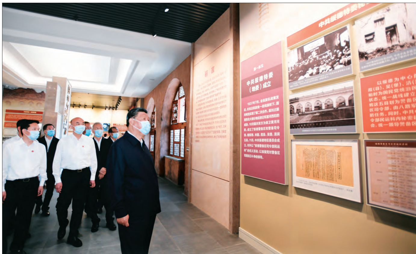
2021年9月13日至14日,中共中央总书记、国家主席、中央军委主席习近平在陕西省榆林市考察。这是14日上午,习近平在中共绥德地委旧址考察。