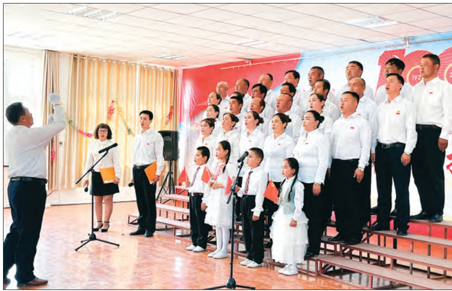
巴里坤县奎苏镇牧业村党支部组织开展“唱红歌、颂党恩”歌咏比赛。