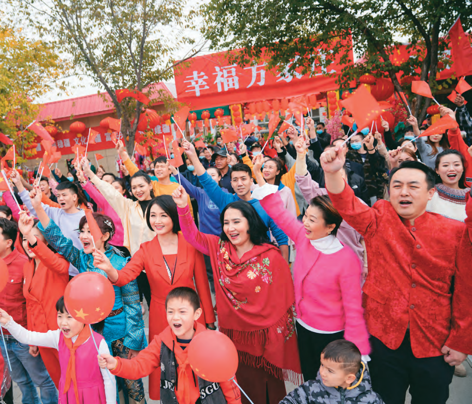
乌鲁木齐县水西沟镇各族群众高唱《我的祖国》，深情祝福伟大祖国。