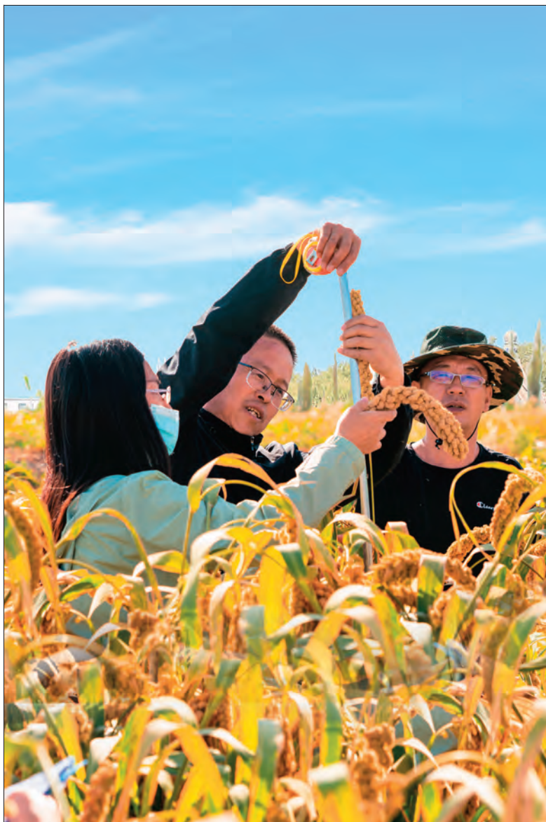
河北省农业专家在援疆项目“张杂谷”试验示范田为农民传授种植技术。