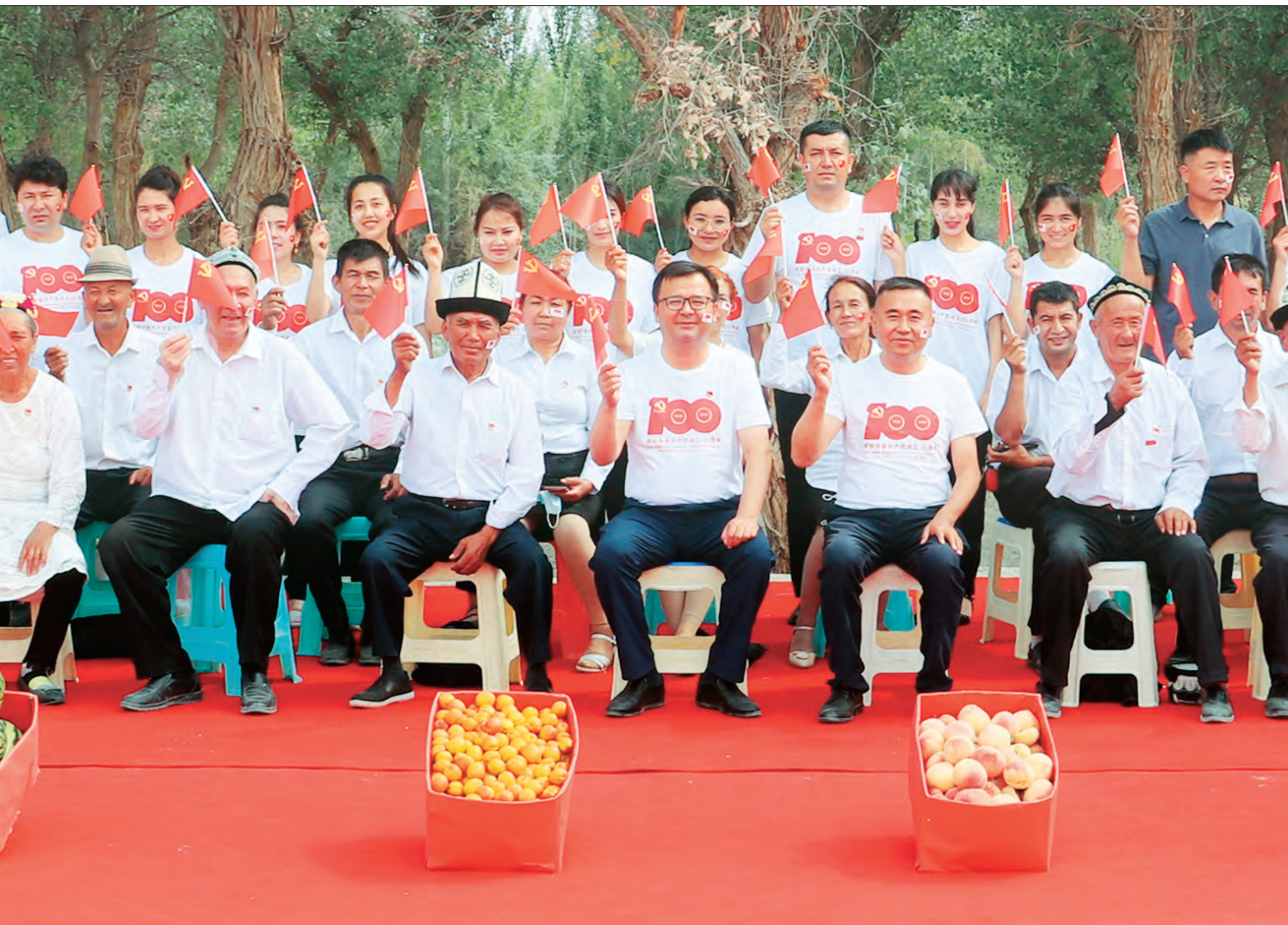
依也勒干村党支部开展“感党恩·庆丰收”主题党日活动。