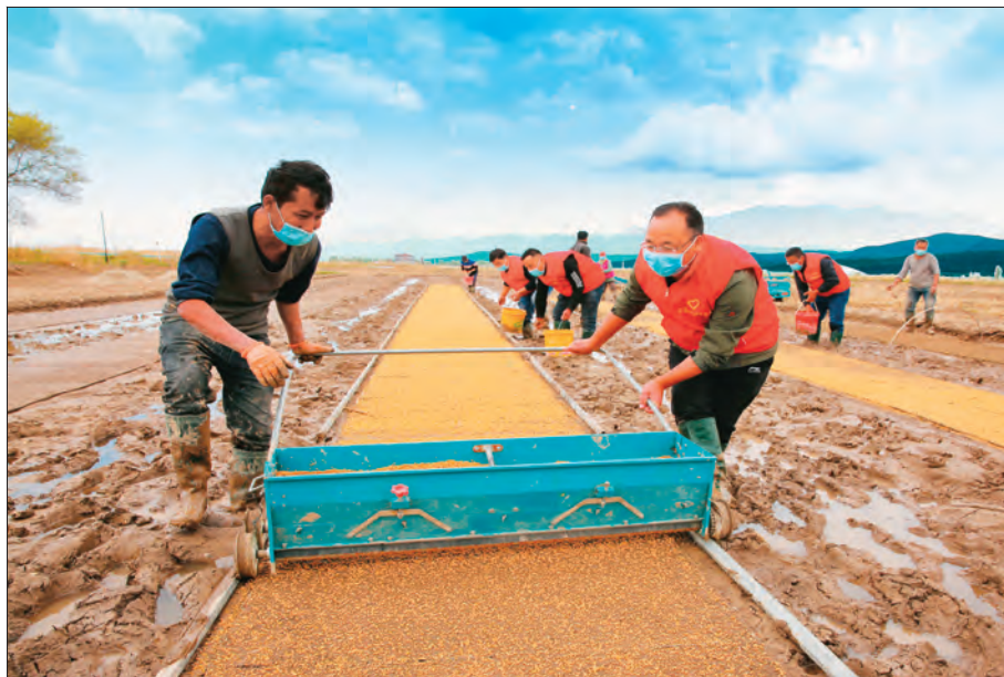
察布查尔锡伯自治县农业农村局党员干部深入稻田帮助村民育秧。

挤压不担当不作为的“生存空间”。一是加强重点监督,防止反弹回潮。结合巡察对州直各行业系统存在的问题进行梳理排查,对一般性问题立查立改,对违纪违法问题按照权限严查,根治各类问题乱象。紧盯重点领域、重要岗位和关键少数,常态化开展以案促改,督促案发单位完善制度、堵塞漏洞。二是强化日常监督,避免因小失大。坚持以正面教育、预防和事前监督为主,制定防止干部“带病提拔”实施办法。加大提醒、函询和诫勉力度,召开集体诫勉谈话会,对发现的领导干部苗头性问题及时进行提醒,防止小毛病演变成成为大问题。