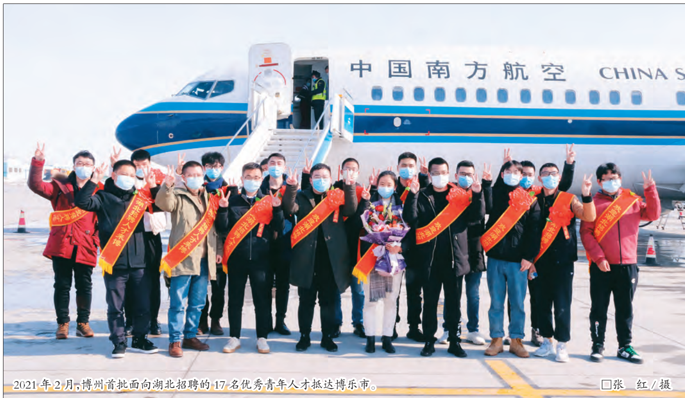
2021年2月,博州首批面向湖北招聘的17名优秀青年人才抵达博乐市。