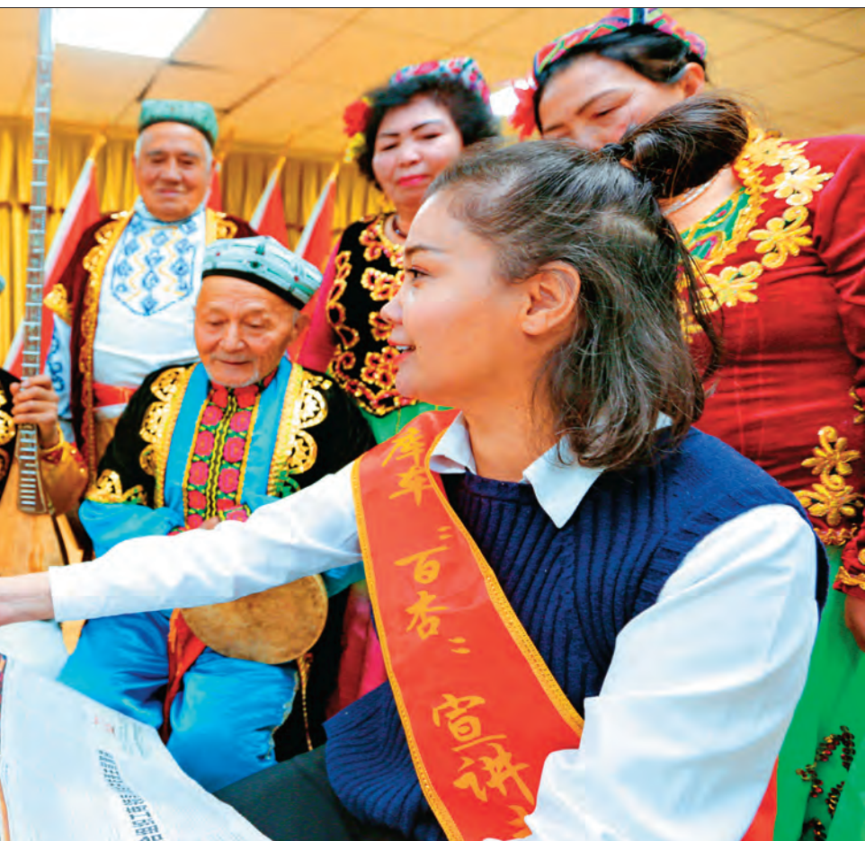
民宣讲党的十九届六中全会精神。