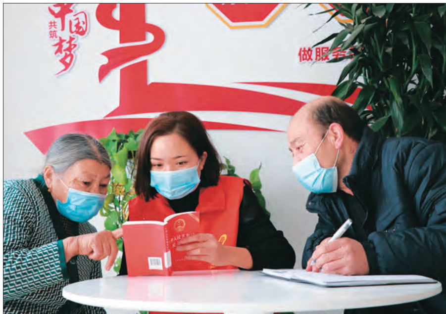
叶城县年轻干部为社区居民宣讲法律。