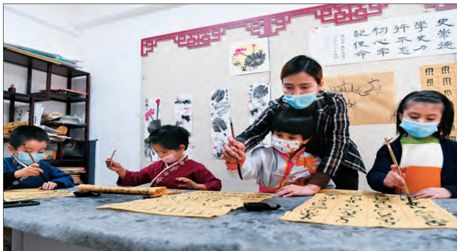
乌鲁木齐市天山区固原巷社区“访惠聚”工作队员辅导小朋友学习书法。

的十九届六中全会精神,用接地气的语言上门送学、结对助学,把全会精神讲解到村民的心坎里。