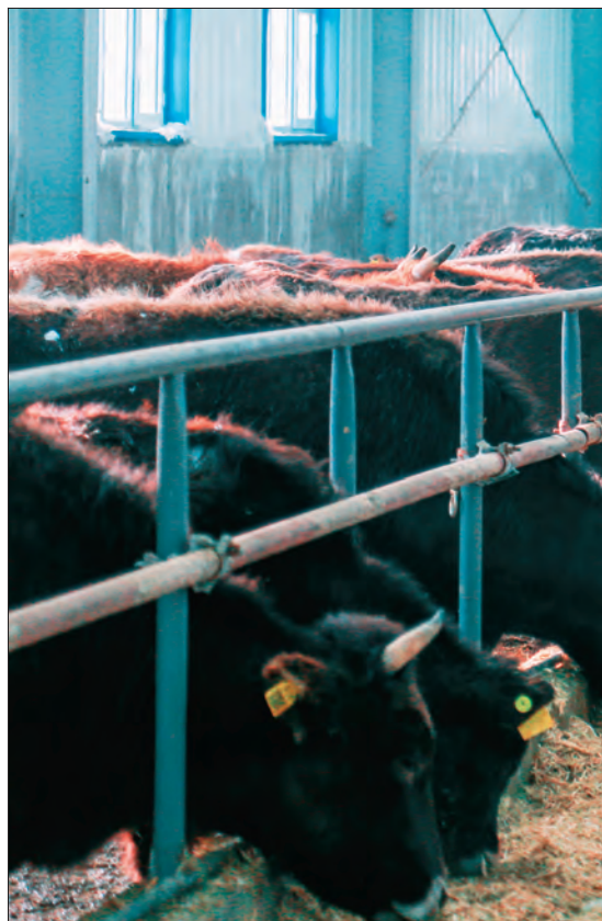
克拉玛依市乌尔禾区乌尔禾镇哈克村畜牧养殖实 现

“村规民约事关你我他，大伙要时刻牢记在心，自觉规范自己的言行举止，共同为乡村振兴添彩加分。”“这份村规民约简洁明了、通俗易懂、朗朗上口，是村民意愿的集中体现……”在村委会会议室，村民们一边仔细阅读村规民约，一边对笔者说。