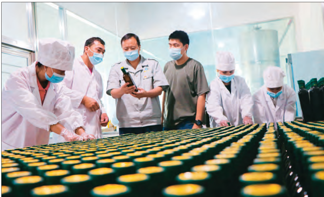
叶城县年轻干部深入在村企业核桃加工厂实践锻炼。