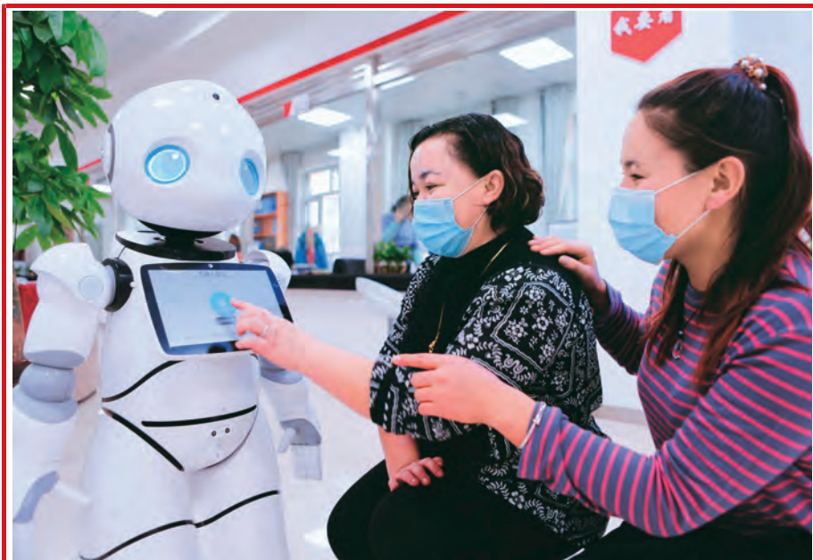
群众与机器人“蕴宝”交流互动。

针对全县1.2万余名“夏村冬城（指温暖季节居住、生活在农村家里，冬天到县城生活）”农牧民群众普遍存在办事难、来回跑、成本高的问题，富蕴县积极前移基层党组织服务群众工作，借助5G现代技术，对县、乡镇原有的社保大厅进行智能化改造，与86个中心村（社区）实施网络互联互通，实现数据交换、视频连线全覆盖，将其打造成