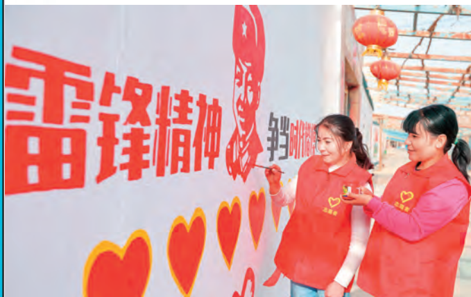
新疆库车市党员志愿者在玉奇吾斯塘乡排孜阿瓦提村绘制“雷锋精神”主题文化墙。

新疆维吾尔自治区市场监督管理局找准党建工作与业务工作的结合点,有序有效推进离退休干部党支部标准化规范化建设工作落实。明确指标重规范。制定《新疆维吾尔自治区市场监督管理局关于开展离退休干部党支部标准化规范化建设工作的通知》,提出离退休干部党支部政治思想建设、组织建设、队伍建设、活动开展、制度落实、工作保障等6个方面22项管根本、可考量的指标体系,对规范离退休干部党支部党建责任、组织生活、场所保障等作出明确要求。试点运行后,邀请组织部、纪委等多部门同志观摩指导,确保离退休干部党支部标准化规范化建设。灵活形式抓落实。采取灵活多样的形式,促进离退休干部党支部“三会一课”、组织生活、“党旗映天山”主题党日、党员教育管理 etc 等落细落实。探索利用新媒体将支部建在网上、党员连在线上,确保离退休干部党员教育管理、党组织生活全覆盖。开展离退休干部党支部调研活动,对离退休干部党员参加党组