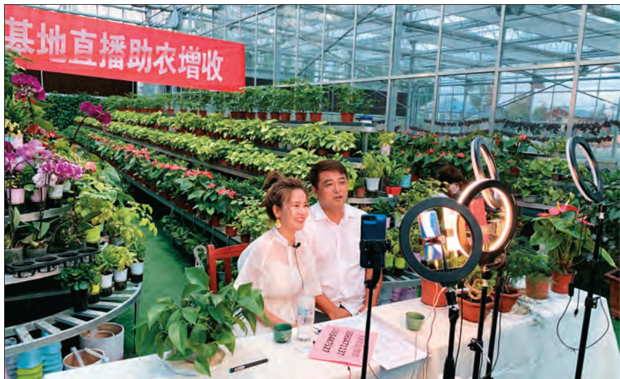
伊宁县萨地克于孜乡“直播带货”拓展花卉销售渠道。

而在特克斯县呼吉尔特蒙古乡呼吉尔特村,党支部充分运用特色种植补贴政策,立足气候禀赋,引进中天山大樱桃,采取“设施农业基地种植+传统种植”模式,大力发展特色种植业。