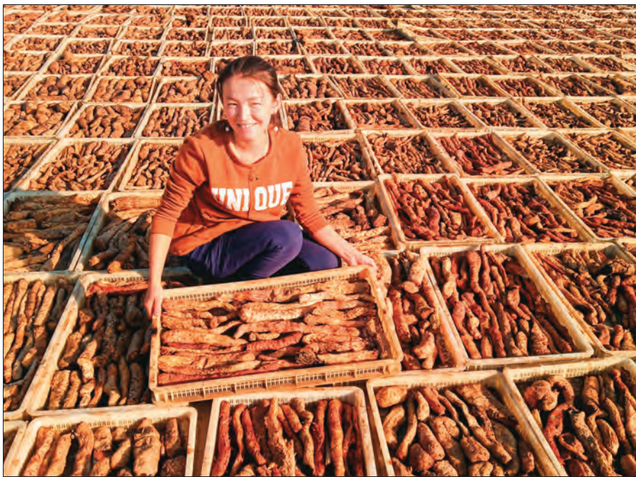
2021年10月,吐鲁番市琼坎儿孜村大芸丰收,晾晒场上的村民喜笑颜开。

2021年以来,吐鲁番市相继实施“领头雁”工程、村干部能力素质提升工程、基层青年工作专项行动等重点工作。从“访惠聚”驻村工作队后盾单位领导班子成员或中层中,考察选派眼界宽、思路新、有带富能力的骨干担任第一书记;组织优秀年轻村干部到职业院校分批接受大专以上学历教育,系统学习基层治理、经济管理知识,全力锻造一支活力足、能力强的农村“头雁”队伍。