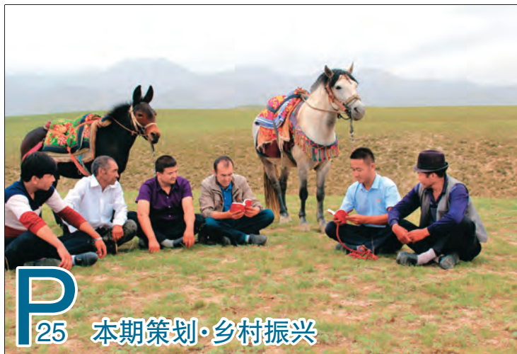
本期策划·乡村振兴