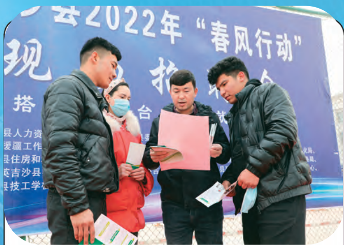
新疆英吉沙县开展“春风行动”人才招聘会，为各类人才牵线搭桥。

新疆库尔勒市广泛开展以“红色先锋”为载体的结对共建活动，有效提升机关党建整体水平。队伍联建，整合优势资源。将辖区内55个部门单位，坚持党委牵头负责、办公地点相邻、资源优势相融，划分区域，打造6支“红色先锋”队。明确牵头单位党委书记为“召集人”、组织委员为“总联络员”，各成员单位组织委员为“联络员”，定期沟通交流，确保各成员单位之间信息畅通。每次活动事先征求各成员单位的意见后，制定活动方案，确保将各支队联建起来，将各项优势资源整合起来。活动联动，提升教育成效。采取一活动一轮值的方式，由“联络员”主动与队内各单位对接，通过党员“点餐”、组织“配餐”，列出需求清单和资源清单，“召集人”按照需求召集活动，采取共过“党旗映天山”主题党日、共听优秀党课、共谈入党感悟、共评“党费日+报告”等方式，让不同领域党员互相对标，取长补短，共同