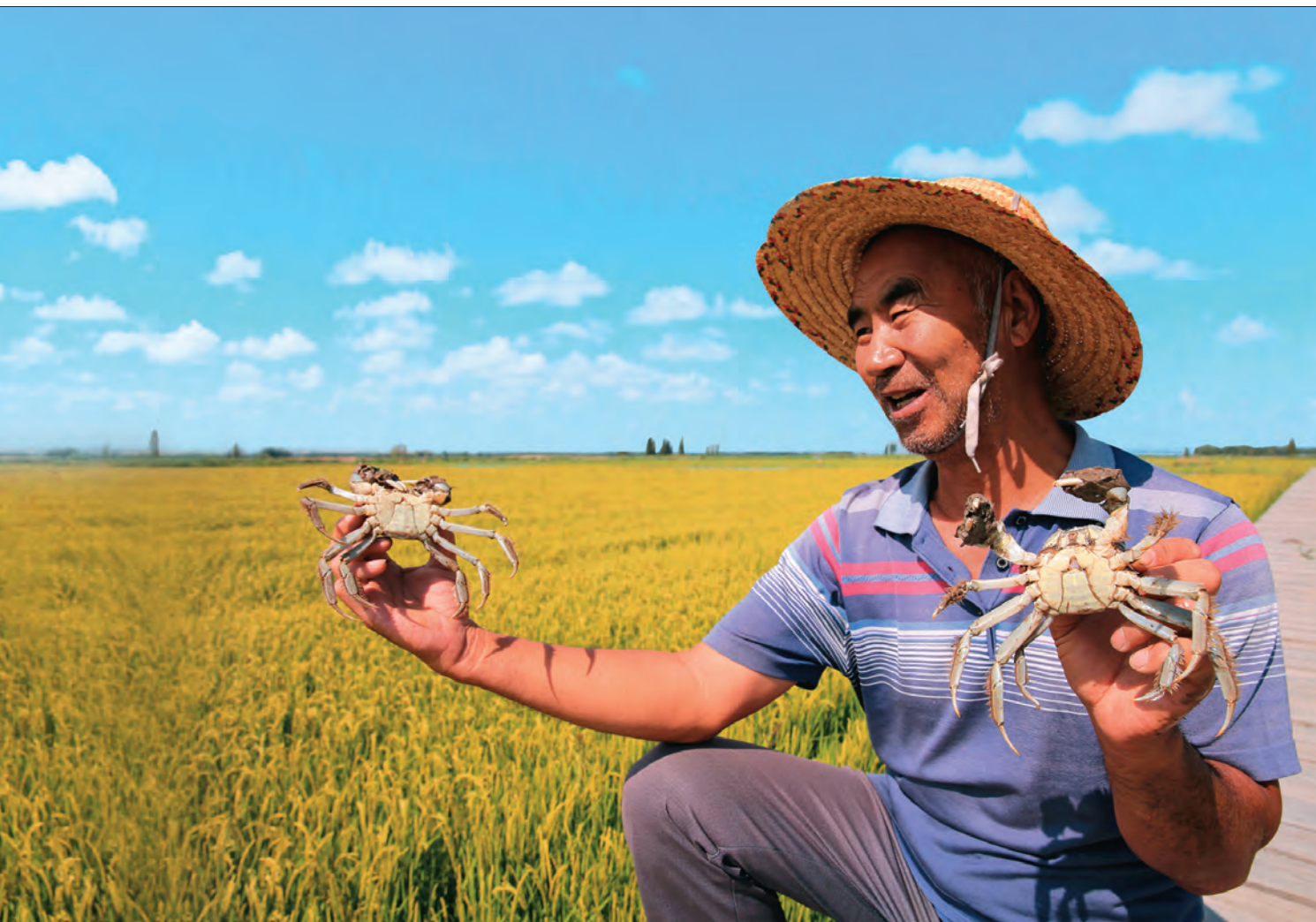
察布查尔锡伯自治县坎乡齐格勒克村“稻蟹共作”助农增收。

光明村是个城郊村,人均耕地少,村民多以养殖为业,发展路子单一,防御风险能力较差,影响群众增收。村党支部在广泛征求群众意见基础上,确定“支部领办+大户示范+小户参社”发展模式,多方争取项目资金 190 万元,流转土地 110 亩,建设“蓝公羊”养殖基地。村民以托管或入股的方式加入合作社,托管马、牛、羊近 170 头