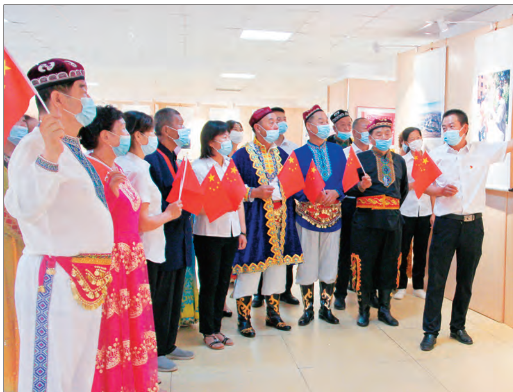
沙湾市委组织部组织党员干部参观党的十九大以来发展成就图片展。

问题、对待名利地位和进退留转时的表现,全面了解和分析干部政治素质、品德修养,使考察指向更加精准、工作程序更加科学。依托地区县级干部政治表现、奖惩、工作实绩台账,按照“一人一档”、常态化、系统化、全方位考察识别干部原则,探索建立健全集学习教育、工作表现、民主生活会意见建议和奖惩情况等为一体的干部政