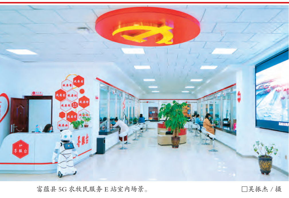
富蕴县5G农牧民服务E站室内场景。