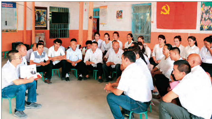
疏勒县阿拉力乡海尼且村党支部实施“红色细胞”工程，在村民小组开展主题党日活动。