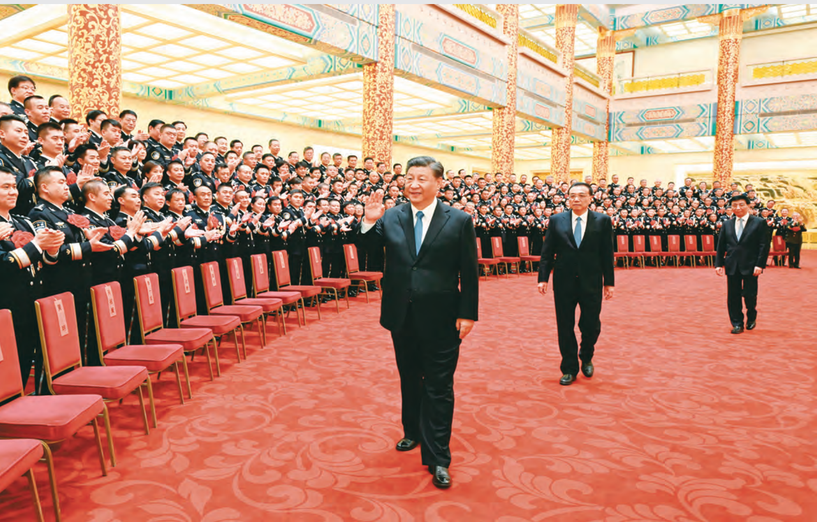
5月25日,党和国家领导人习近平、李克强、王沪宁等在北京人民大会堂会见全国公安系统英雄模范立功集体表彰大会代表。