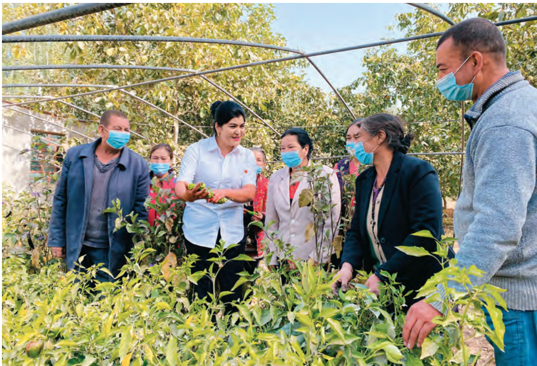
皮山县皮西那乡布拉克贝希村党员致富带头人群众传授种植新技术。