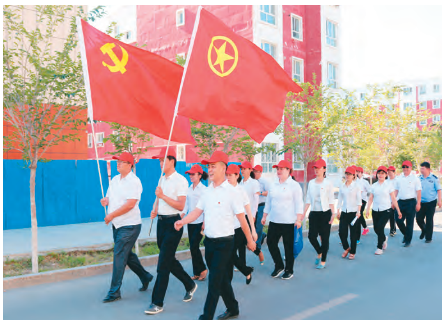
博乐市组织党员、团员志愿者开展便民服务。

博乐市建立党组织领导下的居民委员会、业主委员会、物业服务企业“三方联动”议事协商机制,制定议事规则和工作流程,推动问题共解、资源