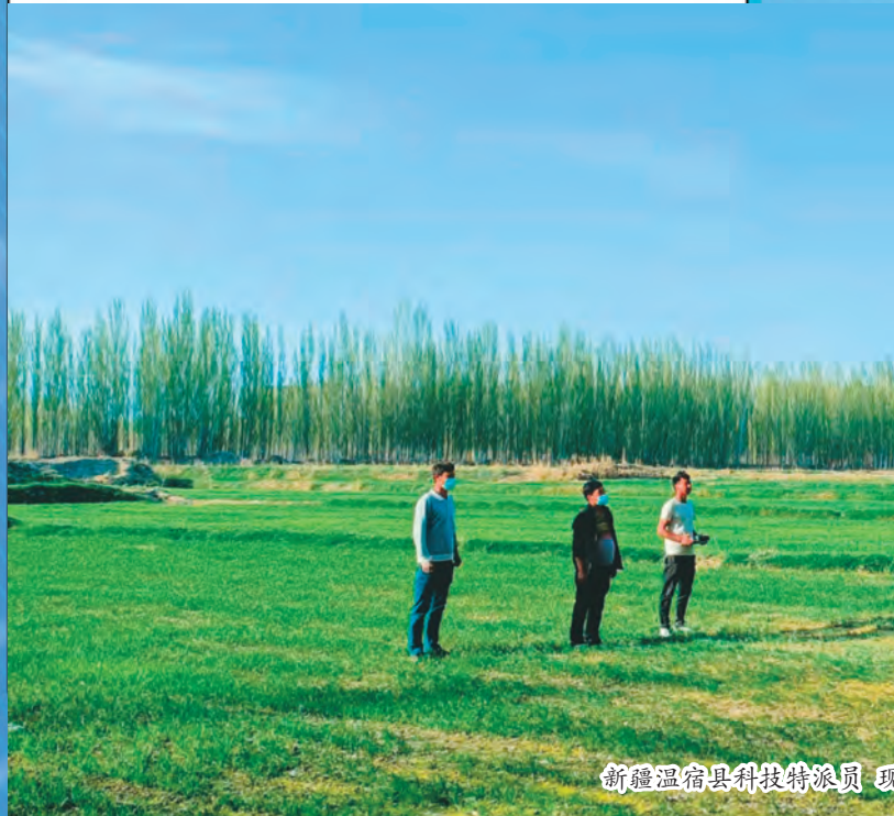
新疆温宿县科技特派员 现

新疆大学坚持加强党对学校工作的全面领导,通过健全机制、建强队伍、开发课程提升思想政治理论课教学质量和水平。坚持把思想政治理论课作为重点课程、把马克思主义理论学科作为重点学科摆在教育教学突出位置;成立学校思想政治理论课教学指导委员会,由学校党委书记任主任委员,推进思政课改革创新,形成全校合力办好思政课、教师认真讲好思政课、学生积极学好思政课的良好氛围。制定思想政治理论课教师队伍培养方案,通过人才引进、校内转岗等方式,持续优化思想政治理论课教师的学历、职称结构,配齐建强思想政治理论课教师队伍;搭建学习交流平台,以铸牢中华民族共同体意识研究基地、哲学研究所