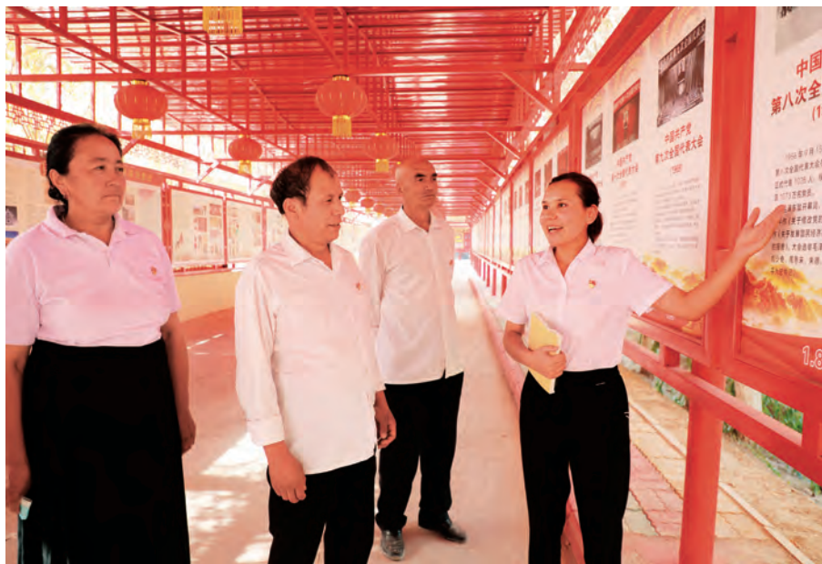
伽师县开展百名红色讲解员下基层宣讲活动。