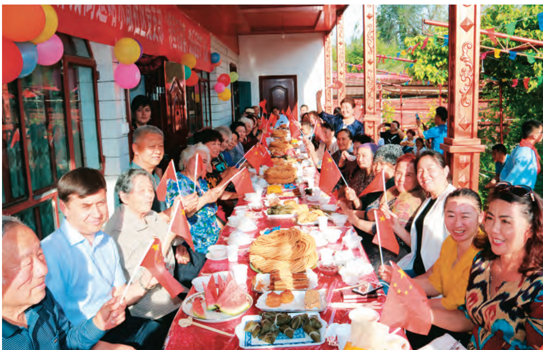
哈尔墩社区开展“邻里节百家宴”活动。