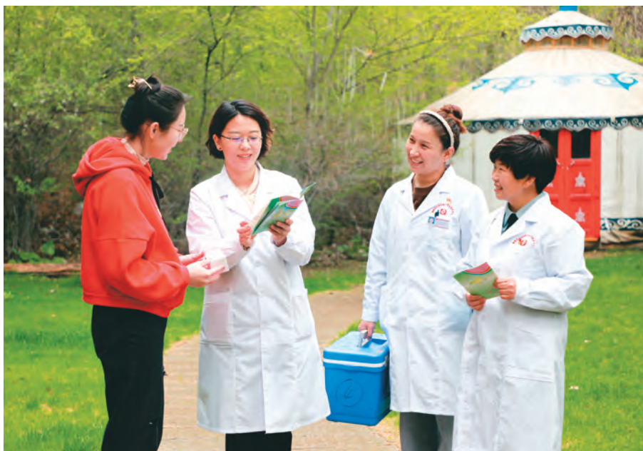
额敏县妇幼保健计划生育服务中心开展“关爱妇幼健康”宣传活动。