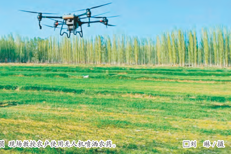
党员 现场教授农户使用无人机喷洒农药。

奎屯独山子经济技术开发区积极探索“益企红盟”党建联建共建新模式,为企业发展提供新动能。以企业需求为导向,坚持办公地点相邻、行业特点相近、资源优势相融,分产业、领域、区域成立7个“益企红盟”站点,选派素质高、能力强的企业党支部书记担任站长,通过抓实党建联抓、政策联研、产业联兴、人才联育、活动联办、品牌联创“五联动”,推动资源整合,实现信息共享。组织各红盟成员单位签订《党建联建共建协议书》,采取A类(党建考核为优秀)企业带动C类(党建考核为合格)企业、B类(党建考核为良好)企业联合形式,每月由A类企业轮流牵头,组织认真落实“党旗映天山”主题党日制度,每季度联盟内优秀党支部书记上党课,推动党建工作与业务工作紧密结合。建立机关企业党建工作联动协调机制,将11个帮带机关党支部纳入“益企红盟”,月初由机关党支部帮带牵头,凝聚行业部门、党建工作指导员等力量,收集整理企业党建、发展等方面存在的问题短板,形成清单;月末组织召开“益企红盟”联席会议,逐项研究,逐条解决,结合机关单位职能,在企业转型、政务审批、