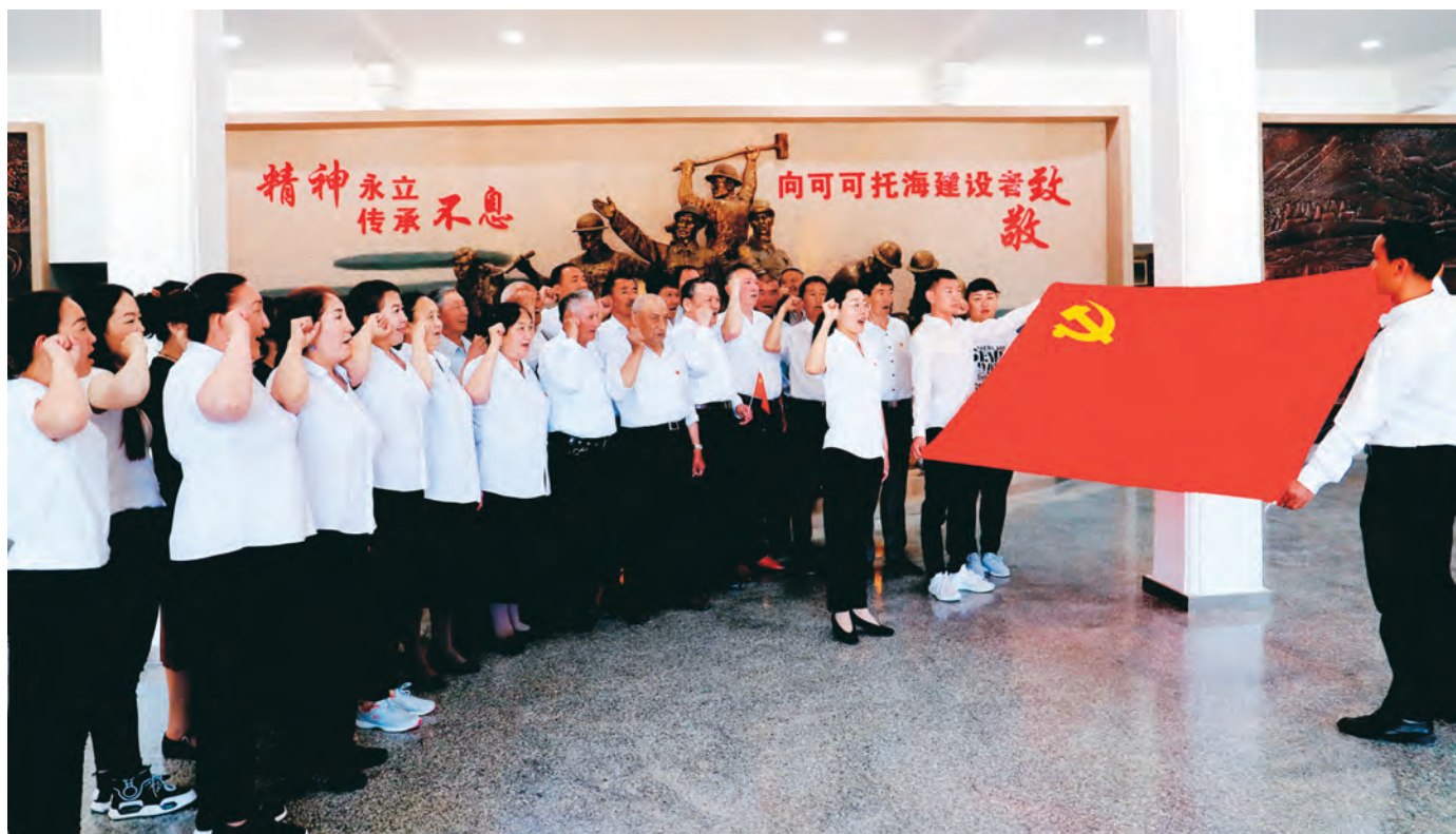
富蕴县机关干部在可可托海干部学院党史馆重温入党誓词。