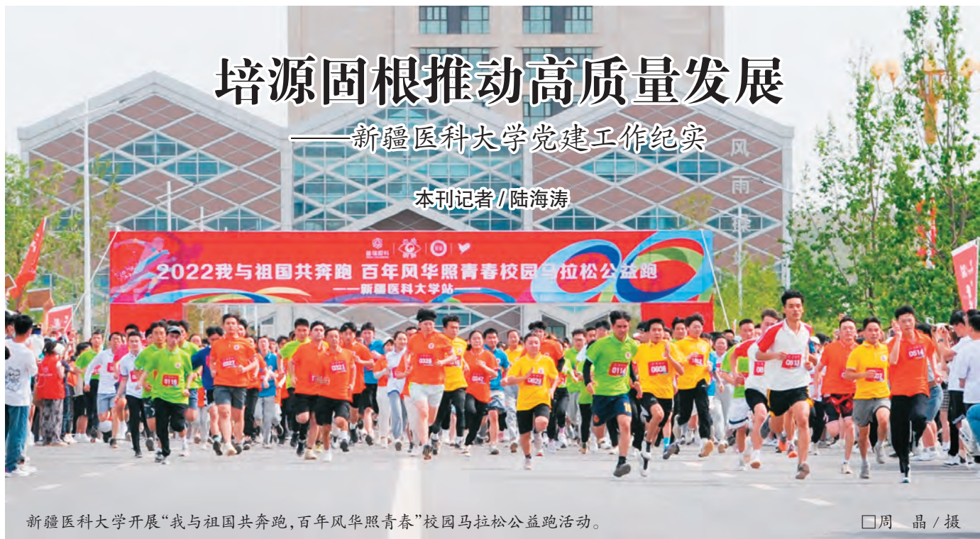
新疆医科大学开展“我与祖国共奔跑，百年风华照青春”校园马拉松公益跑活动。