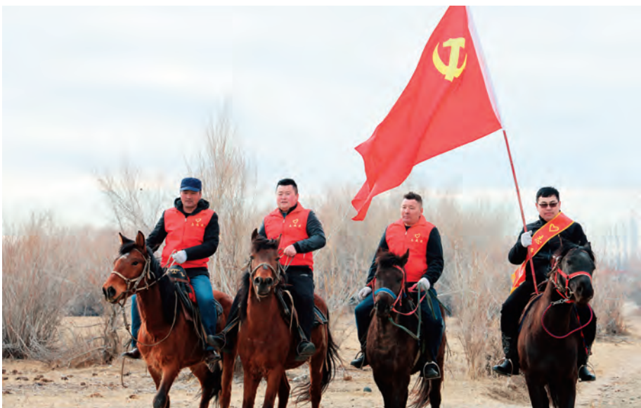
布尔津县自然资源局驻窝依莫克镇哈太村“访惠聚”工作队组织马背宣讲队深入牧区向牧民宣讲。

回村工作、建设家乡。阿克苏地区从改善村“两委”班子结构入手,采取群众民主推荐、党员实名举荐、工作队员走访挖掘等方式,选拔优秀后备力量,制定“一对一”“多对一”联系帮带计划,强化培训培养,强壮基层后备力量队伍。克孜勒苏柯尔克孜自治州通过选拔后备力量任职村“两委”班子成员助理、列席村“两委”会议、轮岗实践锻炼、日常谈心谈话等,发现培养新人。目前有 582 名后备力量进入村(社区)“两委”班子,基层班子结构得到进一步优化。喀什地区通过让村干部到前台唱主角,让预选对象到具体工作岗