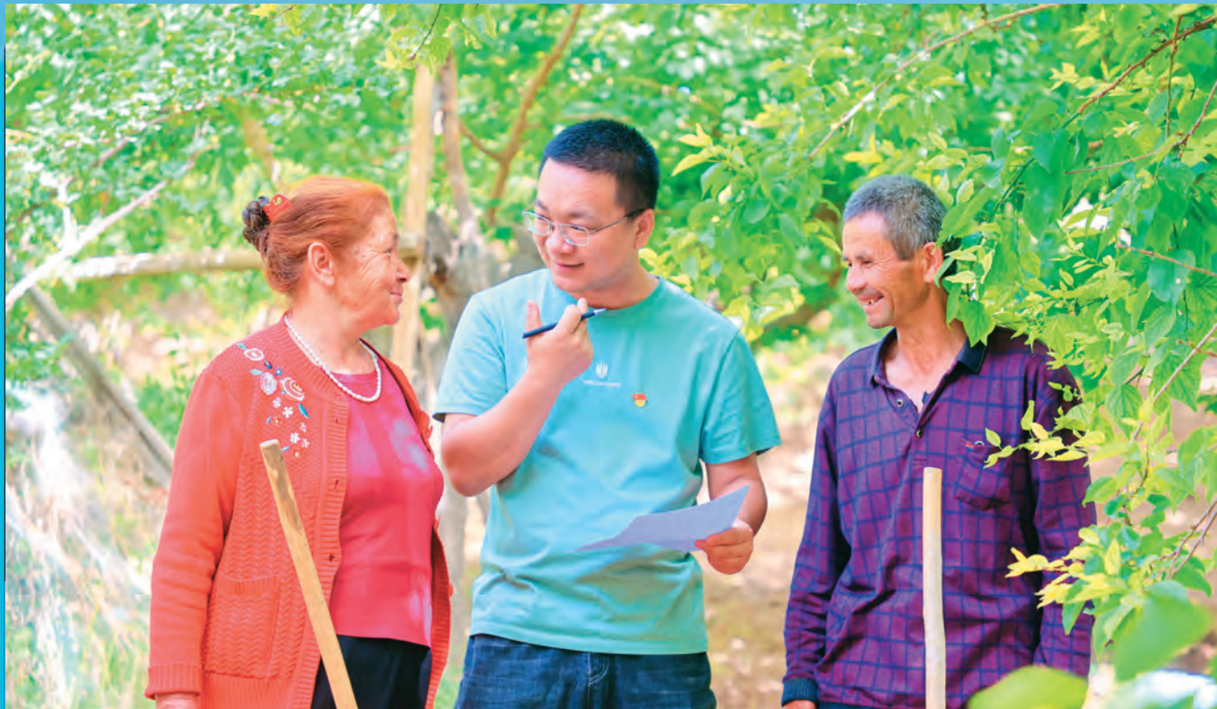
新疆库车市年轻干部在牙哈镇托克乃村向农户了解惠农政策落实情况。