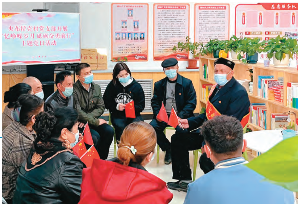
霍城县惠远镇央布拉克村党支部举办活动,认真落实开展“党旗映天山”主题党日制度。