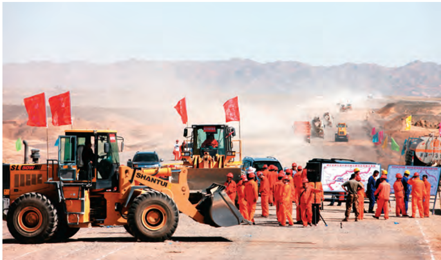
自治区交通运输厅党员突击队奋战在建设一线。

交通畅不畅，服务优不优，管理好不好，是检验交通运输治理能力和服务水平的直接体现。交通运输厅党委始终牢固树立人民至上、生命至上、安全第一的思想，以“实”促效，增强安全意识、责任意识和服务意识，全力保障物流运输畅通。