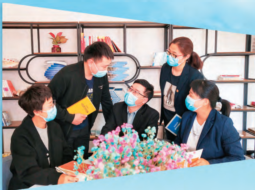
新疆阿勒泰市纪委监委强化干部理论武装，通过练兵比武提质塑能，打造政治过硬、本领高强、忠诚干净担当的纪检监察铁军。图为阿勒泰市纪委监委年轻干部开展学习交流活动。