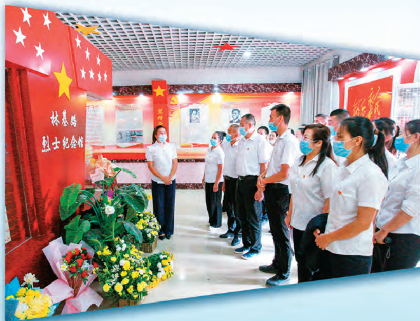
新疆库车市充分挖掘红色资源精神内涵，提高干部党性教育实效。图为市委机关干部在林基路烈士纪念馆开展主题党日活动。