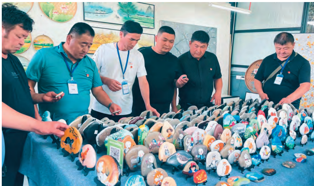
吐鲁番市青年村干部赴 援疆省市集中轮训。

以拓展深化党史学习教育为主题，探索示范“党性之源”教育思路，开展“领导干部上讲台”带头“讲微故事”，将先进人物、革命先辈感人事迹作为年轻干部培根铸魂的“营养剂”，研讨分析故事中的“闪光点”，教育引导年轻干部深化对党的为民宗旨、优良作风、清明政德等认识，自觉知底线冲火线守红线。“部机关各党小组组织党员干部轮流上讲坛，以党史故事为圆心，拓展讲民族团结故事、大国工匠故事、身边典型故事，鼓励干部加强自学，带动干部队伍思想得到淬炼。”集