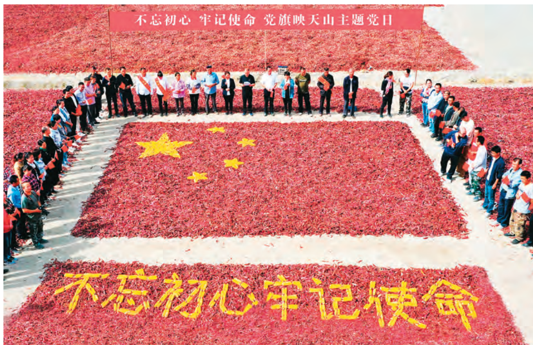
博湖县本布图镇认真落实“党旗映天山”主题党日制度。