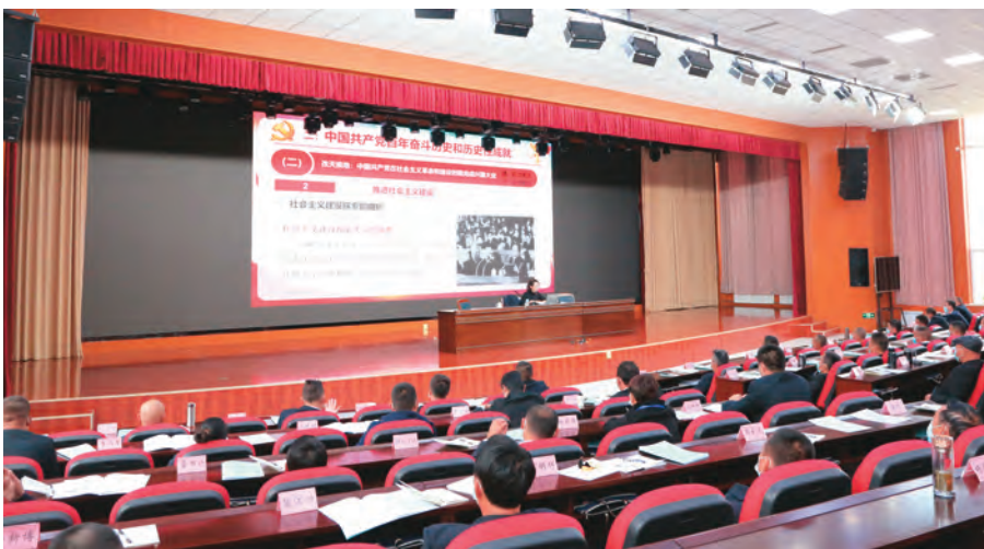
博尔塔拉蒙古自治州举办学习贯彻自治区党委十届三次全会精神专题培训班。

“网络+平台”打造指尖课堂。创新干部培训模式，联合清华大学开设“云课堂”，采取“博州干部群众出题、清华名师名家授课”定制化培训方式，每月开设 2 至 3 期专题培训，州县乡三级近 200 个教学点、5000 余人同步参训，实现线上培训不断档、干部培训不断线。开通“雨课堂”微信公众平台，