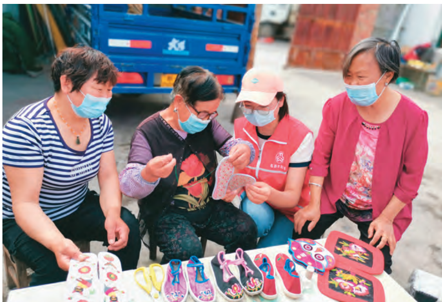
乌苏市朝阳路社区“访惠聚”工作队开展传统手工制作助民增收活动。

自治区党委组织部、老干部局驻乌什县依麻木镇托万克麦盖提村工作队引导村“两委”成立菌类种植专业合作社,试种产量高、经济效益好的雪莲菇。邀请自治区农科院的专家深入温室大棚,对雪莲菇种植提供全程技术服务,联系签订产品购销协议,解决销售问题。全村种植雪莲菇已达30万棒,年产值140万元。自治区人力资源和社会保障厅驻库车市阿拉哈格镇红旗村工作队引导村“两委”打造集蜜蜂养殖、蜂蜜采集、收购、加工、销售于一体的产业链。目前,该合作社有52户蜜蜂养殖户、年产蜂蜜300余吨、销售