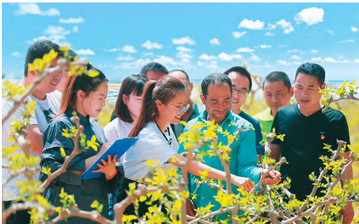
和田市年轻干部深入基层与林果业技术骨干共同探讨红枣树品种改良。