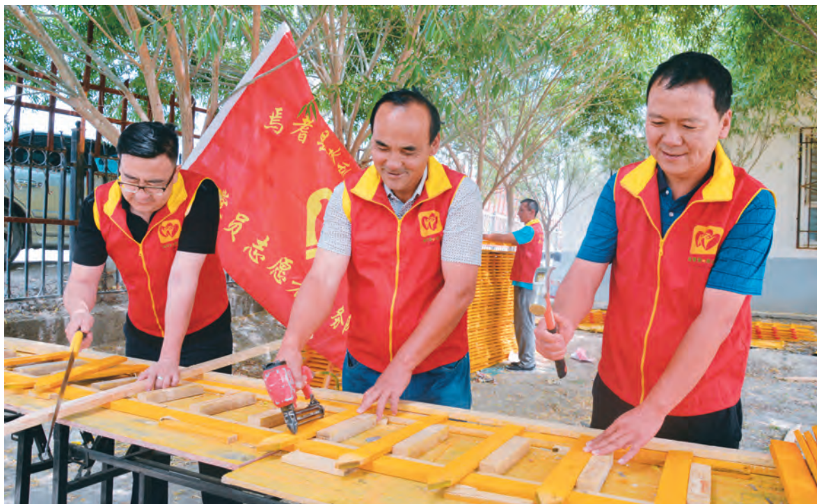
焉耆县四十里城子镇新渠村“访惠聚”工作队队员和村干部帮助村民制作菜园栅栏。