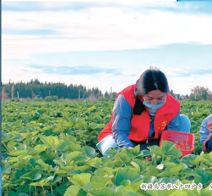
新疆乌苏市八十四户乡

新疆奎屯市开设法治讲学理论课堂、云端学习空中课堂、知识竞赛思辨课堂“三个课堂”,提升基层干部依法履职能力。开设法治讲学理论课堂,紧盯基层干部工作需要,设置政策解读、专题辅导模块,突出法律、法规、法典等涉及基层治理内容,组织法院、律师代表、市委党校和基层工作经验丰富的街道书记分层次、分领域集中授课;安排基层干部进入庭审现场,“沉浸式”感受庭审程序、法律条文运用全过程,激发基层干部学法用法积极性。开设云端学习空中课堂,邀请自治区党委