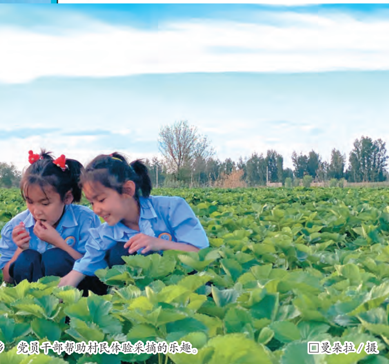
党员干部帮助村民体验采摘的乐趣。