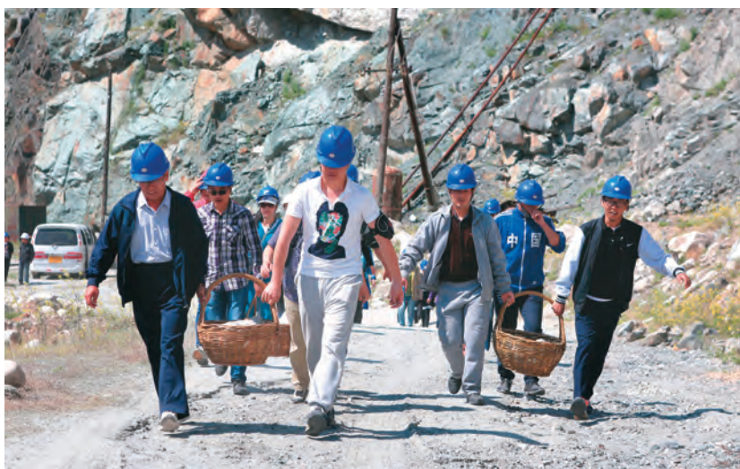
在可可托海干部学院三号矿脉现场教学点,党员干部参加“重走采矿路”体验式学习。

“统一规划、分级分类、精准施训”的培训方式,帮助地区各级干部不断学习新知识、熟悉新领域、开拓新视野、掌握新本领,有效激发干部学习的内生动力,调动干部干事创业的积极性。