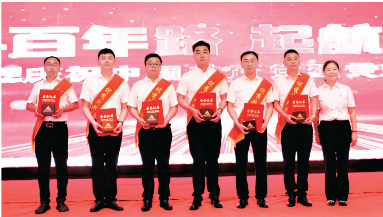
新疆润盛投资发展有限公司表彰优秀共产党员。

坚持把加强党的领导与完善公司治理相统一，把旗帜鲜明讲政治要求融入公司治理，把坚持党的领导写入公司章程，明确国有企业党组织在公司法人治理结构中的法定地位，实现