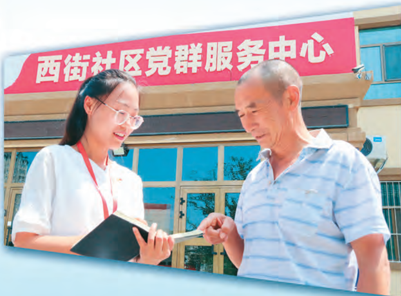
新疆昌吉市注重在基层一线锻炼干部，让年轻干部在疫情防控、城市党建、服务民生等急难险重岗位历练成才。图为昌吉市宁边路街道西街社区干部了解群众诉求。