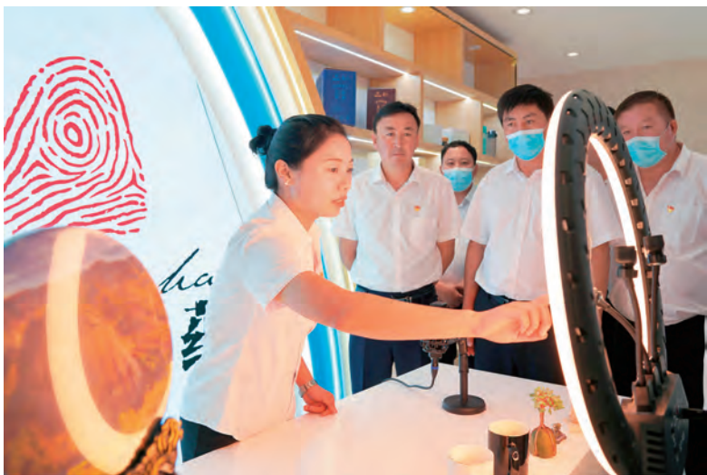
富蕴县新任村“两委”乡村振兴培训班学员学习直播带货,将家乡的特产推向全国。

整合人民调解、行政调解、行专调解、司法调解力量,形成公安、信访、审判、检察机关与人民调解紧密合作的“四对接”机制,联动化解重大疑难复杂矛盾纠纷。青河县通过培训,调动起农村基层干部干事创业的积极性和主动性,阿格达拉镇建起规划面积29万亩的自治区级农业科技示范园区,入驻企业15家,建成标准化规模养殖场10座,年产值达4亿元,吸纳全县1600名农牧民就近就业,托起群