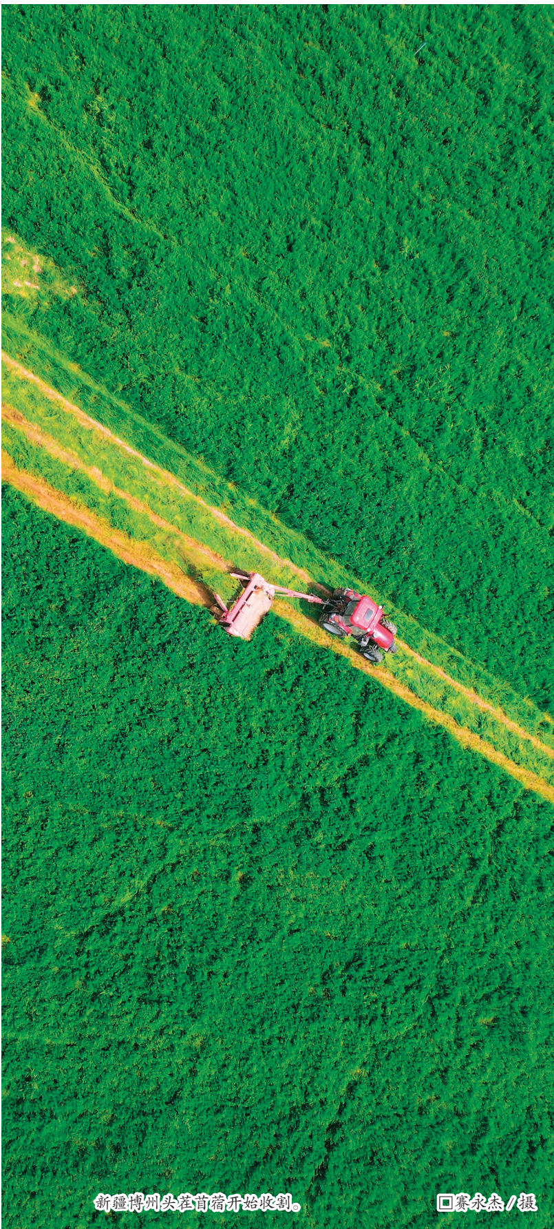
新疆博州头茬苜蓿开始收割。