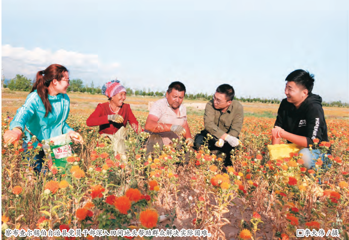
察布查尔锡伯自治县党员干部深入田间地头帮助群众解决实际困难。