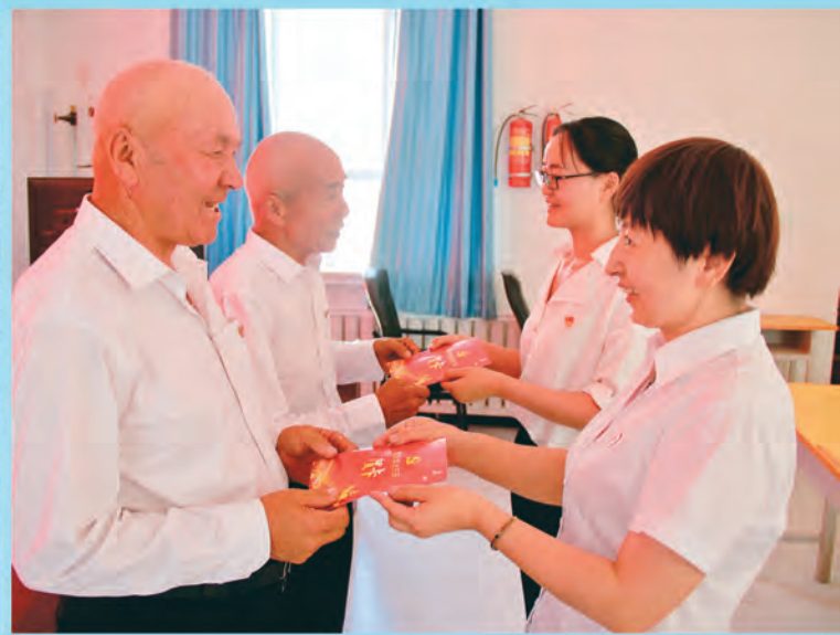
自治区党委组织部、老干部局驻乌什县依麻木镇汗都村“访惠聚”工作队,开展“忆初心 担使命”主题党日活动,强化党员意识,激励担当作为。