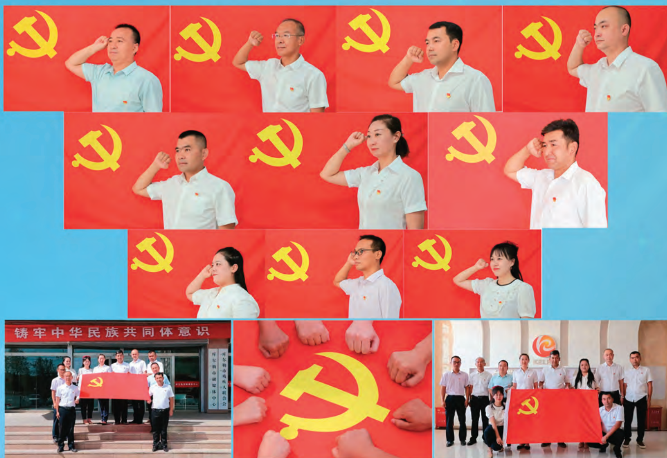
新疆库尔勒市各级党组织开展“庆七一喜迎党的二十大”“我和党旗合张影”活动。