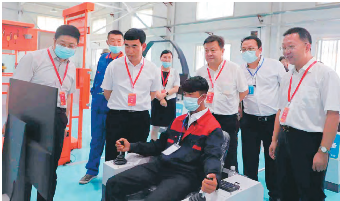
伽师县举办建筑领域人才技术工种职业技能大赛。