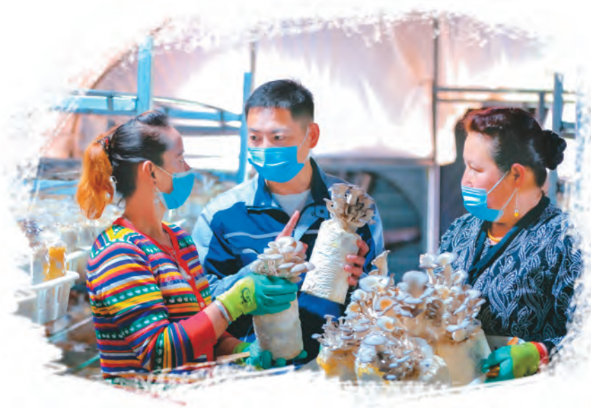
和田地区昆仑菌缘种植基地技术人才给种植大户讲解蘑菇种植技术。