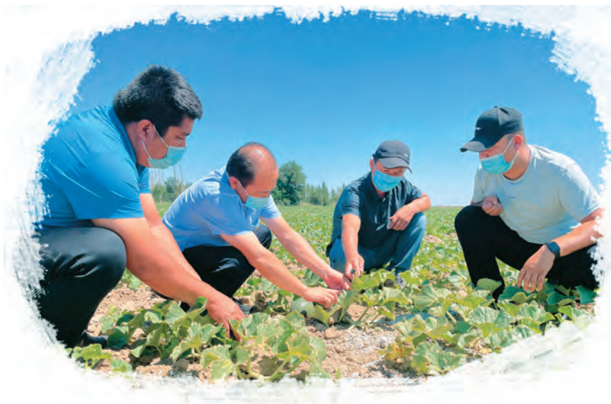
农技人员指导晚熟哈密瓜种植户科学实施田间管理。

哈密市委高度重视农业技术人才的培育和发展工作,将其纳入全市人才培养范畴,每年研究部署农业技术人才重点工作及任务,听取工作进展情况。加强校地合作,充分发挥高校在科技创新、人才智力等方面优势,与新疆大学签署战略合作框架协议,搭建高校与地方政府交流互动平台,深化在共建共享科技创新平台、引进高层次人才、加强人才培养等6个方面的交流合作;与新疆农业大学围绕人才培养、科技服务、成果转化等方面开展座谈,推动双方在乡村振兴、农业农村现代化等领域开展更加务实的合作。丰富培训形式,借助河南对口援疆机制,将农业技术人才送出去培训,通过集中授课、现场教学、经验分享等形式,开拓视野、提高能力。2021年以来,80多名农业技术人才赴河南省参加相关培训,提升综合素质。通过视频培训、远程教育等方式,邀请行业专家