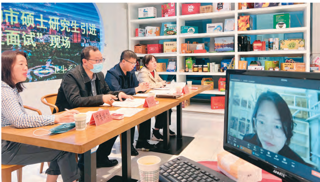
库尔勒市举行 2022 年引进人才“云面试”。

巴州各县市结合本地发展需要，积极引进各类急需紧缺高层次人才，博湖县出台《引进硕士研究生等高层次人才实施办法（试行）》，畅通研究生等紧缺人才引进“绿色通道”，更好服务县域经济社会高质量发展。轮台县