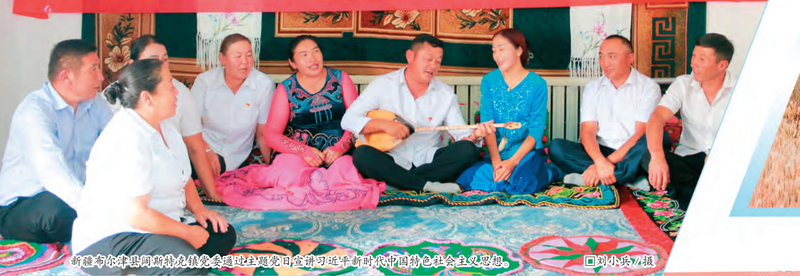
新疆布尔津县阔斯特克镇党委通过主题党日宣讲习近平新时代中国特色社会主义思想。