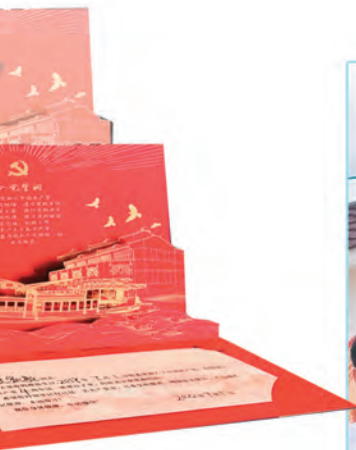
新疆吉木乃县人民法院党支部为党员精心制作的政治生日纪念卡。