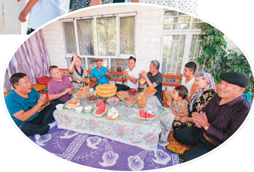
▶奇台县委统战部干部和古城乡果园村村民一起畅谈美好生活。