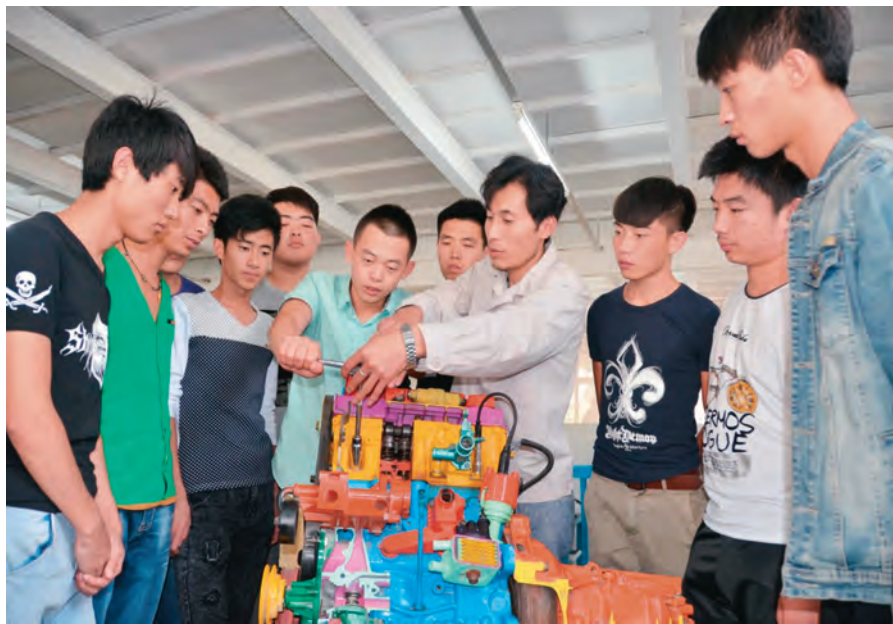
辽阳职业技术学院实训教师为额敏县学生上发动机实训课。