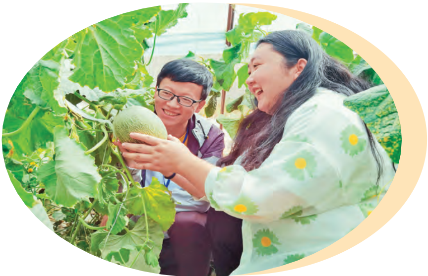
若羌县农村实用人才查看“西州蜜”甜瓜长势情况。