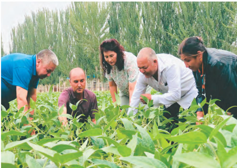
洛浦县农业技术推广站专家指导农民做好农作物病虫害防治工作。