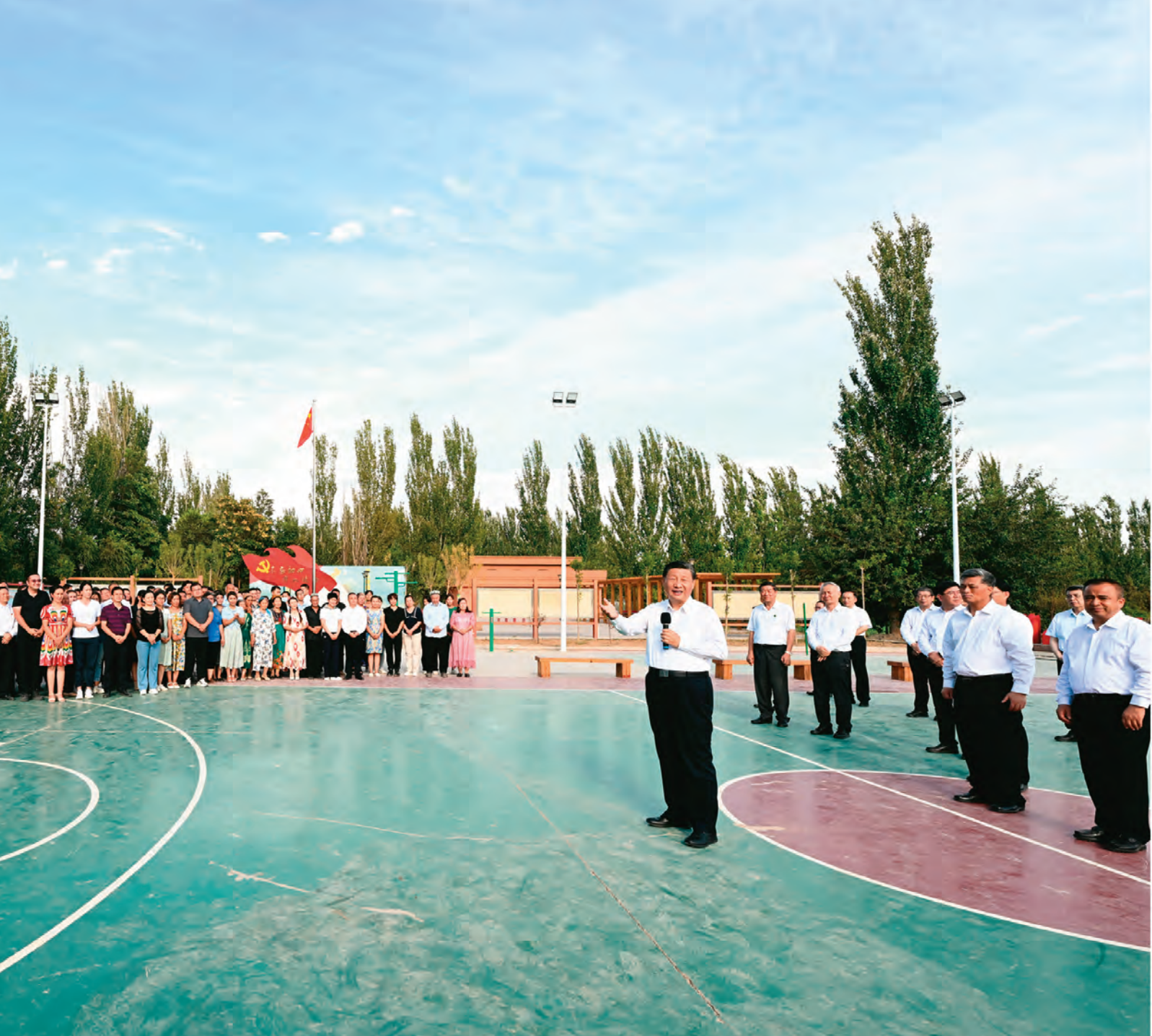
习近平在新疆考察。这是14日，习近平在吐鲁番市高昌区亚尔镇新城片区新城西门村村广场，同村民们亲切交流。

习近平指出，做好新疆工作事关大局，是全党全国的大事。全党都要站在战略和全局高度认识新疆工作的重要性，加大对口援疆工作力度，完善对口援疆工作机制，共同把新疆的工作做好，以实际行动迎接党的二十大胜利召开。