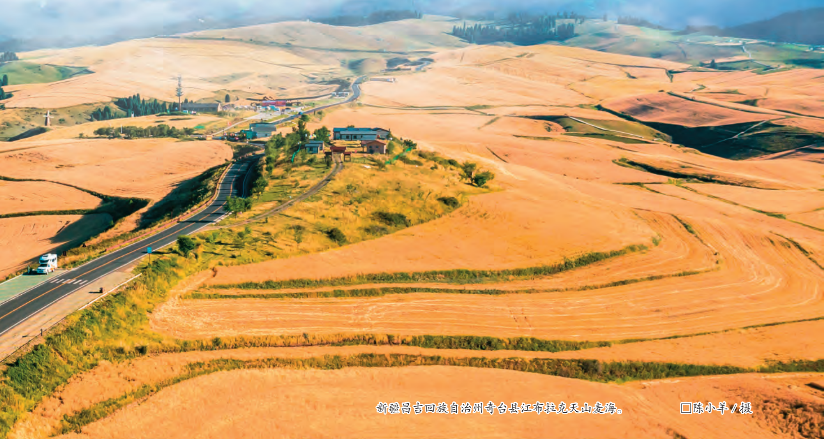
新疆昌吉回族自治州奇台县江布拉克天山麦海。