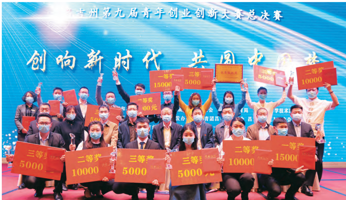
昌吉州举办第九届青年人才创新创业总决赛。