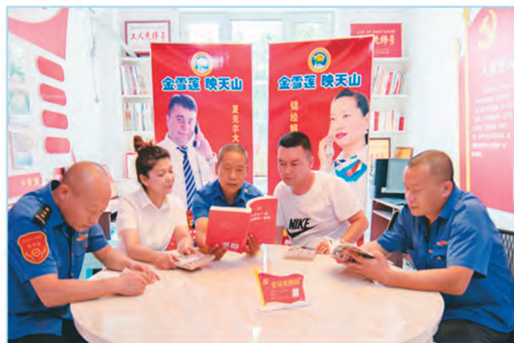
新疆乌鲁木齐公交集团公司二车队党支部强化党员学习教育,创建“金雪莲”党建品牌,助推优质服务提档升级。