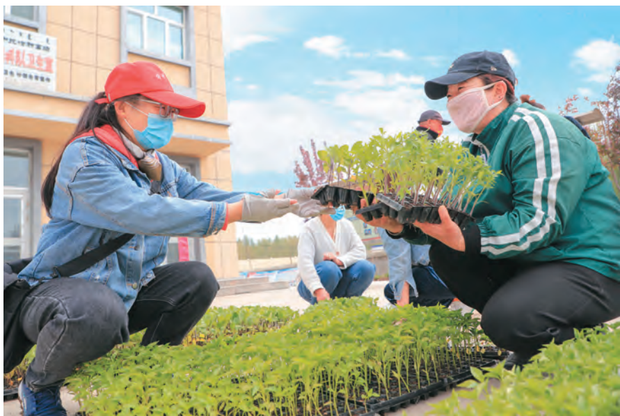
博州农业技术推广中心驻温泉县呼和托哈种畜场“访惠聚”工作队队员引导牧民发展庭院经济,助民增收。

“黄金谷,穗穗香,丰收时节喜洋洋……”这是疏勒县库木西力克乡库木西力克村村民编写的顺口溜。新疆农业科学院“访惠聚”驻村工作队发挥农业科研单位优势,引进公司到村投