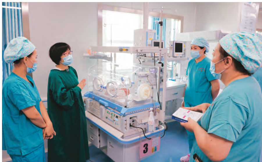
中国医科大学援疆专家向塔城地区人民医院护士传授新生儿护理知识。

培养骨干人才。大力实施医疗人才培养培训项目,邀请后方专家到受援医院讲学2228场次,选派到后方医院进修学习,举办培训班3978场次、培训15.4万余人次。组织疆内外高校开展临床医学研究生免费定向培养工作,一批批本地医疗人才成长为所在医院的中层领导和业务骨干。