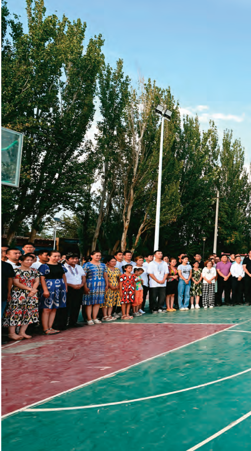
7月12日至15日，中共中央总书记、国家主席、中央军委主席习近平

习近平指出，要坚持全面从严治党，切实抓好高素质干部队伍建设。要坚持严的主基调，以党的政治建设为统领推进党的各方面建设，严肃政治纪律和政治规矩。要巩固拓展