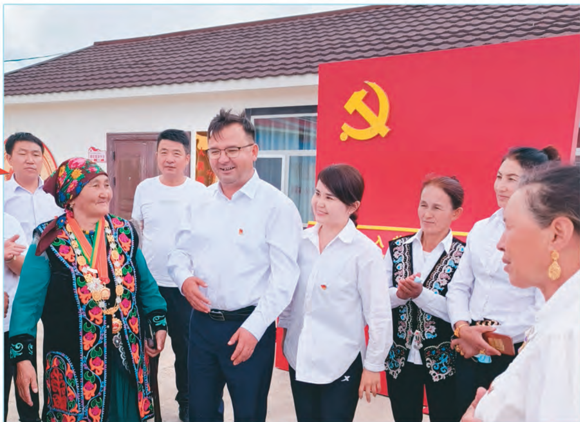
自治区纪委监委驻阿克陶县皮拉勒乡依也勒干村“访惠聚”工作队组织党员干部走进“人民楷模”布茹玛汗·毛勒朵家中开展主题党日活动,激发党员爱党爱国之情。