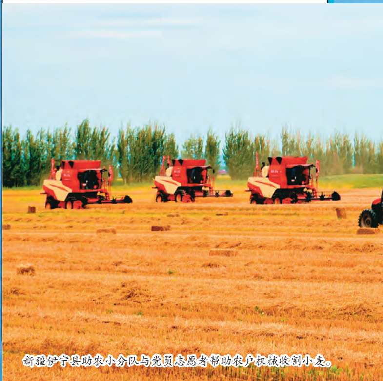
新疆伊宁县助农小分队与党员志愿者帮助农户机械收割小麦。

阿克苏市开展“百名专家人才服务百个行政村”活动,充分发挥专家人才“领头雁”作用,助推乡村振兴发展。选派科技特派员、农业专家、致富带头人等 95 名专家人才,组建 6 支志愿服务队,与 122 个村签订服务承诺书、发放服务联系卡、建立服务联系点。分