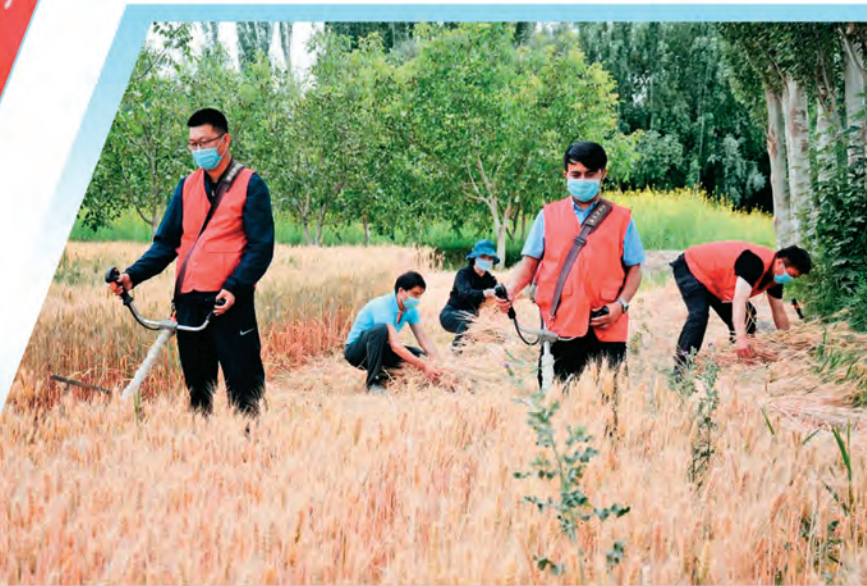
新疆麦盖提县库木库萨尔乡库木博斯坦村党支部将主题党日开到田间地头,帮助缺少劳动力的农户抢收小麦,强化党员宗旨意识。