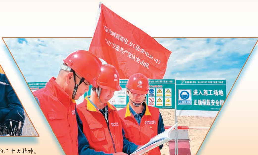
新疆送变电公司发挥党员先锋模范作用,带领员工 学习党的二十大精神。