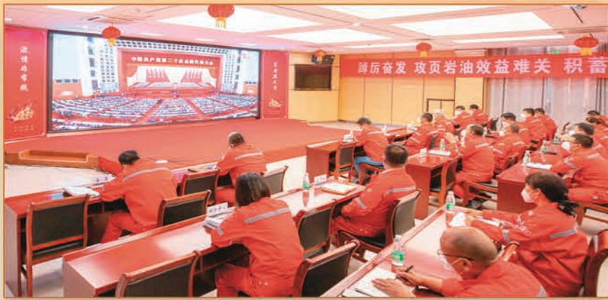
中国石油新疆油田分公司吉庆油田作业区组织党员干部收看党的二十大开幕盛况。