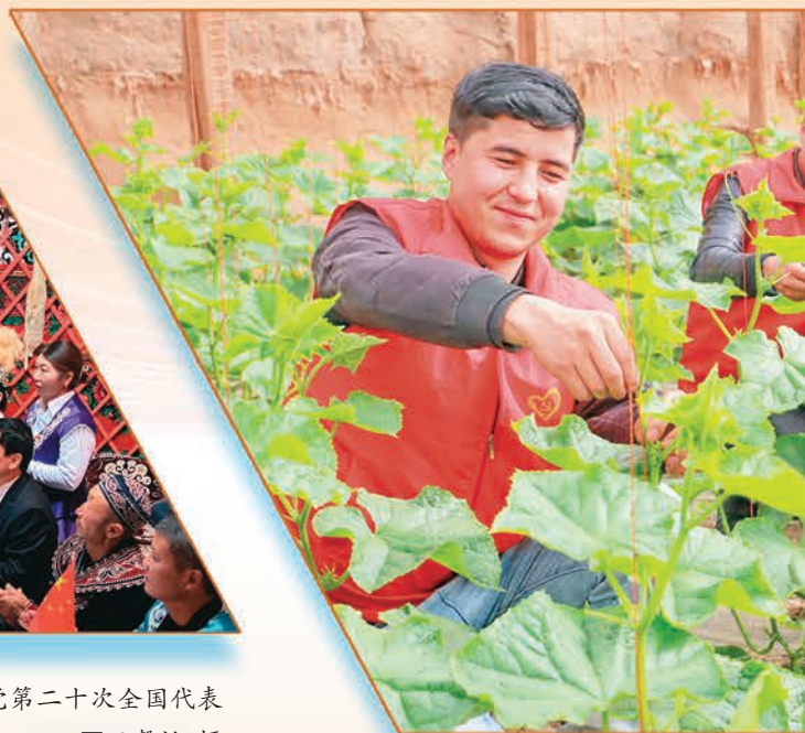
库车市委组织部开展“贯彻二十大精神”主题党日活动,组织干部在齐满镇红星村帮助菜农管理蔬菜。