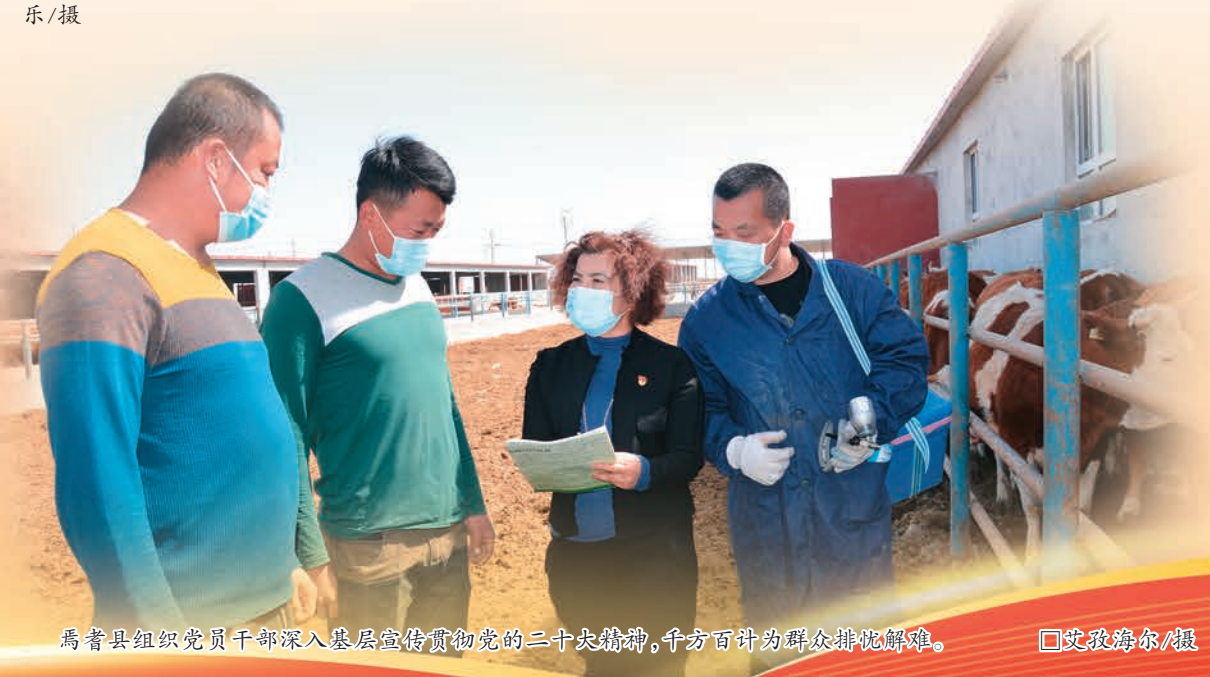
焉耆县组织党员干部深入基层宣传贯彻党的二十大精神,千方百计为群众排忧解难。