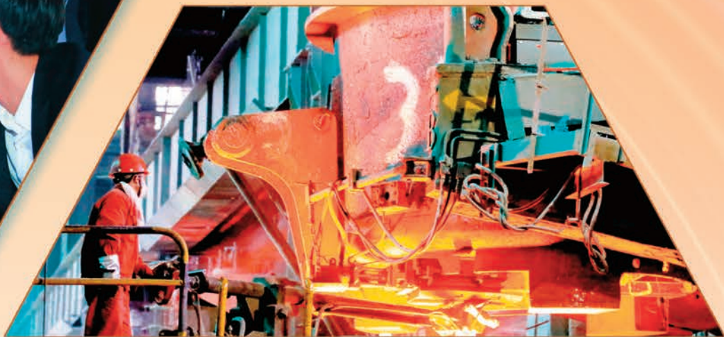
宝钢集团新疆八一钢铁有限公司党委把党的二十大精神转化为推进企业深化改革、 高质量发展的具体实践。