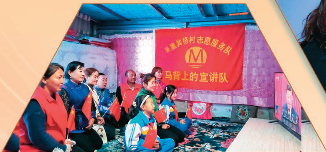
温泉县查干屯格乡米里其格村党支部成立“马背上的宣讲队”，深入牧区组织群众收看党的二十大开幕会。 □邹治刚/摄