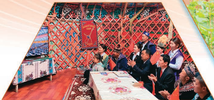
沙湾市博尔通古乡喀拉萨依村党员干部群众共同收看中国共产党第二十次全国代表大会开幕会盛况。

10月16日,中国共产党第二十次全国代表大会在北京胜利召开。新疆各级党组织迅速掀起学习宣传贯彻党的二十大精神热潮,以强烈的政治责任感推动党的二十大精神在天山南北全面落地生根,在新时代新征程上奋力谱写全面建设社会主义现代化国家、全面推进中华民族伟大复兴的新疆篇章。