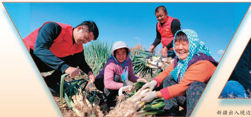
塔城市人大办公室、市残疾人联合会驻恰夏镇官店村“访惠聚”工作队队员帮助农户收获大葱，以实际行动宣传贯彻党的二十大精神。