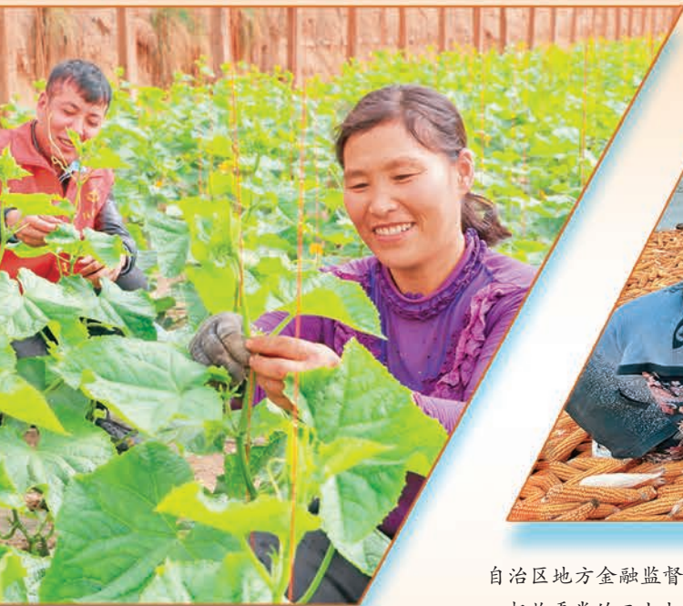
精神 为民服务办实事”系列活动。图为 理 蔬菜大棚。