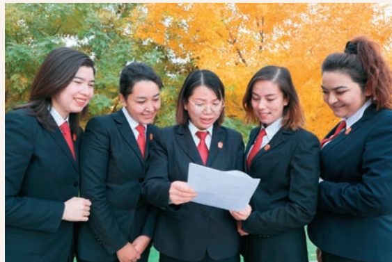
伽师县人民法院抽调骨干力量开展党的二十大精神宣讲活动。

伽师县委组织部认真学习宣传党的二十大精神,开展“讲读写”学习系列活动,让党的二十大精神迅速落地。开展“线上+线下”特色讲。