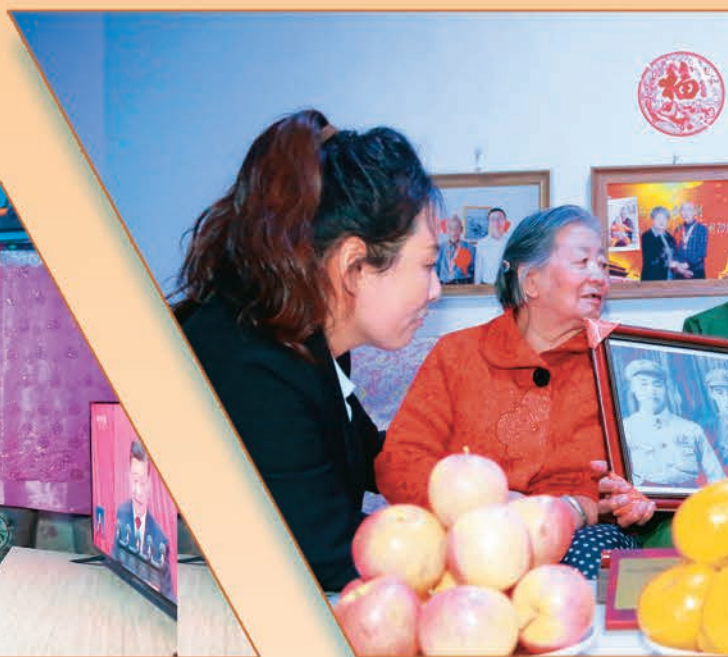
吉木萨尔县吉木萨尔镇苇湖巷社区微阵地组织群众学习党的二十大报