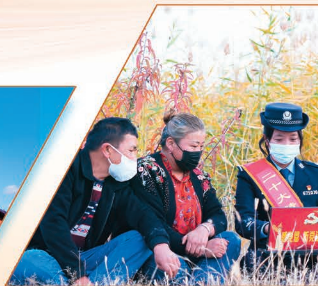
新疆出入境边防检查总站阿克苏边境管理支队塔格拉克边境