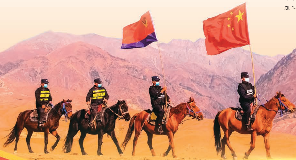
新疆伊犁边境管理支队小麻扎边境派出所民警坚守岗位。