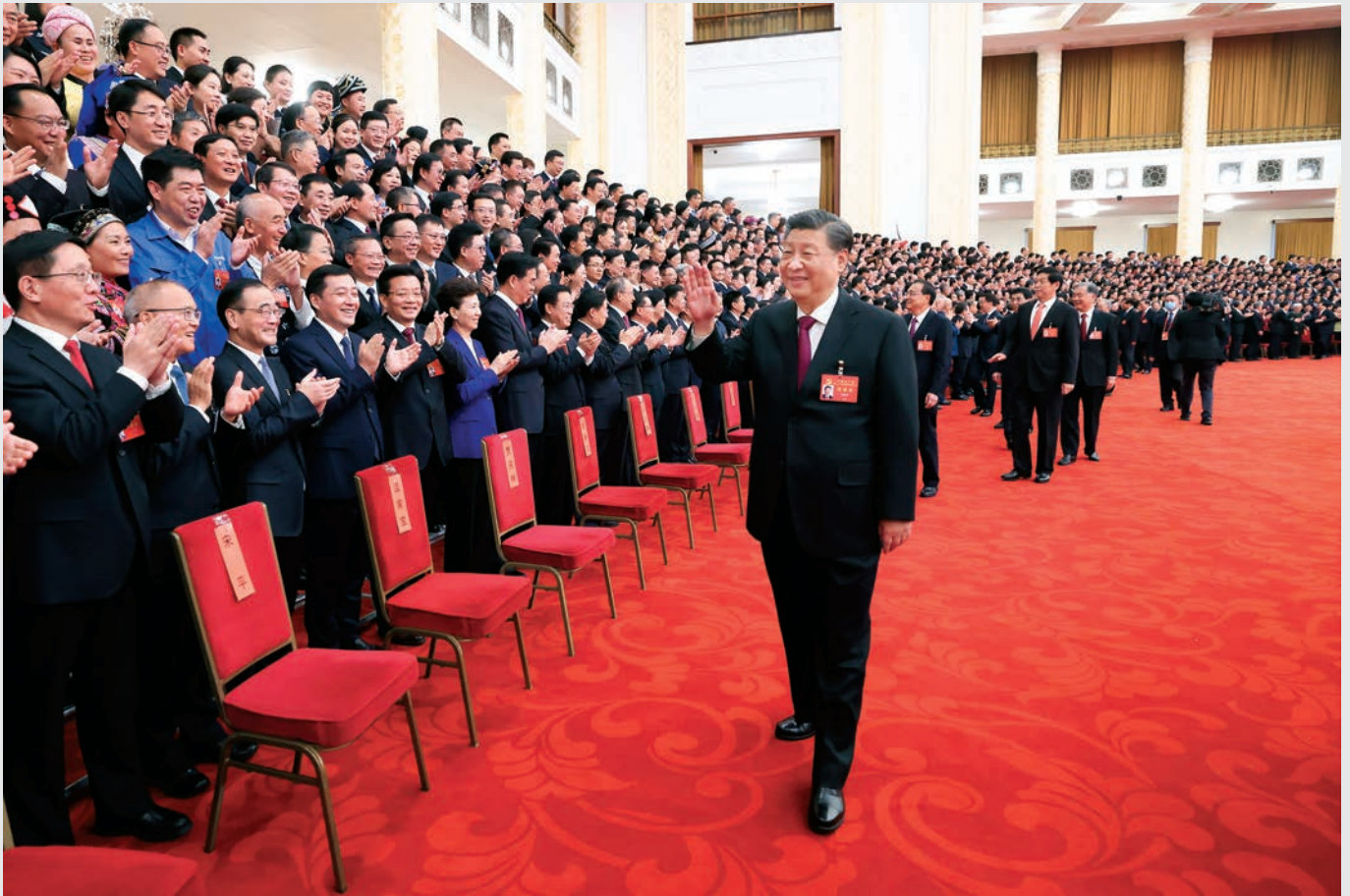
10月23日下午,中共中央总书记、国家主席、中央军委主席习近平等领导同志在北京人民大会堂亲切会见出席党的二十大代表、特邀代表和列席人员,并同大家合影留念。