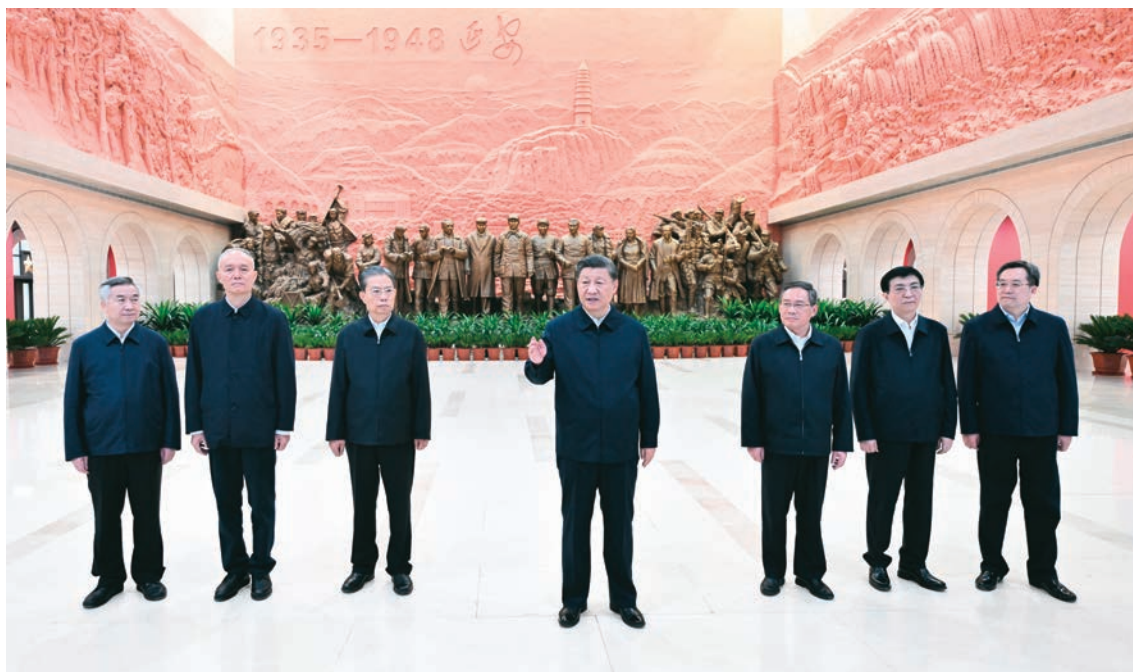
10月27日,中共中央总书记、国家主席、中央军委主席习近平带领中共中央政治局常委李强、赵乐际、王沪宁、蔡奇、丁薛祥、李希,瞻仰延安革命纪念地。这是习近平在延安革命纪念馆参观《伟大历程——中共中央在延安十三年历史陈列》结束时发表重要讲话。