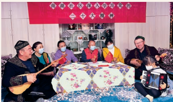
塔城地区信访局、塔城新华书店有限责任公司驻塔城市二工镇南湖社区“访惠聚”工作队以阿肯弹唱的形式,向社区居民宣讲党的二十大精神。