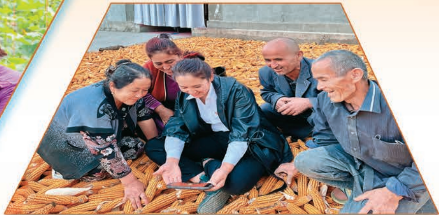
自治区地方金融监督管理局驻阿图什市松他克镇克青孜村“访惠聚”工作队队员和村民一起收看党的二十大开幕会。