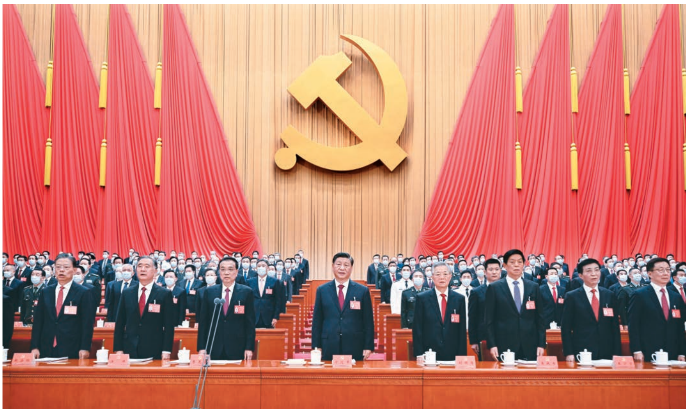
10月16日,中国共产党第二十次全国代表大会在北京人民大会堂开幕。这是习近平、李克强、栗战书、汪洋、王沪宁、赵乐际、韩正、胡锦涛在主席台上。

新华社北京10月16日电 凝心聚力擘画复兴新蓝图,团结奋进创造历史新伟业。举世瞩目的中国共产党第二十次全国代表大会16日上午在人民大会堂开幕。