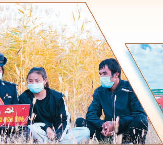
边境派出所民警走进田间地头,向群众宣讲党的二十大精神。