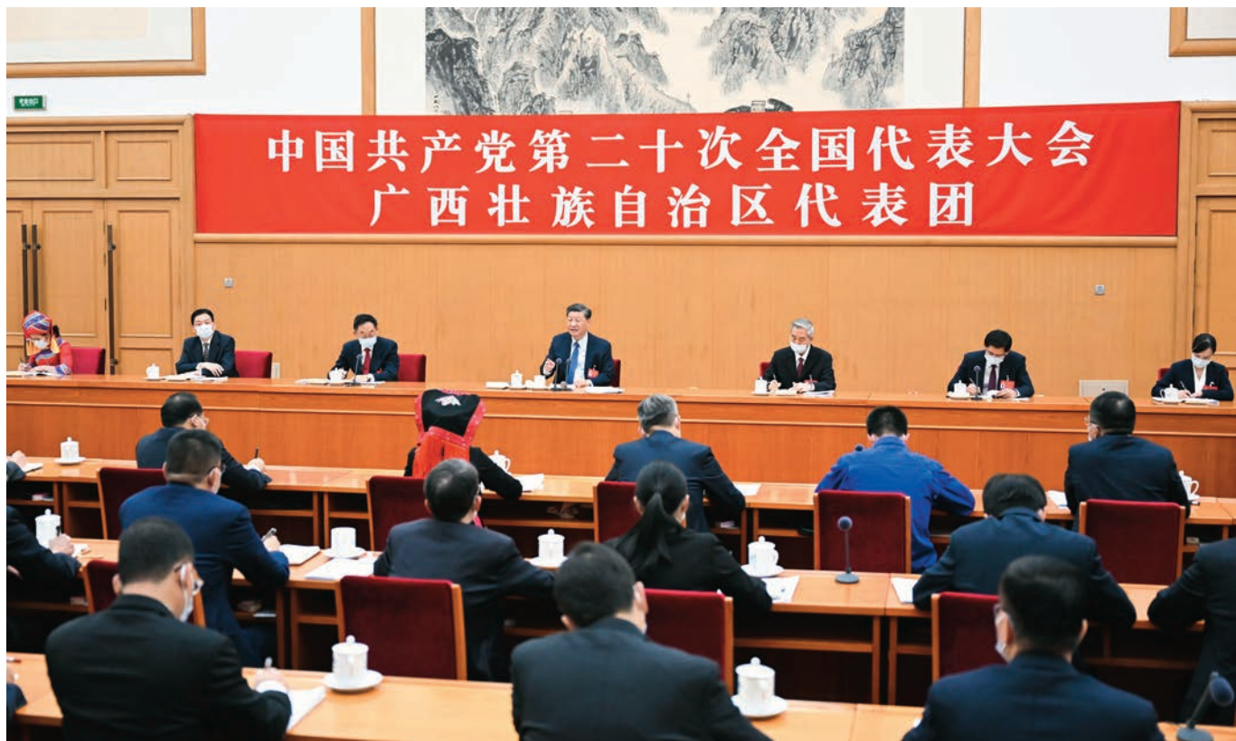
10月17日,习近平同志参加党的二十大广西代表团讨论。