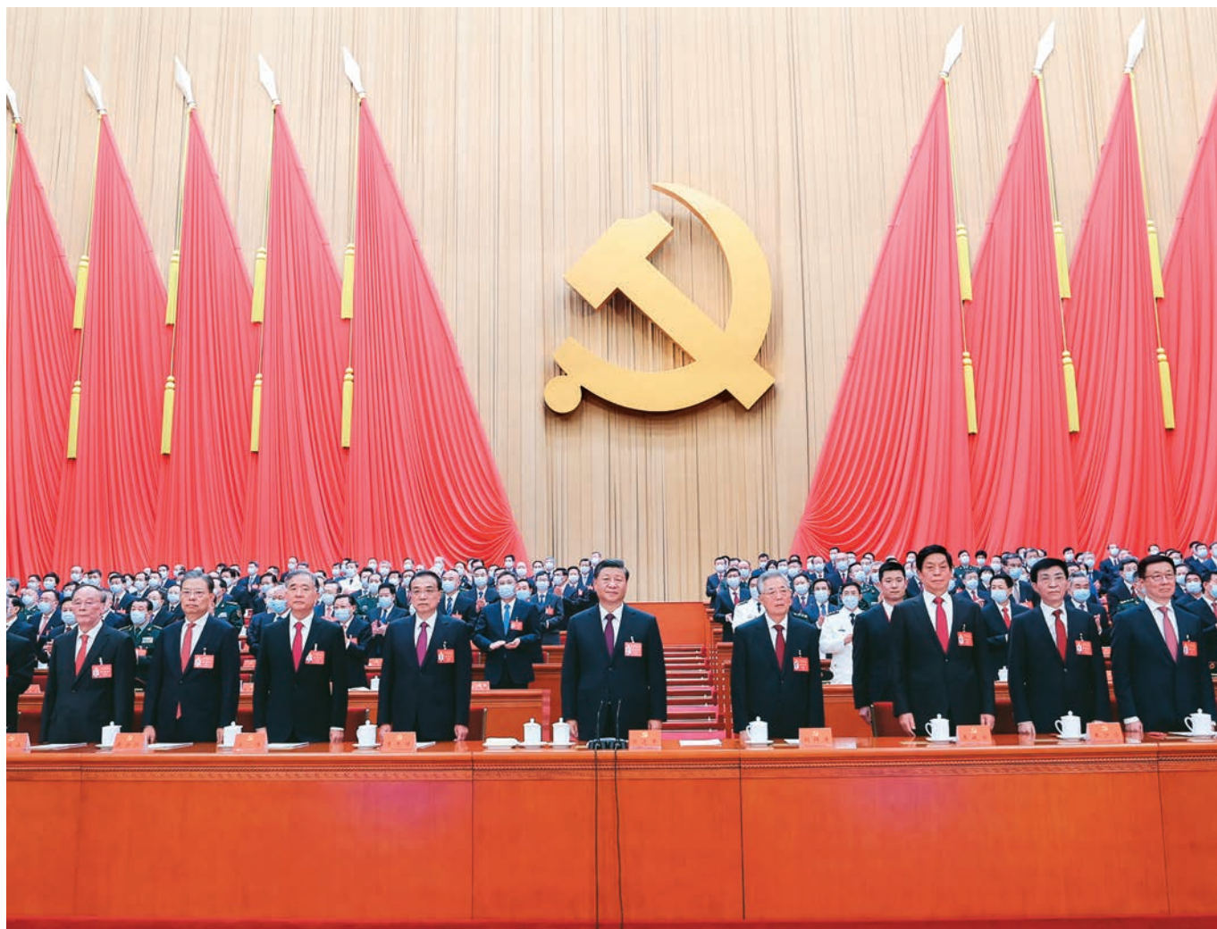
10月22日,中国共产党第二十次全国代表大会在北京人民大会堂胜利闭幕。这是习近平、李克强、栗战书、汪洋、王沪宁、赵乐际、韩正、王岐山、胡锦涛在主席台上。