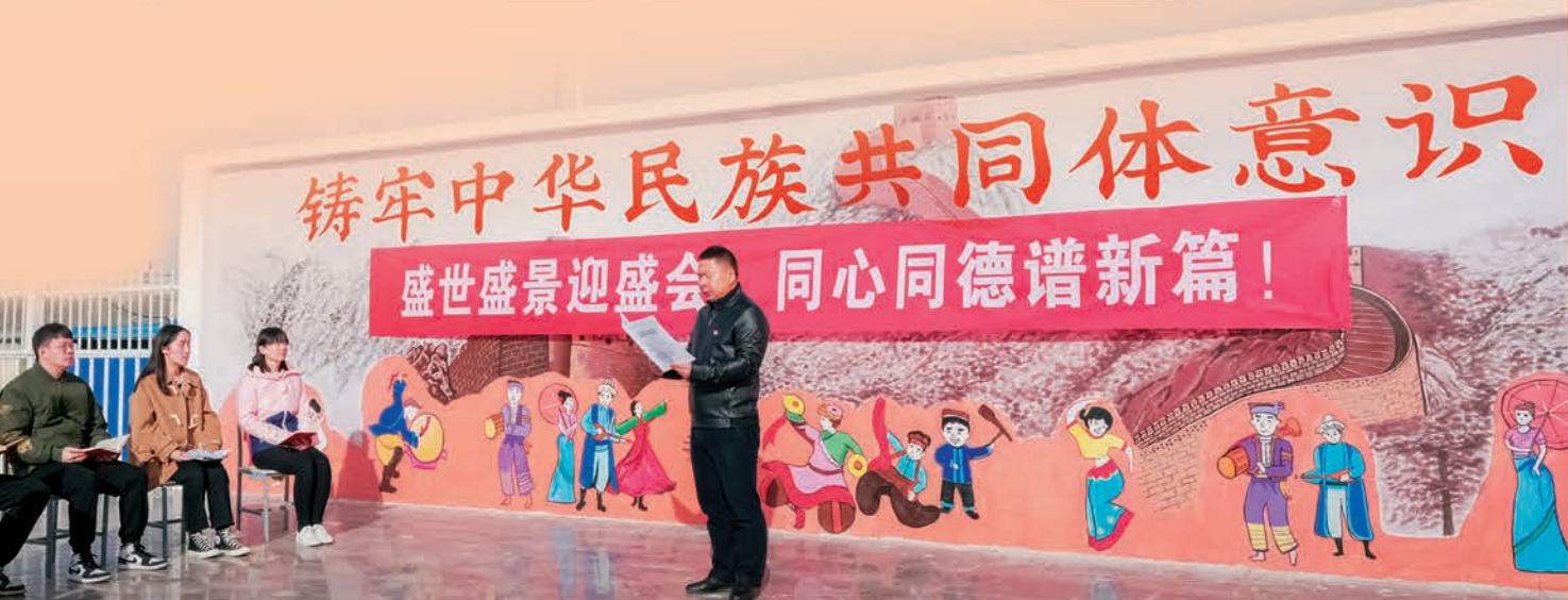
△吉木乃县开展“小院讲堂”活动，深入学习党的二十大精神。图为乌拉斯特镇齐阔尔加村第一书记为党员群众解读党的二十大报告。