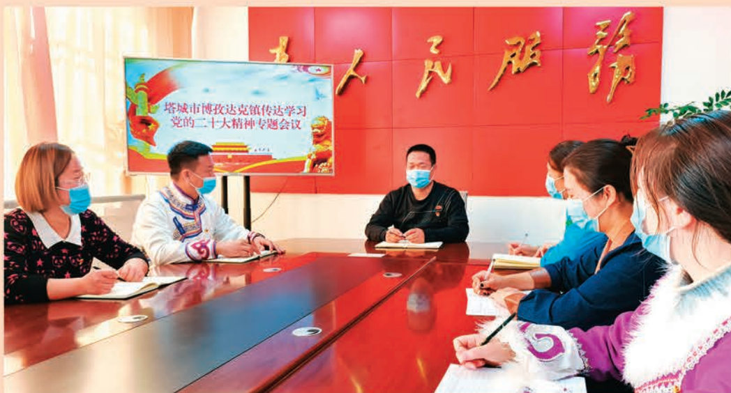
◀塔城市博孜达克镇党委召开学习党的二十大精神专题会议，党员干部结合岗位谈体会、谈认识、谈打算，分享学习心得。