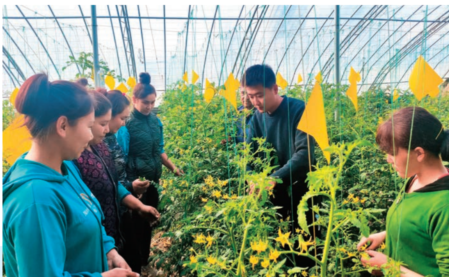
山东省东营援疆指挥部深入贯彻党的二十大精神,以科技助力疏勒县蔬菜产业提质增收。

新时代新理论,新征程新使命。各省市援疆前方指挥部和广大援疆干部人才正以更高的政治站位、更强的使命担当、更实的工作作风,学习贯彻党的二十大精神,把党的二十大精神学习成果落实到具体援疆工作中,用心用情用力书写援疆新篇章。 [责任编辑:朱振陆]