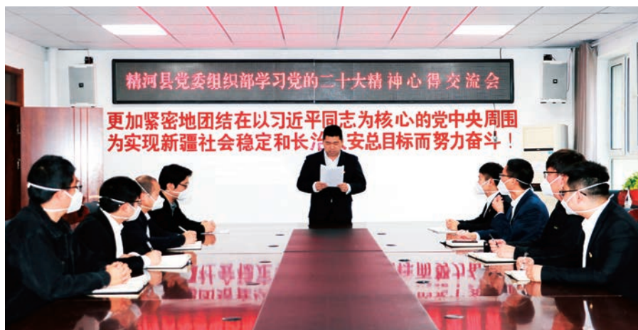
精河县委组织部举行学习党的二十大精神心得交流会。

办法(试行)》,坚持严格管理和关心信任相统一,突出在政治上激励、工作上支持、待遇上保障、生活上关心、心理上关怀,切实增强干部职工的荣誉感、归属感、获得感。莎车县、疏附县委组织部以党的二十大精神为指引,坚持严的基调不动摇,持续开展不担当不作为问题专项整治工作,抓实抓细干部能上能下、容错纠错等制度,推动形成能者上、优者奖、庸者下、劣者汰的用人导向和政治生态。阿克陶县委组织部把