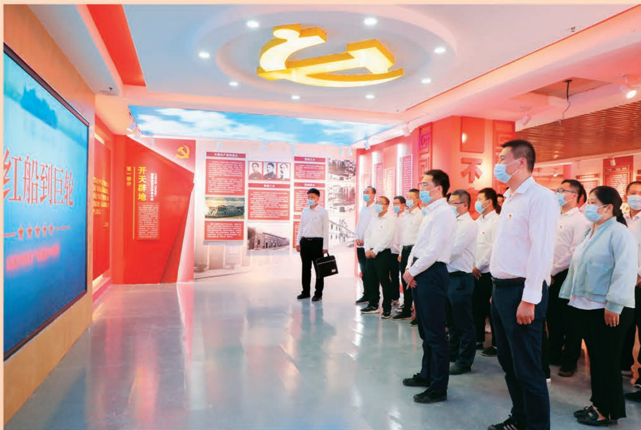
▲伽师县委组织部组织党员干部到红色教育基地参观学习,深刻领会党的二十大精神。