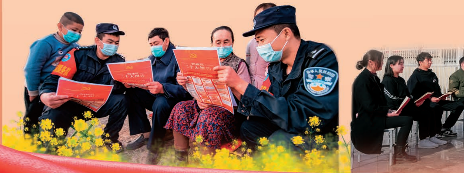
▼哈密市红柳峡边境派出所民警深入辖区宣传党的二十大精神。 □张 辉/摄