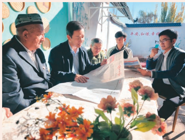
喀什市帕哈太克里乡党员干部深入群众宣传党的二十大精神。

的重大要求,实施人才强县战略,突出人才是第一资源,全方位培养、引进、用好人才,吸引各类人才集聚伊吾,为产业发展提供人才支撑。重点围绕产业链布局人才链,实施“十百千”引才工程,引导企业设立“首席招才官”,与新疆大学签订协同创新合作协议,促进高层次人才向产业链集聚。健全完善人才培养办法,选拔一批符合条件的产业人才,实行师带徒结对培养机制,每年选派一批具有发展潜力的优秀技能人才外出考察学习,帮助其开阔视野、快速成长。建立健全人才目录、人才库、师资库、项目库“一目三库”,积极培育高新技术企业产学研用平台,鼓励优秀技能人才牵头领办技能大师工作室,探索建立人才管理服务权力清单和责任