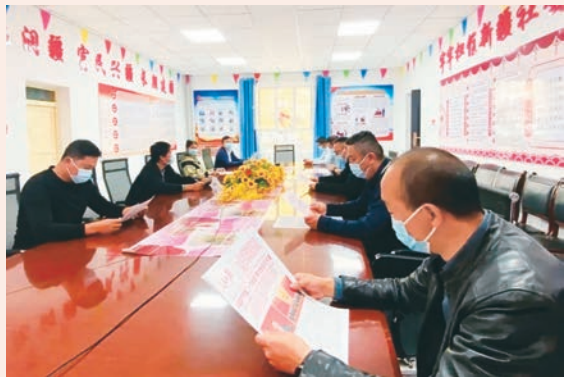
自治区党委组织部、老干部局驻乌什县依麻木镇玉斯屯克和田村工作队通过多种形式学习宣传贯彻党的二十大精神。

阿克苏地委组织部在全面学习、全面把握、全面落实上下功夫,推动党的二十大精神入脑入心、落地落实。制定《学习宣传贯彻党的二十大精神实施方案》,采取领导干部带头专题学、党员干部紧跟集中学、群众宣讲覆盖学等方式,坚持学原文、悟原理,在掌握精神实质上下功夫,确保党的二十大精神把握准、理解透、落实好。依托柯柯牙纪念馆、林基路烈士纪念馆、新时代党性教育馆网上展馆等红色教育资源,通过“主题党日+”活动、“课堂+基地”实训等方式,深入学习《党的二十大报告辅导读本》《党的二十大报告学习辅导百问》等辅导材料,引导广大党员干部领悟党的二十大精神内涵。坚决落实二十大报告“必须坚持科技是第一生产力、人才是第一资源、创新是第一动力”要求,聚焦阿克苏地区人才项目,梳理人才工作中8项急需改进、完善或规范的工作,推动人才评价与培养、使用与激励相衔接,规范建立人才资源信息库,为管理服务人才工作提供信息咨询和决策依据,推动人才项目落地落实,为新时代阿克苏各项事业高质量发展提供人才支撑。(阿组轩)