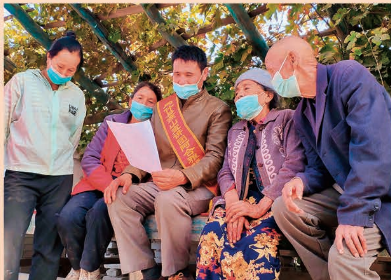
▲乌什县组建“燕山之声”“燕山巾帼”“燕山夕阳红”等29支宣讲团,用群众喜闻乐见的方式宣讲的二十大精神。