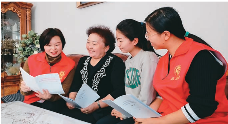
援建博州温泉县的湖北援疆干部深入居民群众家中宣讲党的二十大精神。

辽宁省援疆干部、塔城地委副书记李勇,广东省援疆干部、喀什地委副书记王再华说,新时代10年来,在以习近平同志为核心的党中央坚强领导下,党和国家事业取得历史性成就,迎来中国共产党成立一百周年、中国特色社会主义进入新时代、完成脱贫攻坚全面建成小康社会……这些都在于习近平总书记掌舵领航,在于习近平新时代中国特色社会主义思想科学指引。要深刻领悟“两个确立”的决定性意义,切实增强“四个意识”、坚定“四个自信”,做到“两个维护”,坚定不移沿着总书记指引的正确方向奋勇前进。上海市援疆干部、喀什地委副书记侯继军,天津市援疆干部、和田地委副书记陈健,江西省援疆干部、克州党委副书记蔡清平表示,经过接续奋斗,新疆同全国一道实现小康这个中华民族的千年梦想,打赢了人类历史上规模最大的脱贫攻坚战,党和政府投资在上海市援建的喀什地区叶城县、天津市援建的