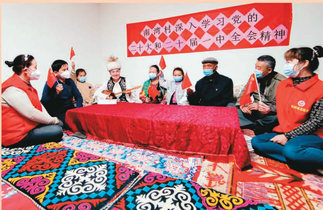
▲沙湾市东湾镇南湾村党支部通过大喇叭、线上课堂、线下入户等方式宣讲党的二十大精神。图为宣讲员以冬不拉弹唱的方式宣讲党的二十大精神。

新疆维吾尔自治区各级党组织把学习宣传贯彻党的二十大精神作为当前和今后一个时期首要政治任务,认真抓好学习培训,扎实做好宣传宣讲,全面抓好贯彻落实,引导全区广大党员干部群众立足岗位、埋头苦干、奋勇前进,在新征程上凝聚起团结奋斗的磅礴力量,推动党的二十大精神在天山南北落地生根。