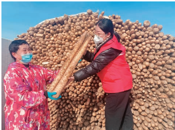
沙湾市纪委监委驻四道河子镇下八户村“访惠聚”工作队把党的二十大精神落实到为民服务行动上。图为工作队员在帮助村民搬运山药。

大精神相关理论录制成快板、三句半及冬不拉弹唱等文艺作品 20 余部,以“百姓话”来宣讲“大政策”,推动党的二十大精神深入人心。塔城地区住建局驻乌苏市西湖镇大庄子村“访惠聚”工作队打造新时代文明实践站、家庭党校等阵地,发挥村里自治区级非物质文化遗产“西湖小曲子”传承人作用,组建“红石榴”宣讲队,编排创作出《党的二十大似明灯》《代出英雄》等文艺作品,以“文艺+宣