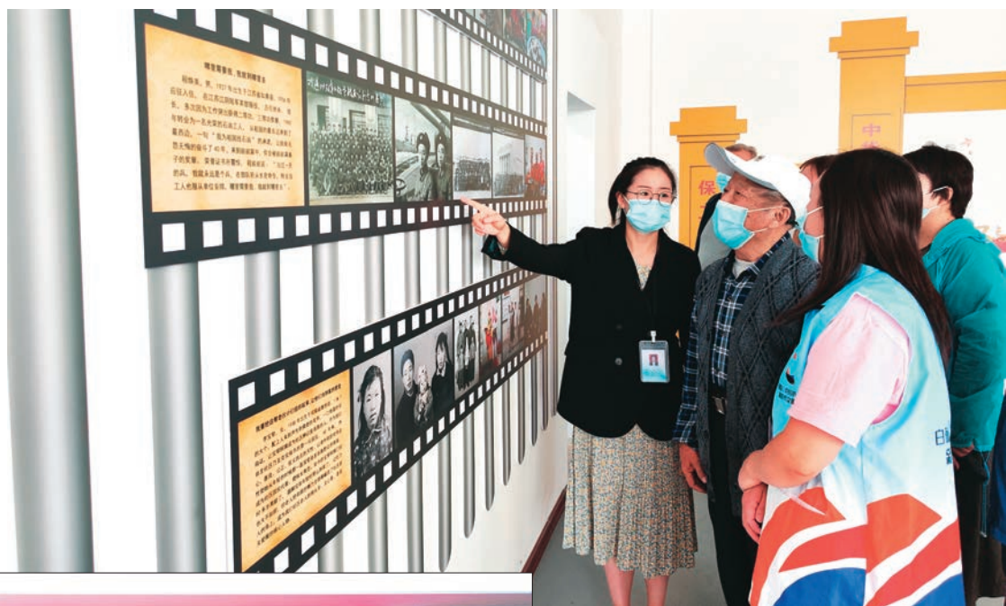
▲克拉玛依市白碱滩区(克拉玛依高新区)光阴博物馆开展群众教育。