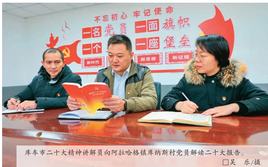
库车市二十大精神讲解员向阿拉哈格镇库纳斯村党员解读二十大报告。

全区各级党组织坚持学思用贯通、知信行合一,认真对照党的二十大精神明确的任务要求,结合实际进一步细化、实化、具体化,研究提出贯彻落实的思路举措。自治区政协立足专门协商机构的职能定位,把自觉践行全过程人民民主作为学习贯彻党的二十大精神的重点,聚焦党政所需、群众所盼、政协所能,推动党的二十大精神在全区政协系统落地生根、见到实效。自治区农业农村厅把学习宣传贯彻党的二十大精神同谋划明年和今后一个时期“三农”工作紧密结合起来,组织开展“三农”重大问题研究,推进乡村