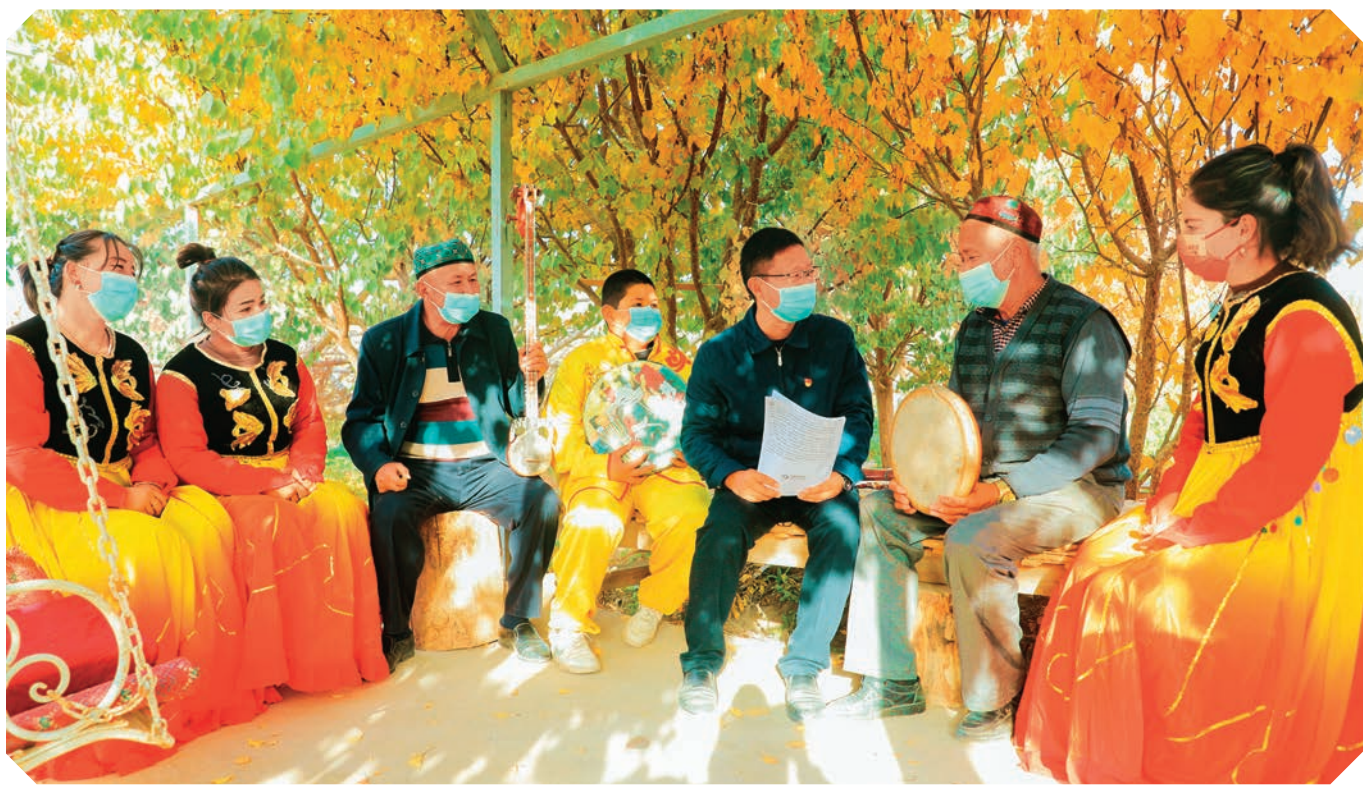
且末县“石榴籽”小分队向群众宣讲党的二十大精神。