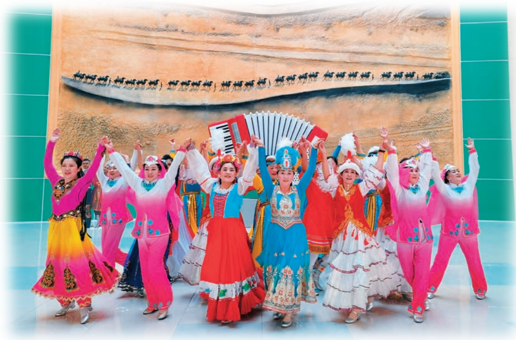
塔城市各族群众在手风琴博物馆开展“民族融情”联谊活动,展现出民族大团结的和谐景象。

充分发挥各级宣讲团、宣讲队优势,采取阿肯弹唱、乌兰牧骑、马背宣讲队宣讲等方式,向各族群众宣传民族团结相关政策、讲好民族团结故事,教育引导各族群众自觉维护民族团结。依托红楼博物馆、沙勒克江家庭展馆、阿山民俗馆等民族团结进步教育基地,展示民族团结先进典型事迹,每年受教育群众达30余万人(次)。典型示范引领。深入挖掘和选树13年来风雨无阻在自