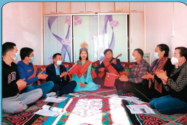
新疆福海县用群众喜闻乐见的方式推动党的二十大精神进万家。

托里县委组织部聚焦习近平总书记在党的二十大报告关于“抓好后继有人这个根本大计”的指示,紧抓干部日常管理工作,打造过硬干部队伍。以平时考核、年度考核为载体,有效掌握干部信息。注重从干部履行岗位职责、承担重点任务、参加组织生活和集中教育培训活动等日常工作中,分析掌握干部的一贯表现,全方位、多角度考准考实干部政治表现。制定《托里县科级领导班子和领导干部平时考核实施方案》,提升考核工作的科学性和精准度,按季度对乡镇、县直部门(单位)和科级干部开展平时考核工作。结合调研、督导检查、干部培训等工作,落实谈心谈