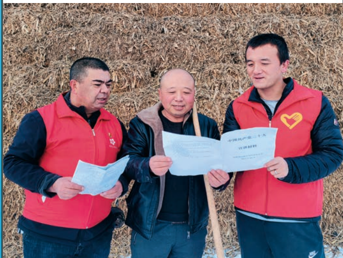
国家税务总局伊宁县税务局驻愉群翁回族乡中阿布拉什村工作队走进田间地头开展党的二十大精神“微宣讲”。

焉耆县委组织部深入学习贯彻党的二十大精神,实施“组工干部能力素质提升计划”,创新打造