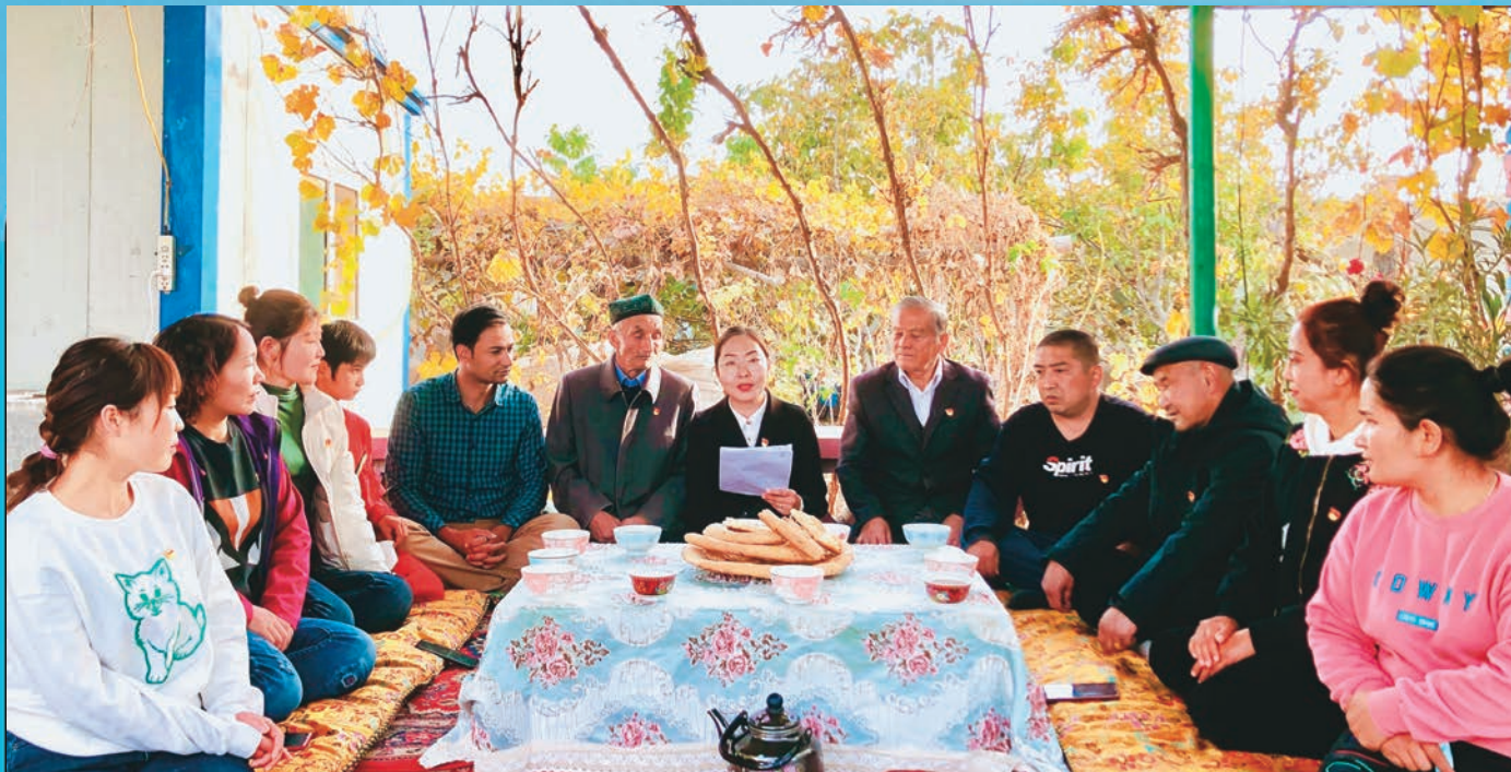
图为新疆和静县党员干部正在给当地群众讲解党的二十大精神。