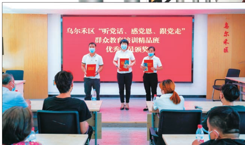
◀克拉玛依市乌尔禾区表彰群众教育优秀学员。