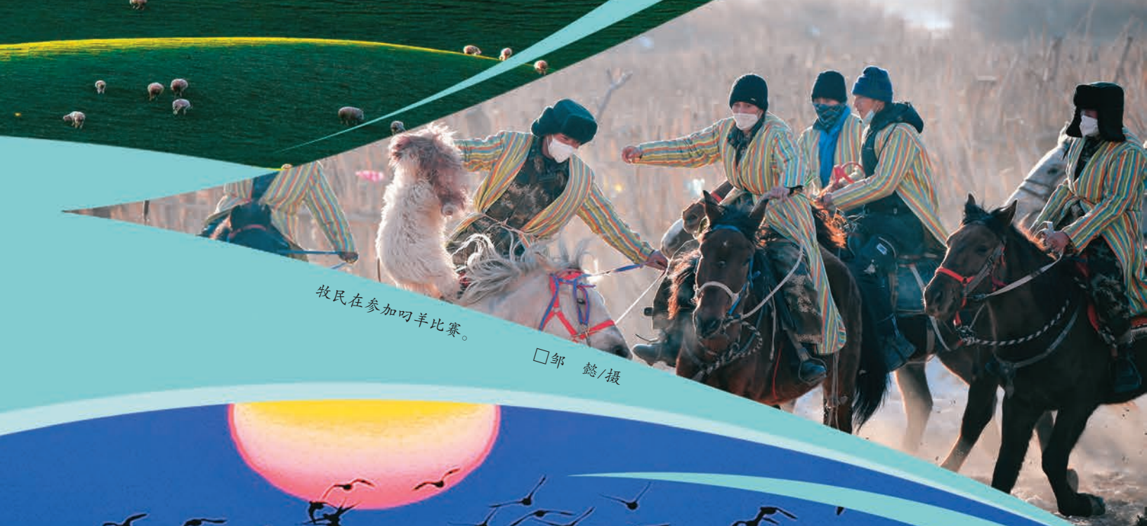
牧民在参加叼羊比赛。