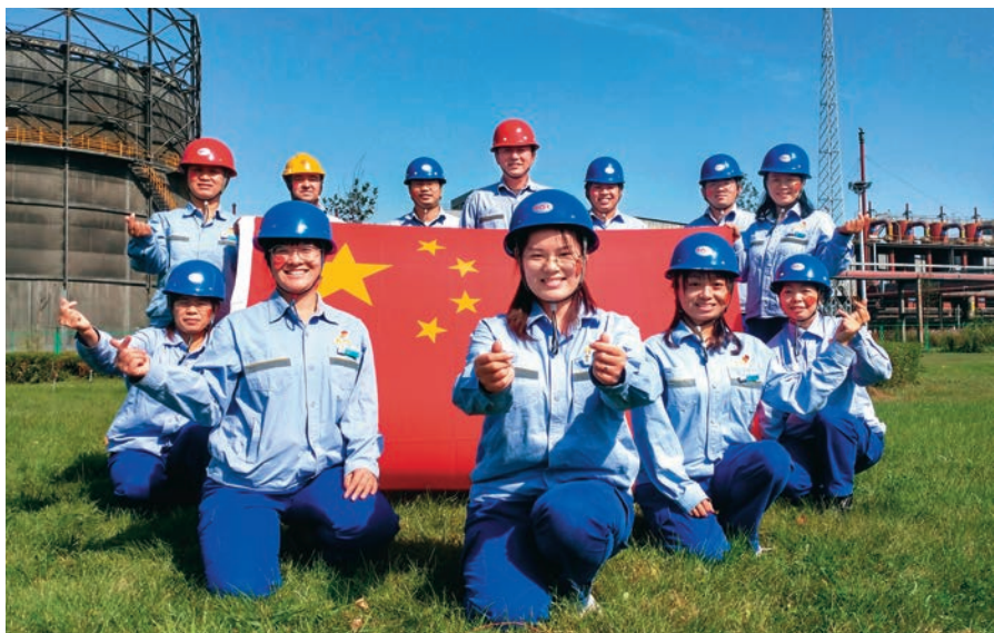
天业集团天能化工有限公司电石厂党支部开展“我爱祖国”活动。

坚持政治引领,不断强化国企员工的政治基础。天业集团党委把加强党的领导与强化员工政治引领、完善公司治理相统一,把党的建设与业务发展相融合,将党建工作要求写入公司章程,明确党组织在公司法人治理结构中的法定地位,