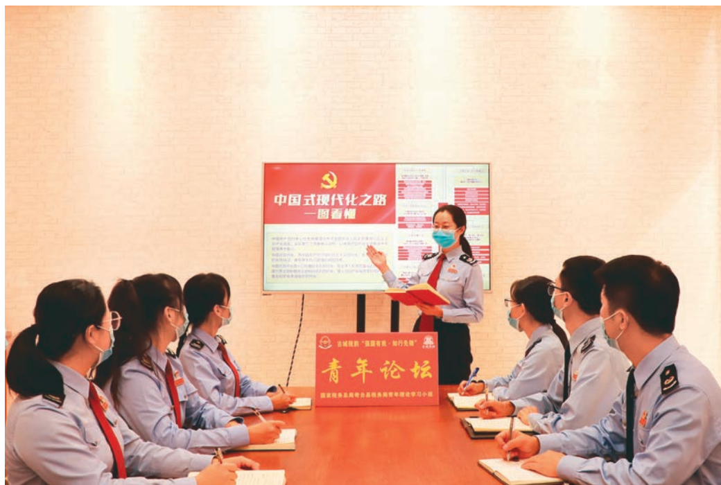
奇台县税务局举办学习贯彻党的二十大精神青年论坛。