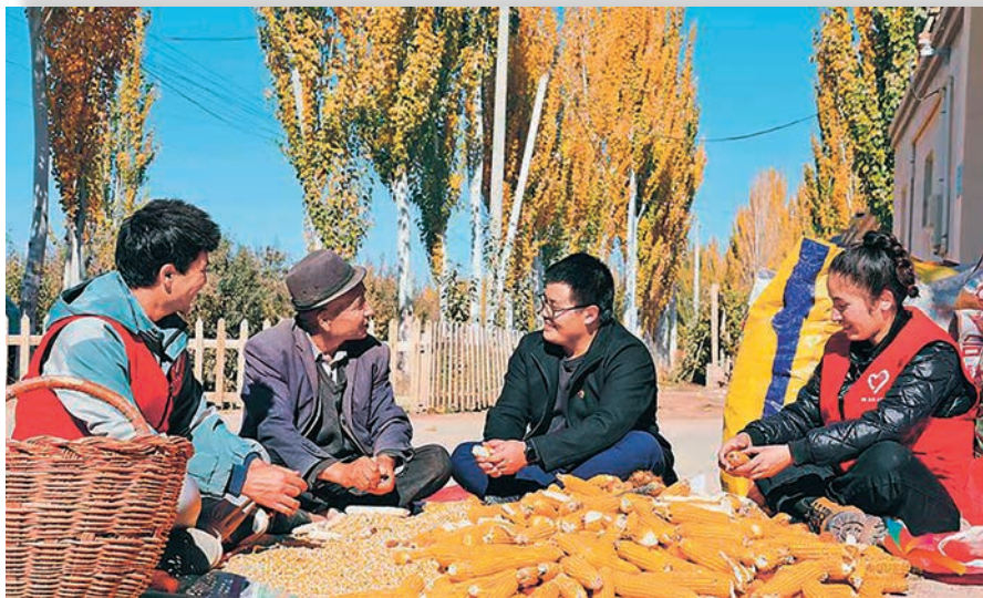
伽师县米夏乡党员干部深入农户了解生产生活情况。

地区着力建强以党组织为核心的严密基层组织体系,以创建依法治理好、凝聚人心好、文明创建好、推动发展好、堡垒作用好的“五个好”标准化规范化党支部,打造政治合格、执行纪律合格、品德合格、发挥作用合格的“四个合格”党员队伍为牵引,实施农村“五强五提升”组织振兴行动、社区“五个优化”服务提质行动、两新组织“三个全覆盖”提质增效行动、党员“三学三亮三比”争当先锋行动,示范引领、以点带面,正向激励、反向监督,整体提