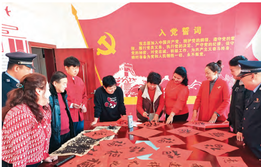
博湖县博湖镇幸福社区党支部组织书法志愿者开展“春联进万家”文艺志愿服务活动。