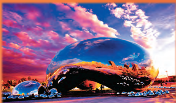
克拉玛依大油泡一号井。