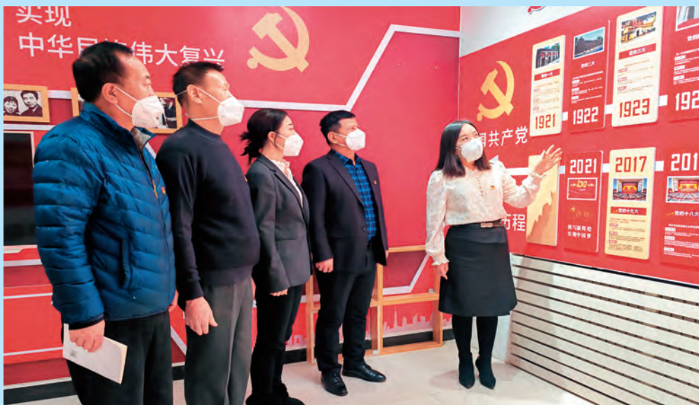
新疆昌吉市北京南路街道金融社区党委开展“重温红色记忆 传承红色精神”主题党日活动，引导党员争先锋、作表率。

振兴示范点等现场教学资源，积极开展互动式、体验式教学，不断在红色教育中锤炼党性修养，提高组工干部政治本领。 (马雅昕)