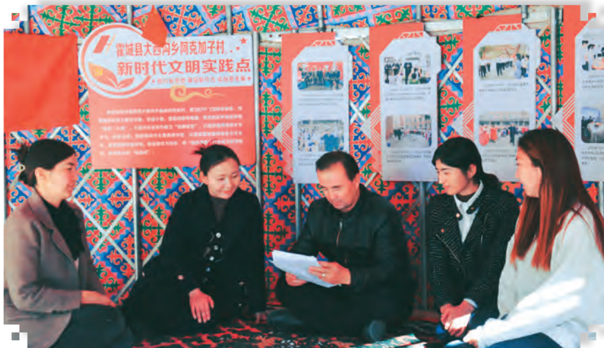
霍城县开展“党的二十大精神进万家”活动。

设,严把政治纪律和政治规矩标尺,制定加强县委领导班子思想政治建设的意见,突出民主集中制建设,严格执行请示报告制度,健全请示报告事项清单,全流程全要素管理监督,严肃查处违背“两个维护”、搞“七个有之”等问题,确保各领域工作严格按照党内法规办事,确保政令畅通、令行禁止。聚焦新时代党的治疆方略常态化开展政治监督和政治督查,加强对领导班子和领导干部的监督,注重动态分析判断,及时发现苗头性倾向性问题,有针对性地加强党员干部党性党纪教育,切实铸牢忠诚之魂,更加自觉地在思想上政治上行动上同以习近平同志为核心的党中央保持高度一致。