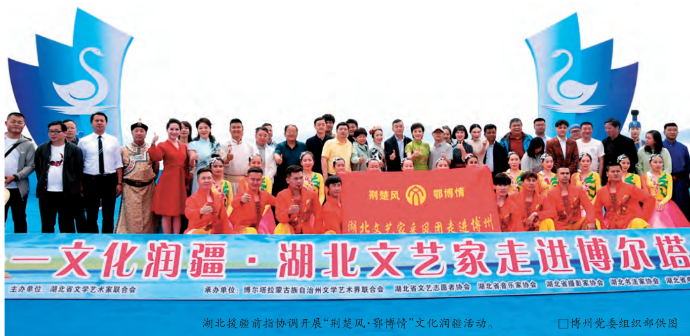
湖北援疆前指协调开展“荆楚风·鄂博情”文化润疆活动。