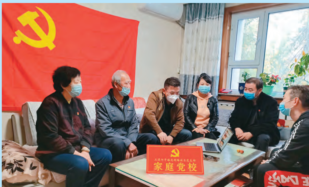
新疆沙湾市纪委监委驻三道河子镇光明路社区“访惠聚”工作队,通过“家庭党校”组织党员深入学习宣传贯彻党的二十大精神。