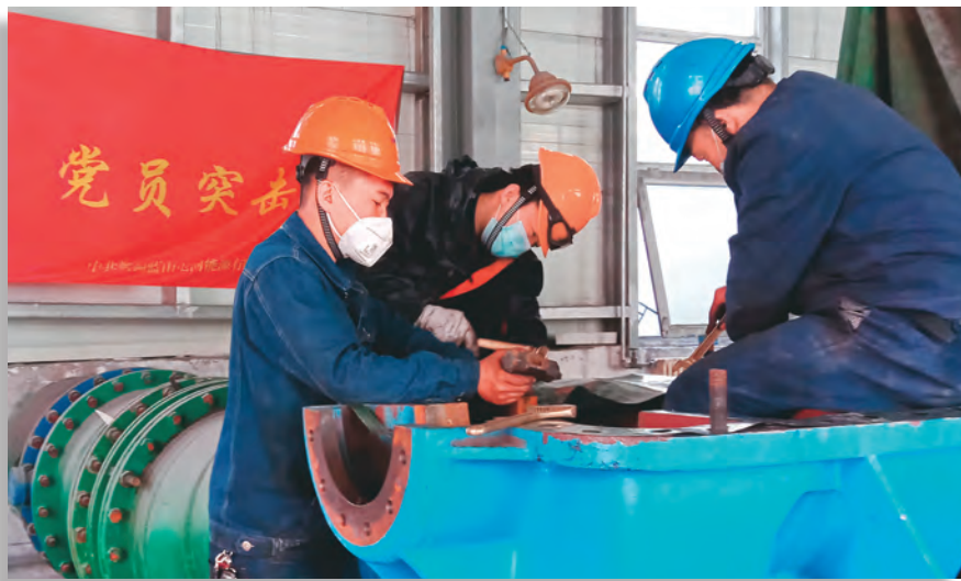
新疆投资发展(集团)有限责任公司所属蓝山屯河能源公司电石厂党支部成立党员突击队,发挥党员先锋模范作用。

习近平总书记指出，“在新时代，我们党领导人民进行伟大社会革命，涵盖领域的广泛性、触及利益格局调整的深刻性、涉及矛盾和问题的尖锐性、突破体制机制障碍的艰巨性、进行伟大斗争形势的复杂性，都是前所未有的。”新投集团党委始终坚持问题导向，聚焦破解发展难题强力推进，形成上下贯