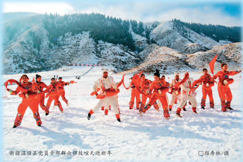
新疆温宿县党员干部群众锣鼓喧天迎新年。

伊宁县委组织部坚持以习近平新时代中国特色社会主义思想为指引,不断健全培训体系,丰富培训内容,加强政治能力训练和政治实践历练,切实提高党员干部政治本领。打造“点单课堂”,结合组工干部学习特性和需求“点单”,将习近平新时代中国特色社会主义思想、党的二十大精神、《中国共产党章程》等作为组工干部教育培训必学篇目,开展专题培训6期,累计培训组工干部1800余人次。打造“网上课堂”,依托共产党员网、学习强国平台、中国组织人事报微信公众号等党员教育信息化平台资源,推送专题学习篇目,组工干部撰写心得、言论文章,参与线上留言、互动,引导组工干部学思践悟、真信笃行。打造“实践课堂”,现场教学促提升。用活用好各类红色教育基地、乡村