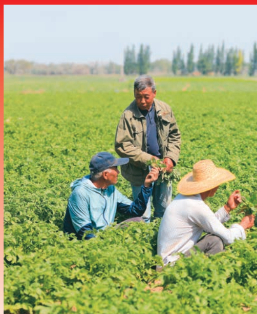
奇台县乡土人才为农户讲解土豆田间管理知识。