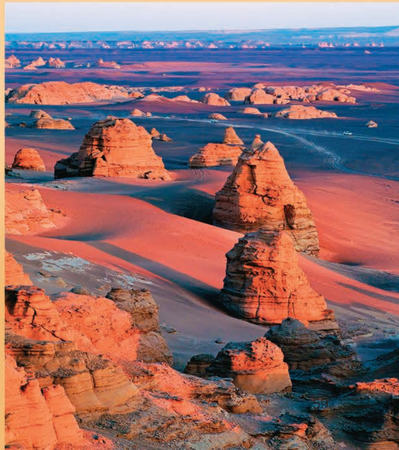
► 夕阳照耀下的雅丹地貌。 □ 闫平/摄