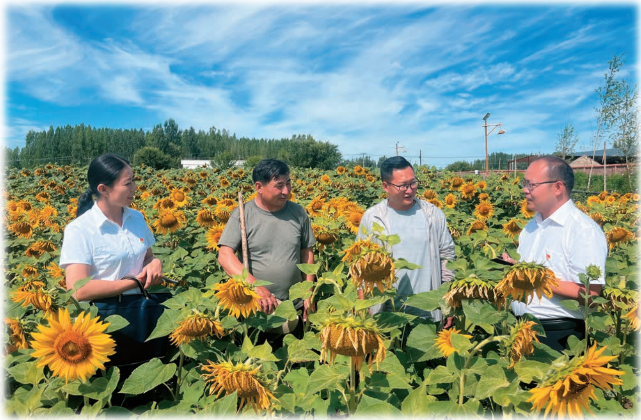
阿勒泰市组织农业科技工作者深入生产一线，实施农村实用人才培养，助力乡村振兴。

系统规划科学施训。合理制定人才培训规划，集中优势资源，坚持“干什么学什么、缺什么补什么”，根据培训主体差异，划分“党的创新理