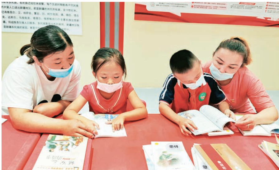
若羌县尤勒滚艾日克村石榴籽服务站开展亲子阅读活动。