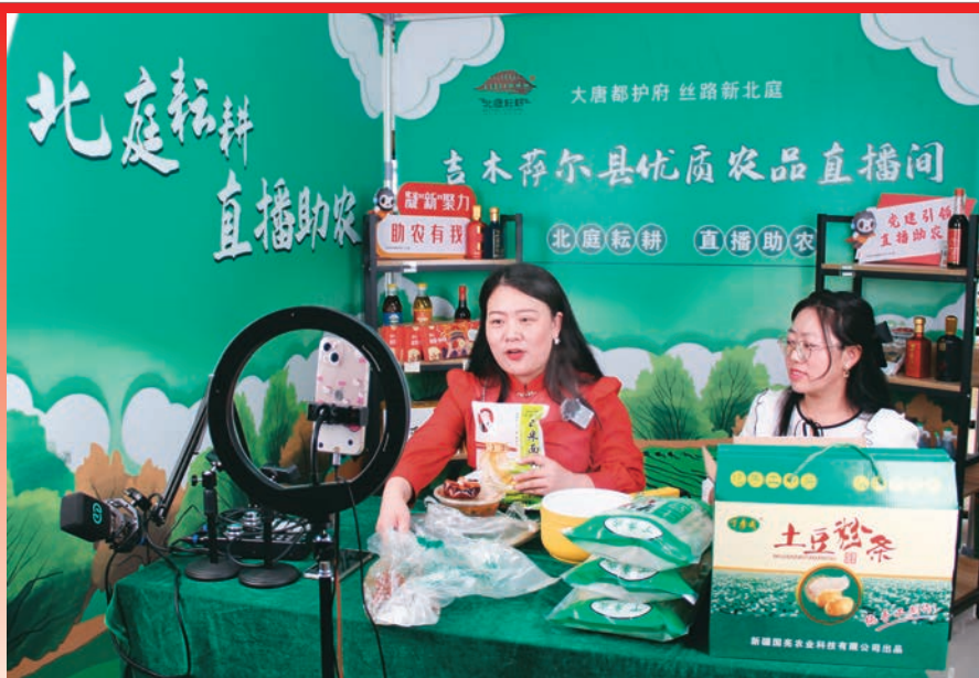
吉木萨尔县乡土人才开展电商销售,帮助农户销售农产品。