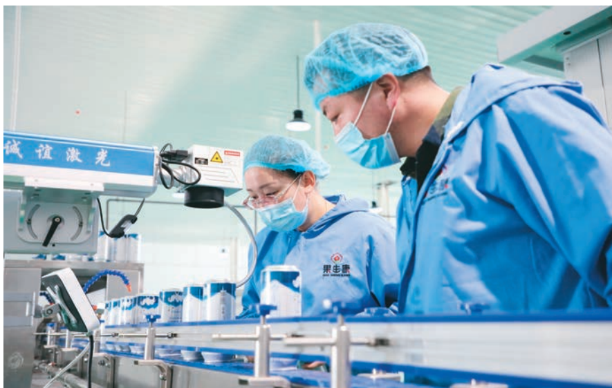
精河县高技能人才在生产一线检查产品质量。