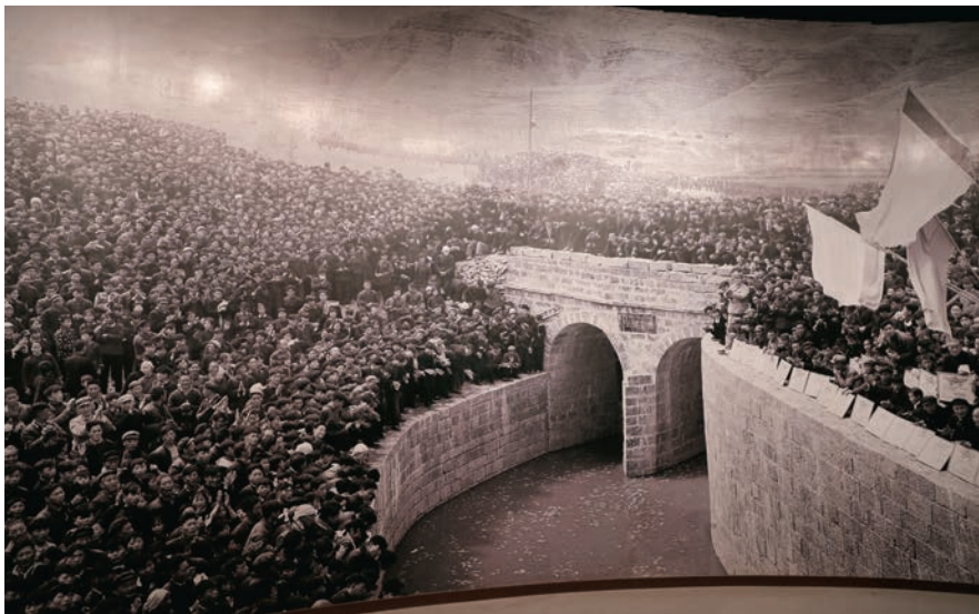
1965年4月5日红旗渠总干渠通水盛况。

练就本领勇担当。“世界上的事情都是干出来的,不干,半点马克思主义都没有。”红旗渠精神是我们的革命先辈付出鲜血乃至生命换来的。生逢盛世,在阔步迈进新时代的重要关口,正是我们大有可为、大有作为的伟大机遇。广大党员干部