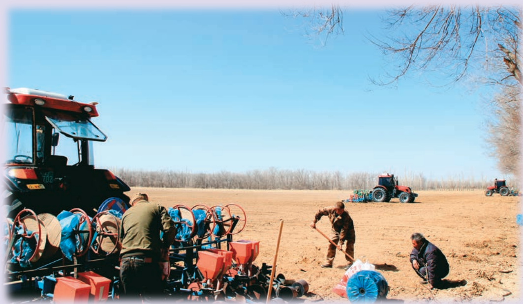
新疆裕民县哈拉布拉乡南哈拉布拉村村民开展春耕生产。