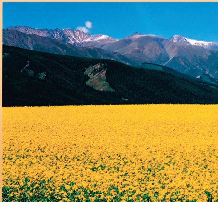
▲东天山脚下金色的花海。