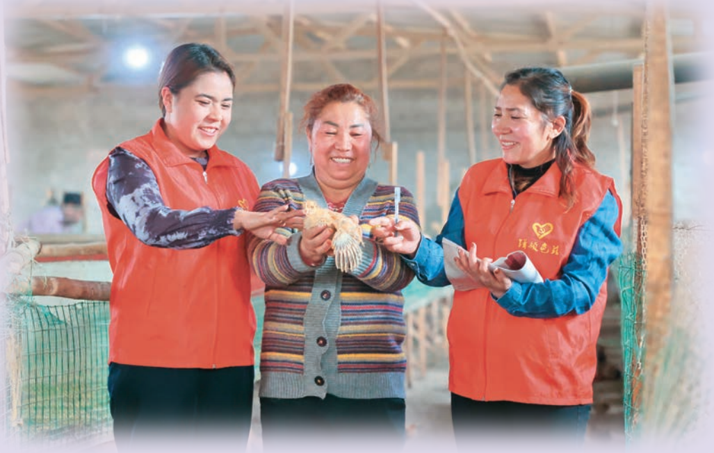
新疆库车市党员干部向雏鸡养殖专业合作社负责人了解雏鸡外销情况。