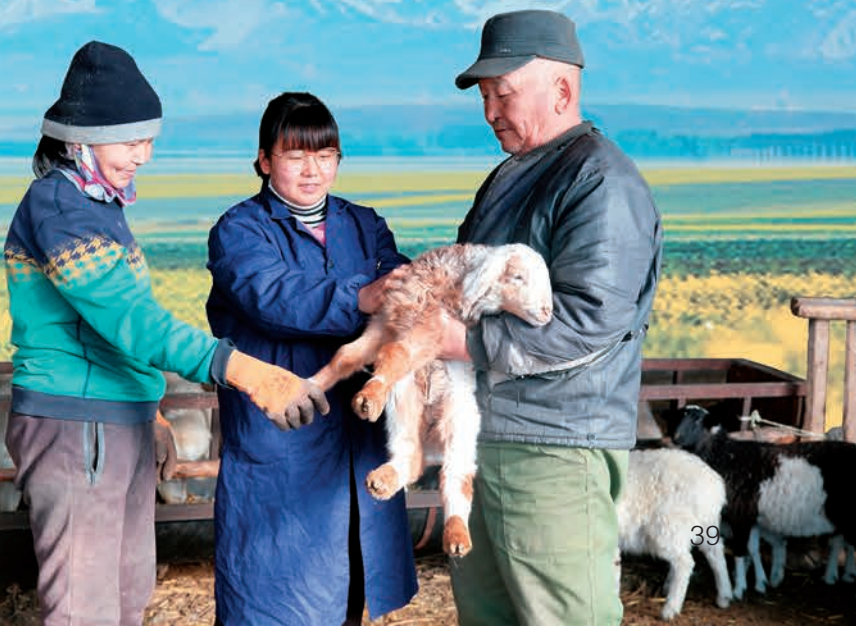
▼博湖县引进新疆农业大学研究生为牧民传授畜牧养殖技术。