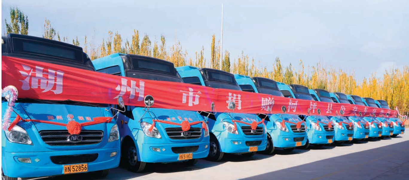
湖州市捐赠柯坪县公交车交接仪式。

浙江企业落户阿克苏。丽水市组织举办“尽‘丽’所能、创‘新’美好”新和特色产业招商引资推介会、“处州十县好新和一浙商丽商走进新和专题招商推介会”,累计招商引资签约资金13.3亿元。着力发展壮大本土特色产业。针对乡村产业发展乏力、基础薄弱等问题,通过优化基础产业、壮大特色产业、挖掘新兴产业等方式,整合畜牧业、林果业、旅游业等优势资源,以村集体经济组织为载体,串联生态、生活、生产三大