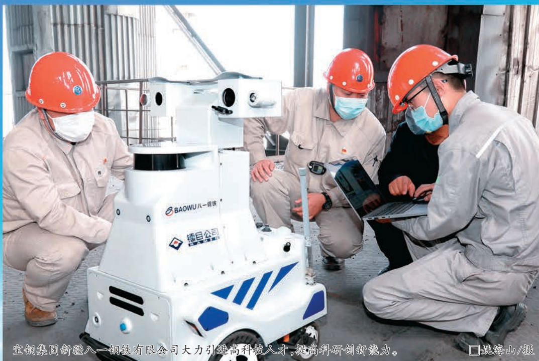
宝钢集团新疆八一钢铁有限公司大力引进高科技人才,提高科研创新能力。