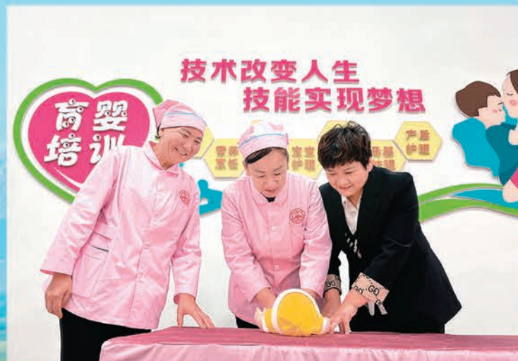
▲温泉县采取校企合作、工学结合等方式,加强农牧民职业技能培训。