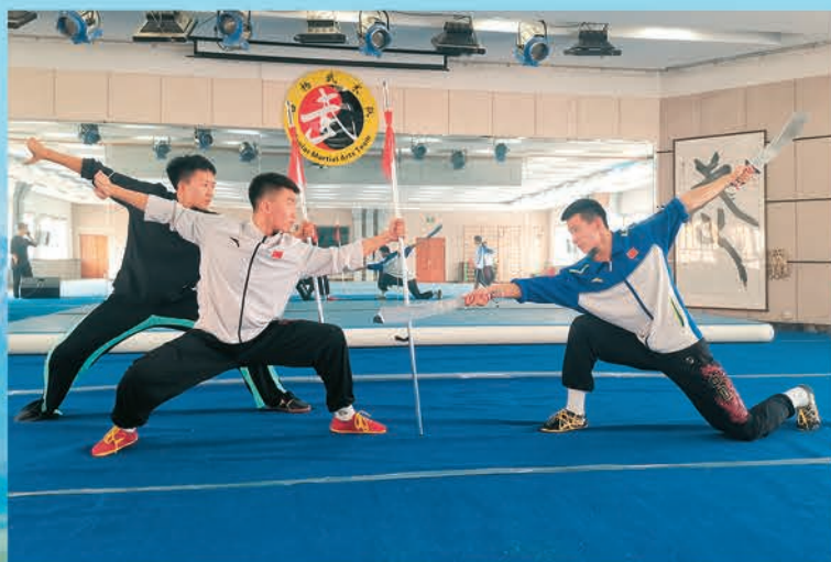
▲乌鲁木齐市实验学校特色办学打造人才成长摇篮,图为白杨武术队队员在进行武术训练。

创新是第一动力,人才是第一资源。新疆紧紧围绕推进经济社会高质量发展的人才需求,创新机制育才引才用才,破藩篱、改机制,聚人才、兴事业,激励各类人才在新疆扎根奋斗、各展其能,各类人才的创新创造活力在天山南北竞相迸发、聪明才智充分涌流,共同为建设美好新疆献智。