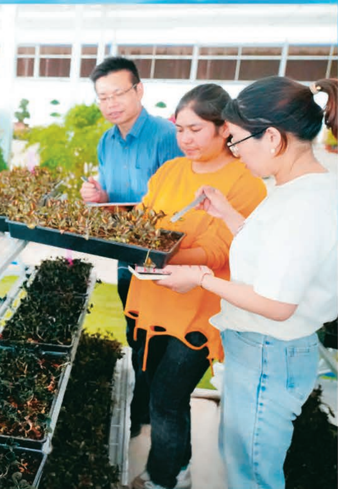
▲在温宿国家农业科技园区金华特色经济种植基地，金华市农科院指导农技人才引进金线莲、藏红花等名贵药材试种成功。