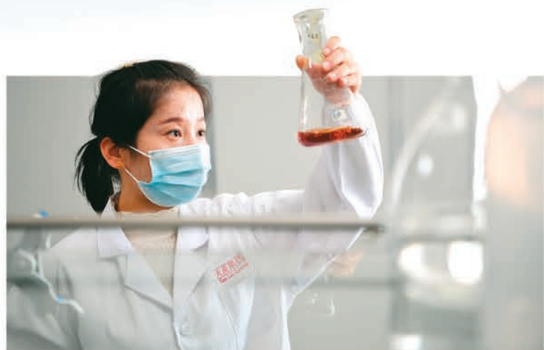
▲新疆天莱牧业集团有限责任公司坚持科技强企，图为技术人员在检测饲料的营养指标。 □汤永/摄