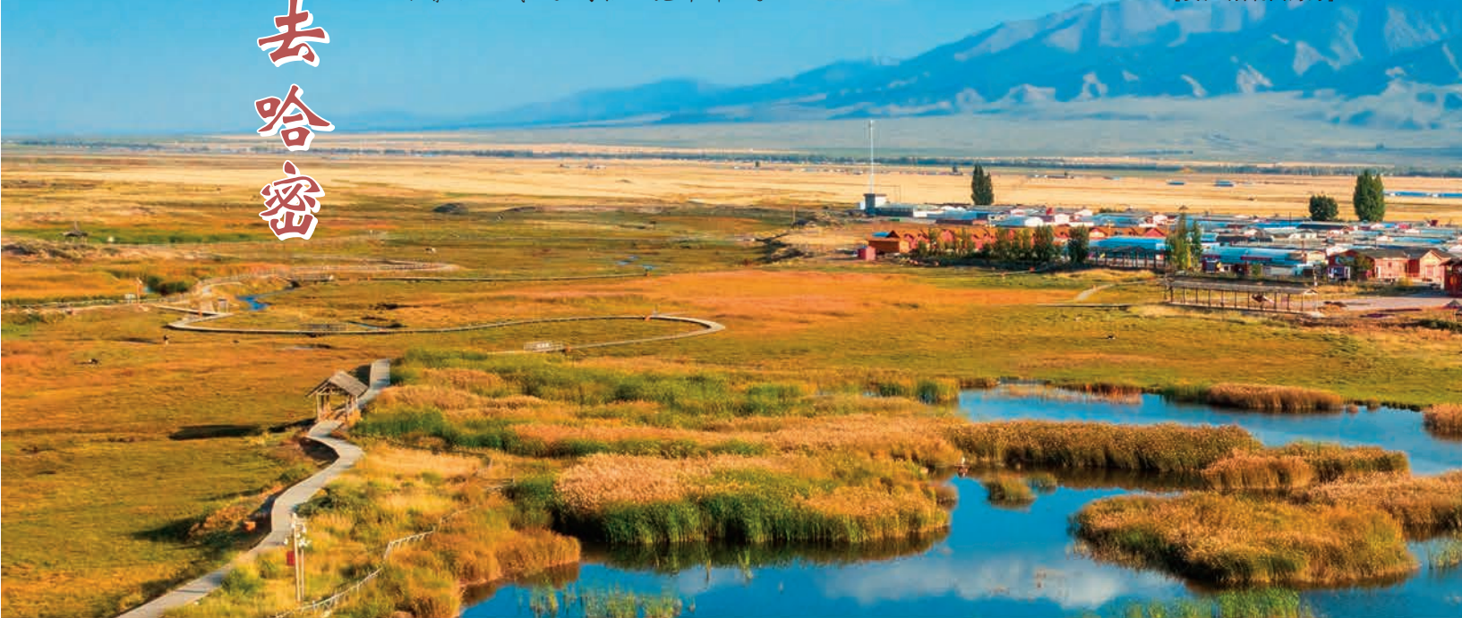
▲巴里坤县高家湖湿地。