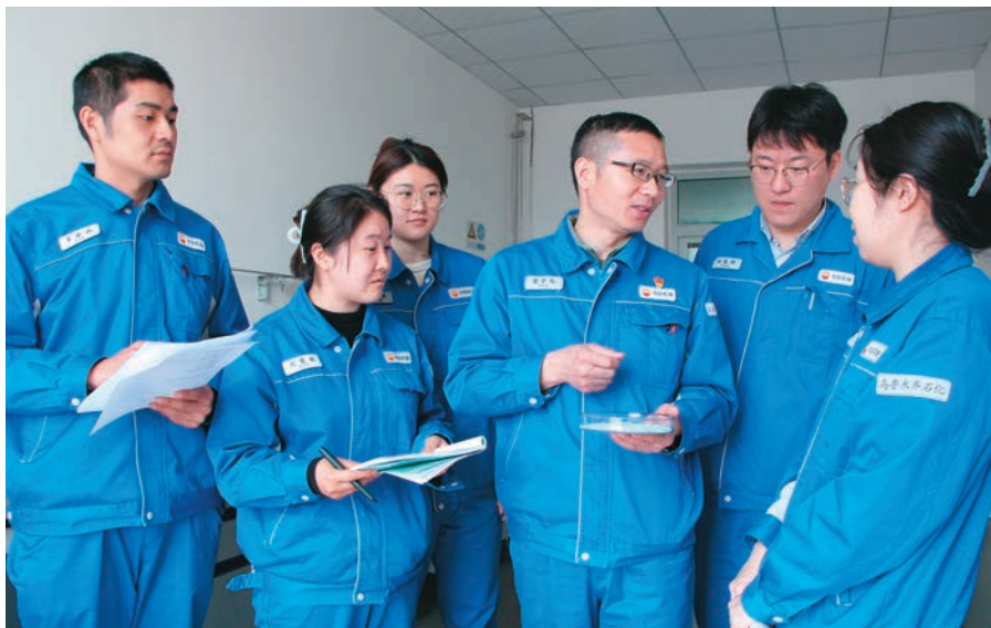
乌鲁木齐石化公司研究院科研人员探讨试验结果。

高度重视大学生引进工作,前置服务触角,主动与国内石油院校和地方重点院校对接,广泛开展校园招聘宣讲,通过公众号推送、院校网推介、高校就业平台发布招聘信息等方式为招聘铺路架桥。在相关专业院系设置“引才联络站”,与毕业生进行“点对点”沟通,了解毕业生就业意向,根据学生需求“靶向”开展职业介绍、政策推介,以政策引人、