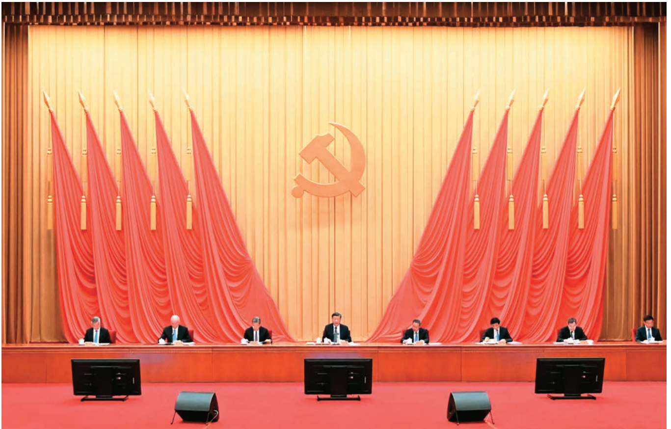
4月3日,学习贯彻习近平新时代中国特色社会主义思想主题教育工作会议在北京召开。中共中央总书记、国家主席、中央军委主席习近平出席会议并发表重要讲话。李强、赵乐际、王沪宁、蔡奇、丁薛祥、李希、韩正出席会议。