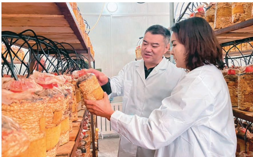
博州科技特派员在新疆金桑湾生物科技有限公司传授桑黄菌培育技术。

博州统筹农技、医疗、教育等人才资源,实施“三项行动”,引导人才向基层一线流动,有效缓解基层人才紧缺问题。实施农技人才助农行动。制定农技人才认定管理办法,以个人申报、组织推荐、专家评审的方式,重点围绕种植能手、民间名医、戏曲传承人、农田水利工匠等人群开展农技人才认定工作;聚焦产