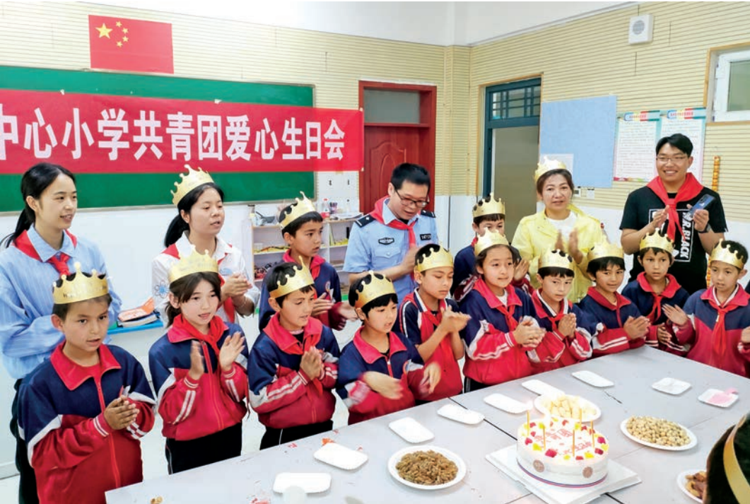
乌什县阿克托海乡派出所民警与乡中心小学开展共建活动。