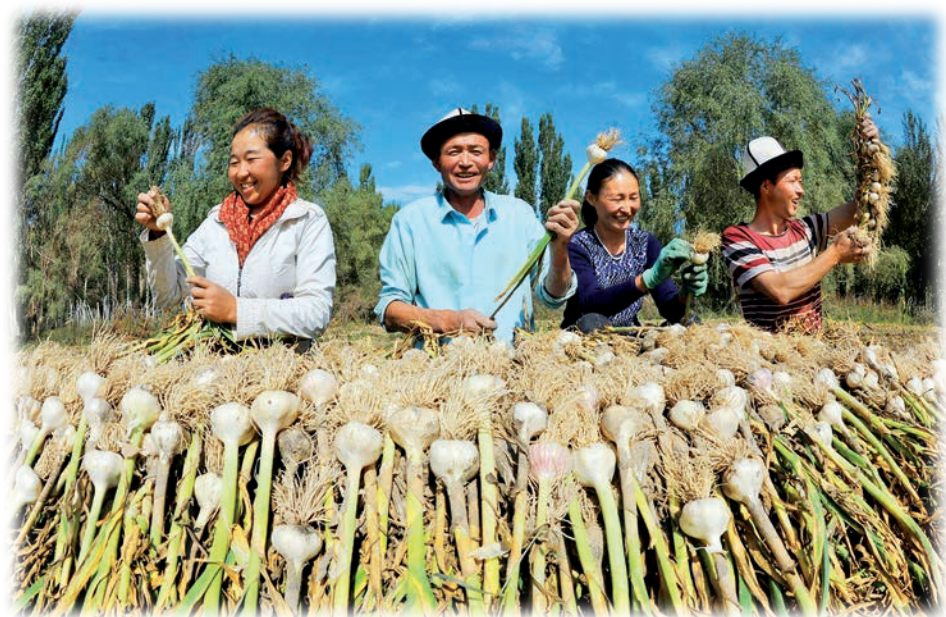
阿合奇县苏木塔什乡大力发展特色种植业。