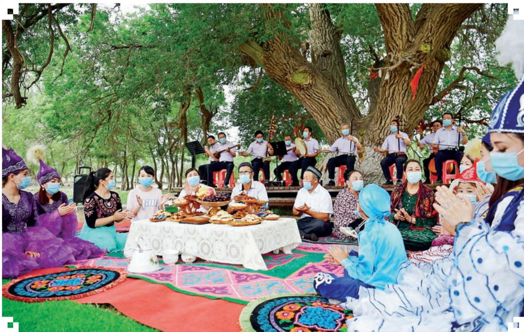
乌鲁木齐经济技术开发区(头屯河区)两河街道马庄子村“访惠聚”工作队队员、村干部和各族村民欢聚一堂,共话新时代新生活。

近年来,新疆乌鲁木齐市认真贯彻落实习近平总书记关于乡村振兴的重要指示精神,深入学习贯彻自治区党委农村工作会议精神,坚持和加强党对农村工作的全面领导,把党的建设贯穿乡村振兴工作全过程,推动资源向乡村汇集,为全面推进乡村振兴提供坚强保证。