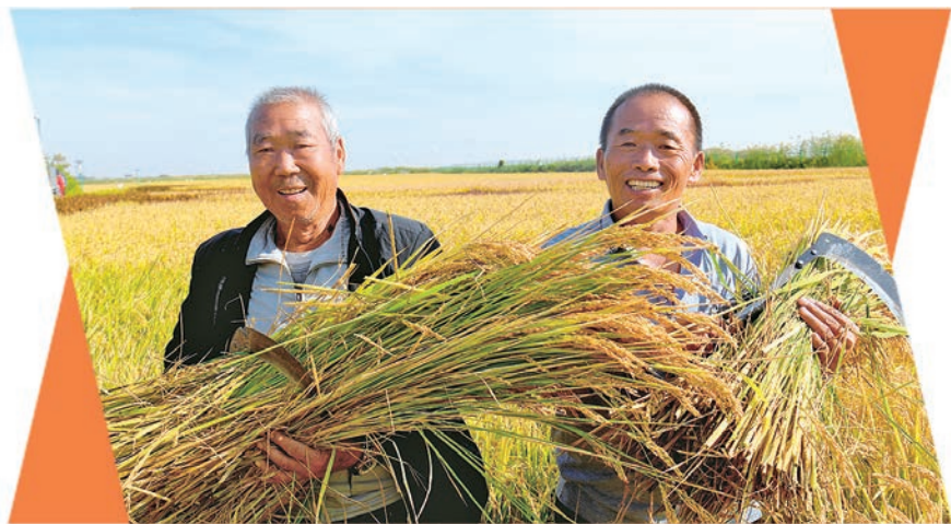
乌鲁木齐市米东区水稻科技示范园水稻喜获丰收。