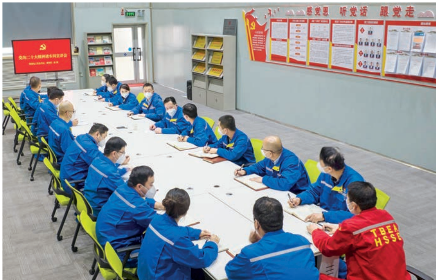
特变电工党委组织党员认真学习党的二十大精神。