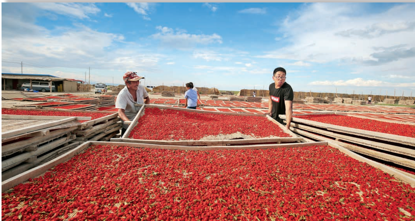
精河县枸杞种植户晾晒枸杞。