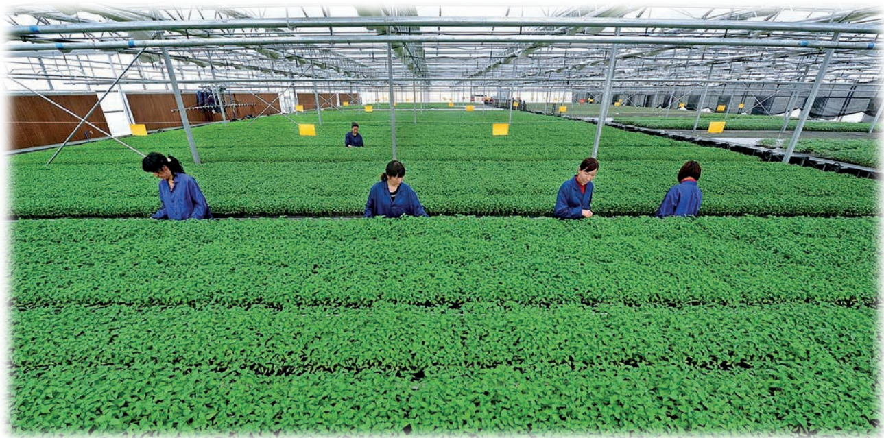
乌恰县育苗基地绿意盎然。