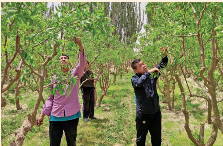
自治区科学技术协会驻民丰县安迪尔乡夏央村“访惠聚”工作队队员帮助村民修剪枣树。