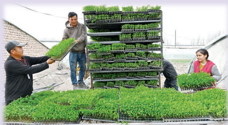
新疆巴音郭楞蒙古自治州充分利用现代农业科技提高农业生产效率。