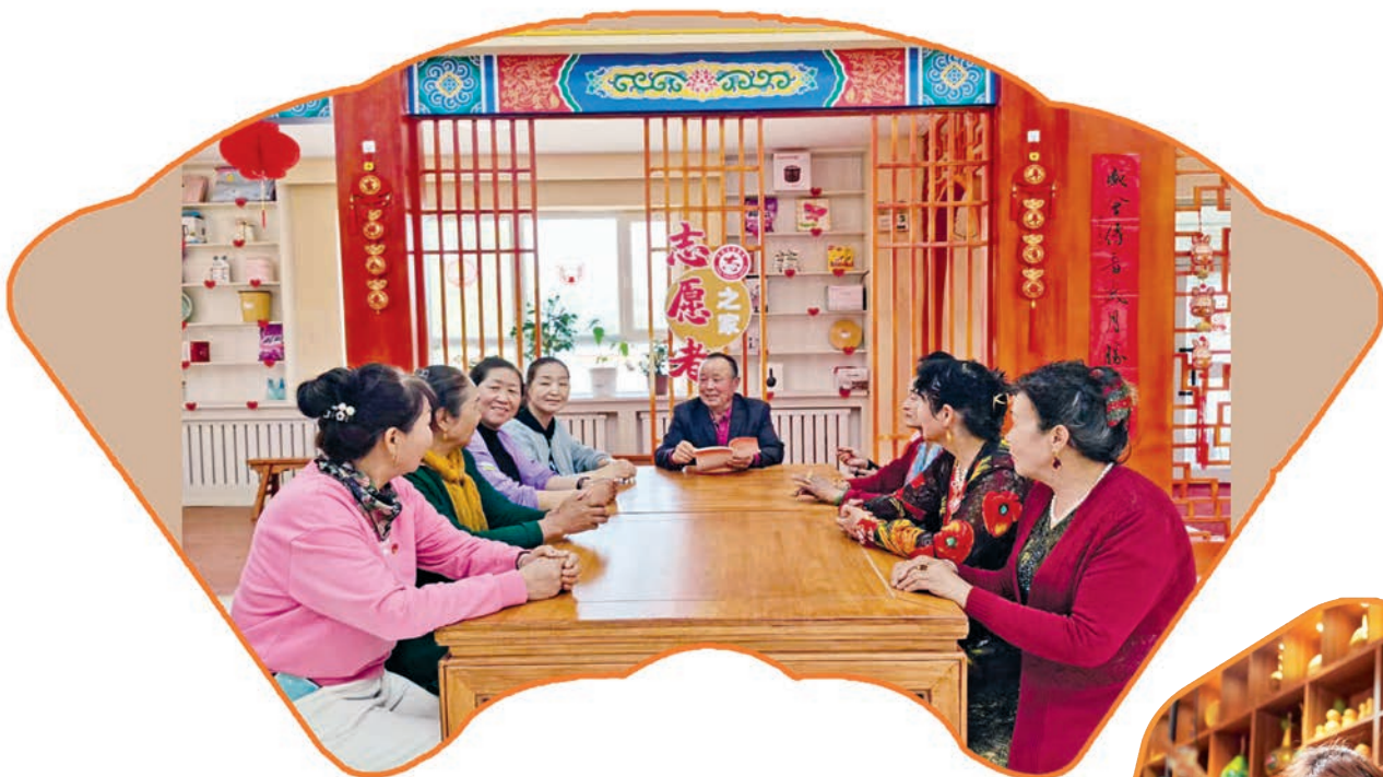
▲哈密市伊州区二堡镇“石榴籽”服务队向村民讲述民族团结故事。