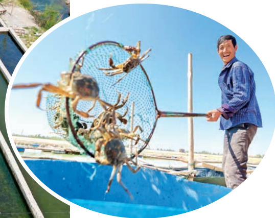
阿克苏地区大力发展特色水产养殖业促乡村振兴。