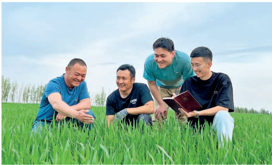
下阿西尔村党员干部指导农户进行田间管理。