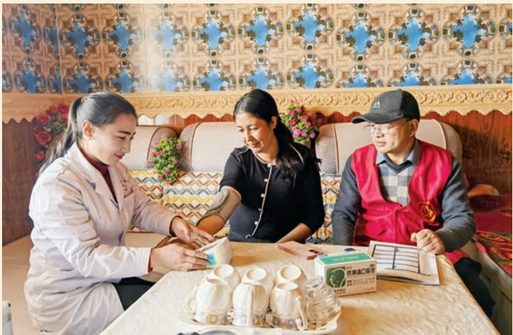
和田地区卫生健康委员会驻策勒县恰哈乡干吉萨依村“访惠聚”工作队开展为民服务免费义诊活动。