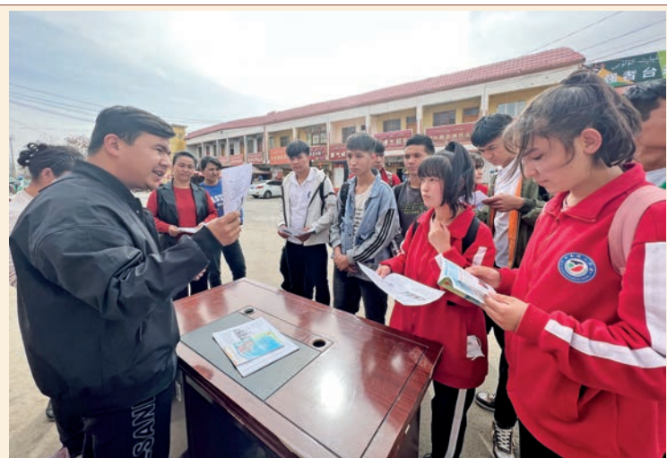
中国邮政集团有限公司和田地区分公司驻于田县科克亚乡科克亚村“访惠聚”工作队组织开展法治宣讲。