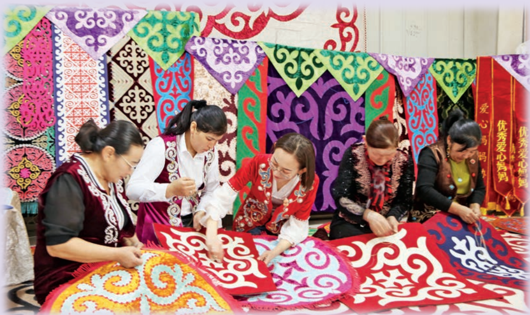
新疆裕民县积极培育哈萨克族刺绣传统非遗文化产业。