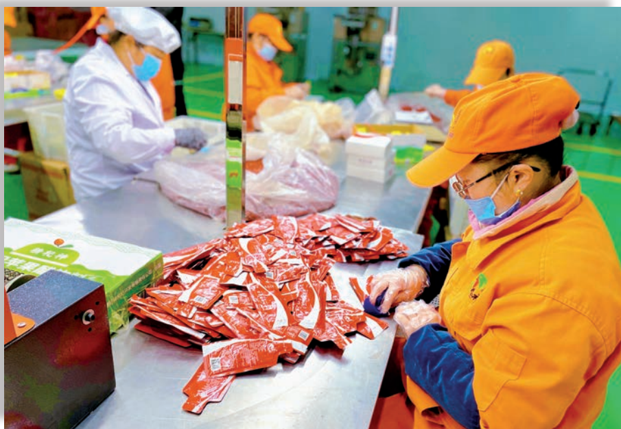
新疆精杞神枸杞开发有限公司的工人在加工枸杞产品。