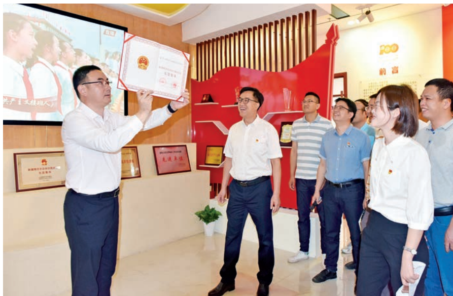
福建省援疆前指举行“福建援疆馆”开馆仪式。