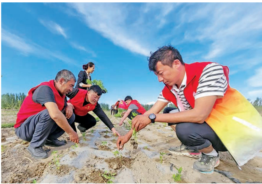
新和县渭干乡渭干买里村党员志愿服务队帮助村民移栽辣椒苗。

坚持以党建为引领,针对本地产业采取相应措施,不断激活新动能,推动乡村产业转型升级,特色产业提质增效。改造提升传统产业。采取“党支部+专业合作社+种植养殖基地+农户”和“产业联合、资源联通、效益联享”等模式,调整产业种植养殖结构,优化促进优势主导产业。突出“人有我精、人精我新”,在传统产业创新上下功夫,对现有产业通过改良品种品质、拓宽销售渠道、健全售后服务等方式,提升传统产业竞争力。大力实施传统产业延链、补链、升链、强链,汇集链上研发、销售、运输、储藏等相关要素,推动产业链、供应链和价值链高度融合。培育壮大特色产业。探索“一乡一特、一村一品”产业发展模式,开展引进水产养殖、热带水果种植、反季节蔬菜培育等特色种养业提升行动,通过股权投资、订单采购等方