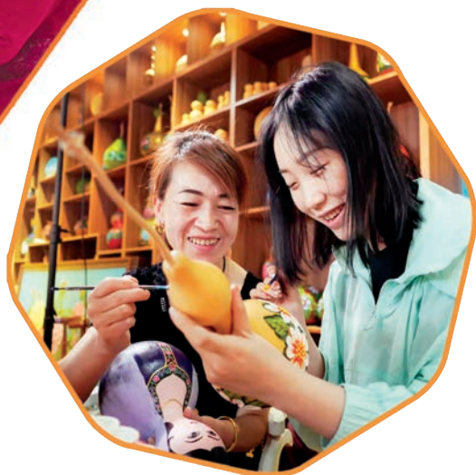
▶哈密市委网信办“访惠聚”驻村工作队员与“亲戚”一起绘制葫芦画。