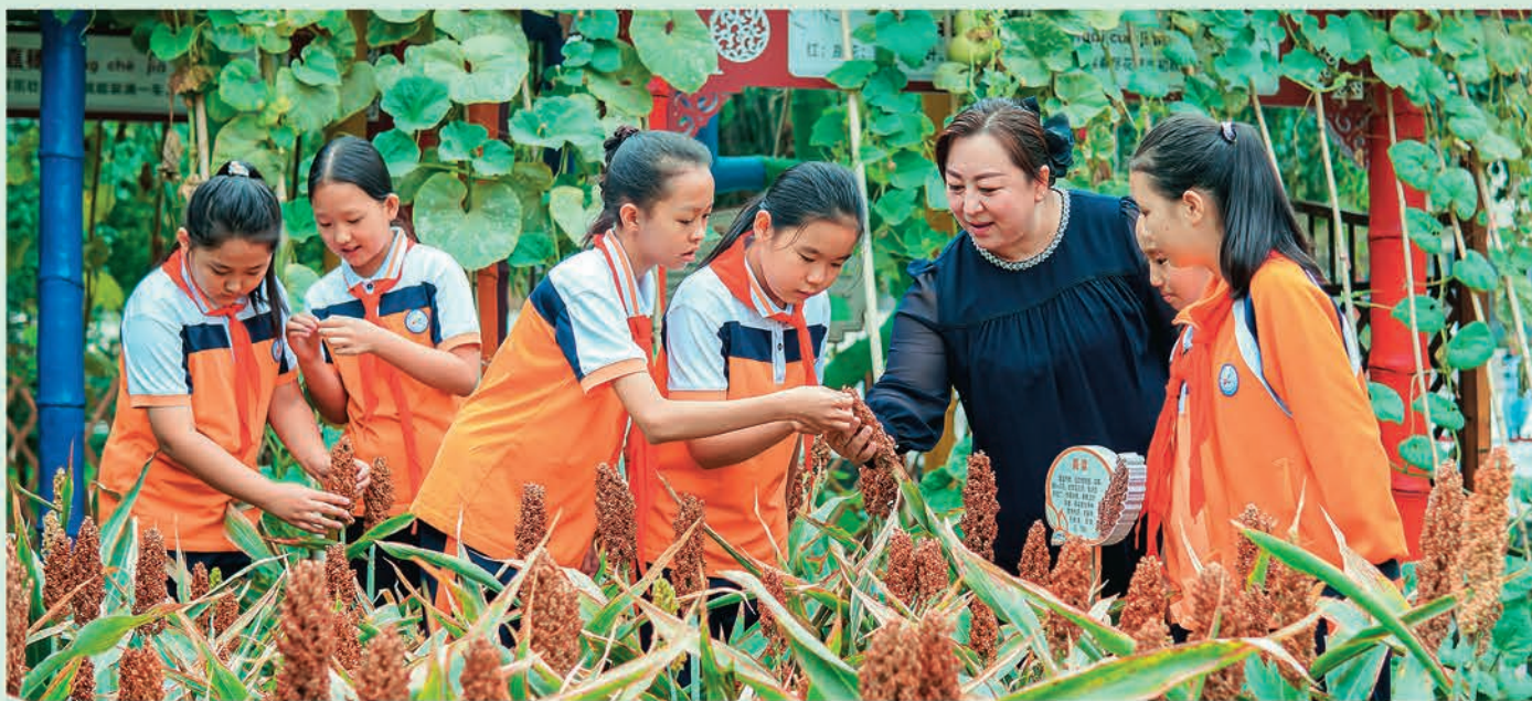
▲昌吉市第一小学学生们在老师的带领下开展劳动教育实践活动。