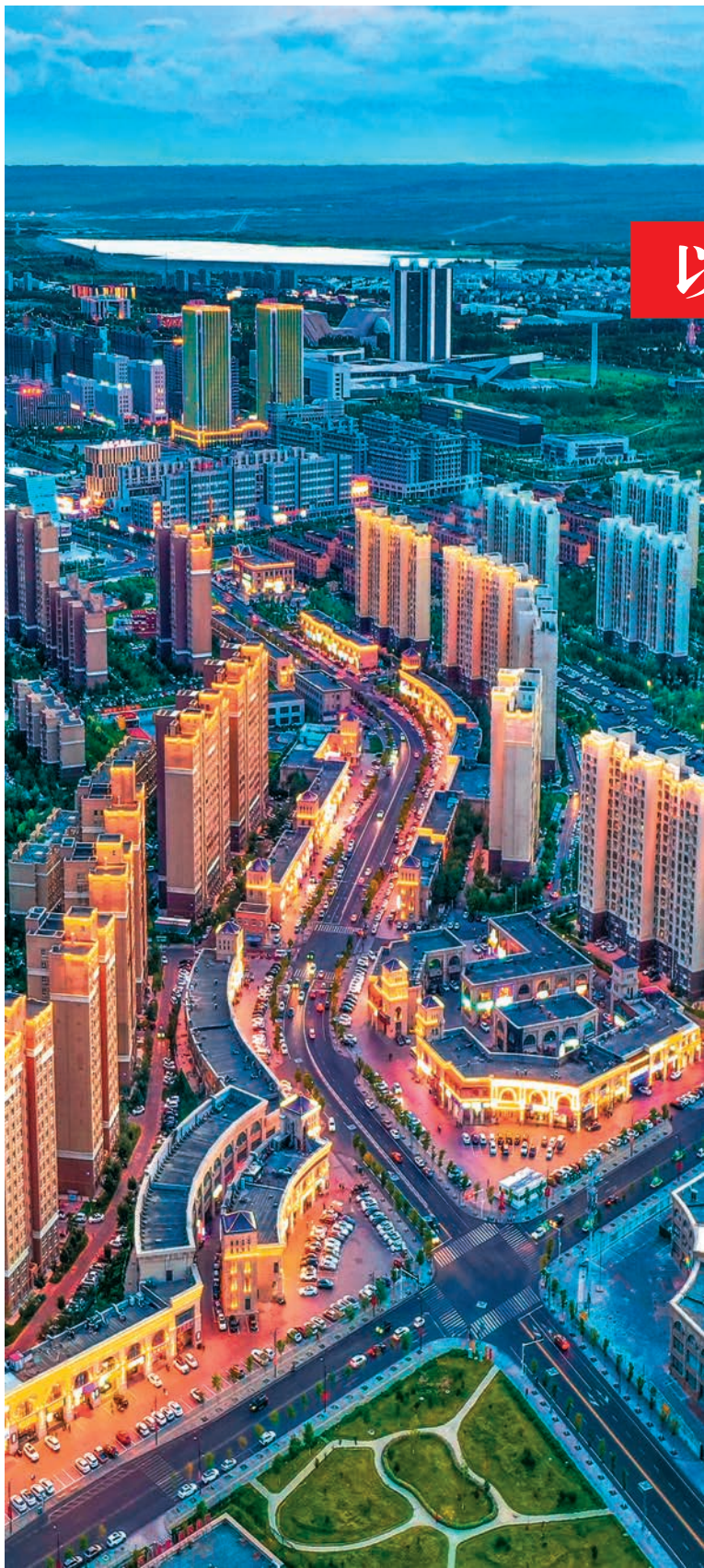
克拉玛依市倾力打造“时尚之都·越夜越美”夜间经济品牌。