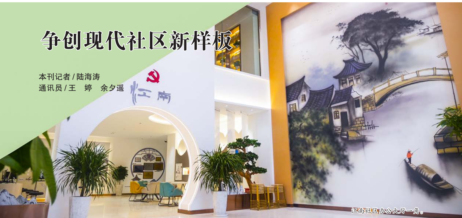
江南社区办公大厅一角。

新疆伊宁市上海路街道江南社区党总支深入贯彻落实党的二十大精神,全面提升基层治理能力,精细化做好服务群众工作,打造让党放心,让群众满意的高品质社区。2022年,被评为伊犁州“先进基层党组织”。