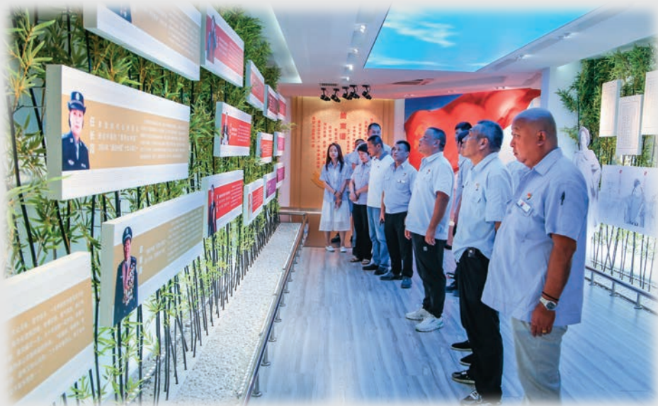
新疆乌鲁木齐水业集团排水公司党支部组织党员开展党风廉政教育,学案例、观看英模展。

坚持走在前、学在先,结合实际抓贯彻,确保全区组织工作会议精神落地落细。将学习贯彻全区组织工作会议精神作为各级党委党组学习“第一内容”、党员干部学习“第一任务”,精选学习内容,制定学习计划,通过书记讲学、部门比学、支部研学、培训辅学等方式,坚持原汁原味学,推动党员干部先学一步、学深一层。整合共产党员网、昆仑网等学习资源,推送涵盖理论课堂、视频课堂、音频课堂的“云课堂”,依托“阿勒泰市零距离”微信公众号平台,组织100余名领导干部围绕学习党的创新理论、工作重点落实推进等撰写言论文章并广泛推送,共享学习成果。深化“书记讲党课”活动,围绕自治区组织工作会议精神,“线下”广泛开讲、“线上”集中展播推广,引导基层党组织书记、党员干部走上讲台、交流经验、互学互鉴,解决实际问题,全市各级党组织讲党课300余场次,覆盖党员群众1万余人。(沈盛强)