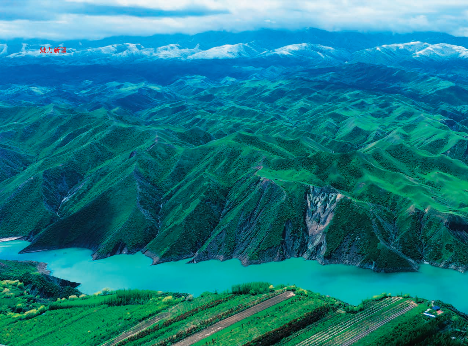
▲玛纳斯县肯斯瓦特水库。