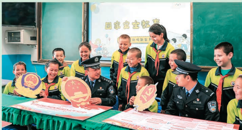
◀富蕴县吐尔洪乡中心小学开展国家安全教育宣讲,增强师生爱国意识。