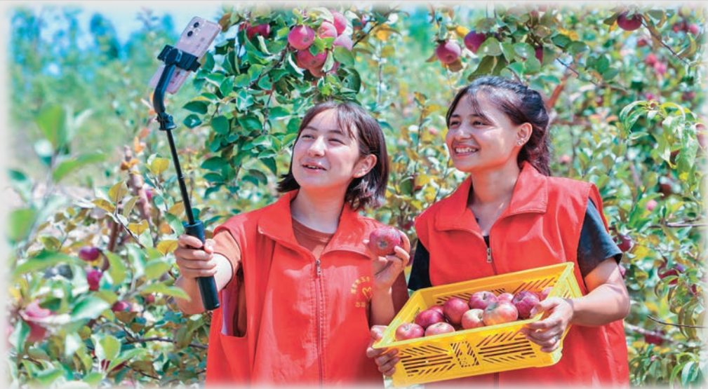
新疆库车市委组织部干部帮助果农通过网络直播推销苹果。