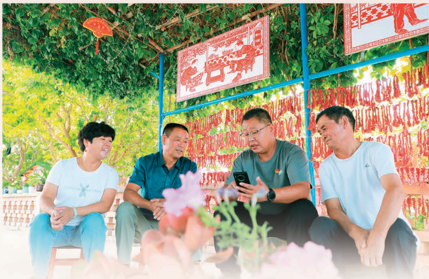
和硕县新塔热乡党委推进干部包村联户工作,打好群众基础,夯实基层根基。