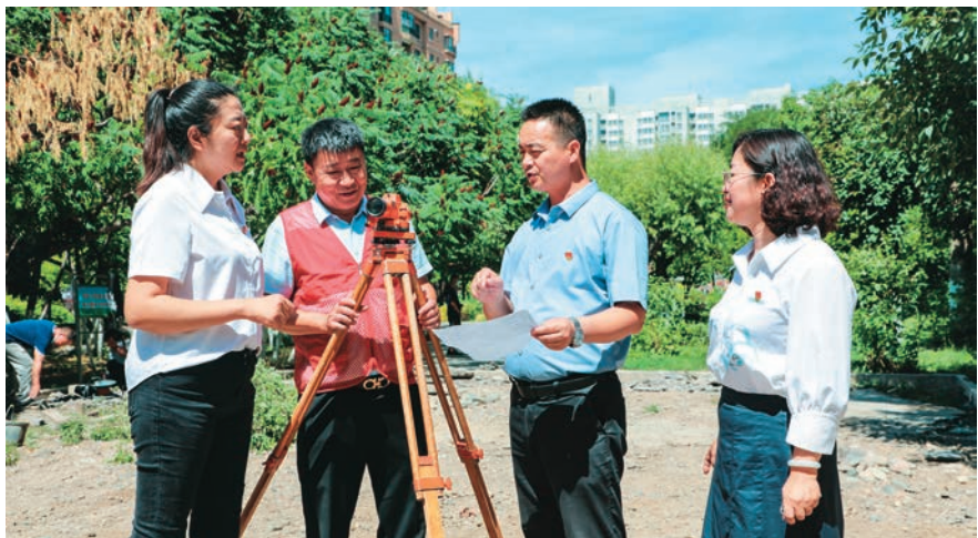
江南社区党支部牵头物业、业委会整治小区环境。