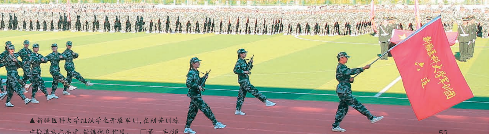
▲新疆医科大学组织学生开展军训,在刻苦训练中锻炼意志品质、锤炼优良作风。