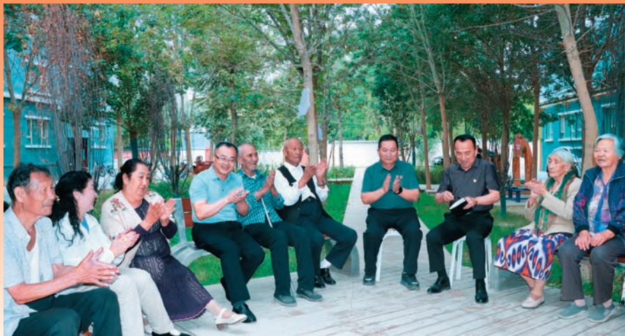
在若羌县若羌镇胜利社区政协委员联络站，政协委员深入群众收集社情民意。