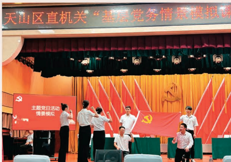
乌鲁木齐市天山区委直属机关工委开展“基层党务情景模拟”岗位练兵活动。