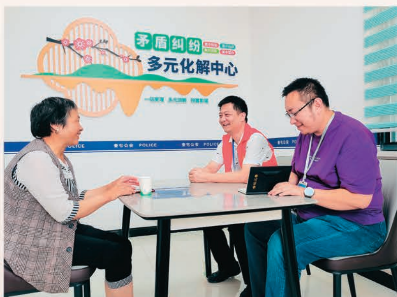
奎屯市乌鲁木齐东路街道东虹苑社区党支部坚持和发展新时代“枫桥经验”,及时化解各类矛盾。