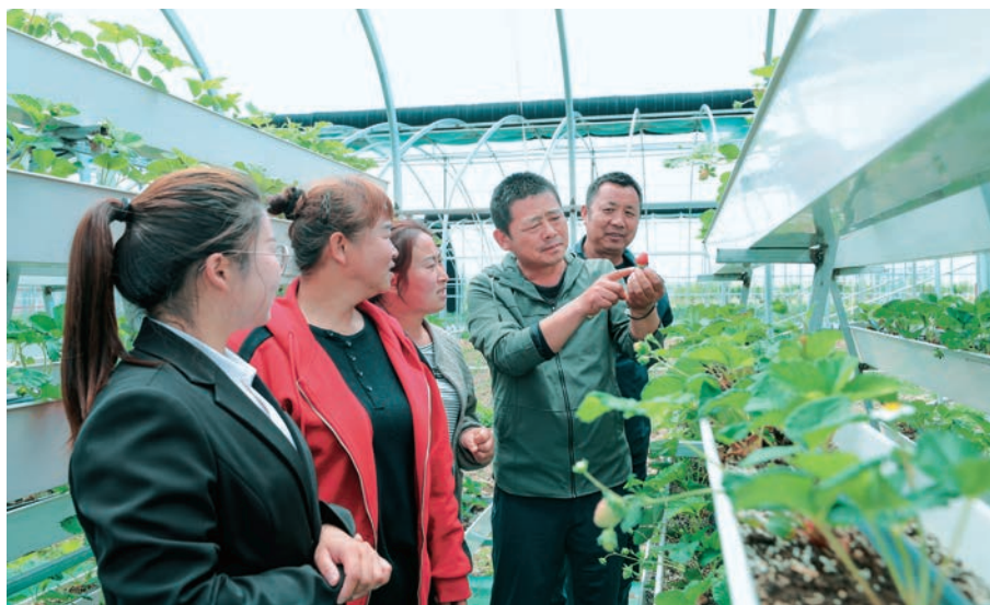
温泉县邀请种植专家讲解立体栽培技术,帮助企业解决技术“瓶颈”问题。

以两新组织需求为导向,打破固有服务模式,积极探索服务新方法、新路径,实现“零距离”服务。助企纾困解难,各级两新工委组建“服务团”,每月27日作为固定走访联系日,深入两新组织帮助建强组织、排忧解难;实施两新工委派单机制,严格落实走访摸排、收集汇总、梳理派单、及时办理、反馈回访闭环程序,通过实地走访、电话回访等方