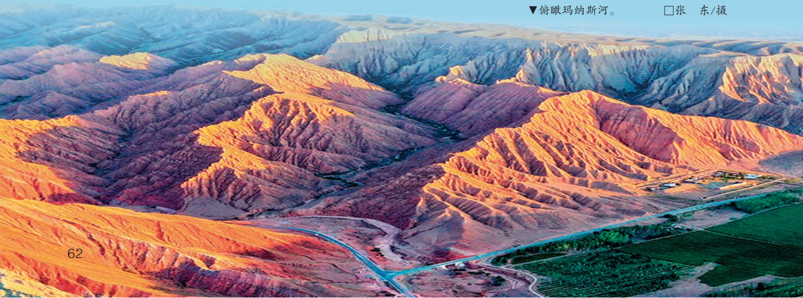
▼俯瞰玛纳斯河。 □张 东/摄