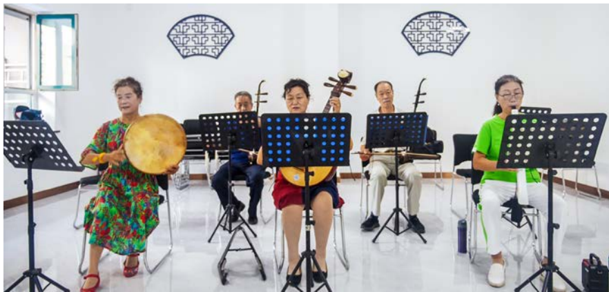
老人正在江南声韵厅弹奏民乐。