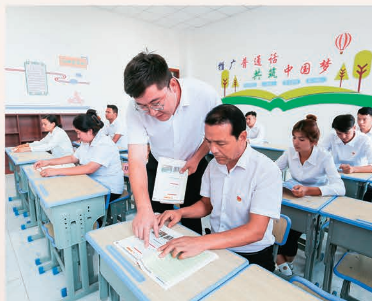
自治区文化和旅游厅驻阿瓦提县英艾日克镇苏盖提艾日克村工作队以“课堂教学+技能实操”相结合的方式,提高村民国家通用语言文字水平。