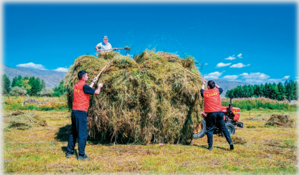
新疆青河县党员志愿者帮助农牧民收割牲畜越冬草料。

坚持“百名书记讲党建”业务大比拼活动,全面提升党务工作者能力水平,促进基层党建工作提质增效。择优选取乡(镇)、街道(片区)和两新组织分管党务的党(工)委副书记、党组织书记180名,坚持“确定主题、对照认领、开展宣讲、综合评价”原则,每月推选一名讲评人,面向本行业领域全体党务工作者讲党建。在乡(镇),每月组织分管党务的副书记和村党组织书记,利用“三会一课”、主题党日活动,采取现场观摩会、推进会等方式,向党务工作者传知识、理思路、讲方法,提升党务工作者履职能力。在街道(片区),采取知识竞赛比理论素质、现场观摩比工作技能、情景模拟比工作规范、幻灯片展示比工作亮点、个人演讲比综合能力等方式,促进各社区党组织书记之间互学互鉴、共同提高。在两新组织,坚持按需施教,依托“党建大讲堂”,采取专题辅导、案例分析、交流研讨等方式,推动“经验共享、问题共商、素质共提”,提升基层党建工作质效。(谢强)