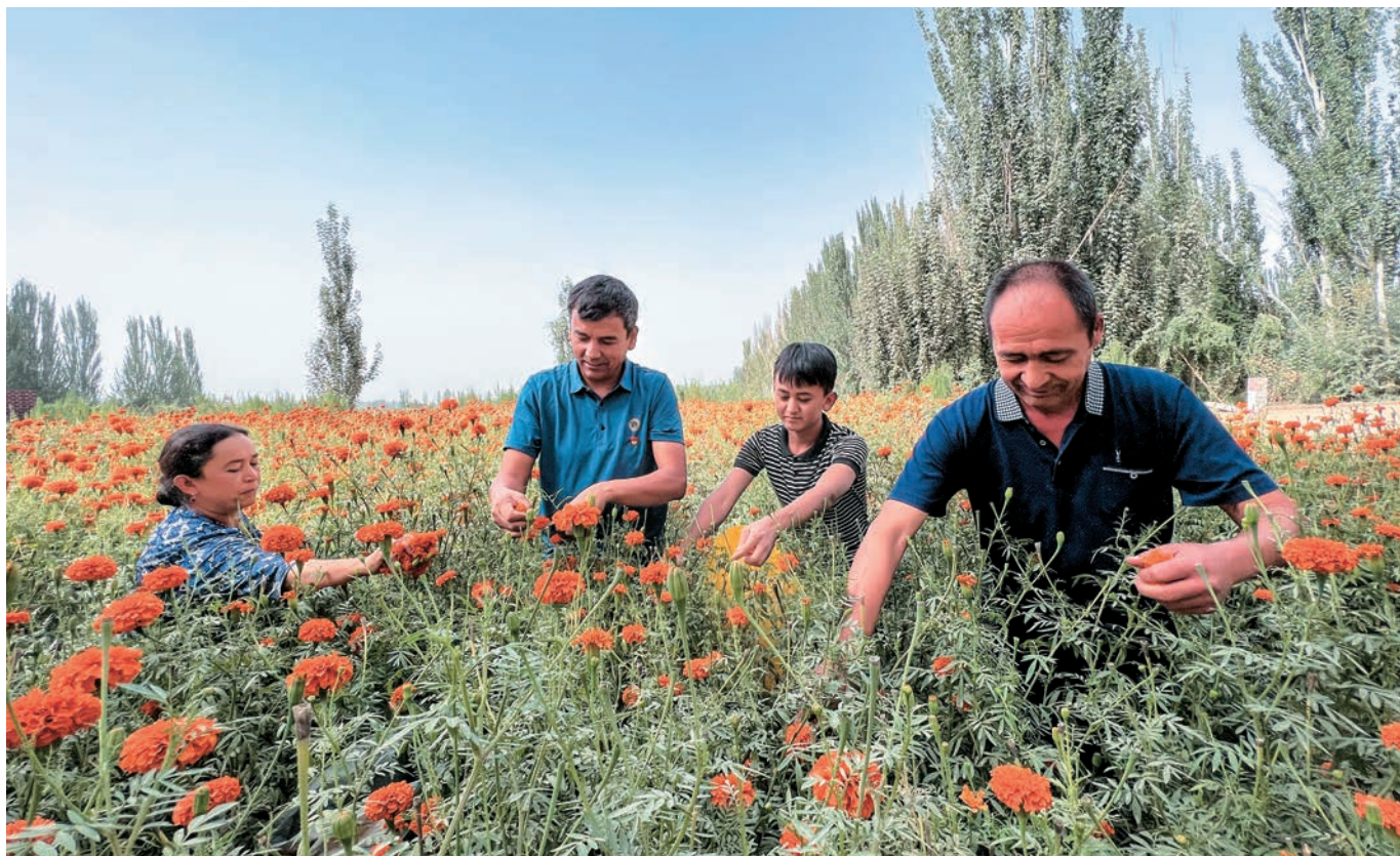
于田县英巴格乡托什坎塔合塔村党员帮助农民采摘万寿菊。