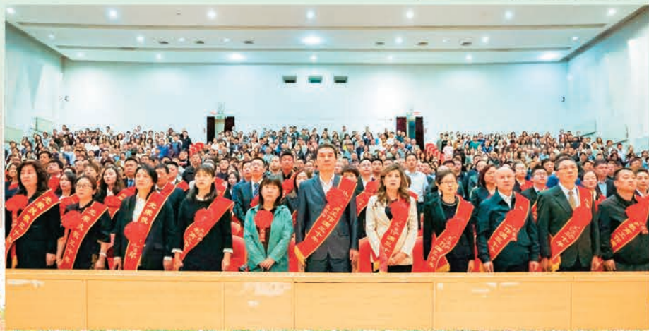
◀新疆大学隆重举行2023年教师节庆祝暨表彰大会,表彰在教书育人各项工作中取得突出成绩的集体和个人。