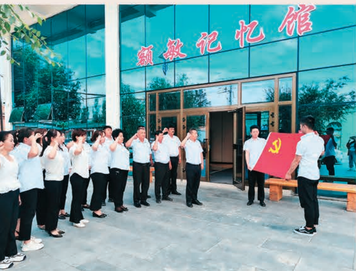
额敏县水利局机关党支部组织党员干部到额敏县记忆馆开展主题党日活动。