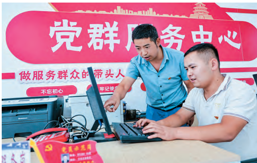
库车市乌尊镇英吐尔村驻村干部(右)为村后备力量讲解党建知识。 □吴乐/摄

完善组织体系。 坚持大抓基层鲜明导向,健全基层党组织体系,形成党的全面领导工作机制,推进组织体系和工作力量直达基层末梢。加强组织领导。建立健全“年初安排部署、年中督促落实、年底验收考验”闭环工作机制,推动乡(镇)党委、村党组织全面领导辖区各类组织和各项工作,村党组织每年听取村民委员会、村务监督委员会、村级集体经济组织、群团组织和和其他经济组织、社会组织的工作汇报,确保党组织始终总览全局、协调各方。延伸组织触角。健全“行政村党组织+村民小组党小组(党支部)+党员联系(中心)户”基本架构,完善“党群服务中心、维稳综治中心、农村发展中心”运行模式,统筹整合配置村级各类组织和人员,形成以村两委为主导的管理运行体系,有效凝聚工作合力。增强组织功能。深入实施基层党组织晋位升级,分阶段、分层次推进村(社区)党组织“五个好”(依法治理好、凝聚人心好、文明创建好、推动发展好、