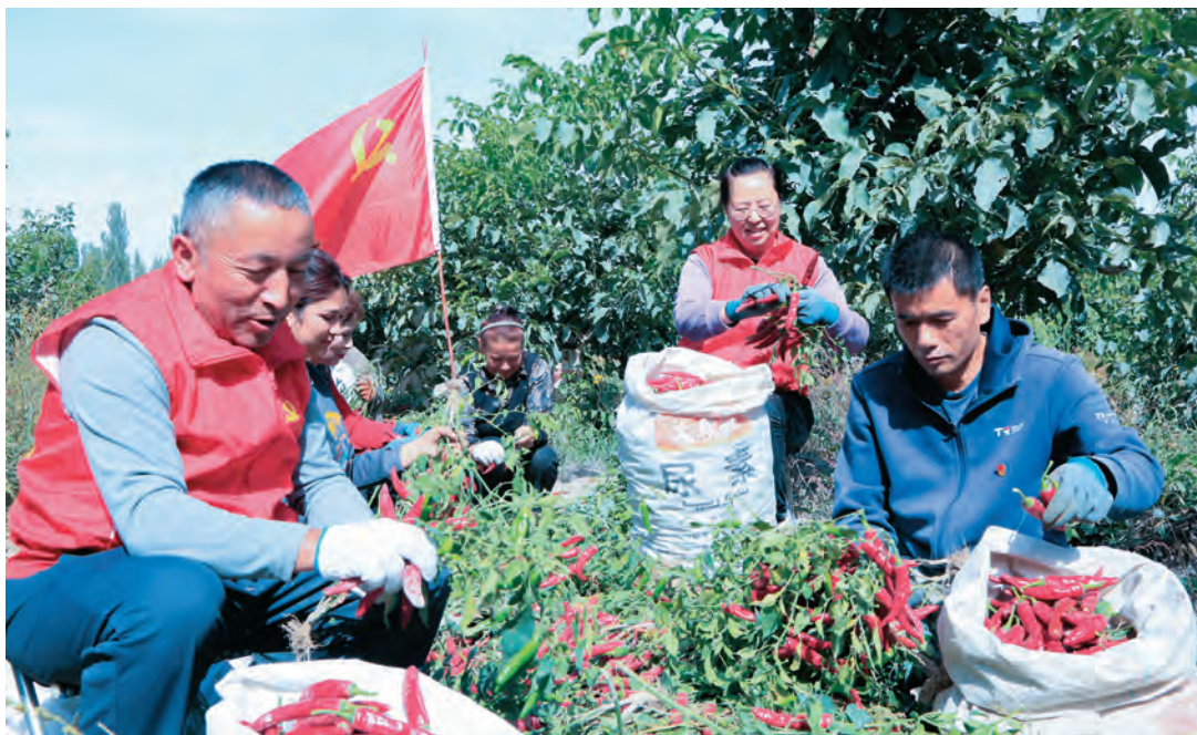
乌什县阿克托海乡麦盖提村“两委”组织党员帮助村民采摘辣椒。