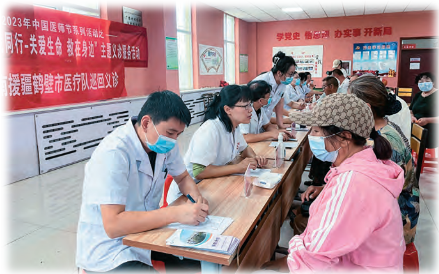
河南省鹤壁市援疆医疗队与哈密市伊州区人民医院组成志愿服务医疗队,走村入户开展急救知识宣讲及健康义诊活动。

强化互动培养。 发挥河南医疗资源和技术优势,坚持请进来帮带、走出去培养,不断强化受援地医疗人才技术能力培养提升。坚持全覆盖培训。结合医疗援疆项目,坚持医疗人才技术全覆盖培养,推动医疗援疆向疾控、妇幼、中医、卫生监督、职业病防治等全行业拓展。先后实施河南名医哈密行、援哈医疗队在行动等培训项目,通过“以治带训”“以巡带培”促进医疗人才成长,解决受援地医疗人才不足问题。通过“河南省卫生监督实践技能培训”“卫生人才赴豫进修”“青年人才赴豫培训”等项目,每年选派受援地卫生人才赴河南进修学习、跟岗学习,增强哈密卫生健康事业发展内生动力。开展精准帮带。针对哈密市医疗卫生健康领