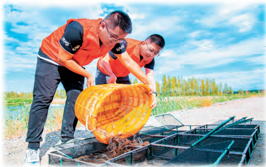
新疆精河县阿合其农场合作社社员 捕捞南美白对虾。

深入学习贯彻自治区组织工作会议精神,推动基层组织工作全面进步。严密组织体系,建立完善“行政村党组织+村民小组党小组(党支部)+党员中心户”“社区党组织+网格党支部(党小组)+楼栋(巷道)党小组”组织设置,规范运行农村“三中心”(党群服务中心、维稳综治中心、农村发展中心)、社区“两中心一站”(党群服务中心、维稳综治中心、新时代文明实践站),落实社区党组织领导下的居委会、业主委员会、物业服务企业协调共治。强化队伍建设,坚持从致富能手、退役军人、返乡高校毕业生等群体中内选外引,动态储备培养后备力量,优化党员队伍结构,加强素质能力建设,依托援疆省市资源、各级党校主阵地等优势,组织村(社区)干部、基层党员开展学习培训。增强服务功能,健全完善党群服务中心功能体系,发挥“石榴籽服务站”功能,探索实施凉亭议事、民事直说、服务承诺等机制,制定干部包联片区责任制,沉入网格服务群众,实施群众合理诉求“全收集、全解决、全反馈、全评价”工作机制,做好群众服务,确保党的政策有效贯彻落实到基层。 (斯琴)