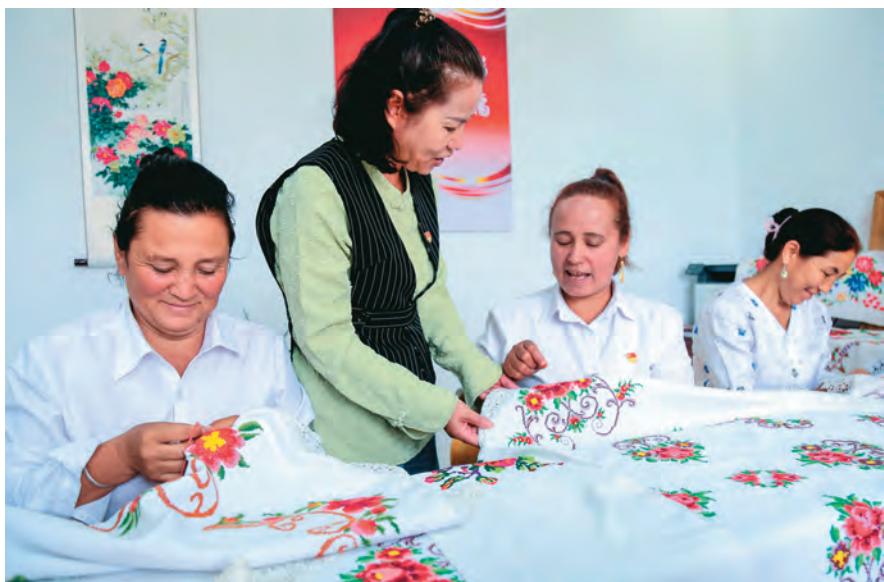
喀什地区叶城县阿克塔什镇瓦勒瓦村妇联邀请专业刺绣老师为无职妇女开展刺绣培训。

市妇联协同发力,开展“最美家庭”交往交流交融活动,今年以来,组织受援县市505户“最美家庭”与援疆省市“最美家庭”结对认亲,先后组织112户来自巴州、阿克苏、克州、喀什、和田的“最美家庭”代表赴援疆省市开展结亲走访活动,让大江南北的“最美家庭”结成一家人,绘制出民族大团结的动人画卷。和田