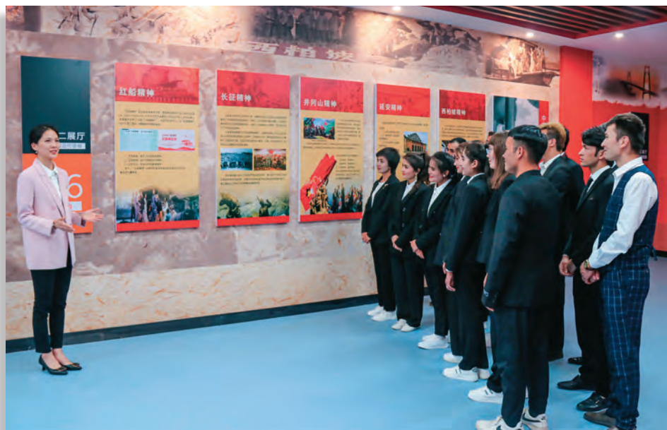
马克思主义学院学生在中国德育馆(新疆工程学院分馆)聆听爱国主义德育故事。