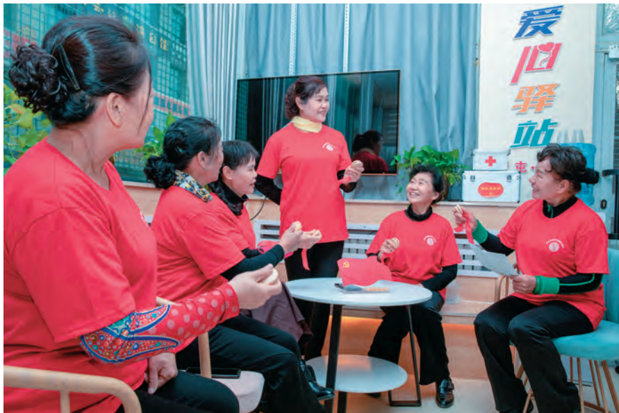
奎屯市团结街街道龙溪里社区党支部以群众喜闻乐见的方式学习宣传党的创新理论。

制定实施党的创新理论学习教育计划,以党员领导干部这个“关键少数”为重点,开展“第一议题”学习、市委理论学习中心组集中学习研讨,完成25个学习专题,市四套班子领导带头作学习交流发言,党员领导干部讲专题党课,坚持以身作则、以上率下,做到先学一步、学深一层。采取读书班、交流研讨等形式,组织各单位党委(党组)负责人带头读原著、学原文、悟原理,坚定拥护“两个确立”、坚决做到“两个维护”,不断提高政治判断力、政治领悟力、政治执行力。发挥市委党校(行政学校)教育培训主渠道、主阵地作用,举办2期领导干部能力素质提升培训班,通过集中教育,让领导干部带着问题边学边思考,系统掌握党的创新理论、科学体系