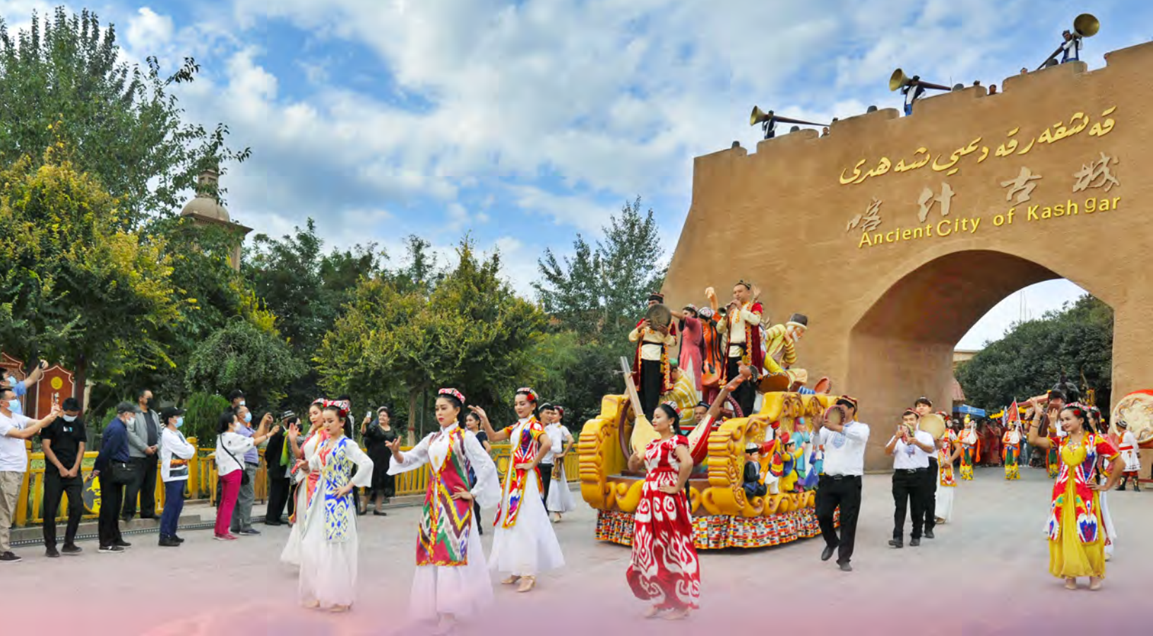
▲喀什古城景区举行入城仪式,迎接八方游客。