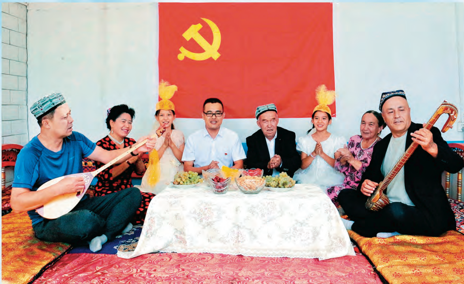
▲沙湾市乌兰乌苏镇三官店村党支部通过冬不拉弹唱、快板等多种形式开展学习宣传习近平总书记重要讲话精神主题宣讲活动。