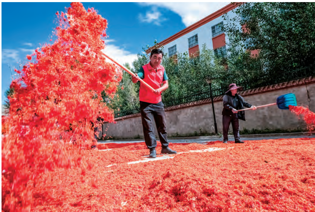
阿勒泰地区交通运输局驻吉木乃县托斯特乡托斯特村工作队队员帮助村民晾晒红花。

力开展安全生产宣传教育,组织村“两委”集中排查易燃易爆物品、老旧线路等隐患,研究制定防火、防汛、防中毒等应急预案,建立护村队、护路队、护校队等,增强治理实效。突出典型示范,全面推行“社会支持、村民参与、积分管理、奖惩结合”的积分制度,设置畜栏规范、垃圾清运等20项积分内容,将村民参与产业发展、环境整治等事务的现实表现量化为“百分制”积分,排名靠前的,评选为“党员示范户”“星级文明户”“美丽庭院”。青河县教育