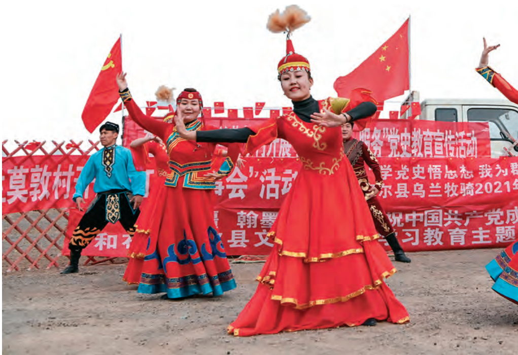
和布克赛尔县乌兰牧骑宣传队深入牧区向基层群众宣讲党的创新理论。

习标兵”520名,并在光荣榜中展示,激发党员学习热情。“工作标兵”提能力,年初为每名党员定岗位、定职责,科学设置工作完成情况、季度考核、业务测试、上级部门结果反馈等业绩评价指标,每季度末对党员“收单亮分”,综合评定“工作标兵”“岗位能手”497名,引导党员立足岗位做示范,提升为民服务本领。志愿服务送温暖,充分运用在职党员“双报到”、党员志愿服务日活动等载