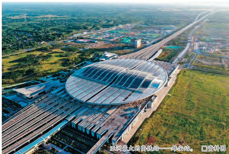
亚洲最大的高铁站——雄安站。 □资料图