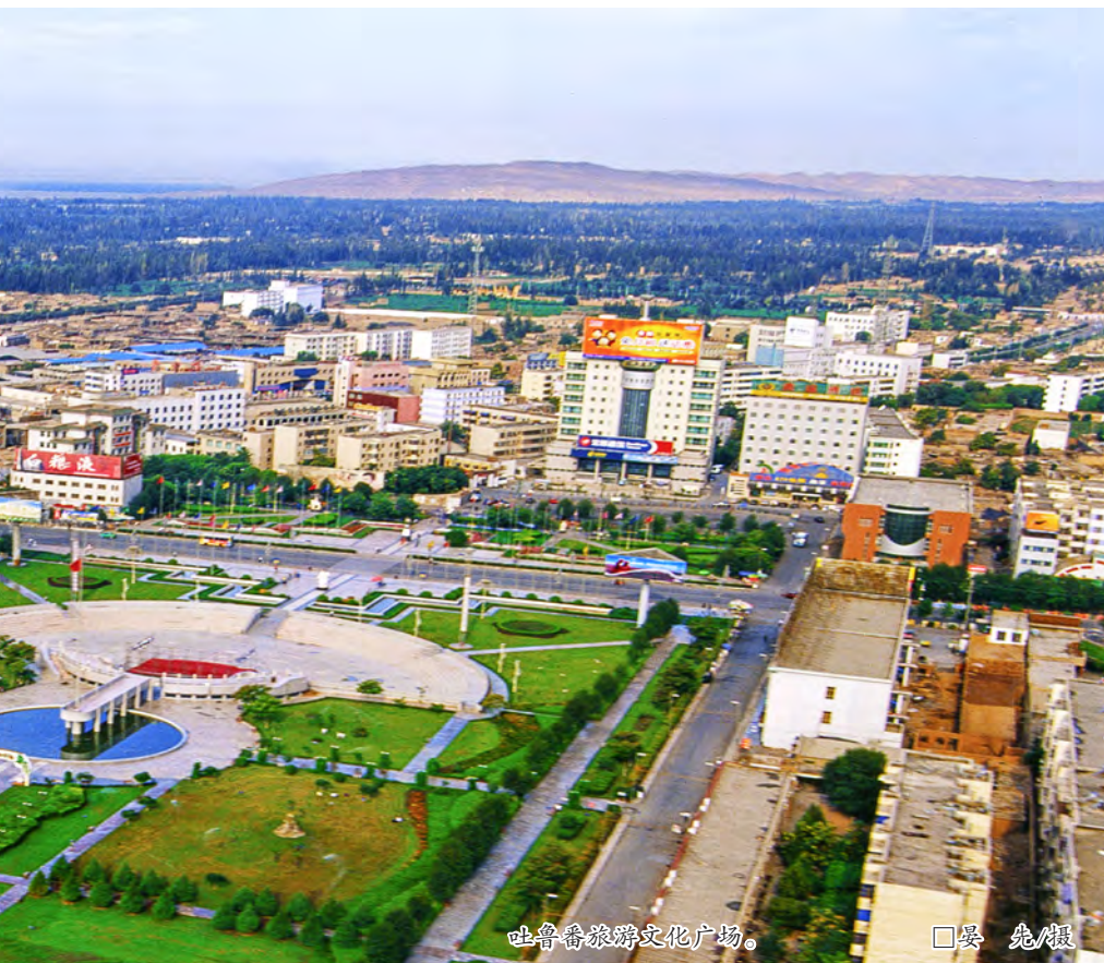
吐鲁番旅游文化广场。