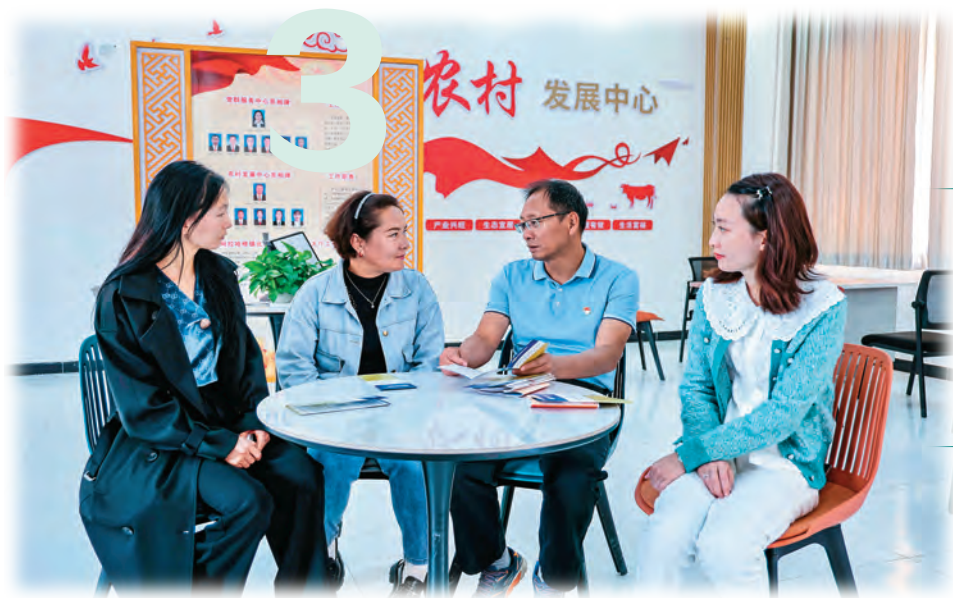
新疆库车市阿拉哈格镇比苏特村驻村第一书记(右二)向村后备力量传授工作经验。