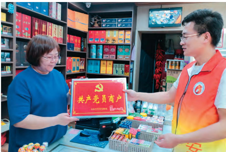
克拉玛依市白碱滩区(克拉玛依高新区)三平路街道振兴社区党支部为辖区商户发放“共产党员商户”标识牌。

深化新时代油城“红细胞”工程,丰富内涵和扩张外延,充分发挥党员先锋模范作用。建立“双报到、双积分、双服务、双反馈”四大体系,市、区两级在职党员、离退休党员、农牧民党员到居住地社区(村)报到,创新设置“8+X”服务岗位,“8”为基础岗位,包括党建指导岗、环境整治岗、关爱帮扶岗等岗位;“X”为自选岗位,涵盖技术服务、“红喇叭”宣传、敬老服务等岗位,同步完善岗位积分评价机制,推动党员认领服务岗位,参与志愿服务。抓实学习标兵、工作标兵评比。设置党员先锋岗8400余个,创建党员示范岗、责任区2.3万余个。在商圈公开党员户,全覆盖颁发“共产党员经营户”标识牌,引导商户诚信经营、示范先行。推动窗口单位和服务行业党员“亮牌带徽”全覆盖,在工位或服务大厅设置公示栏,公开党员姓名、岗位职责,亮身份、亮职责、亮承诺,接受群众监督、发挥表率作用。