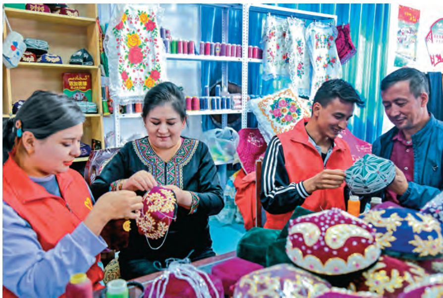
叶城县依提木孔镇实施乡土人才“青苗”工程,组织乡村匠人以“师徒结对”的方式带领返乡创业大学生学习制作花帽。