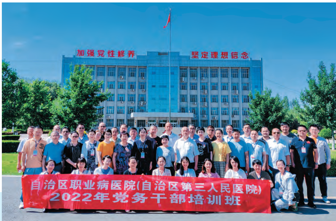
自治区第三人民医院党委开展党务干部培训。