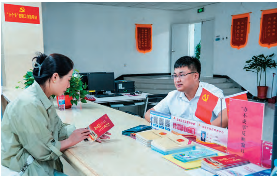
阿拉山口综保区党群服务中心工作人员帮助企业办理注册登记。

强化党建指导，建好“加油站”。 充分调动属地资源，建立市委“两新”工委、市直结对共建单位、镇（街道）党（工）委联动抓党建机制，推动园区“两新”组织党建提档升级。加大党组织组建力度，依托园区龙头企业，采取“单独组建、联合组建、行业联建、区域统建”等方式，组建园区党组织8个，做到符合条件的企