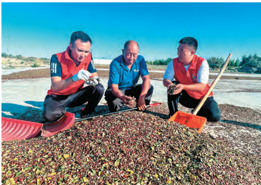
福海县驻阔克阿孜什乡别斯克拜村工作队队员帮助农户晾晒打瓜籽。

立足资源优势，找准发展重点，探索推行“党建+产业”融合发展模式，带动村民增收致富。延长养殖产业链，探索规模化养殖、集约化管理的发展模式，扶持致富能人创办骆驼养殖专业合作社，采取“企业扶持、农户买驼、以奶还款”方式，引导养殖户入股1000余头骆驼到合作社共同经营，与村“两委”促成与驼奶公司签订订单收购协议，明确驼奶及其他产品收购质量、数量和最低保护价，实现牧民养殖有目标、销售有渠道、收入有保障。促进农旅融合发展，立足生态资源优势，推行“支部+旅游”模式，与村“两委”帮助农牧民申请农家乐项目，引导农牧民打造集休闲、餐饮、娱乐为一体的生态采摘园100余个，吸引6.6万人次观光、采摘、订购，带动1200余名富余劳动力实现就业增收。助力农特产品销售，依托沙棘、黑加仑、中草药等特色产品加工企业技术优势，借助后盾单位力量，对接景区游客服务中心、高速公路服务区、机场等游客密集场所，设立118个产品展销专区，实现种植户年增收6000余元。新疆地矿局第四地质大队、中国银行阿勒泰分行驻哈巴河县萨尔塔木乡库尔米希村工作队成立中草药种植合作社，引导村集体和村民土地入股，统一种植、管理、采挖、销售，形成“村集体+合作社+村民”发展模式，带动周边170余名村民