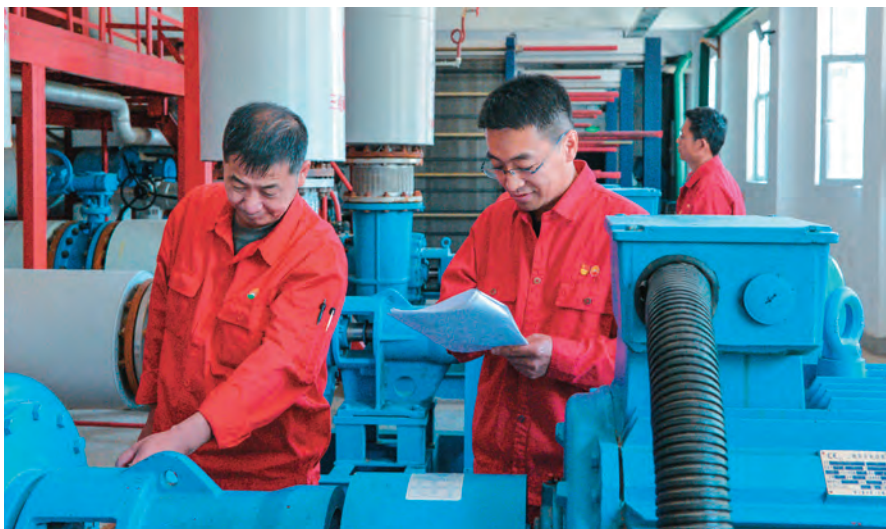
克拉玛依市热力公司推行党员“赛马”工作制,引导党员挑重担当先锋。