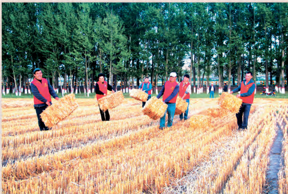
◀昭苏县喀夏加尔镇党员干部组成“助农志愿者服务队”深入田间帮助农户秋收,进一步增强党员干部宗旨意识。 □巴衣巴扎尔·马吾特/摄