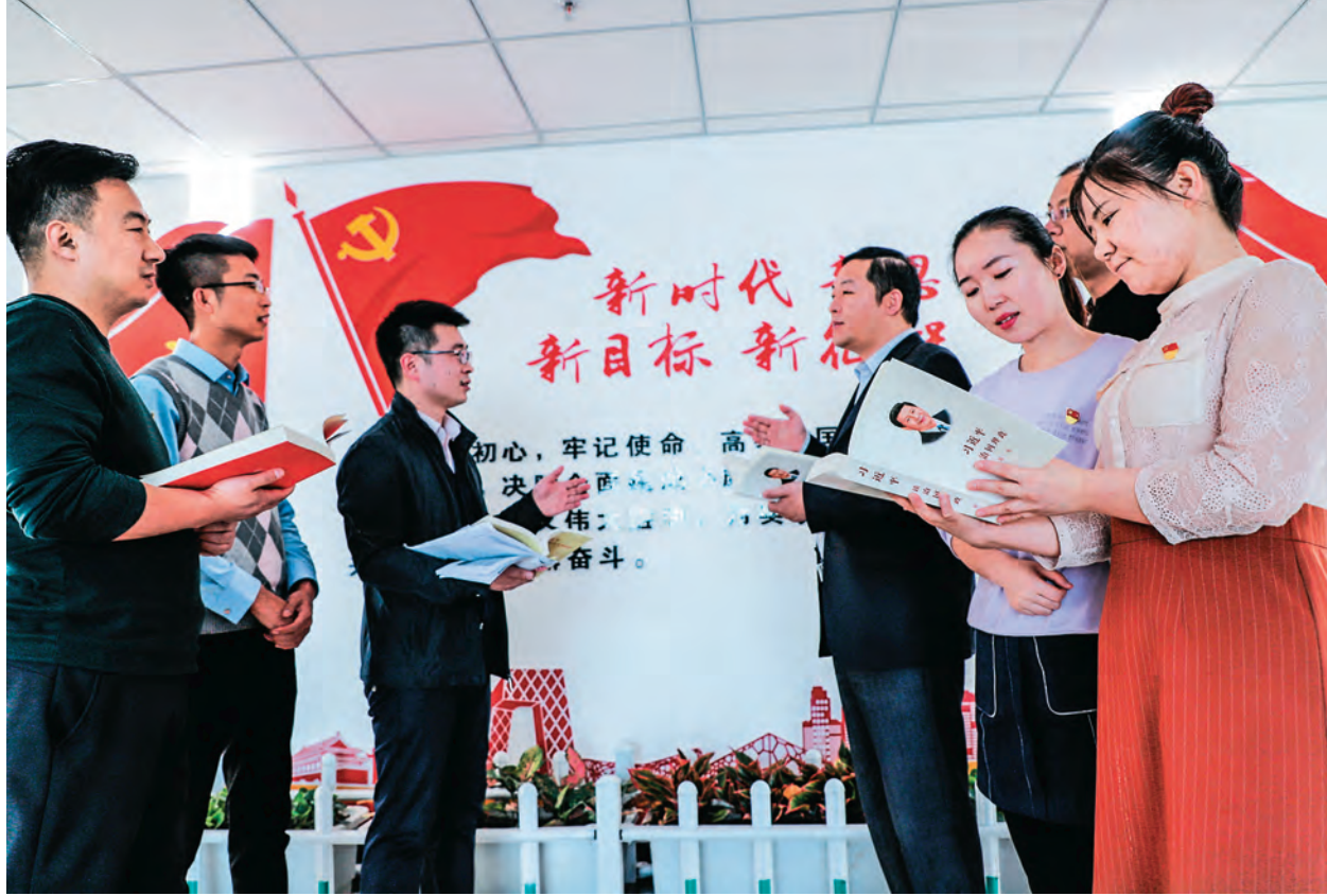
新疆塔城地区强化党员干部党的创新理论学习,加强机关党的政治建设。