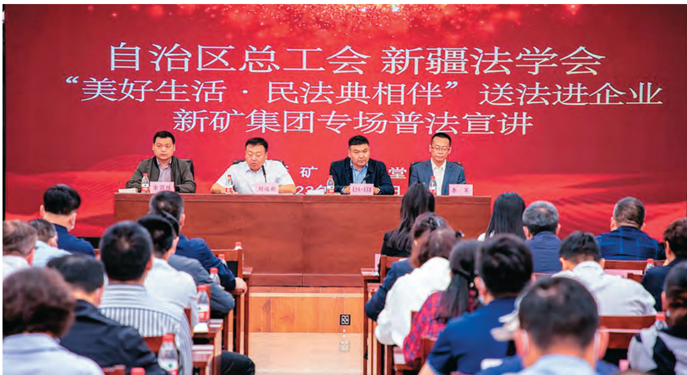
自治区总工会联合新疆法学会开展企业普法宣讲活动。