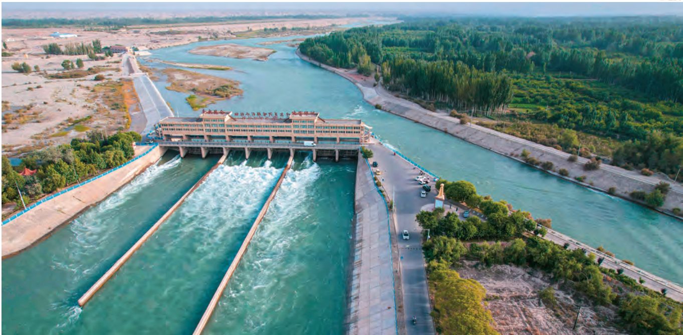
叶尔羌河喀群引水枢纽。