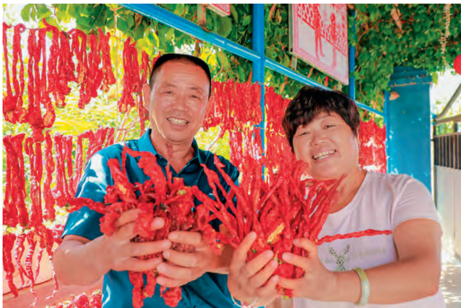
新塔热村通过“党建+合作社”模式发展辣椒优势产业助农增收。

强基固本筑堡垒。深入开展“五个好”标准化规范化党支部创建工作,严格落实“三会一课”“党旗映天山”主题党日、民主评议党员、组织生活会等制度,推动党的组织生活规范化。持续加强村“两委”班子和党员队伍能力素质提升,乡镇领导班子、驻村干部与村“两委”班子成员、后备力量结对帮扶形成制度,通过业务指导、经验分享、资源共享等方式,带出政治过硬、本领过硬、作风过硬的乡村振兴骨干队伍。扎实开展党员“三学三亮三比”争当先