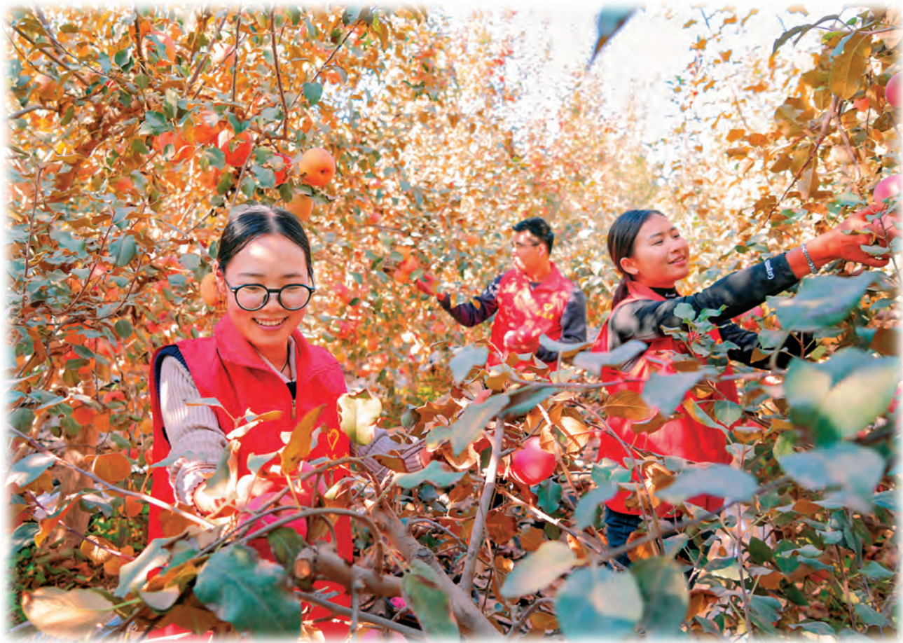
新疆麦盖提县组织党员干部深入农家院落、田间地头,帮助农户采摘苹果。