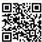
扫描二维码看视频 感受基层党员心声