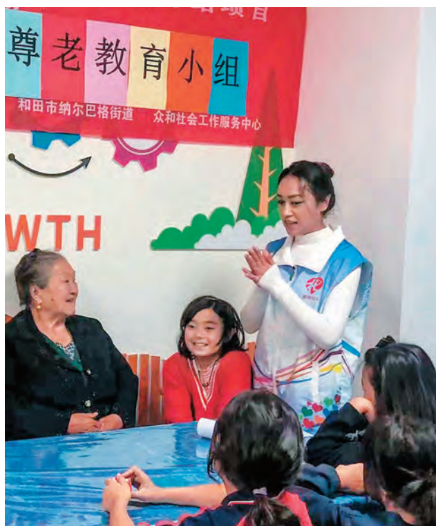
民心社区党支部开展感恩尊老活动。