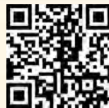
扫描二维码看视频 感受基层党员心声