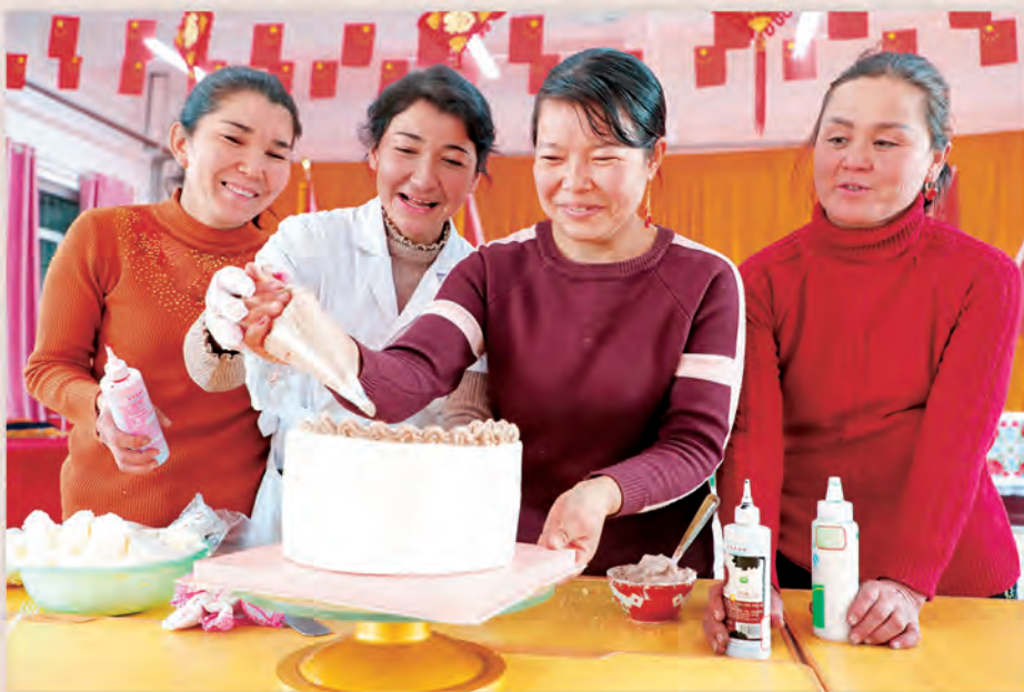
◀库车市妇联组织妇女干部走进基层,开展技能培训活动,提高农村妇女就业创业本领。