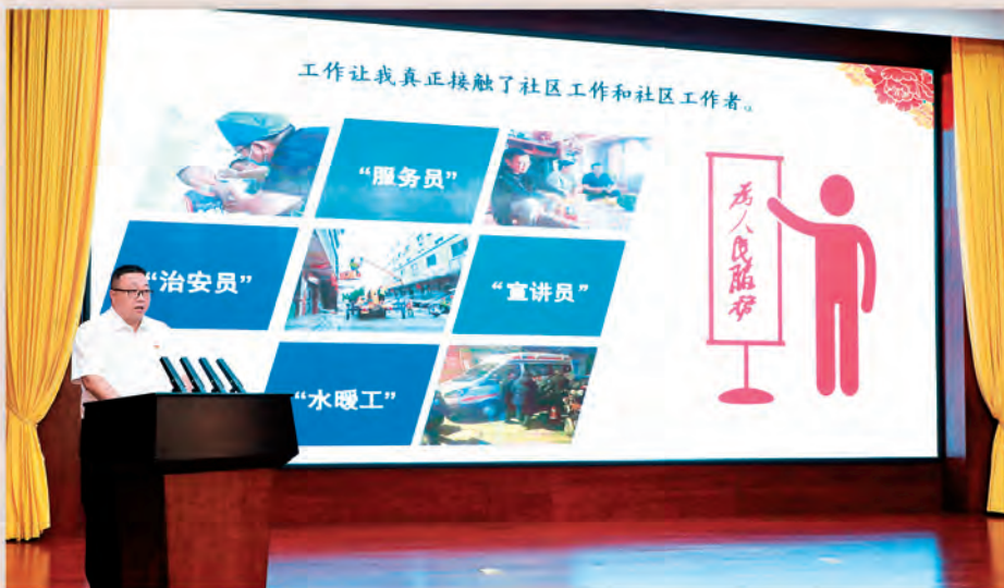
◀乌鲁木齐经济技术开发区(头屯河区)举办社区党组织书记擂台比武活动,提升基层干部履职能力。 □高康媛/摄