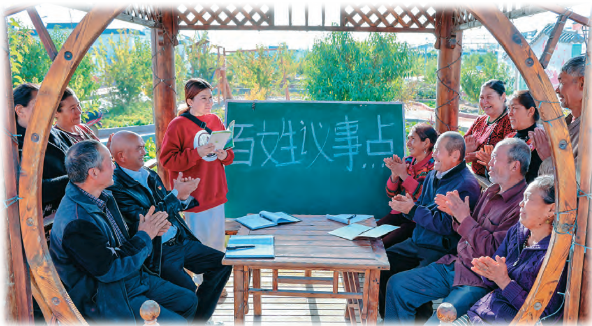
新疆库车市哈尼喀塔木乡巴扎村“百姓议事点”现场。