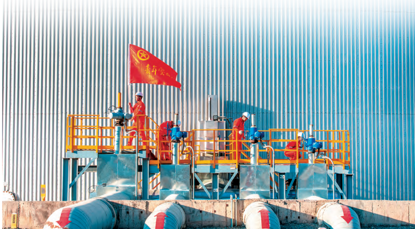
中国石油新疆油田王家沟油气储运中心“青年突击队”开展库区巡检。