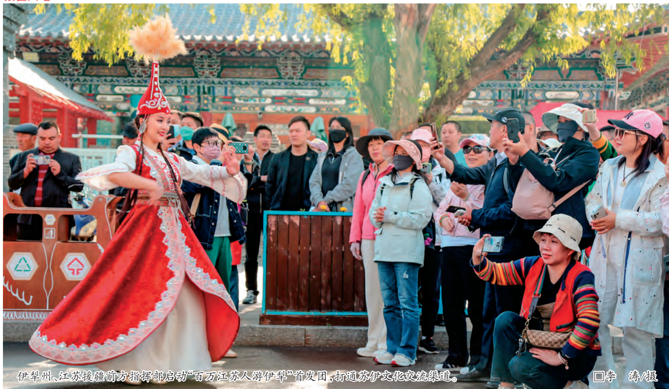
伊犁州、江苏援疆前方指挥部启动“百万江苏人游伊犁”首发团,打通苏伊文化交流渠道。