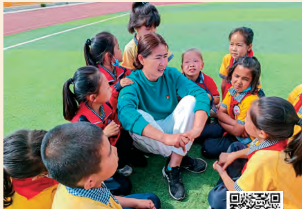
扫码观看视频 学习身边榜样