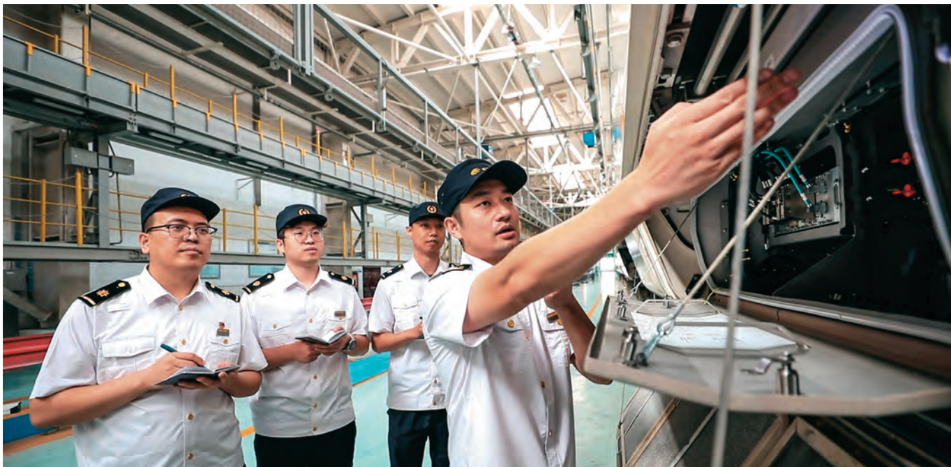
乌鲁木齐车辆段随车机械师在动车所内开展动车组行车风险点巡检现场教学。