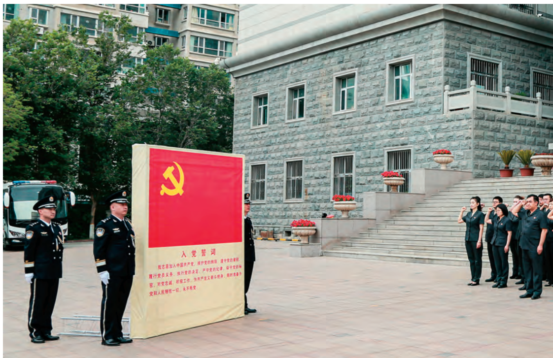
乌鲁木齐市中级人民法院党员重温入党誓词。

新疆乌鲁木齐市中级人民法院以习近平新时代中国特色社会主义思想为指导，坚持抓党建、带队建、促审判，从严管理、从严治院，着力打造让党放心、让人民群众满意的高素质法院工作队伍。近年，先后荣获“全国优秀法院”“全国文明单位”“全国扫黑除恶专项斗争先进集体”，被最高人民法院和自治区党委、自治区人民政府分别荣记“集体一等功”。