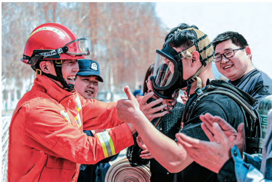
新疆富蕴县消防救援大队青年干部深入牧区开展“防灾减灾”宣传。

引导党员干部以更好状态、更实作风担当作为、勤政履职。强化结果运用。用好正向激励,坚持以干成之事评价干事之人,形成绩由事考、人以绩论的闭环链条,激励干部敢于担当、积极作为。落实反向鞭策,建立考核结果反馈机制,肯定成绩、指出不足,明确提出表彰奖励、批评教育、提醒诫勉、限期整改等意见,引导干部发扬成绩、改进不足,更好忠于职守、担当奉献。