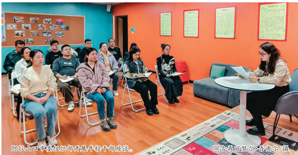
阿拉山口市市委组织部开展年轻干部座谈。