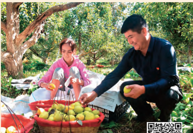
扫码观看视频 学习身边榜样