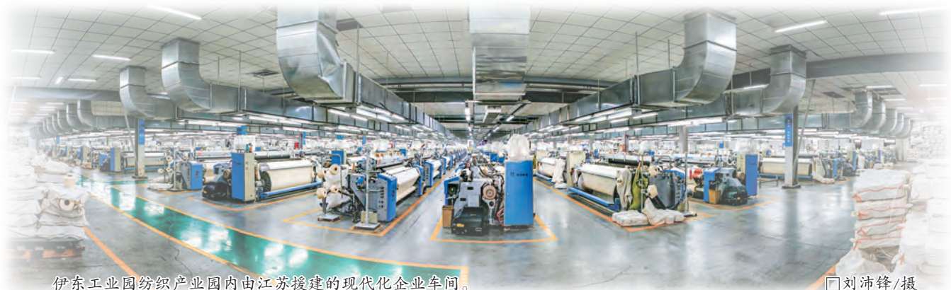
伊东工业园纺织产业园内由江苏援建的现代化企业车间。