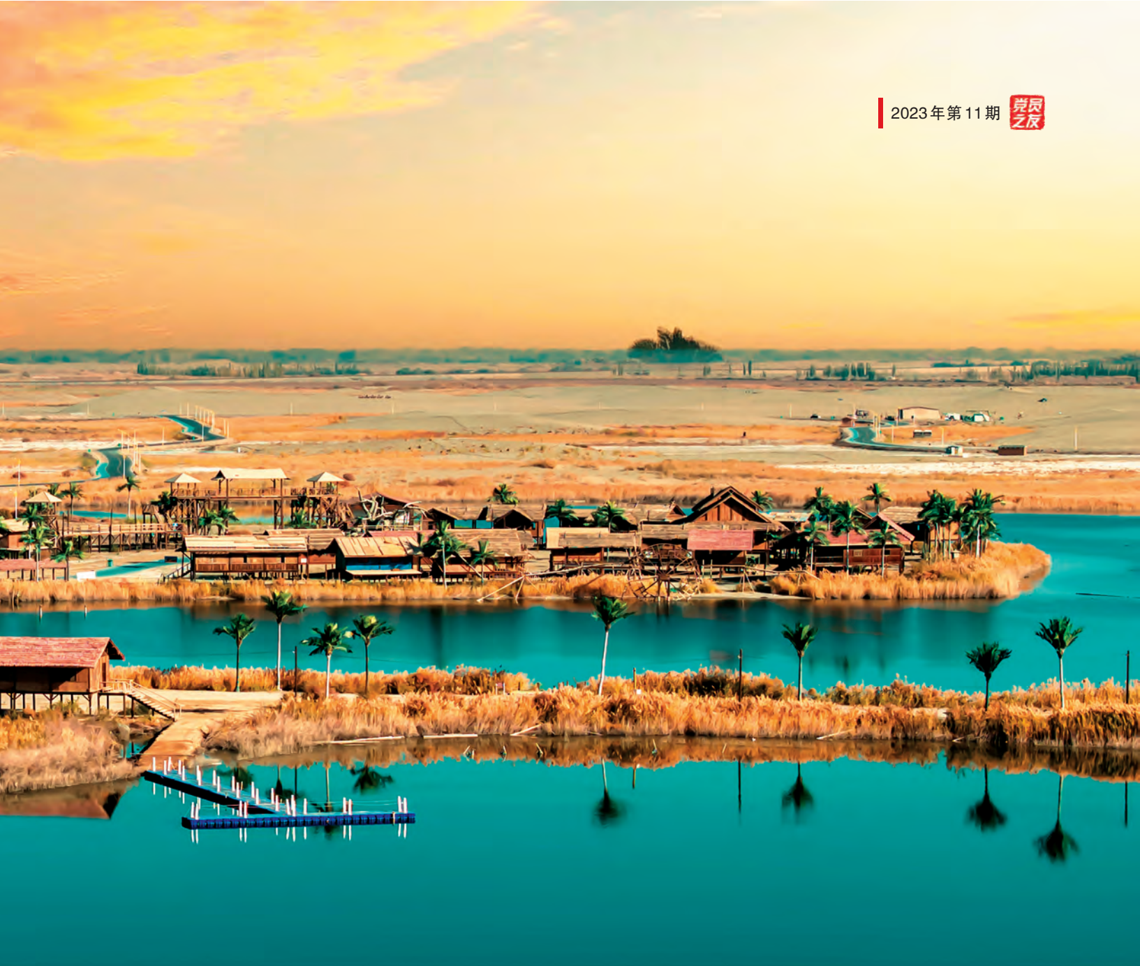
▲阿克苏市皇宫湖景区。