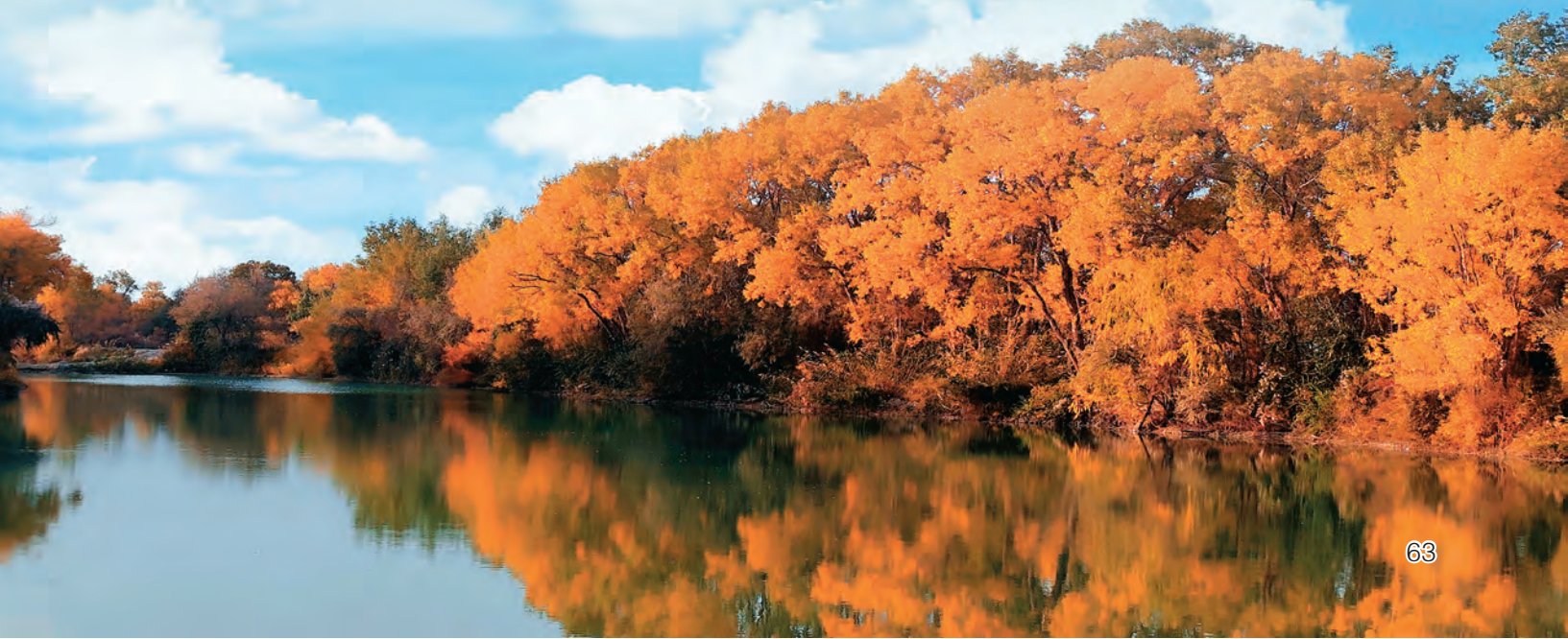
▼阿克苏市胡杨岛乐园。