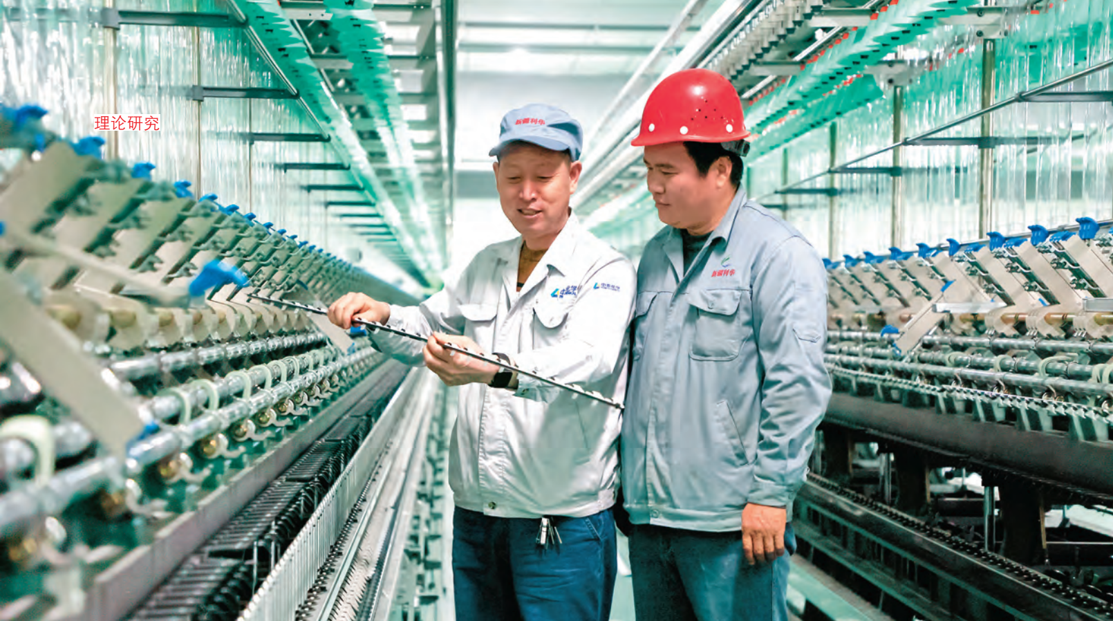
新疆库车市利华纺织有限公司技能人才(左)指导学徒安装调试设备。