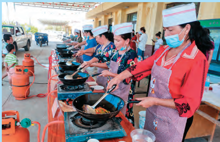
吐鲁番市自然资源局驻鄯善县鲁克沁镇赛尔克甫村工作队开展厨艺技能培训。