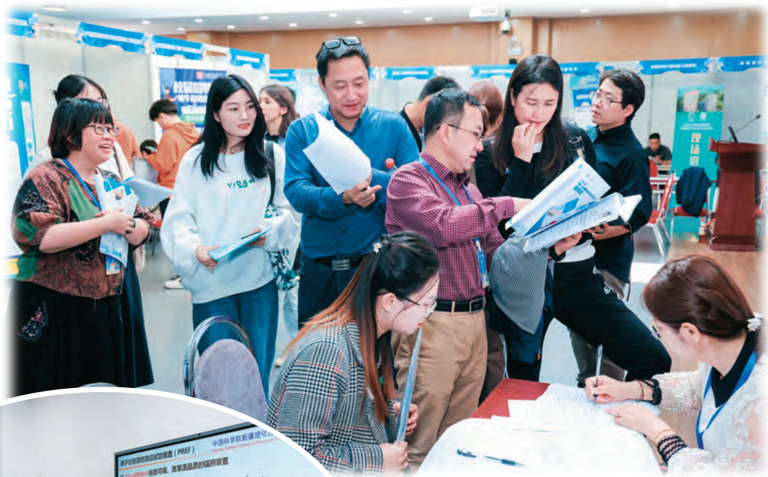
▲自治区人力资源和社会保障厅在西安交通大学举办现场招聘会。