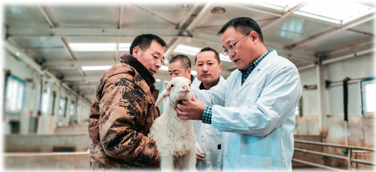
墨玉县邀请自治区畜牧科学院专家帮带指导当地畜牧人才。