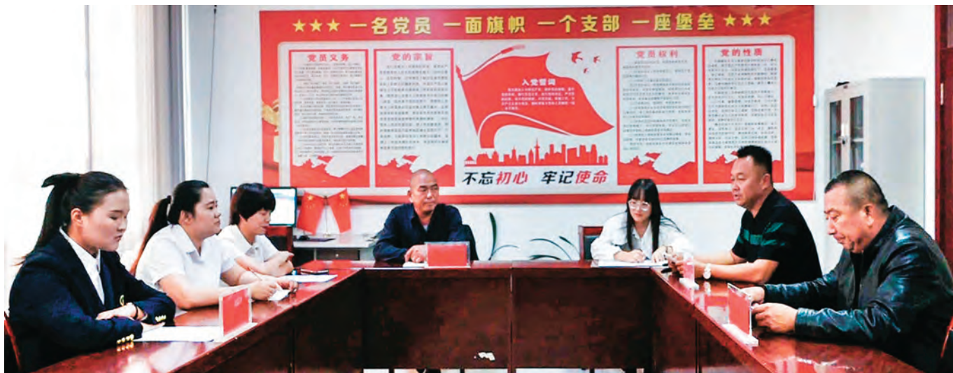
吉木萨尔县政务服务中心工作人员和二工镇头工街东村村委员会人员现场办理群众诉求事项。