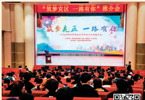
扫码观看视频 展现人才工作