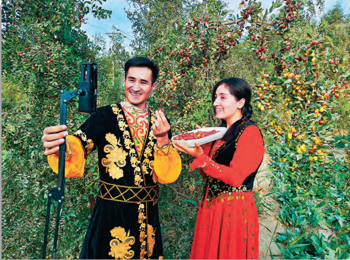
电商人才在吾塔木乡果勒艾日克村枣园现场直播,帮助村民销售红枣。