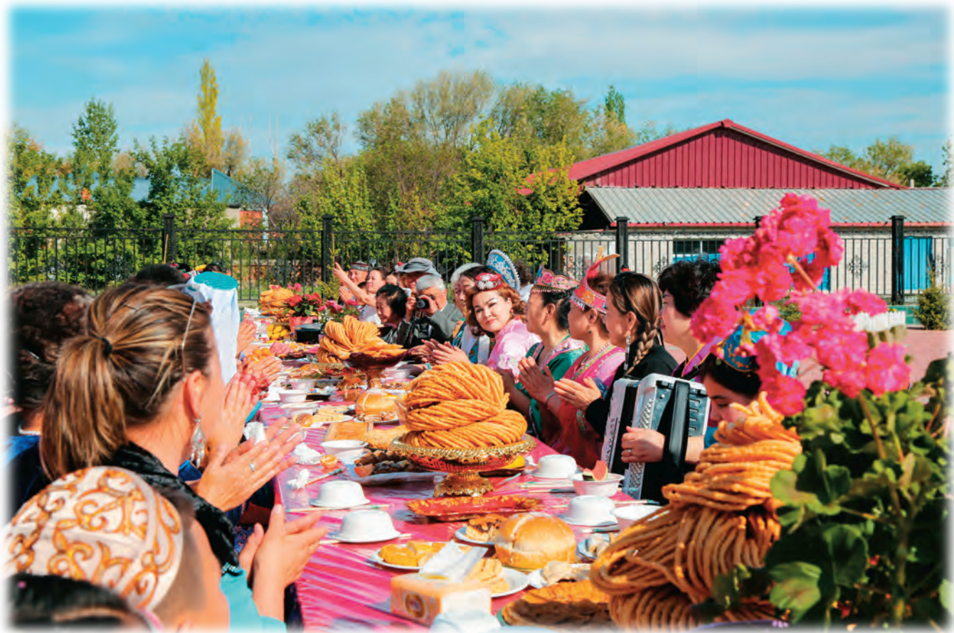
塔城市新城街道哈尔墩社区举办“邻里节百家宴”活动。