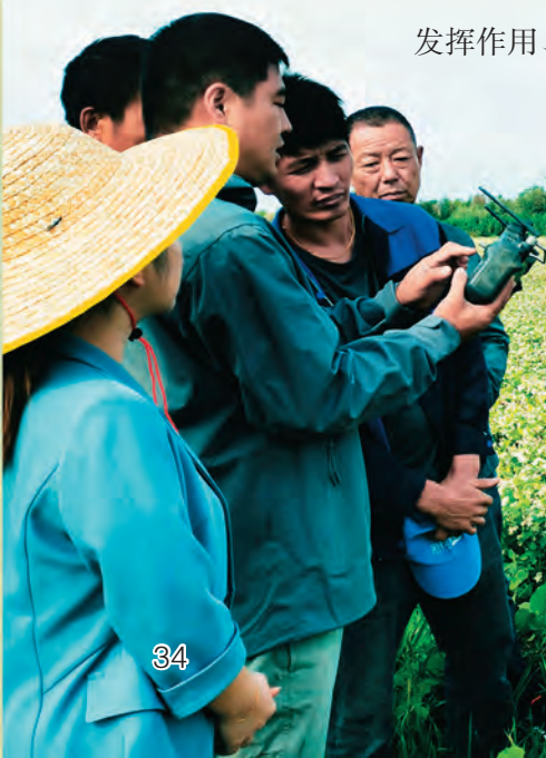
◀ 沙湾市纪委监委驻商户地乡蘑菇湖村工作队邀请专业技术人员开展植保无人机实操培训。 □ 田芳吉/摄

自治区深入实施人才强区战略,聚焦“八大产业集群”建设、丝绸之路经济带核心区建设,实行更加开放的人才政策,为人才松绑,让人才创新创造活力充分迸发,形成人尽其才、才尽其用、用有所成的良好局面,为人才发挥作用、施展才华提供更加广阔的天地。