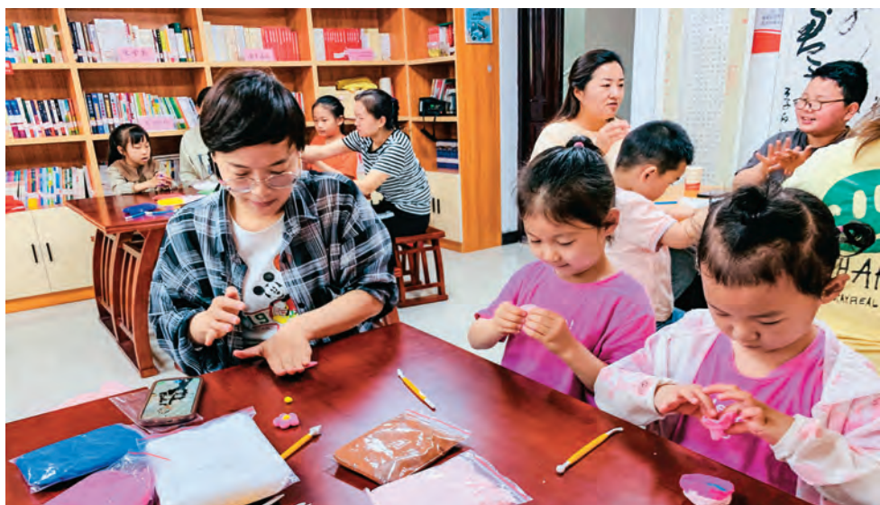
明苑社区开展亲子活动。