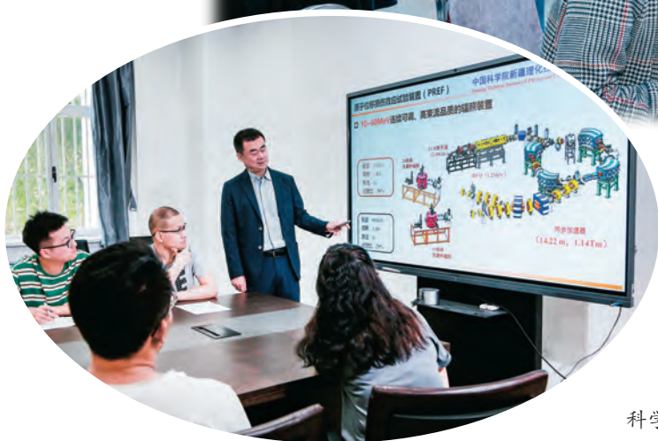
◀自治区人力资源和社会保障厅柔性引才政策为中国科学院新疆理化技术研究所发展注入新活力。

绩的等级晋升制度,拓展县以下事业单位管理岗位人员职业发展空间,打破基层事业单位管理岗位人员晋升“天花板”。实施人才项目激励。实施“天池英才”引进计划,分为领军人才、特聘专家、青年博士、急需紧缺专业人才4个引进专项,分别研究确定量化赋分要素、标准,避免一刀切,确保标准科学,择优遴选给予经费资助。