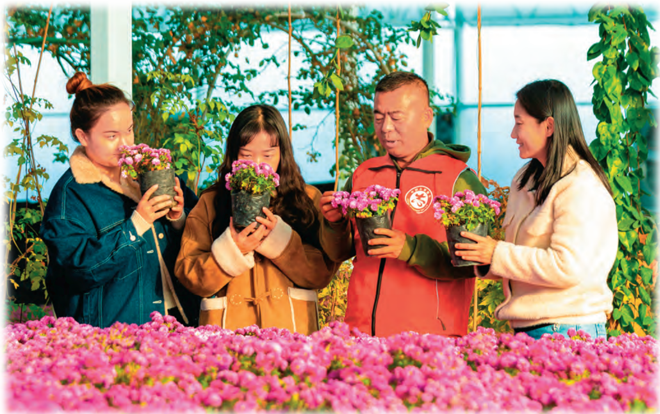
新疆奎屯市园艺科研所特色种植人才服务团在开干齐乡指导培训秋菊种植技术。