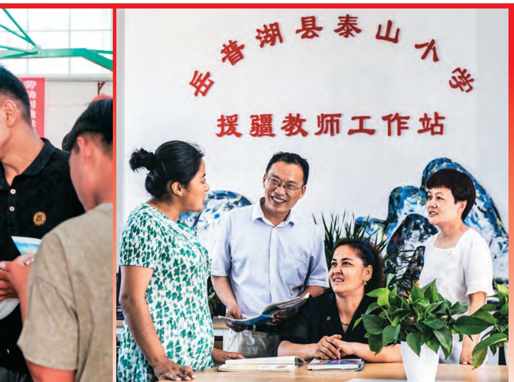
援疆教师与当地教师结对子,共同促进业务提升。