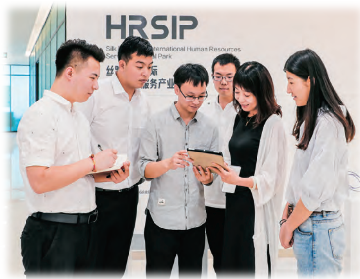
乌鲁木齐高新技术产业开发区(新市区)丝路之星国际人力资源服务产业园的青年专家讨论工作。

精准引才需求。 明确引才需求,锁定引才目标,实施多维引才。靶向精准引才。盘点各行业、领域岗位需求清单,精准绘制人才需求“地图”,给予重大项目领军人才和创新团队重奖,吸引急需紧缺人才。11月15日,在深圳举行中国(新疆)自由贸易试验区乌鲁木齐片区高新功能区块暨“双招双引”推介会,发布“揭榜挂帅”全球引才项目,推出急需紧缺人才需求项目,为高端人才提供广阔机遇。专项招聘引才。启动党政人才引进工程,通过“定向+专场”“校招+社招”、召开引进人才推介会等形式,连续10年面向清华大学、北京大学、复旦大学、中国