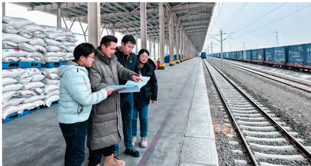
精河国际公铁联运综合物流园区高级顾问开展铁路专用线监督指导工作。

展“他山研学”,帮助人才开阔眼界、提升素质。开展“订单式”培训。充分发挥院校人才培养主阵地作用,紧贴经济发展、乡村振兴等实际需求,加大专业型、技能型人才培养力度。健全校企合作机制,支持鼓励和引导企业前移人才培养环节,通过“订单式”培养等方式,与高校、企业联合培养人才。温泉县天源花卉有限公司加强校企合作,与石河子大学生命科学学院签订合作协议,建立石河子大学温泉县食用菌产学研基地,推进优质食用菌及其他农