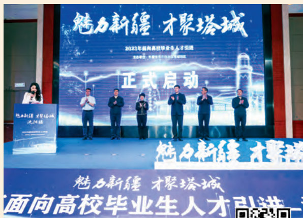
扫码观看视频 展现人才工作