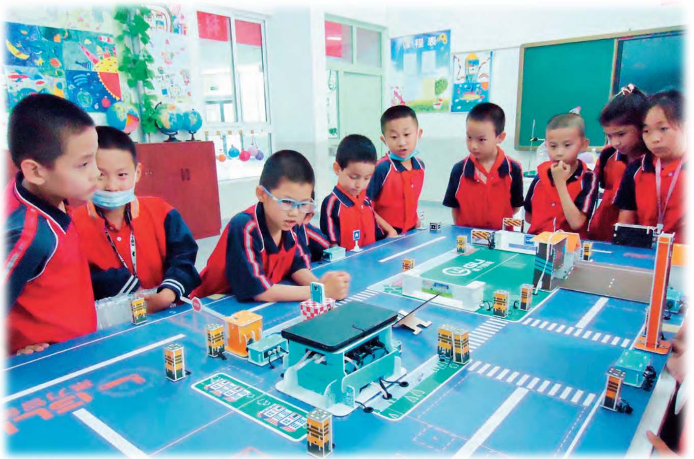
和田市海淀小学通过开展科技社团活动,增强孩子们学科技、爱科技意识。