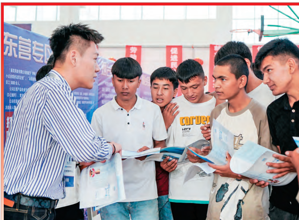
山东援疆前指举办“就选山东、送岗入疆”就业服务活动,促进双方人才交流。

坚持长期援疆与柔性援助并举,打破单位、地域、层次限制,整合优化干部人才资源,采用多种形式组团,构建整体性、系统性、协同性干部人才援疆模式,有效提升援疆效能。实行针对性组团。设立山东援疆喀什柔性人才工作站,紧扣受援地经济社会发展需求,实施“紧缺什么就选派什么”柔性人才模式,精准选派专业技术人才开展短期援疆工作,先后组建各类“立体组团”320个,提供有针对性的服务。目前,山东在喀什援疆干部人才已达1145人。实施“嵌入式”组团。将计划内援疆的党政领导干部人才作统一安排,让他们在受援单位任实职、分实工、担实责。结合任职单位工作实际,将他们与柔性援疆干部人才和受援地干部人才组合,形成“1+X”组团模式,