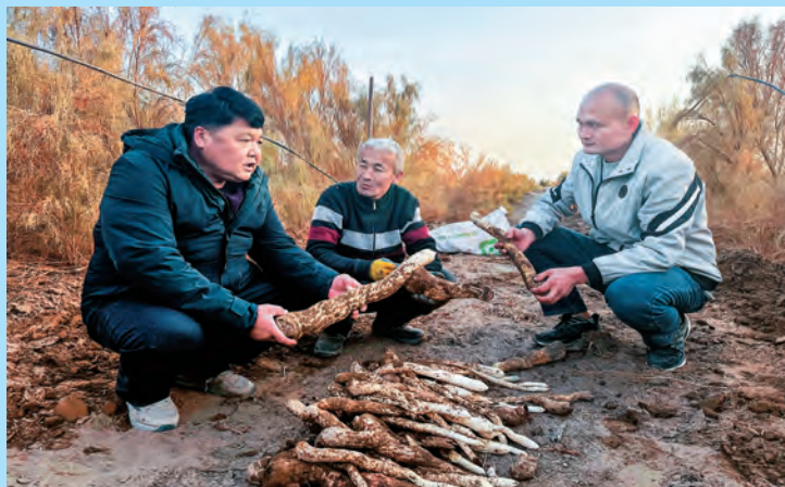
吐鲁番市交通运输综合行政执法局驻鄯善县迪坎镇迪坎村工作队邀请农业技术人员讲解大芸种植技巧。