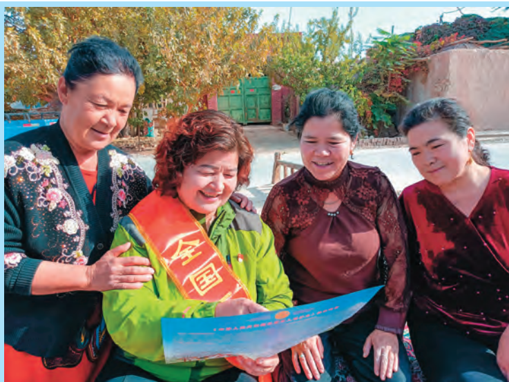
吐鲁番市政协机关驻鄯善县吐峪沟乡团结村工作队邀请全国优秀妇女主任为村民宣传法律知识。