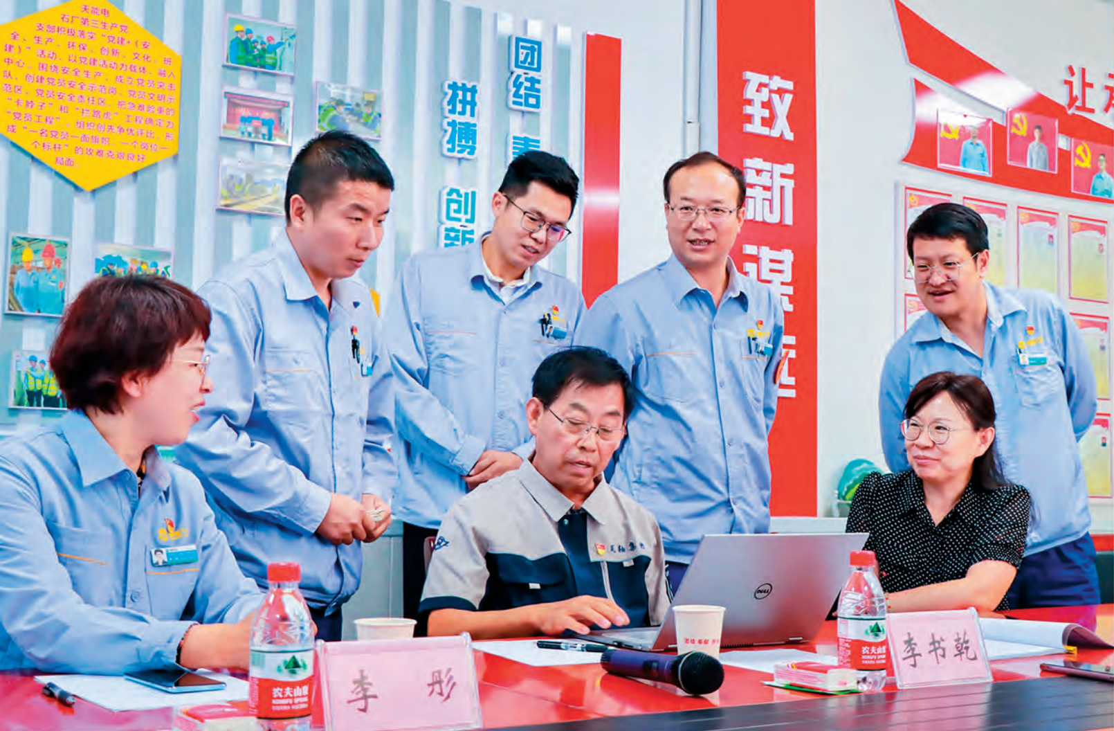
▲ 新疆产业工人队伍技术交流暨大连·石河子劳模工匠技术创新协作行动走进新疆天业集团传经送宝。