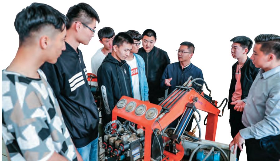
昌吉职业技术学院加强校企合作,培养符合企业需求的高素质技能人才。