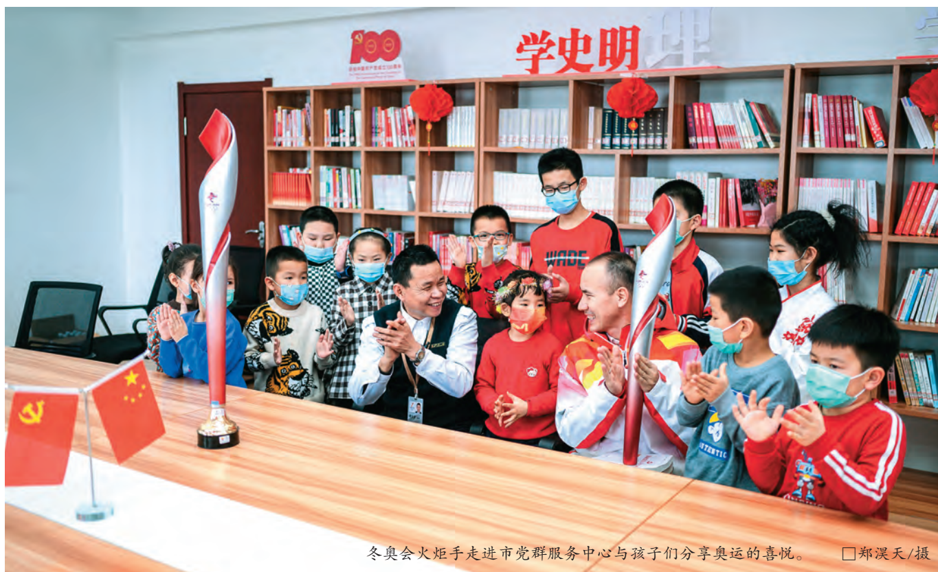
冬奥会火炬手走进市党群服务中心与孩子们分享奥运的喜悦。