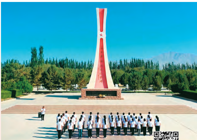
扫码观看视频 感悟初心使命