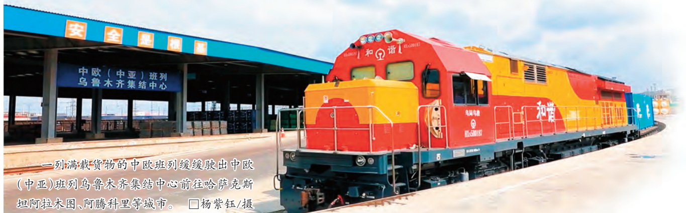
一列满载货物的中欧班列缓缓驶出中欧(中亚)班列乌鲁木齐集结中心前往哈萨克斯坦阿拉木图、阿腾科里等城市。