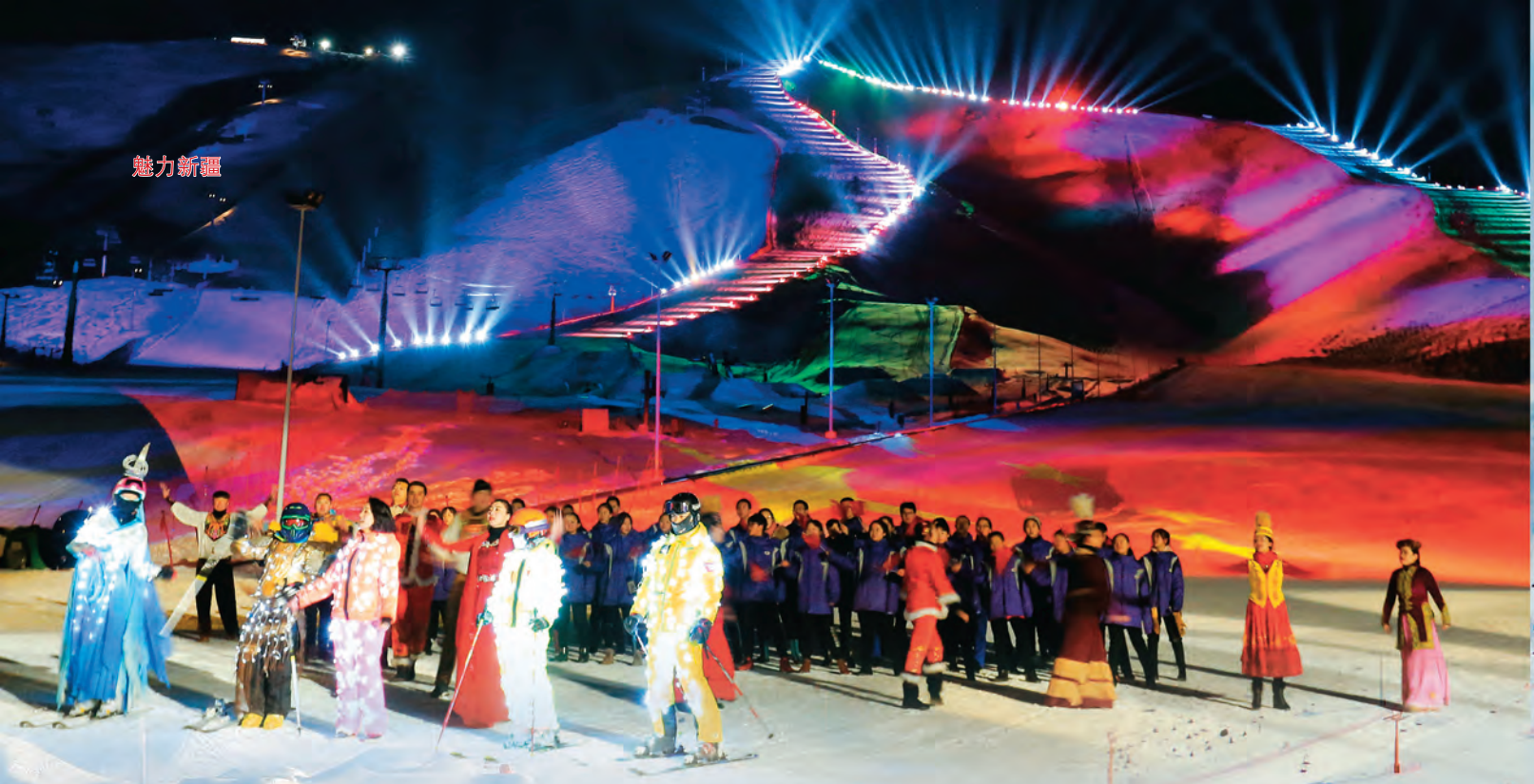
▲将军山的夜晚灯光璀璨。