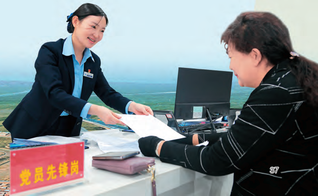
►新疆博湖县深化服务型党组织建设,强化服务功能、改进服务作风、提高服务能力,不断增强党组织创造力凝聚力战斗力。图为县行政服务中心党员先锋岗办事窗口的青年党员正在服务。