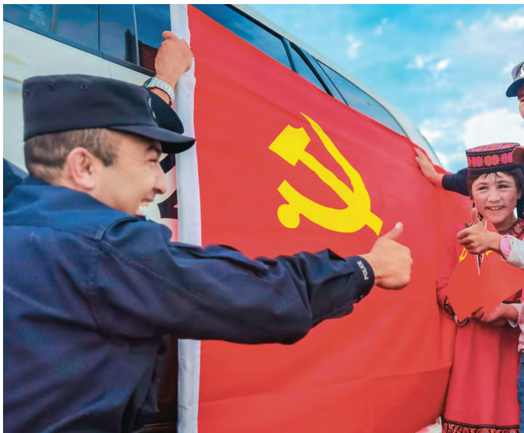
新疆喀什边境管理支队民警走进牧区开展红色教育,在潜移默化中铸牢中华民族共同体意识。

我们必须倍加珍惜当前来之不易的大好局面,切实把铸牢中华民族共同体意识同反分裂斗争和维护稳定结合起来,把铸牢中华民族共同体意识成果转化为维护社会稳定、促进高质量发展的强大动力。