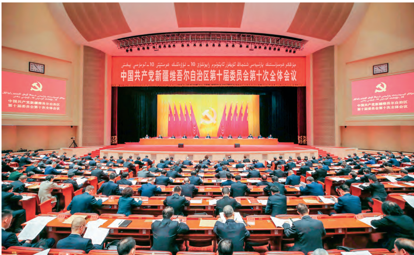
1月5日,中国共产党新疆维吾尔自治区第十届委员会第十次全体会议在乌鲁木齐召开。