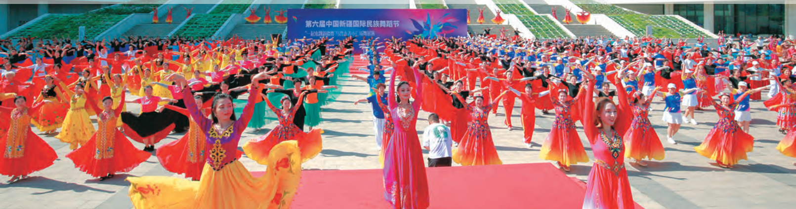
新疆文化馆在乌鲁木齐市“六馆一心”开展“一起来跳广场舞”展演活动。