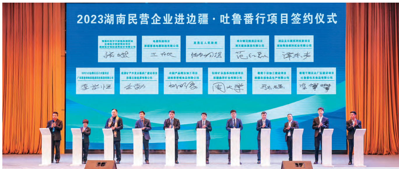
“2023湖南民营企业进边疆·吐鲁番”招商推介会现场签订33个项目,总额达246.18亿元。