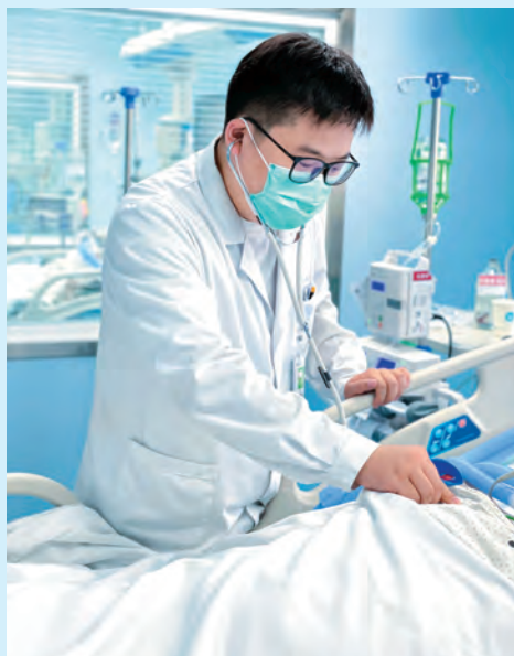
马加威在重症医学科为患者听诊。