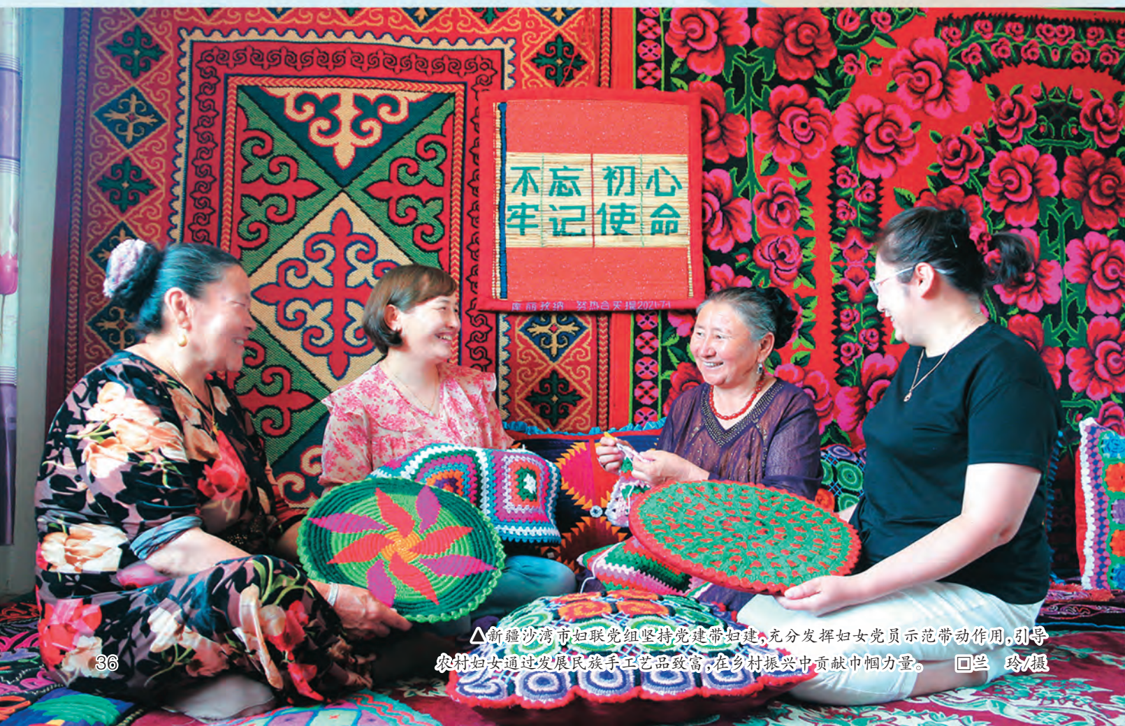
△新疆沙湾市妇联党组坚持党建带妇建,充分发挥妇女党员示范带动作用,引导农村妇女通过发展民族手工艺品致富,在乡村振兴中贡献巾帼力量。 □兰玲/摄