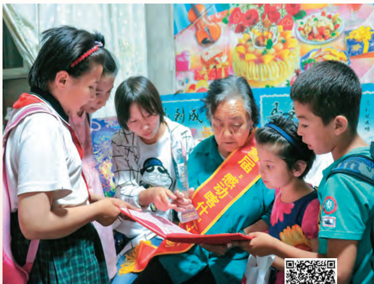
扫码观看视频 感悟初心使命