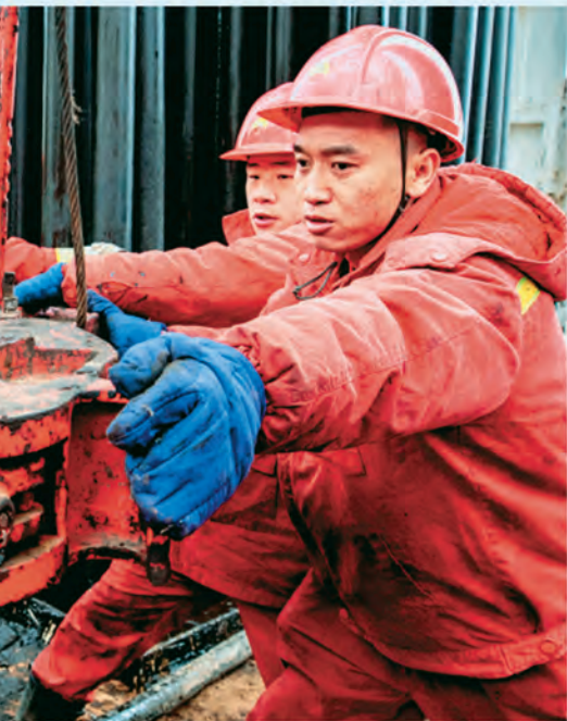
▲中国石油新疆油田公司吉庆油田作业区党委苦练内功,激励党员生产一线奋发有为。