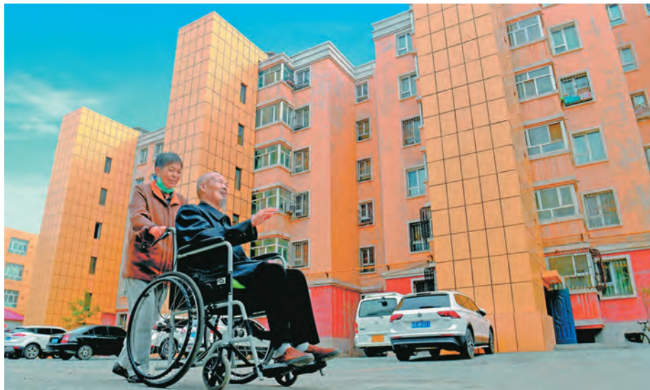
乌鲁木齐市大力推进住房保障服务,居民幸福指数明显提升。