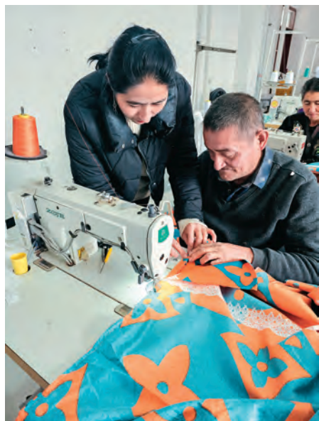
阿瓦提村裁缝厂技工在辅导新进员工缝纫技术。

新疆和田市拉斯奎镇阿瓦提村党支部扎实做好服务群众、凝聚人心工作,坚持把为民服务落实到每名党员身上、每件具体事情上,努力将实事好事做到群众心头,受到村民的普遍好评。