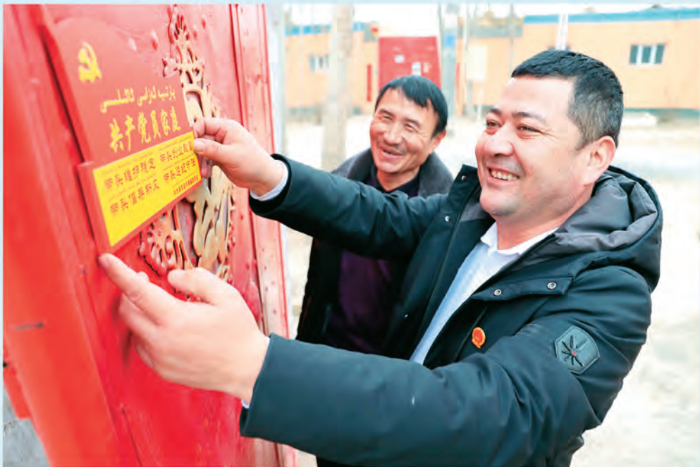
▲新疆库车市农村基层党组织广泛开展“共产党员家庭”挂牌活动,引导农牧民党员亮身份、当表率、树形象。