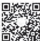
扫描二维码看视频 感受基层党员心声