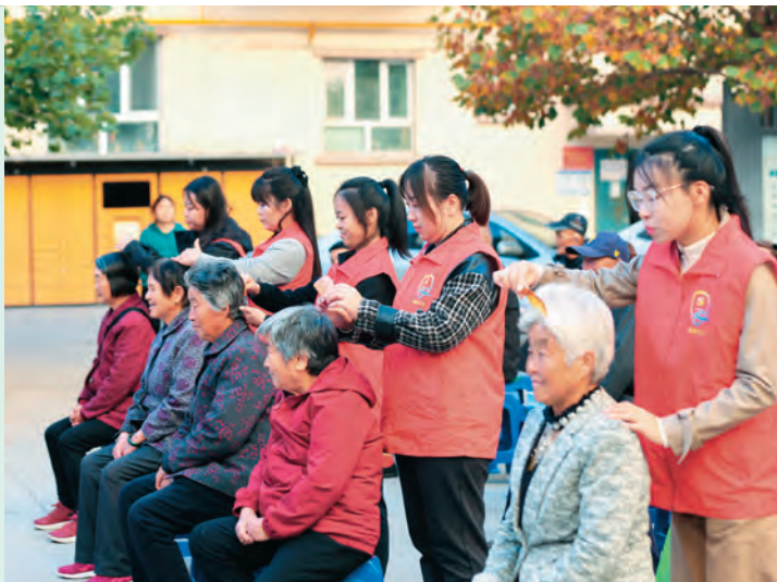
摆玲 在职党员到社区“双报到”,开展关爱老年人志愿服务活动。

参与治理搭建平台,激发治理效能。加入治理“攒”积分。开通积分申请功能,针对各年龄阶段居民特点,将自贸试验区政策学习、化解纠纷、传统美德等14类210项日常文明行为转为可量化、可评价数据指标,每项活动赋予不同分值,居民线上自主认领、线下参加具体活动获取积分,居民参与基层治理积极性显著提升,增强“主人翁”意识,使“小积分”激发新活力。优享服务“兑”积分。设置兑换积分功能,居民在线上惠民商城兑换果蔬肉蛋奶等200余种商品,线下兑换物业费减免、家电维修、汽车保养等近百种服务和权益,在社区康养和托幼中心兑换服务时长,为自贸试验区个体工商户企业引流,实现“商铺引人气、居民得实惠”双赢。评先选优“用”积分。将