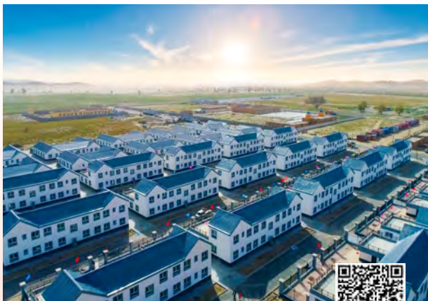
扫码观看视频 感悟初心使命