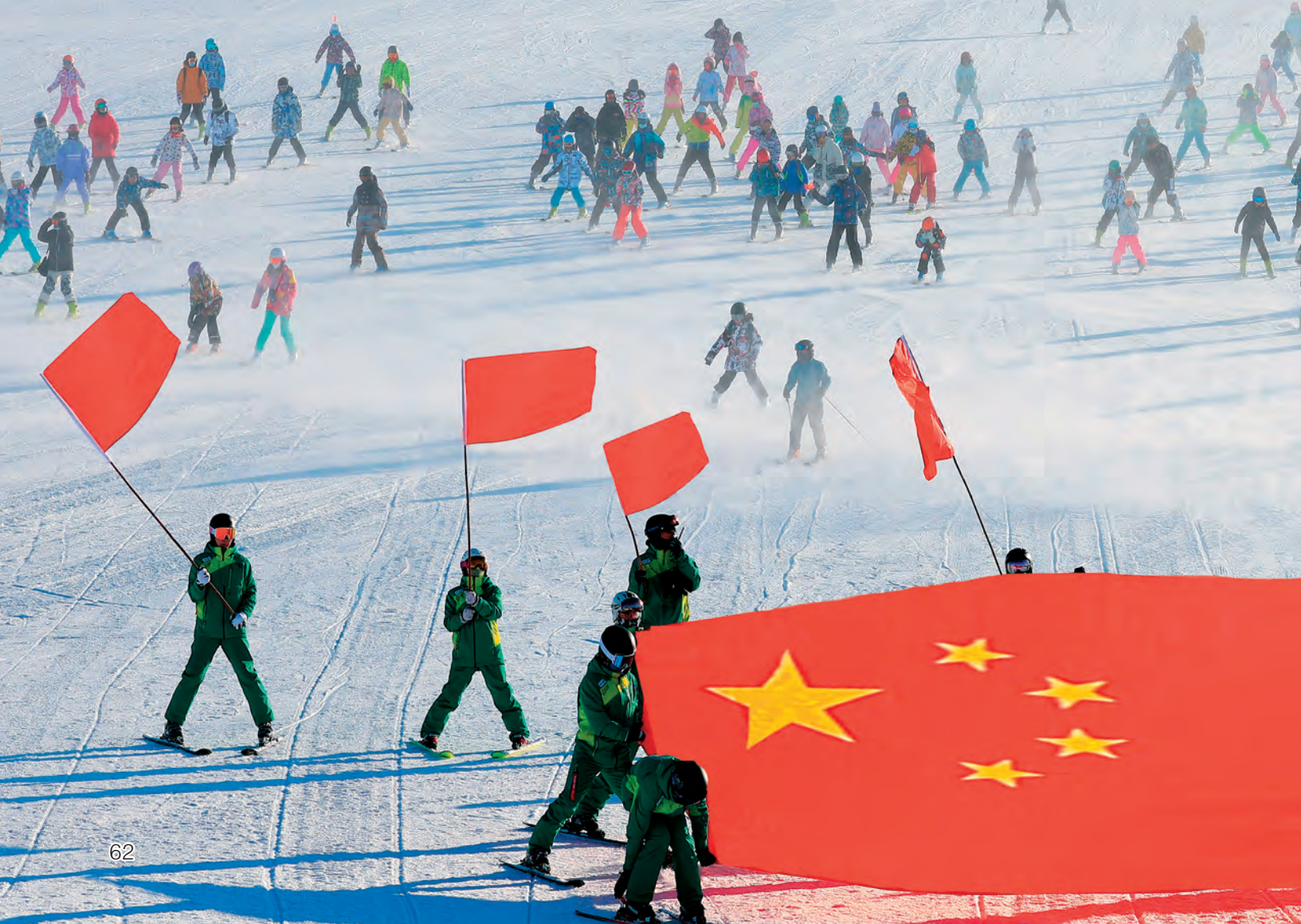
▼热烈隆重的阿勒泰滑雪节盛大开幕。