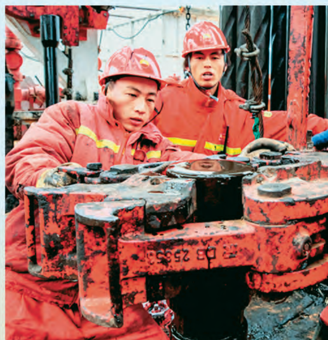
◀野马集团有限公司党委注重对青年党员政治引领,教育引导青年党员爱岗敬业,开拓创新,在企业改革发展中建功立业。