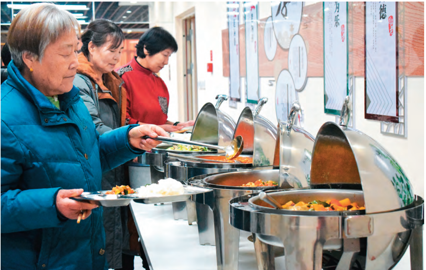
阜康市准东街道南华路社区成立养老服务中心,为老年人提供就餐服务。