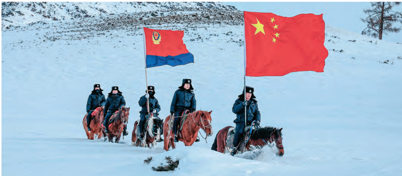
新疆出入境边防检查总站阿勒泰边境管理支队富蕴边境管理大队库卫边境派出所民辅警在边境前沿地带擎旗巡边。

紧盯“五个好”标准化规范化党支部创建重点工作任务,多方持续发力,确保“五个好”党支部创在实处、走在前列。组织领导到位,发挥市委“一线指挥部”作用,召开常委会和党建领导小组会,专题研究部署“五个好”党支部创建工作,将“五个好”标准化规范化党支部创建内容纳入理论学习中心组学习内容,认真学习创建标准、步骤、实效等工作要求,确保熟悉创建环节。包联指导到位,安排市级领导、科级领导全覆盖包联各支部,常态化开展联系指导,推动“五个好”党支部创建工作全领域提升,落实党(工)委书记联系指导、班子成员包联跟踪、后盾单位助力“三方”联动机制,定期召开协调会,帮助基层理清思路。激励保障到位,将创建工作纳入绩效指标,与晋升晋级、激励褒奖等挂钩,提拔重用“五个好”党支部书记,选树市级“五个好”党支部示范点,划拨专项经费助力晋位升级,激发创建热情,确保创建实效。(田春红)