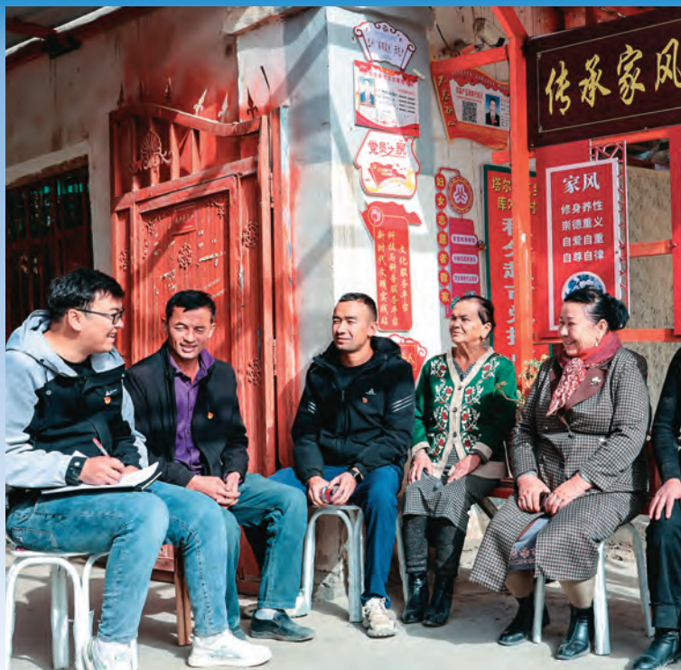
轮台县塔尔拉克乡库木墩村党员中心户联系党员群众开展政策宣传、收集