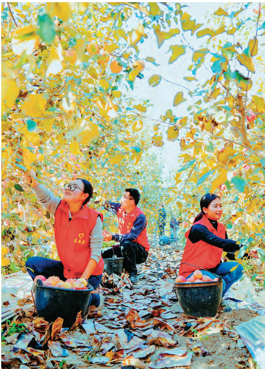
麦盖提县组织党员帮助种植户抢收苹果。