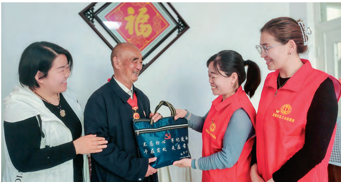
新疆塔城市和平街道新华社区为离退休老党员定做“党员学习小书包”,送去组织的关切和温暖。

充分发挥广大党员先锋模范作用,着力为应对特强寒潮提供坚强组织保证。迅速集结全州党员,鼓励投身紧急救助、捐赠物资、灾害防御等各项工作,在防范应对工作中担当作为。州县两级行政服务中心窗口、民生服务事项一线成立党员突击队121支,建立首问负责、办理反馈等机制,设立寒潮应对热线电话,实行24小时值班制度,确保群众诉求解决到位。组建党员先锋队、党员志愿者服务队,参与寒潮应对工作,采取“支部书记联系党小组长、党小组长联系党员、党员联系群众”方式,“地毯式”摸排辖区情况,确保群众情况掌握到位。驻村工作队党员干部第一时间返岗,奔赴工厂、牧区、种养区和群众家中,开展“敲门行动”,走访居民群众2.5万余人,做好取暖、用火、用电宣传等工作,帮助群众做好农业设施防雪防风加固、牛羊棚圈增温保暖加固等事项,确保群众安全温暖度过特强寒潮。(张敏)