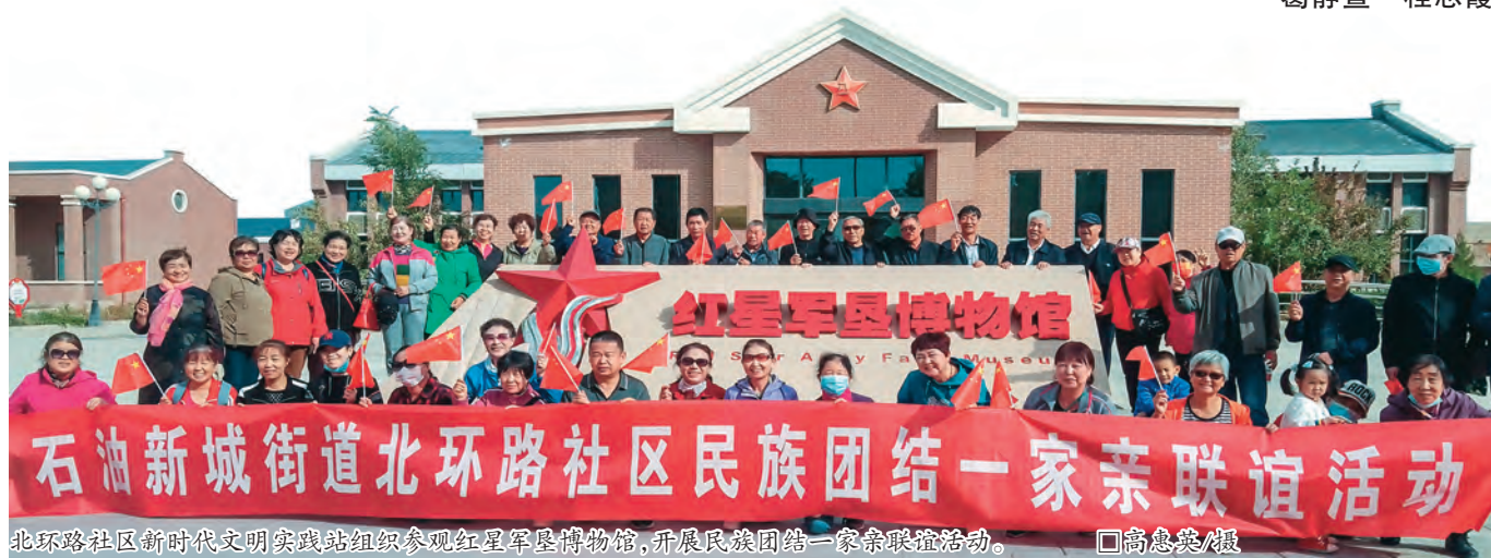
北环路社区新时代文明实践站组织参观红星军垦博物馆,开展民族团结一家亲联谊活动。

区党委结合“五个好”标准化规范化党支部创建工作,不断加强党组织规范化、标准化建设。健全第一书记着力管、党委书记带头抓、网格党支部书记具体抓的工作格局,充分发挥“优秀社区书记工作室”作用,把辖区非公党组织书记、物业经理、居民骨干等各支力量吸纳进工作室,发挥出谋划策作用,不断健全工作体系。坚持制度管人管事,严格落实“三会一课”、民主评议、组织生活会、党支部工作规则等,严格执行党组织议事决策、沟通协调、党费使用管理、党务公开等工作制度,促进党的生活制度化、党建工作规范化。进一步优化机构设置和职能配置,构建社区党组织-网格党支部-楼栋党小组-党员示范户纵向到底的四