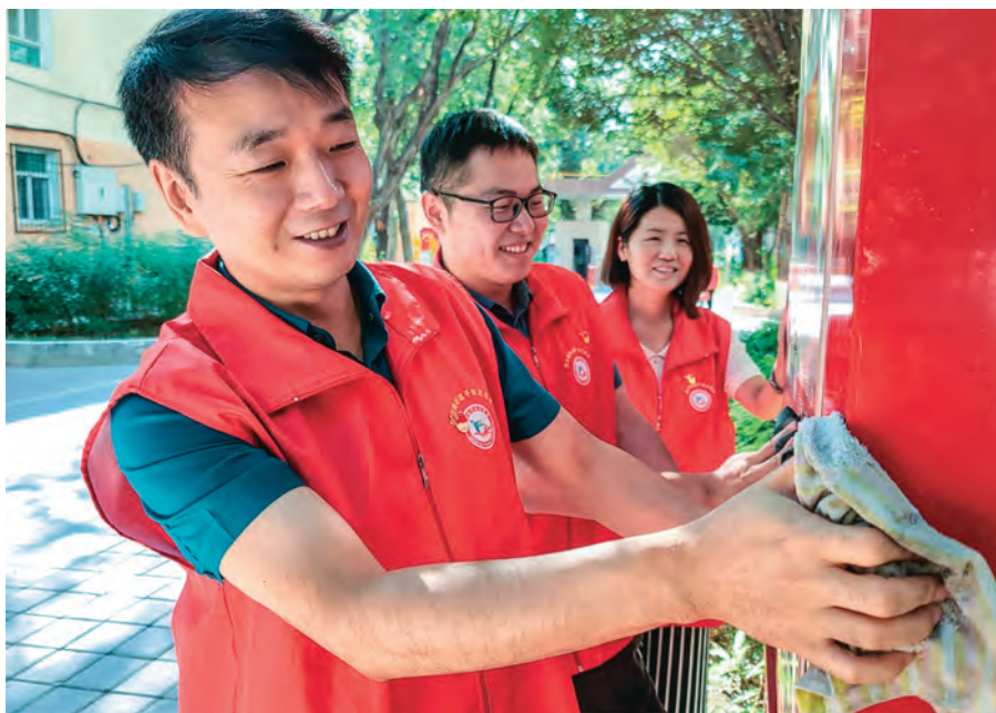
克拉玛依市党员在社区开展志愿服务。

强化教育培养。 坚持把思想教育贯穿发展党员全过程,做细做实日常培养教育工作,引导和帮助发展对象端正入党动机、提高思想觉悟。发挥党支部培养作用,结合开展学习贯彻习近平新时代中国特色社会主义思想主题教育,通过“三会一课”“党旗映天山”主题党日等活动,用好新疆黑油山干部教育培训