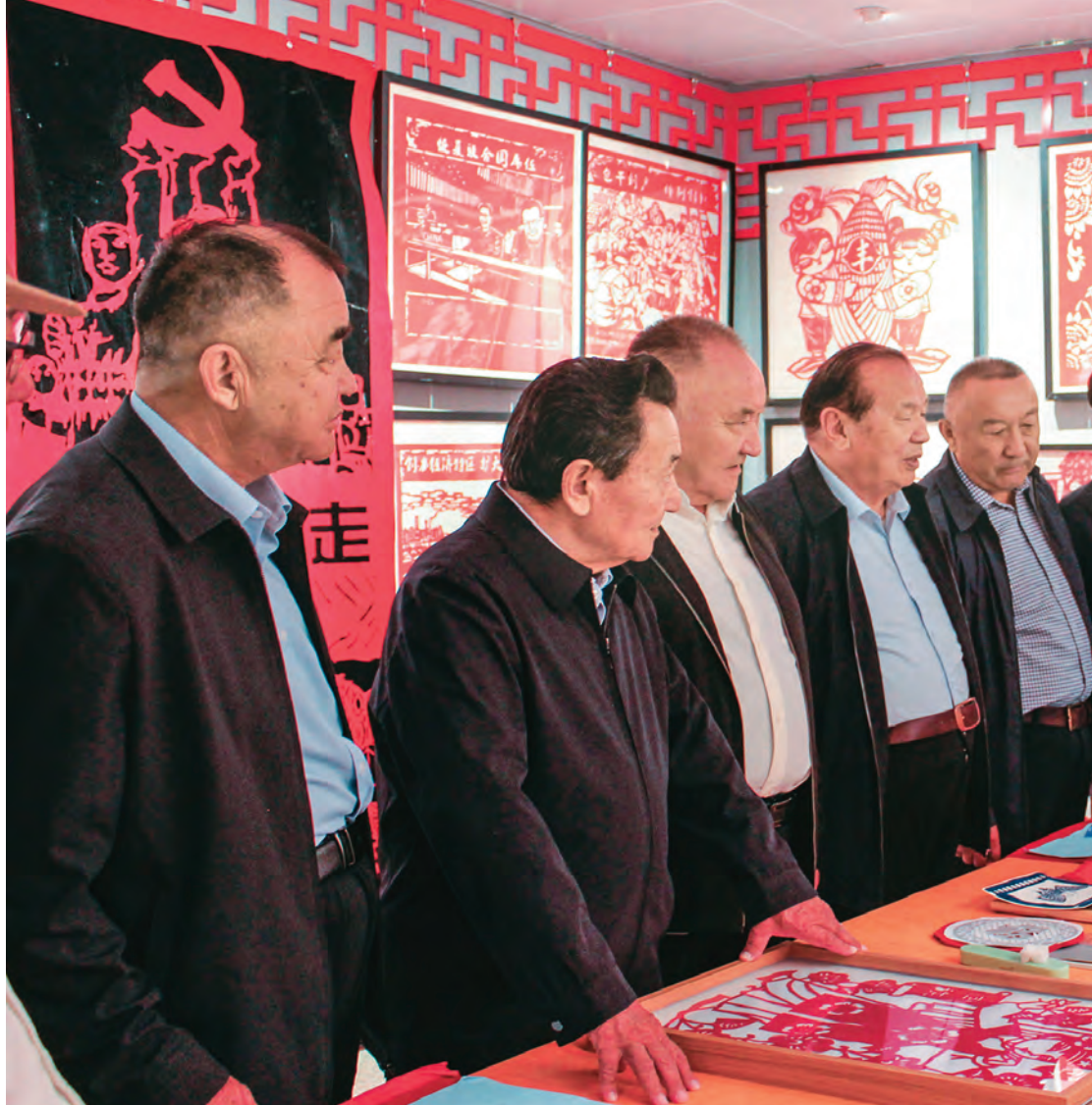
富蕴县委老干部局组织“额河银辉”夕阳红志愿者参观感受中华优秀传统文化。

自治区党委老干部局贯彻落实习近平总书记关于老干部工作重要论述和重要指示批示精神,引领全区老干部工作系统树立创新理念,科学谋划工作,推动新时代老干部工作高质量发展。