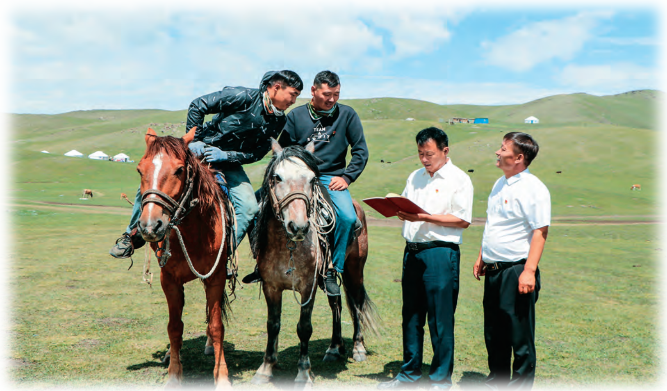
精河县八家户农场牧业二队党支部党员深入牧区为流动党员开展“上门送学”活动。