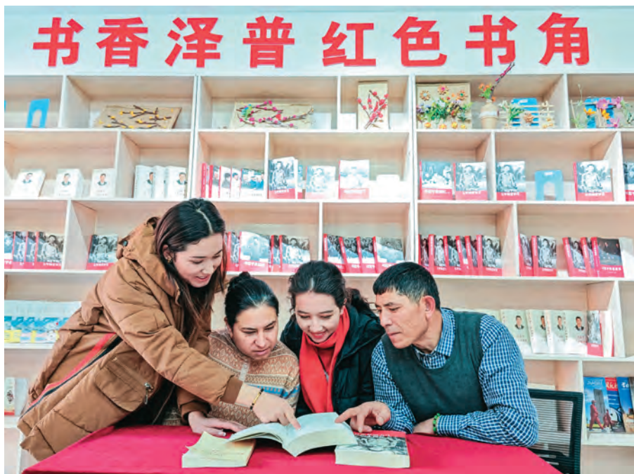
泽普县泽普镇喀拉萨社区组建党员志愿服务队,深入辖区宣传全民阅读活动。