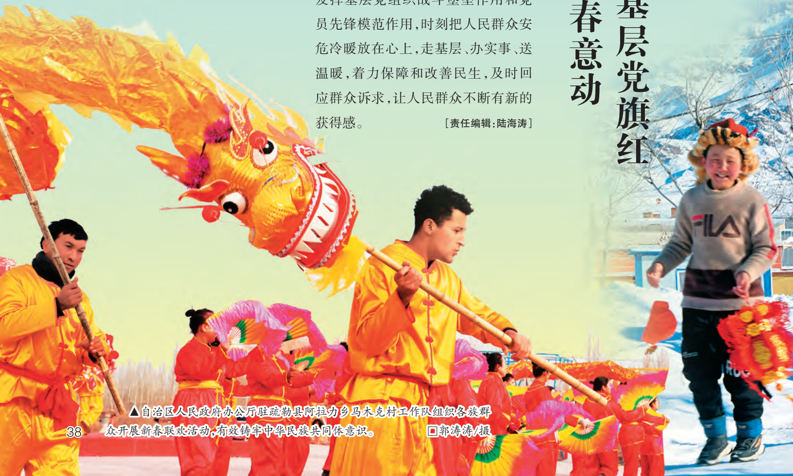
▲自治区人民政府办公厅驻疏勒县阿拉力乡马木克村工作队组织各族群众开展新春联欢活动,有效铸牢中华民族共同体意识。