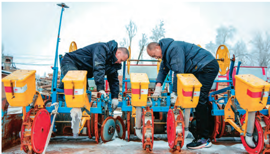
温泉县组建“党员先锋服务队”帮助农户检修农机。