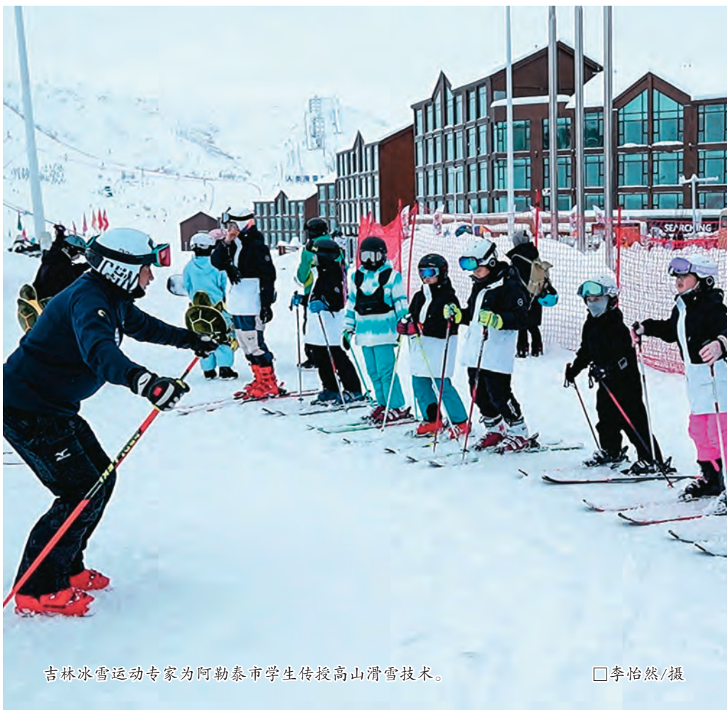
吉林冰雪运动专家为阿勒泰市学生传授高山滑雪技术。

育体育旅游新热点,发展寒地冰雪经济,推动受援地“冷资源”转化为“热经济”。积极献计献策。充分发挥“吉智寒地经济研究所”功能作用,采取个人自荐、组织推荐、公开