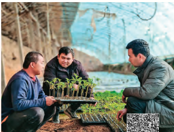
扫码观看视频 感受新春气象