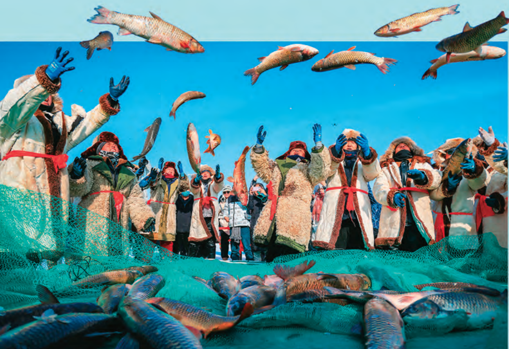
▲新疆博湖县博斯腾湖冬捕节已成为当地文化旅游产业的闪亮名片,助推农民吃上旅游饭,挣上旅游钱。