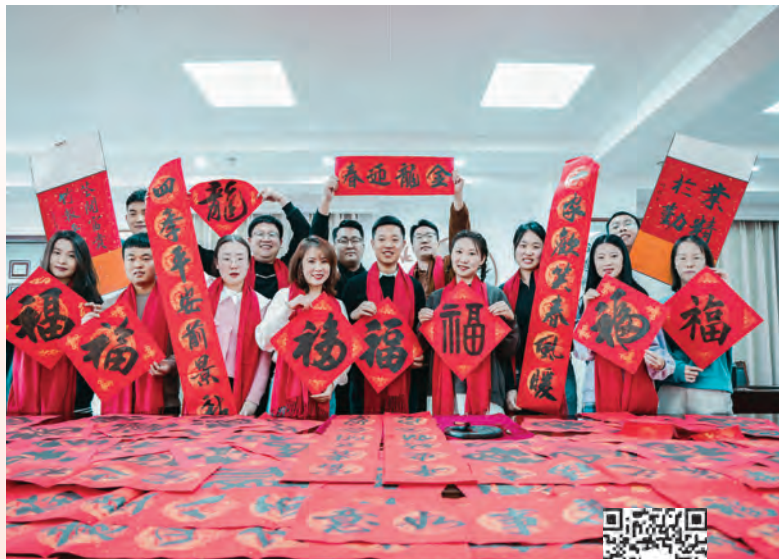
扫码观看视频 感受新春气象