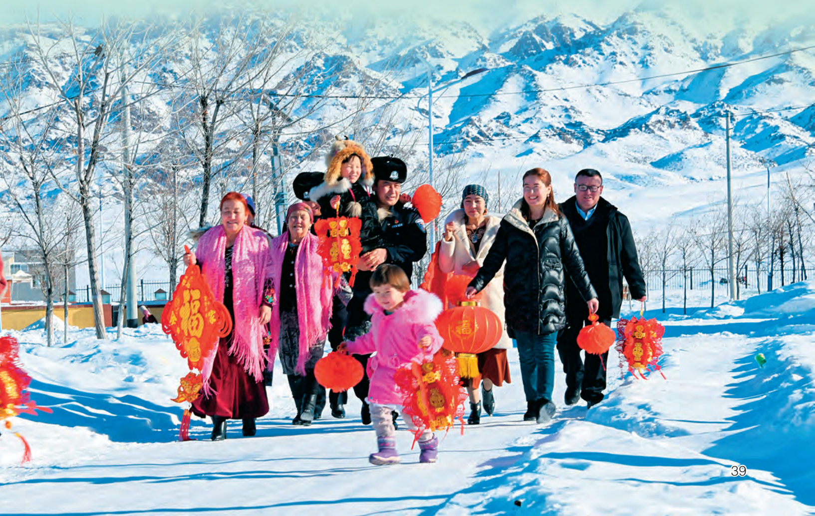
▼新疆昌吉边境管理支队库甫边境派出所民警走进牧民定居点,了解诉求,共度佳节。