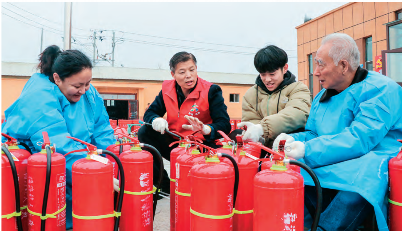
新疆福海县在职党员协助社区干部开展“灭火器进万家”活动。