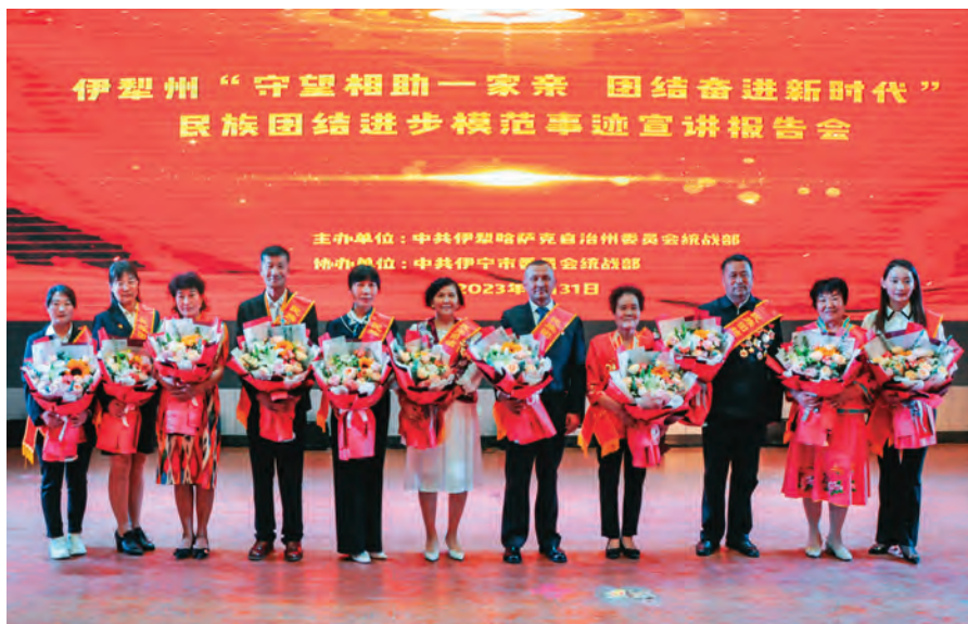
2023年5月31日,参加伊犁州民族团结进步模范事迹报告会的部分代表合影。