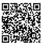
扫描二维码听音频 感受基层党员心声