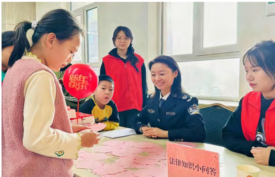
嵩山街街道办事处举办“青少年寒假普法游园会”,开展法治宣传教育。

坚持为民服务,以便捷、高效、优质、贴心的服务,推动化解劳动人事争议,切实解决群众“急难愁盼”问题。“一站式服务”暖人心。细化咨询、答疑、受理、调解等服务事项,