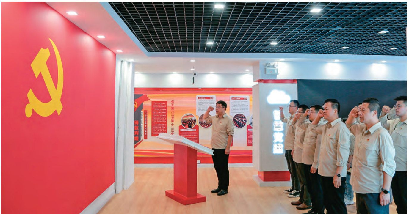
克拉玛依市水务公司举行新发展党员入党宣誓仪式。