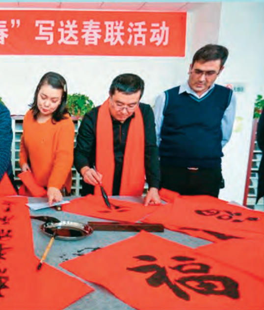
送春联活动,在欢乐祥和的节日气氛中,增进民族 □买买提艾力·艾尼瓦尔/摄