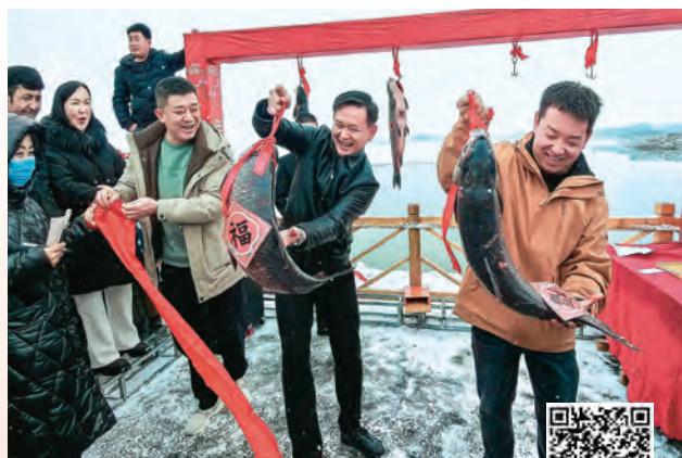
扫码观看视频 感受新春气象