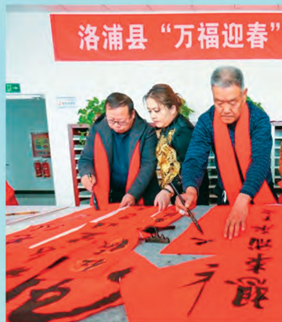
▲新疆洛浦县图书馆开展“万福迎春”写送春联活动,增进感情、促进民族团结。

春节期间,新疆各级党组织始终坚持以人民为中心的发展思想,充分发挥基层党组织战斗堡垒作用和党员先锋模范作用,时刻把人民群众安危冷暖放在心上,走基层、办实事、送温暖,着力保障和改善民生,及时回应群众诉求,让人民群众不断有新的获得感。