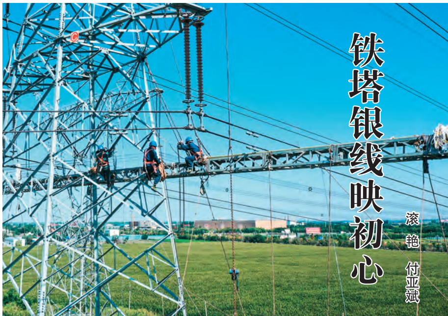
凤凰-乌北Ⅱ回750千伏输变电工程开展跨越施工作业。