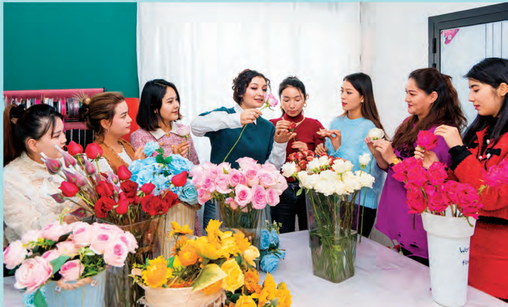
▲新疆乌鲁木齐市天山区黑甲山街道富康街南社区开展新年插花技能培训, 拓宽妇女就业渠道。