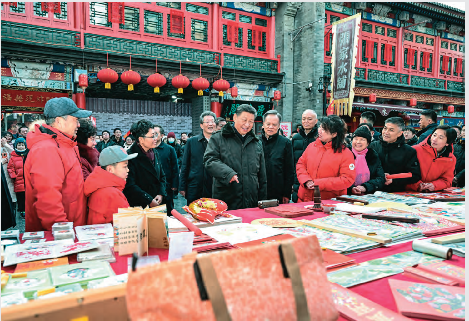
2月1日至2日,中共中央总书记、国家主席、中央军委主席习近平来到天津,看望慰问基层干部群众。这是1日下午,习近平在天津古文化街考察时,同店铺员工和现场群众互动交流。