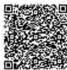
扫描二维码看视频 感受基层党员心声