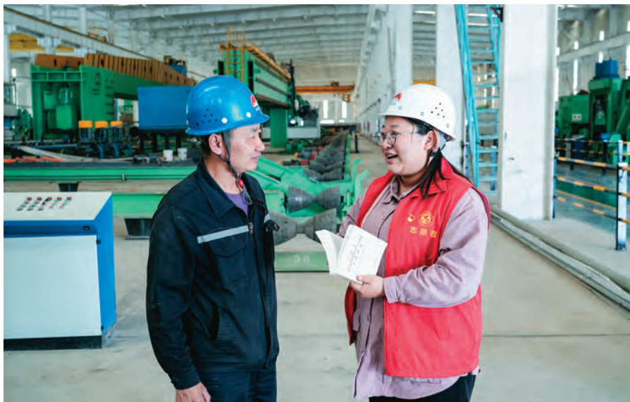
阿拉山口市委组织部党员到新博油气管道有限公司与流动党员交流了解参与组织生活情况。

开展“地毯式”摸排,摸清流动党员基本情况,实行精准管理,实时更新流动党员台账,确保流动不离党、流动不流失。做好精准摸排,针对流动党员流出地域宽、分布行业广等特点,以基层党组织为单位,以党员党组织关系所在为依据,开展“党员找组织、组织找党员、党员找党员”集中摸排活动,通过上门走访、电话联系、网格排查等方式,对流入、流出党员仔细排查,形成“一支部一表格、一村一名册”,实时详细掌握基本情况。设置专人管理,建立县乡村三级备案信息库,以“平时收集、集中采集、按月汇总、季度更新”为主线,安排专人及时掌握流动去向、流动原因、流动时间、流动类型等信息,做好更新和维护,县乡两级强化指导监督,不定期开展抽查核实,切实做到底数清、情况明。强化制度建设,把流动党员教育管理服务工作纳入基层党建目标考核体系,建立流动党员定期向党组织报