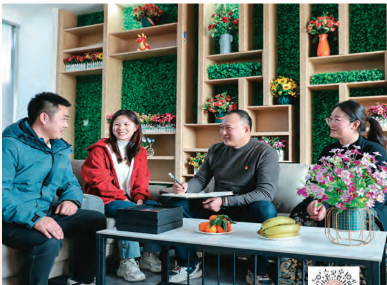
扫码观看视频 感受新春气象