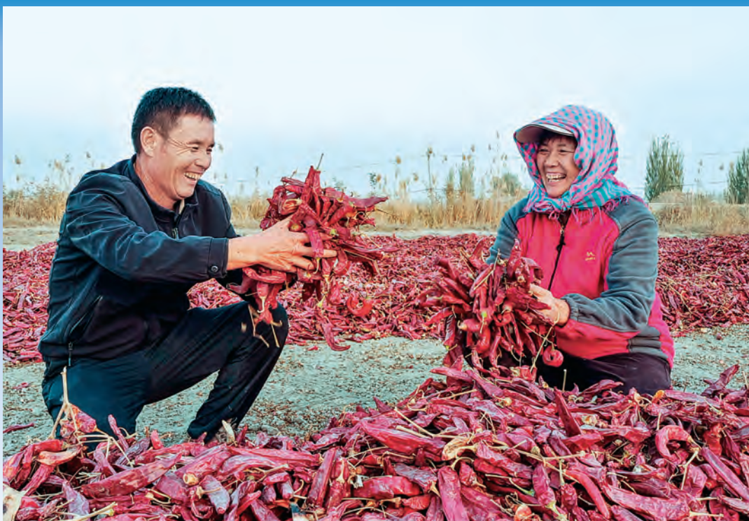
博湖县塔温觉肯乡科克莫敦村党员致富带头人和辣椒种植户分享丰收的喜悦。