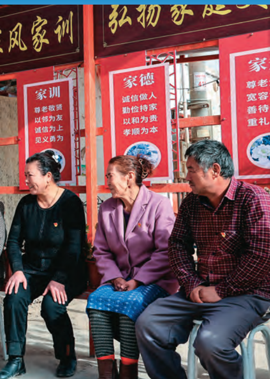
收集民情民意、协商解决问题座谈会。□冯涛涛/摄

距离、巴音郭楞日报、白天鹅网(巴州党建网)等平台展播宣传,教育引导党员践初心、作表率、树形象。销号管理取实效。推行党员联系群众“敲门行动”,坚持“家家党员联、户户见党员”,组织党员联系(中心)户包