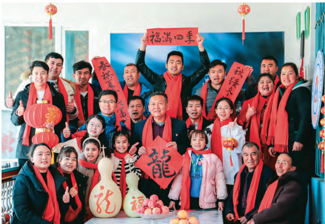
自治区人民政府办公厅驻疏勒县阿拉力乡马木克村工作队开展迎新春活动。