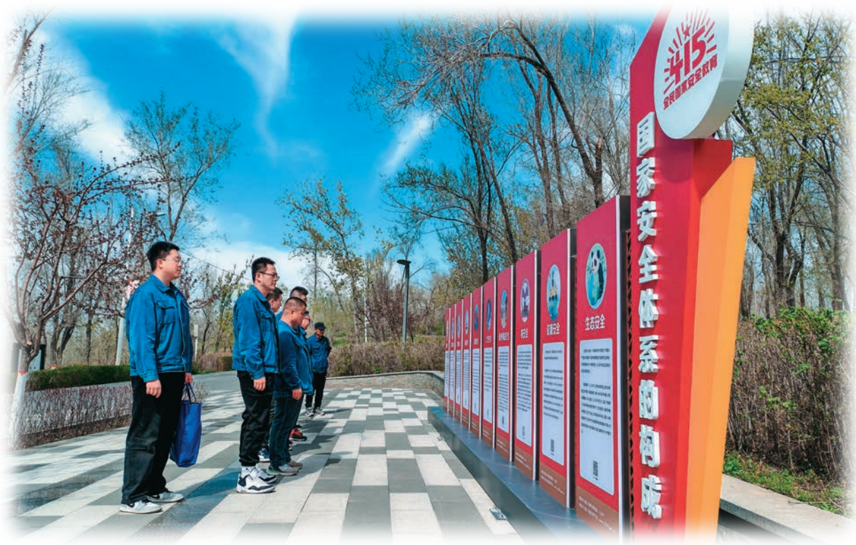
乌鲁木齐水业投资发展集团有限公司排水公司党支部组织党员干部开展“国家安全观教育学习”主题活动。

专题课堂原汁原味学,举办党纪学习教育专题读书班,将习近平总书记关于全面加强党的纪律建设重要论述作为重点学习内容,部机关县级领导干部率先学,各级党员干部同学共悟,推动党纪学习教育从浅层灌输向深层理解转变。研讨课堂交流互动学,紧扣“六项纪律”,开设党纪学习教育研讨课,列出专题,安排组工干部交流研讨,检视存在的问题和不足,引导组工干部密切联系岗位职责,畅谈学习教育感悟,推进党纪学习教育内化于心、外化于行。实践课堂融会贯通学,开设组工干部“公审课堂”,邀请派驻纪检组公开审理党员干部违纪案件,组织重点科室、岗位干部模拟审理,让党员干部“零距离”接受警示教育,推动党纪学习教育见行见效。(谈中亮)