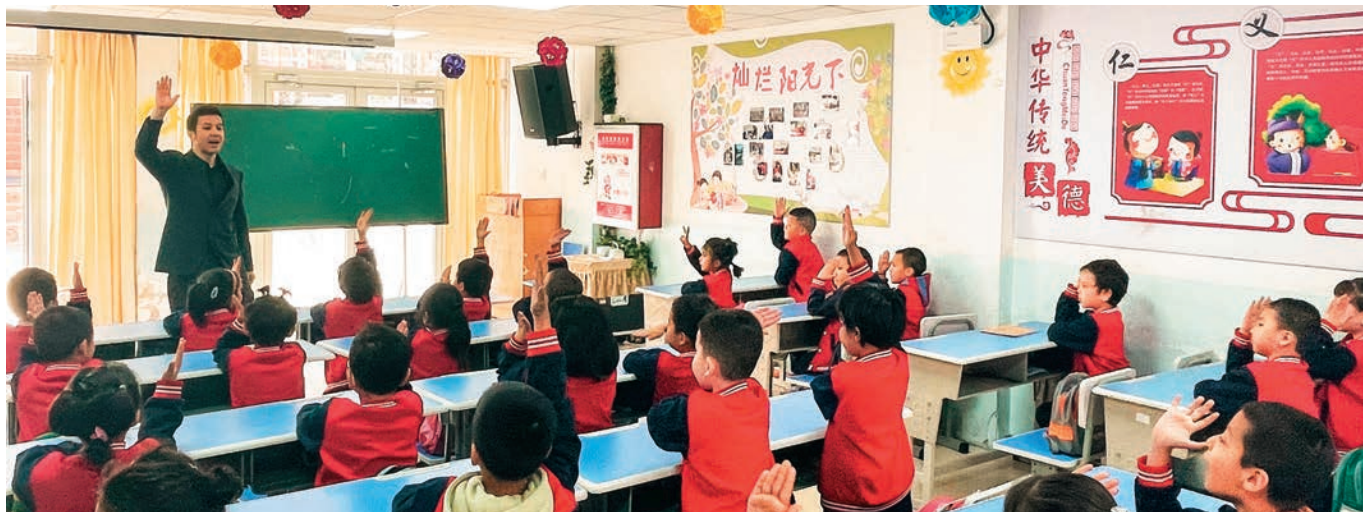
新居社区为辖区流动人口学龄前儿童提供托幼服务。