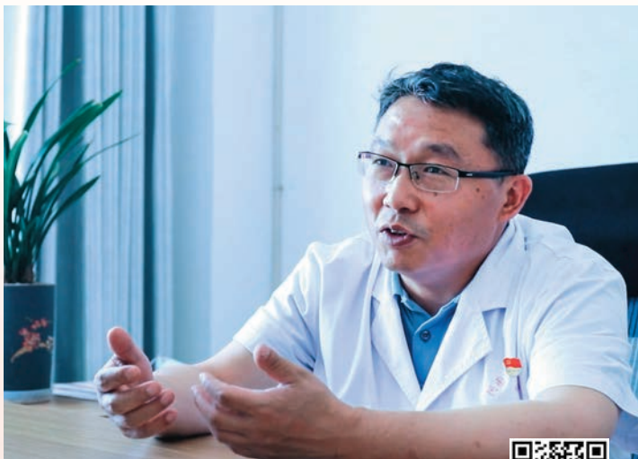
扫码观看视频 凝聚人心力量