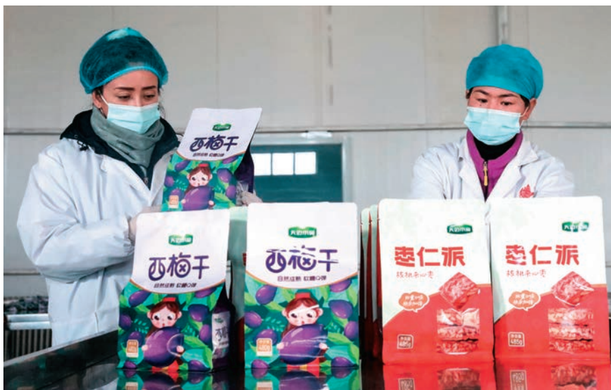
且末县技工学校学生在且末小宛有机农产品有限责任公司开展实训。