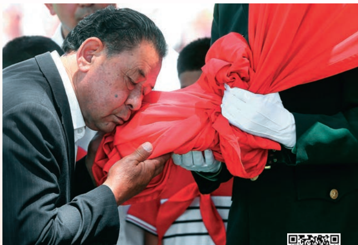
扫码观看视频 凝聚人心力量