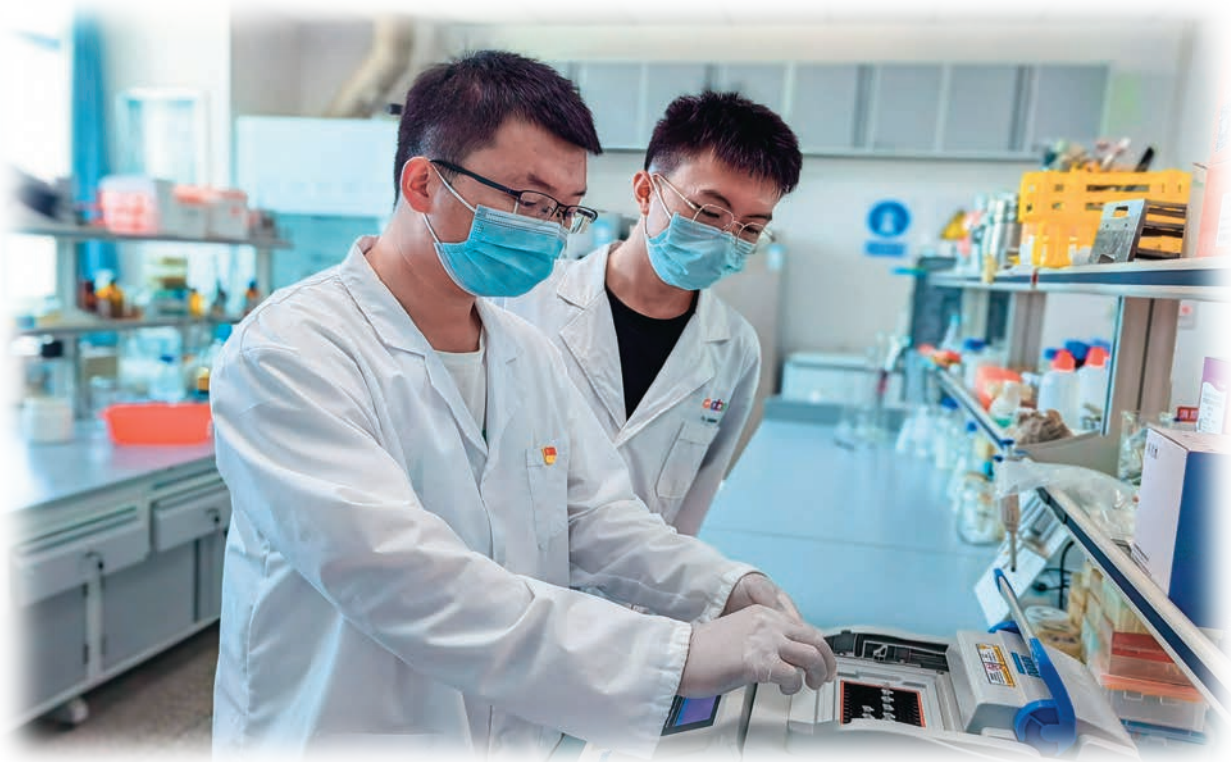
新疆特克斯县实施乡土人才雏雁计划,助力育强乡土技能人才。