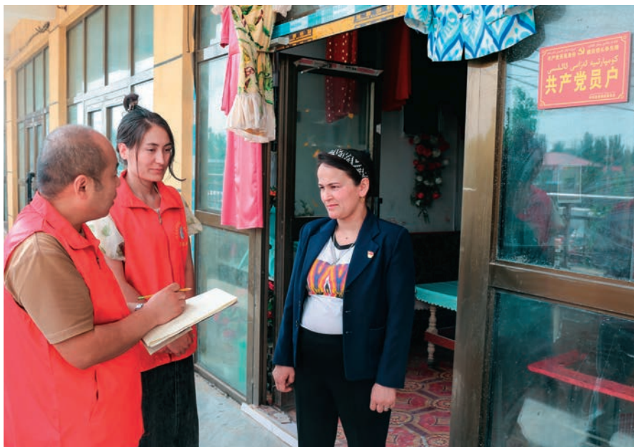
党支部党员志愿者上门了解党员经营户诚信经营情况,征求营商环境意见建议。