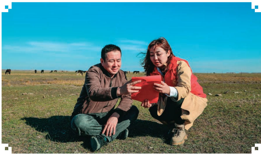
裕民县吉也克镇新录用公务员深入库鲁斯台草原宣讲生态环境保护政策。□焦剑奇/摄

压实担子促成长。 坚持把导师帮带作为新录用公务员历练成长、提升能力的重要载体,通过以老带