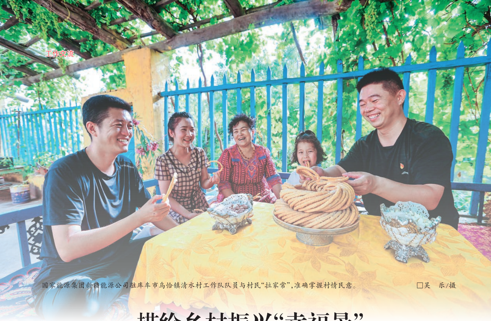
国家能源集团新疆能源公司驻库车市乌恰镇清水村工作队队员与村民“拉家常”，准确掌握村情民意。