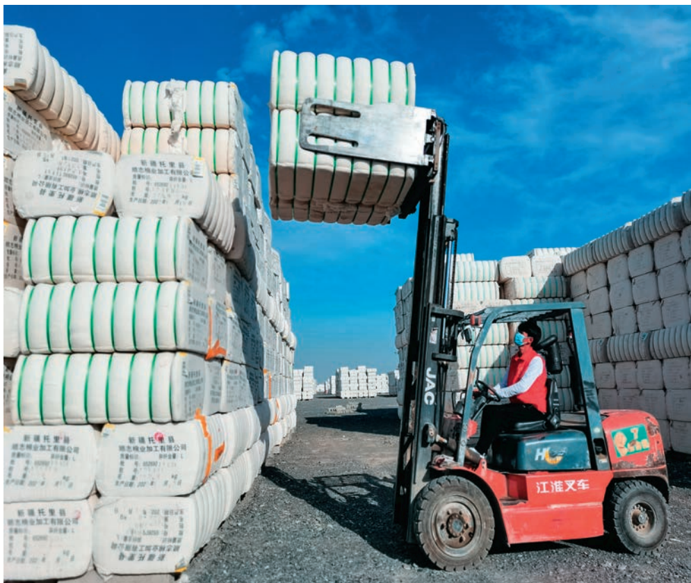
奎屯新亚科工贸有限公司工人正在搬运棉包。