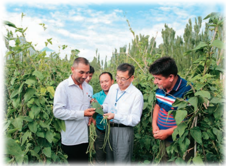
乌恰县党员干部深入田间地头帮助解决实际问题。

县级领导牵头抓总。严格落实县级领导包联村(社区)制度,依托党纪学习教育、日常工作指导等,开展基层调研18场次,大力实施老旧小区改造等重点民生项目,发现解决难点问题,完成民生实事391件,以抓好“关键少数”带动“绝大多数”,有效解决群众难题、化解信访积案。部门骨干攻坚克难。推动教育、医疗、农业、畜牧等13个行业部门50余名经验丰富的科级领导干部深入一线现场办公、推动任务落实,主动承接情况较为复杂、矛盾较为激烈、任务较为艰巨的重点难点工作,实现走在前、作表率,做到示范带动。年轻干部开拓创新。