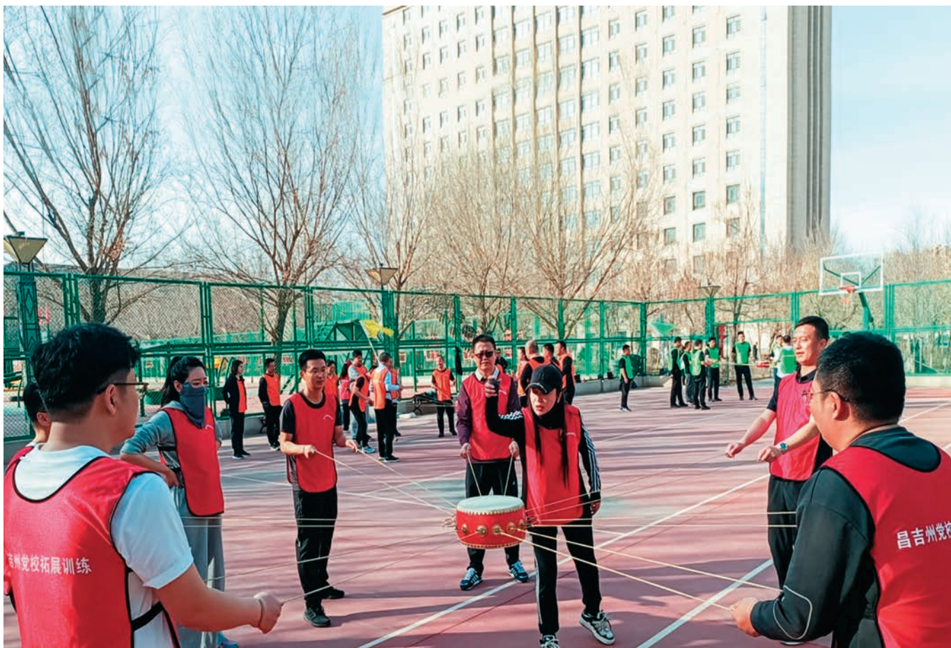
昌吉回族自治州创新干部教育培训方式,组织在州党委党校学习的中青班干部学员开展素质拓展活动。