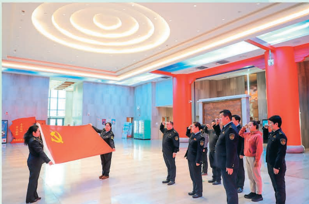
▲新疆乌鲁木齐市国际道路运输管理局组织干部开展“铸牢中华民族共同体意识”主题党日活动。