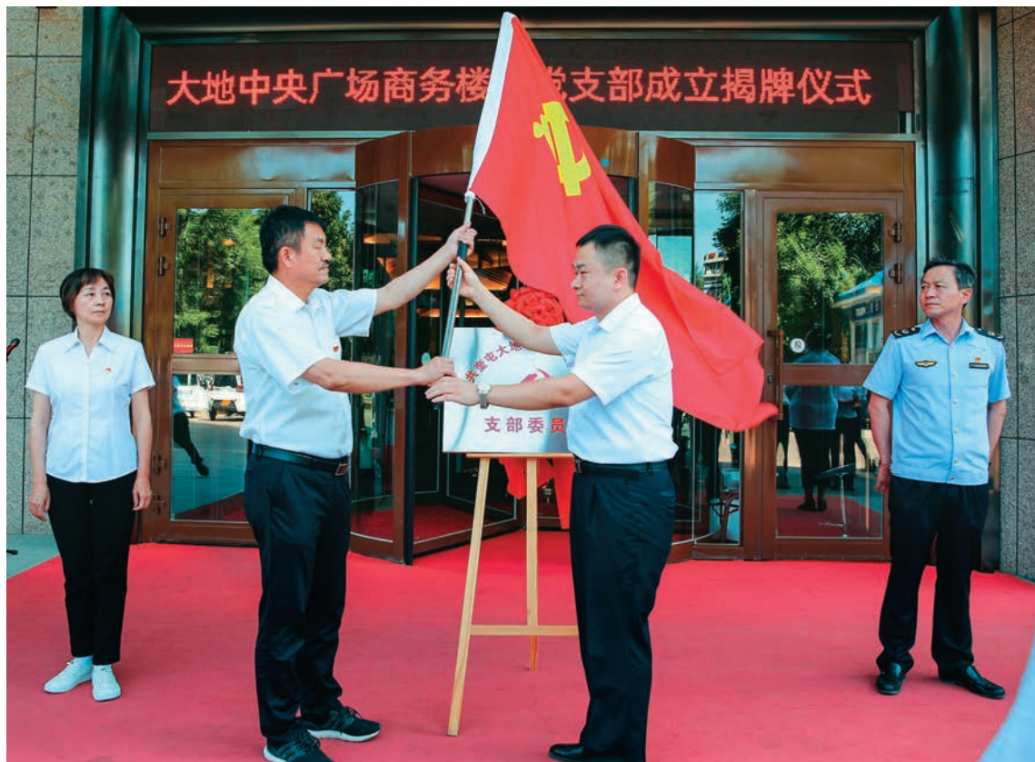
奎屯市委“两新”工委为大地中央商务楼宇党支部授旗。