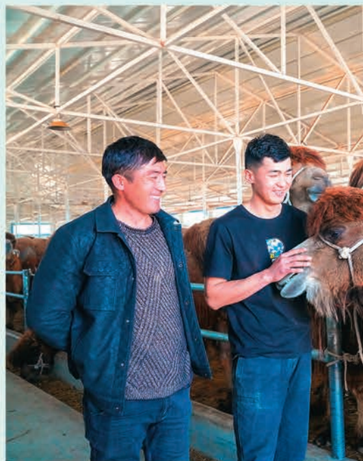
▲新疆霍城县年轻干部进农家、访民情、解难题，在