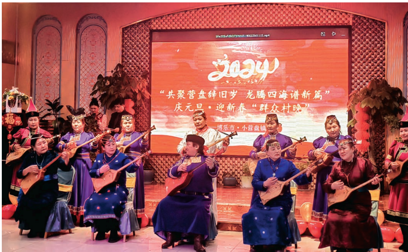
博乐市小营盘镇举办“民族团结一家亲”和民族团结联谊活动。