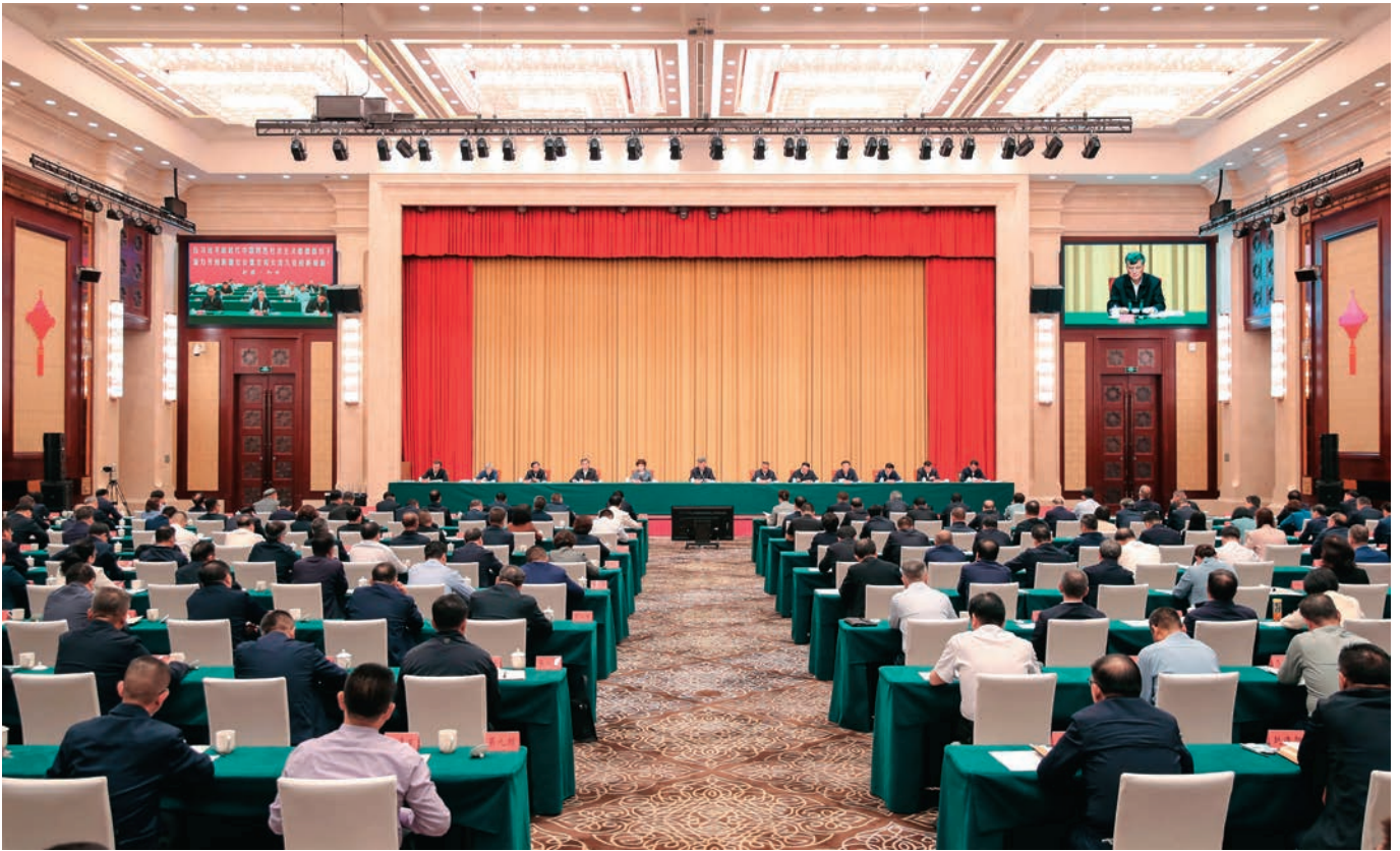
5月14日,自治区党纪学习教育警示教育会在乌鲁木齐召开。自治区党委书记马兴瑞出席会议并讲话。