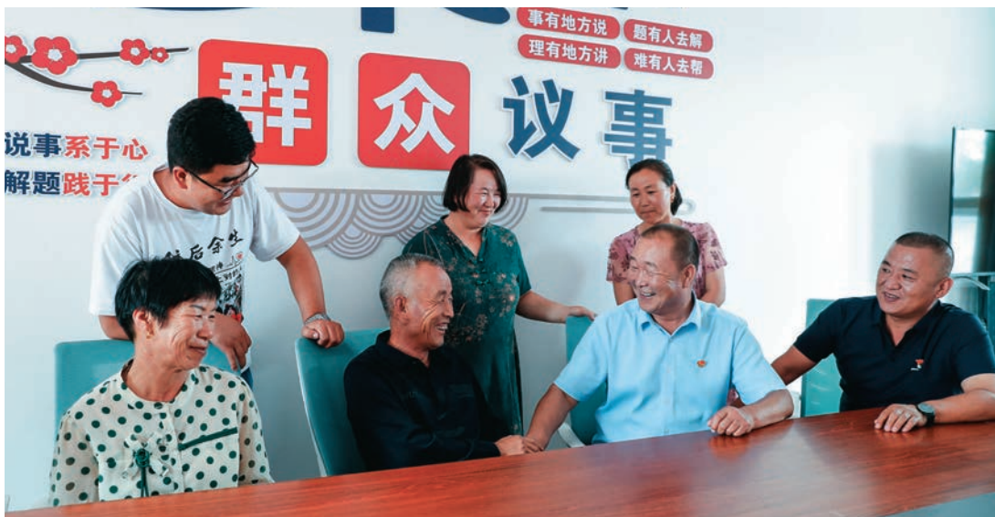
尼勒克县驻村干部手把手帮带村干部。