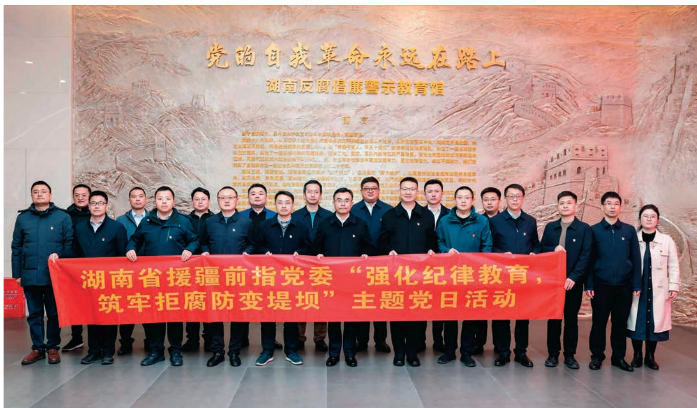
湖南省援疆前方指挥部党委开展“强化纪律教育·筑牢拒腐防变堤坝”主题党日活动。