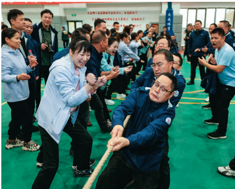
湖南省第十批援疆干部在吐鲁番石榴体育场举办拔河比赛。

通过搭平台、展才能、优服务等措施,全力保障援疆干部人才发挥作用,凝聚人心力量,激发干事热情。搭建干事平台。根据援疆干部工作经历、专业特点、能力素质等因素,按照“人岗相适、人事相宜”原则,安排到不同领域岗位,任实职、分实工、担实责。举办援疆干部进疆培训班,采取“集中授课+外出调研+经验交流”模式,帮助援疆干部迅速进入状态、尽快转变角色,接好对口援助“接力棒”。做实工作保障。协调受援单位提前安排办公场所,配全办公设备,保障用水、用电、用网;入住集安居办公、学习交流等功能于一体的“人才小区”;突出关心关爱。建立健全健康体检、医药费报销、购买人身意外保险、节假日慰问和谈心谈话等制度,掌握情况,疏导情绪,增进团结;妥善解决好子女就学、住房医疗、社会保障等实际问题;成立8个兴趣小组,定期举办运动会和文艺晚会,丰富业余生活,营造“一家人、一条心、一起干、一块甜”的团队文化,为援疆干部发挥作用提供良好条件。