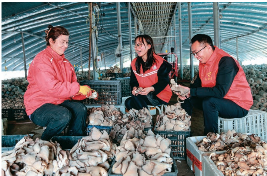
阿瓦提县财政局驻塔木托格拉克镇玉斯屯克阿热勒村工作队组织党员志愿者帮助村民采收蘑菇。

发挥作用,扎实开展“民族团结一家亲”“老有所为,永跟党走”“一老一小”等形式多样的群众性文体活动,促成民心由“散”到“聚”,推动治理见实效。