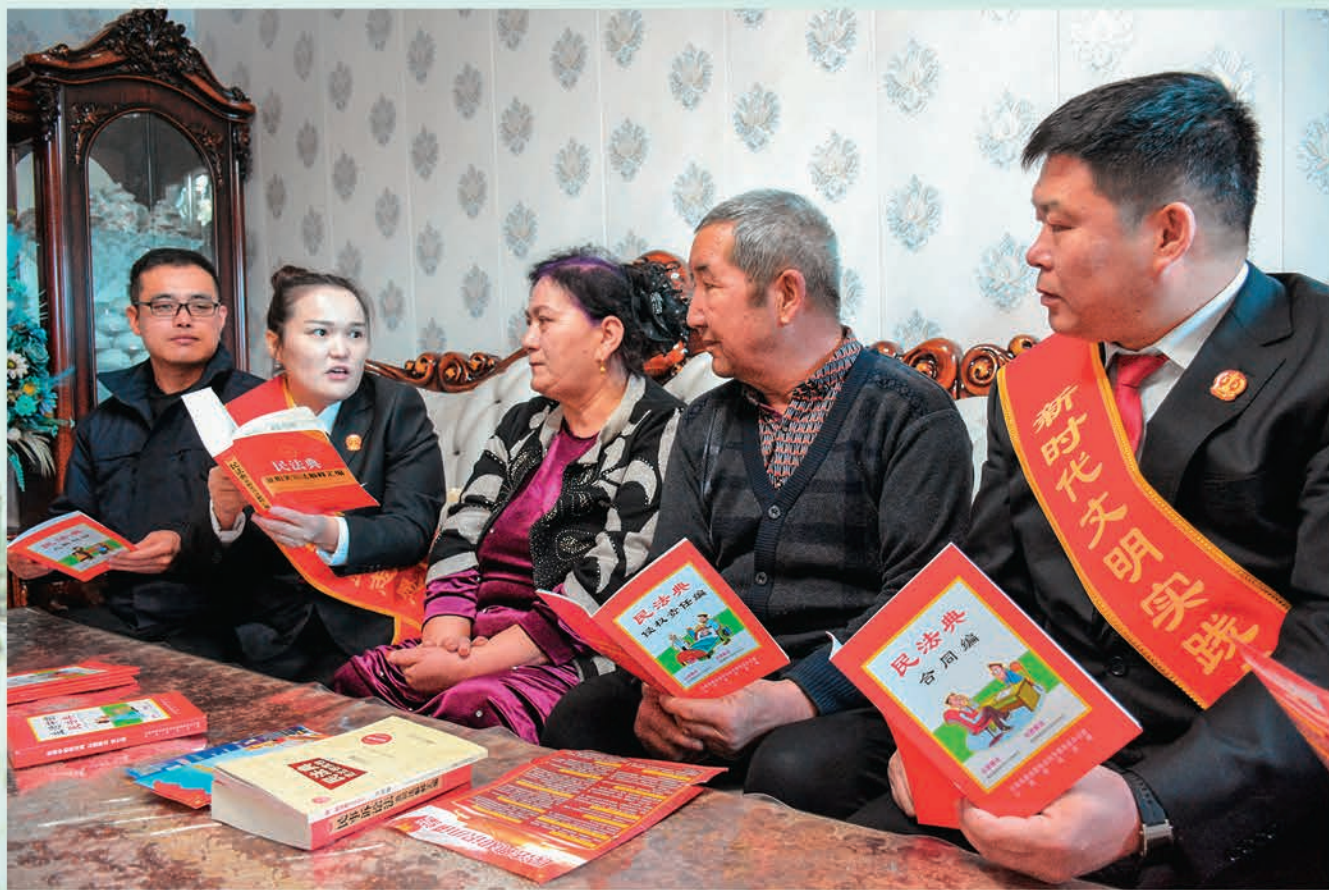
▲新疆沙湾市人民法院成立普法宣讲小分队开展“普法宣传进万家”活动。