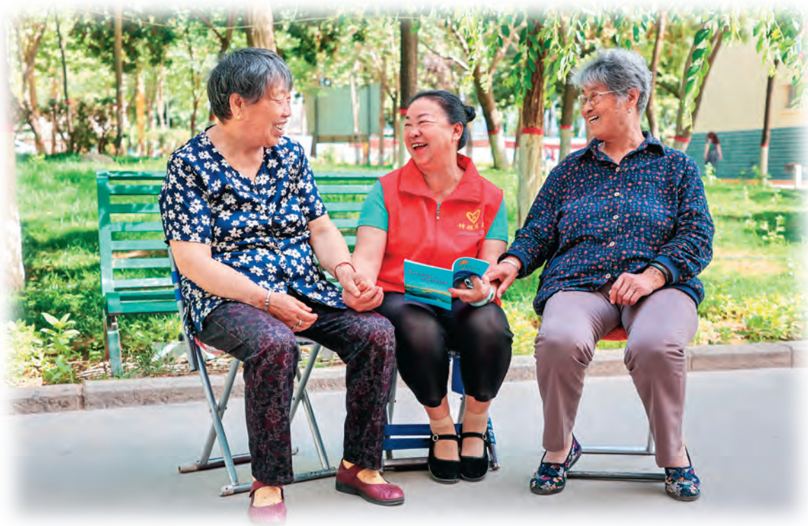
新疆库车市新城街道干部在文化路社区走访,听取群众意见建议。