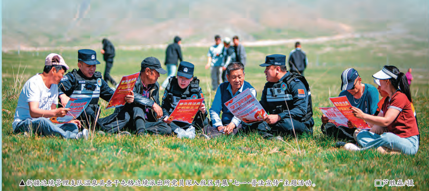
▲新疆边境管理支队温泉县查干屯格边境派出所党员深入牧区开展“七一·普法宣传”主题活动。