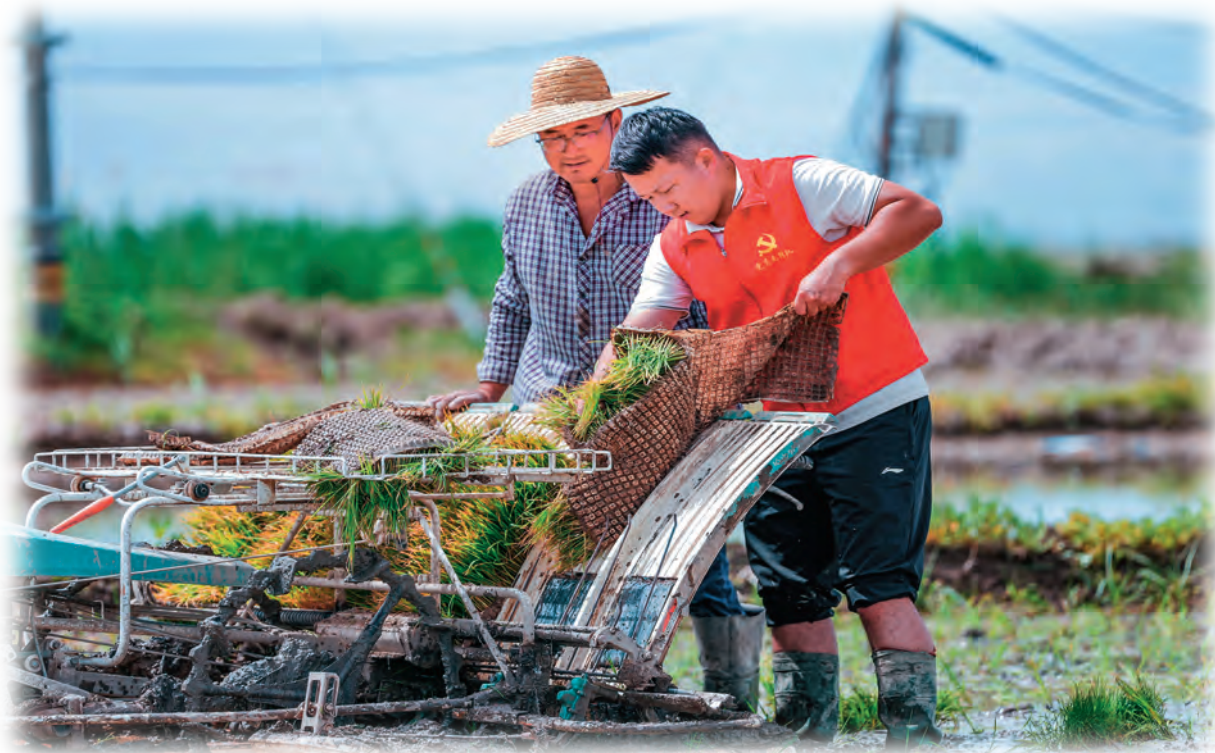
新疆乌苏市“红链先锋队”党员志愿者帮助农户种植水稻。