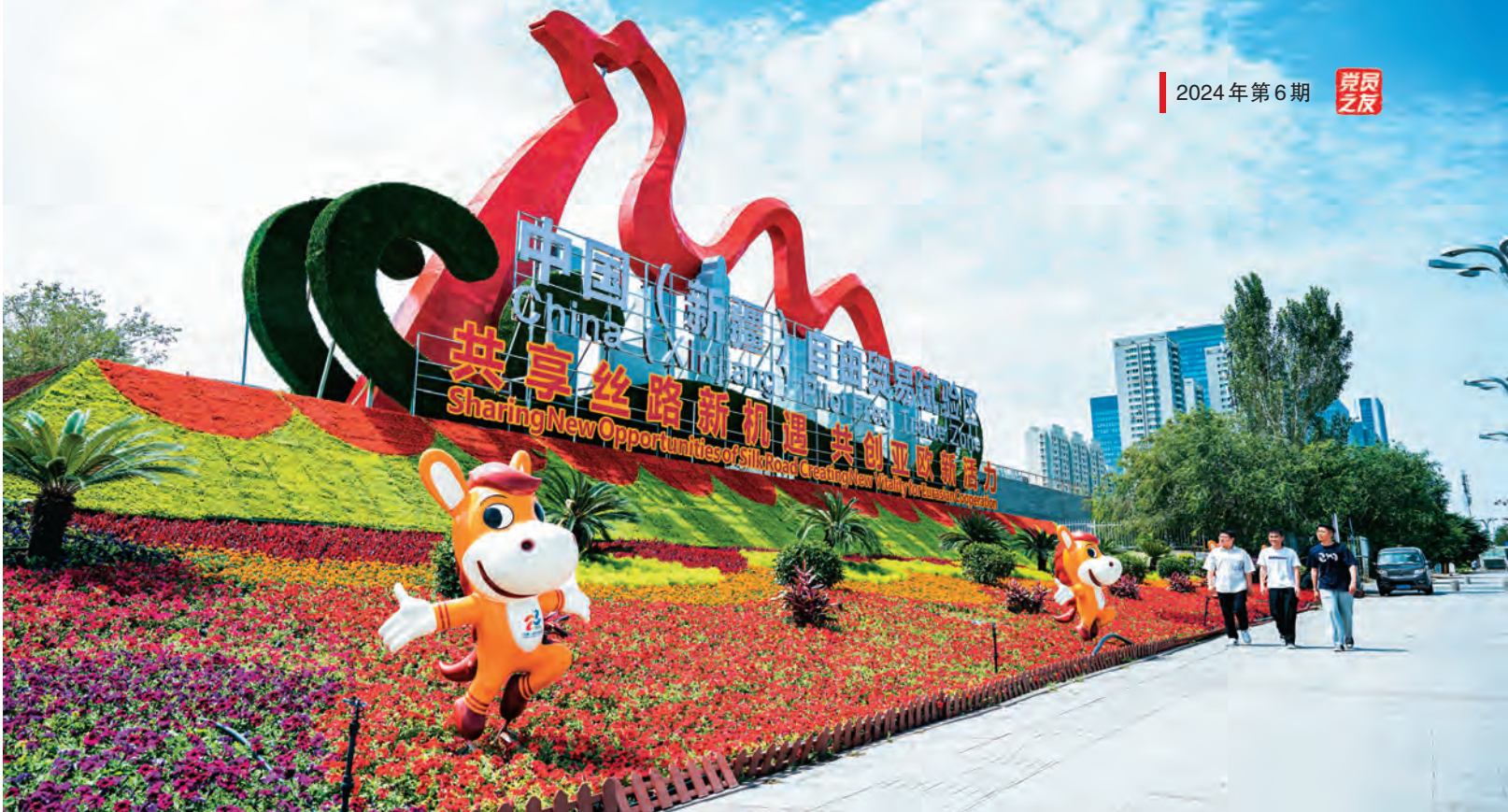
“七一”前夕,第八届中国—亚欧博览会在乌鲁木齐市隆重召开。