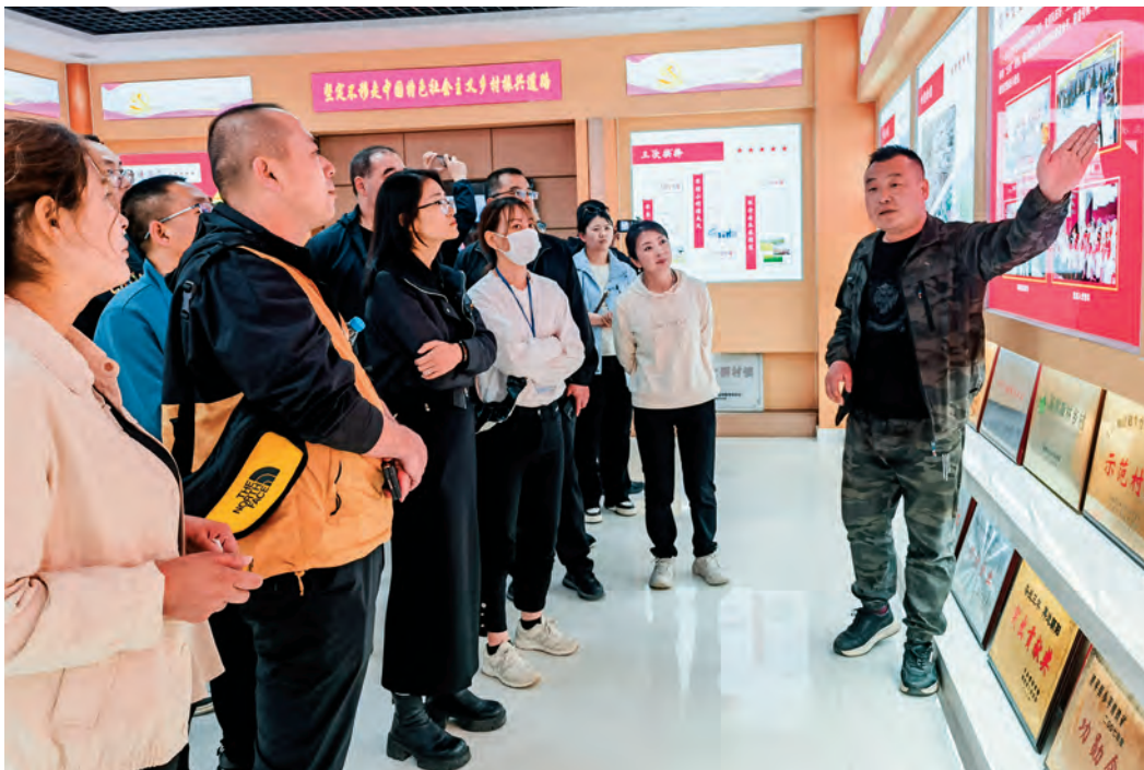
乌苏市围绕考核中发现的短板弱项,选派60余名干部参加业务能力提升培训。