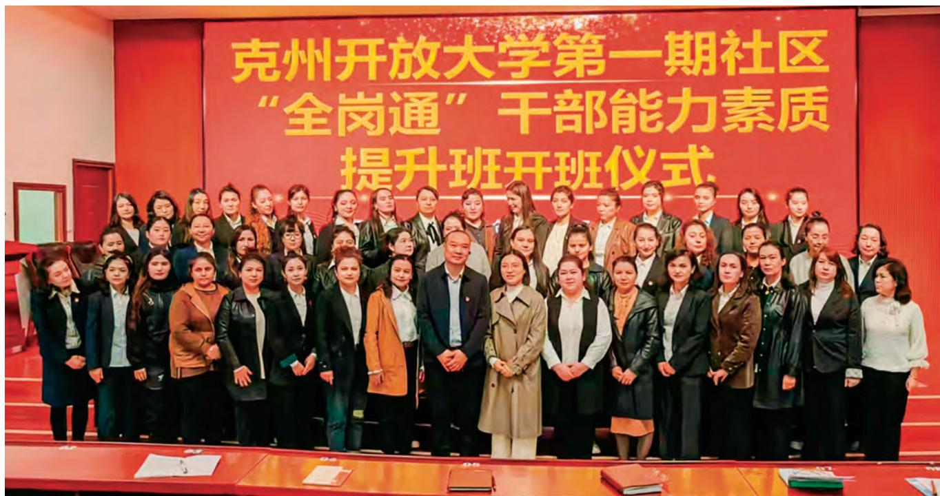
克州开展社区工作者“全岗通”业务培训。