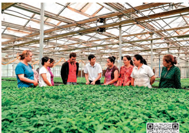
扫码观看视频 展现人才风采