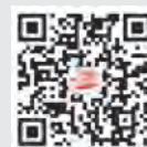
《党员之友》 电子期刊(昆仑网)