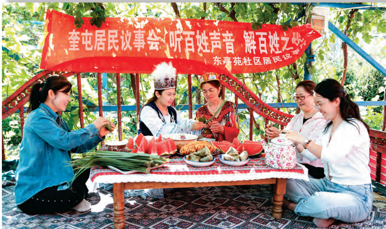
奎屯市国家税务局驻东亭苑社区工作队队员与小区居民共度中华传统节日。

的居委会、警务室、城管工作站、业委会、物业“1+5”专业队伍,支撑社区核心工作。发挥示范作用,逐社区逐村制定基层治理问题清单、责任清单、整改清单,开展“三学三亮三比”、无职党员“设岗定责”活动,采取承诺、亮诺、践诺、述诺、评诺“五诺”方式,推动“力量在一线汇聚、问题在一线解决”。乌鲁木齐东路街道东亭苑社区党总支开办“红色教育、国