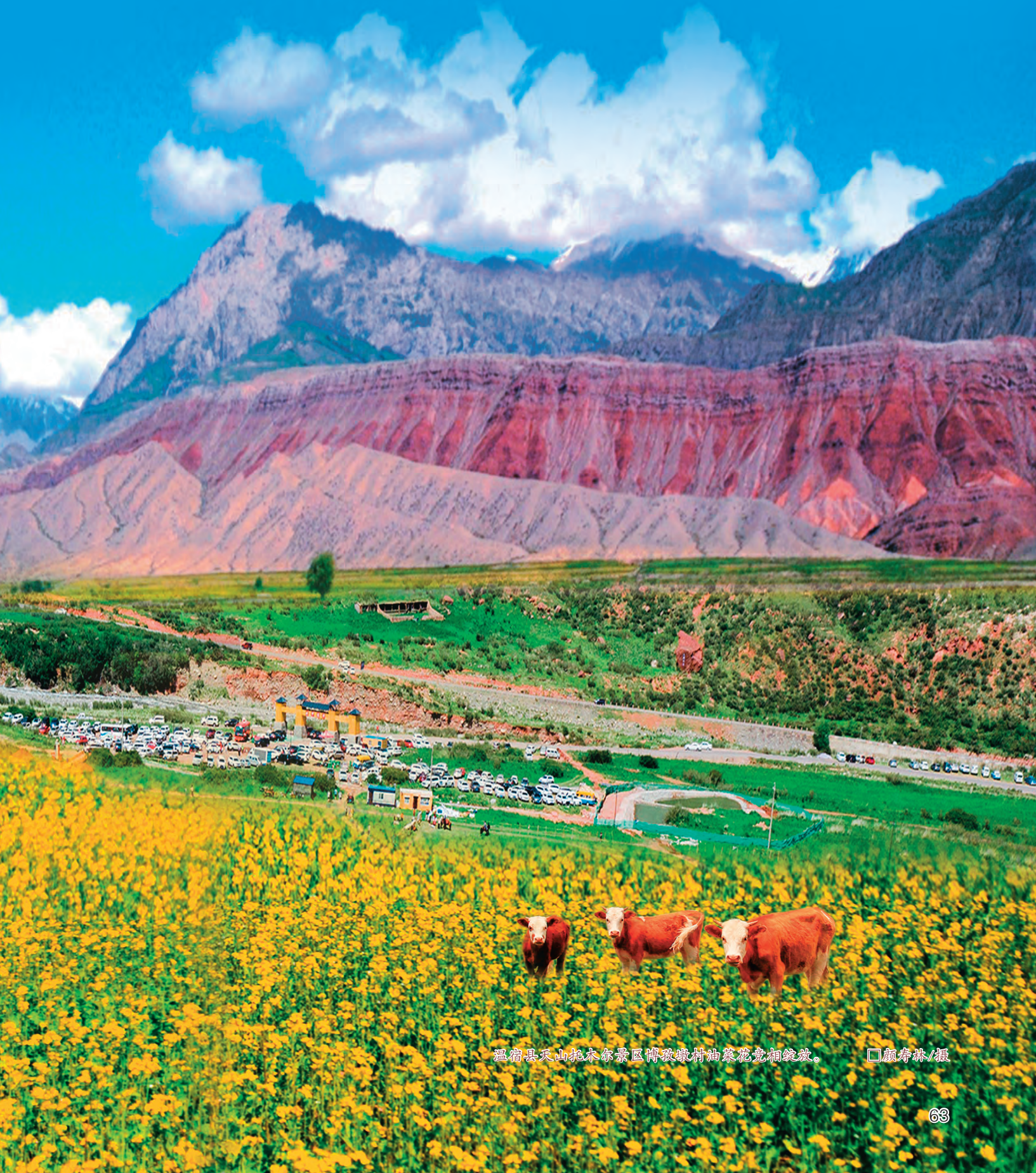
温宿县天山托木尔景区博孜墩村油菜花竞相绽放。