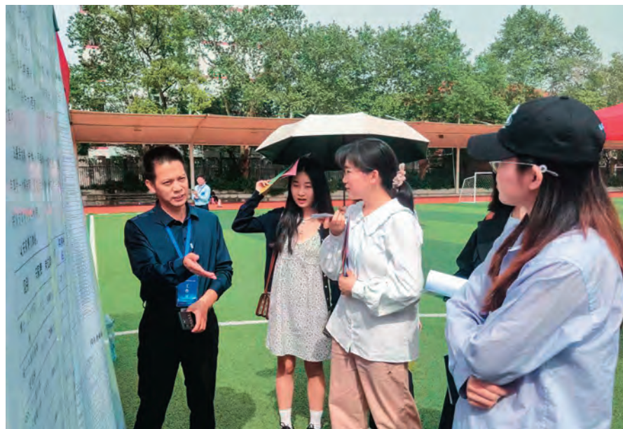
吐鲁番市委组织部干部在湖南大学介绍引才政策。