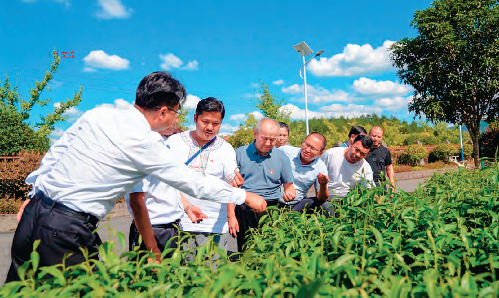
湖南省茶叶种植专家为吐鲁番市考察学习的乡土人才讲解“十八洞茶”种植技术。