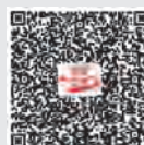
《党员之友》 学习强国号

本刊部分转载文章的稿酬已按法律规定交由中国文字著作权协会转付,敬请作者与该协会联系领取。 地址:北京市西城区珠市口西大街120号太丰惠中大厦 1027~1036室 邮编:100037 电话:010-65978906