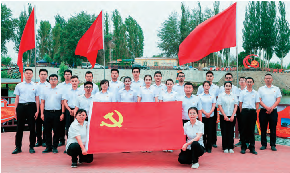
且末县组织党员干部参观梧桐湾红色教育点,接受红色教育。