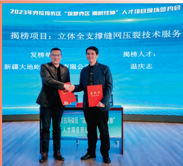
克拉玛依市克拉玛依区举办发榜单位与专家人才现场签约活动。

单位、校企合作人才共育项目14个,助力帮带培养拔尖创新人才。结合实践锻炼育才,持续推进能力素质提升工程和“沪克访问学者”选派计划,选派各领域人才赴沪参加实践培训、到上海对口部门单位跟班学习,有效提升人才队伍综合素质。