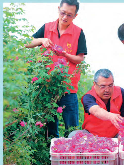
▲新疆且末县机关干部来到塔提让乡塔提让村,为塔提让村小学 迎接党的生日。