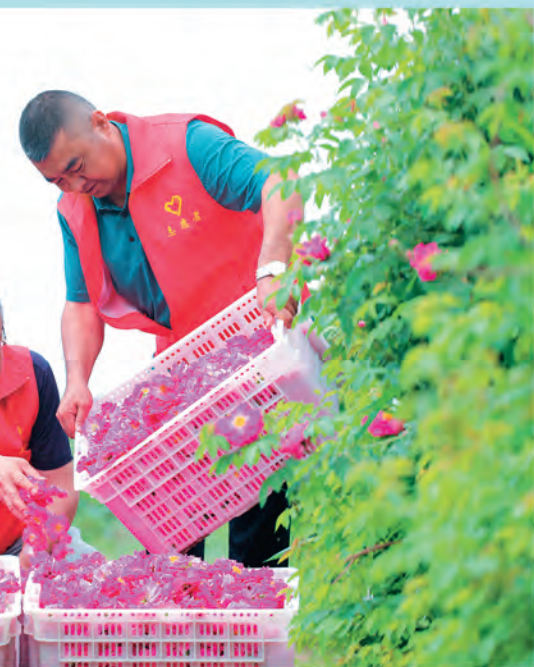
▲让镇色日克布央村开展志愿服务,以实际行动