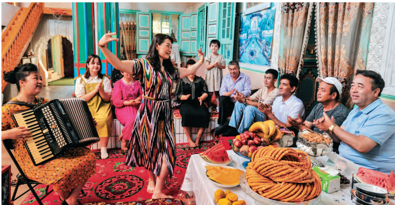
阿图什市光明街道北山社区工作者组织开展民族团结联谊活动。