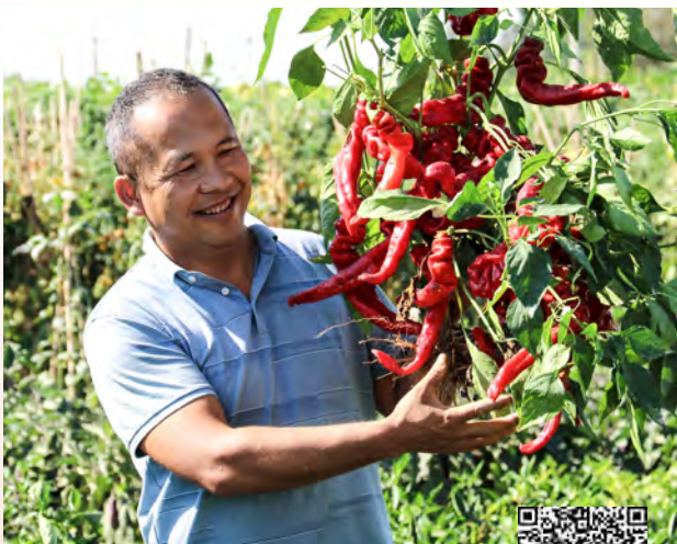
扫码观看视频 展现人才风采