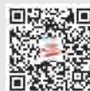
《党员之友》 微信公众号