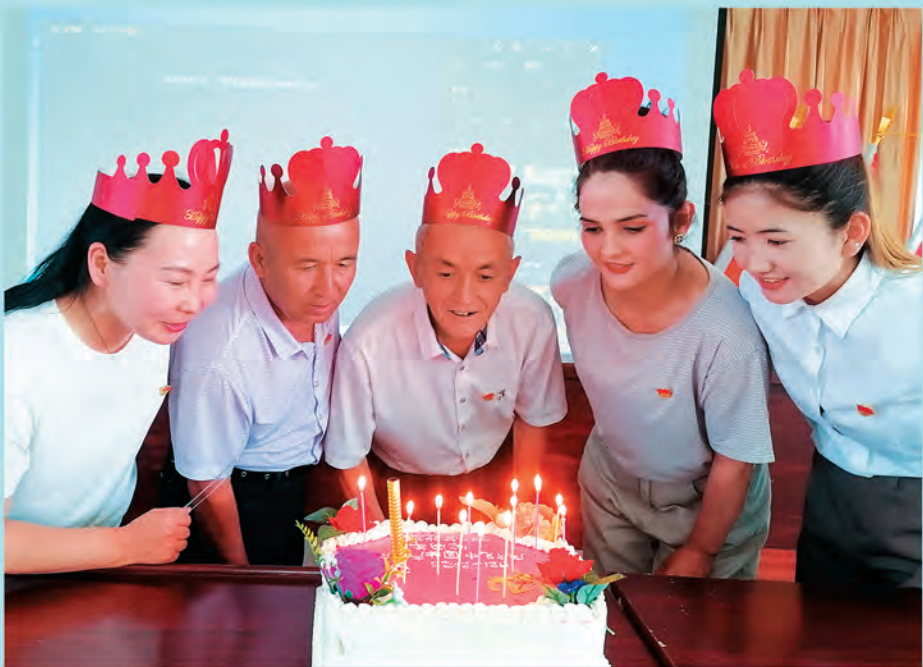
▲新疆察布查尔锡伯自治县坎乡阿拉尔村党支部开展“政治生日”主题活动,激励党员不忘初心、牢记使命、永远奋斗。