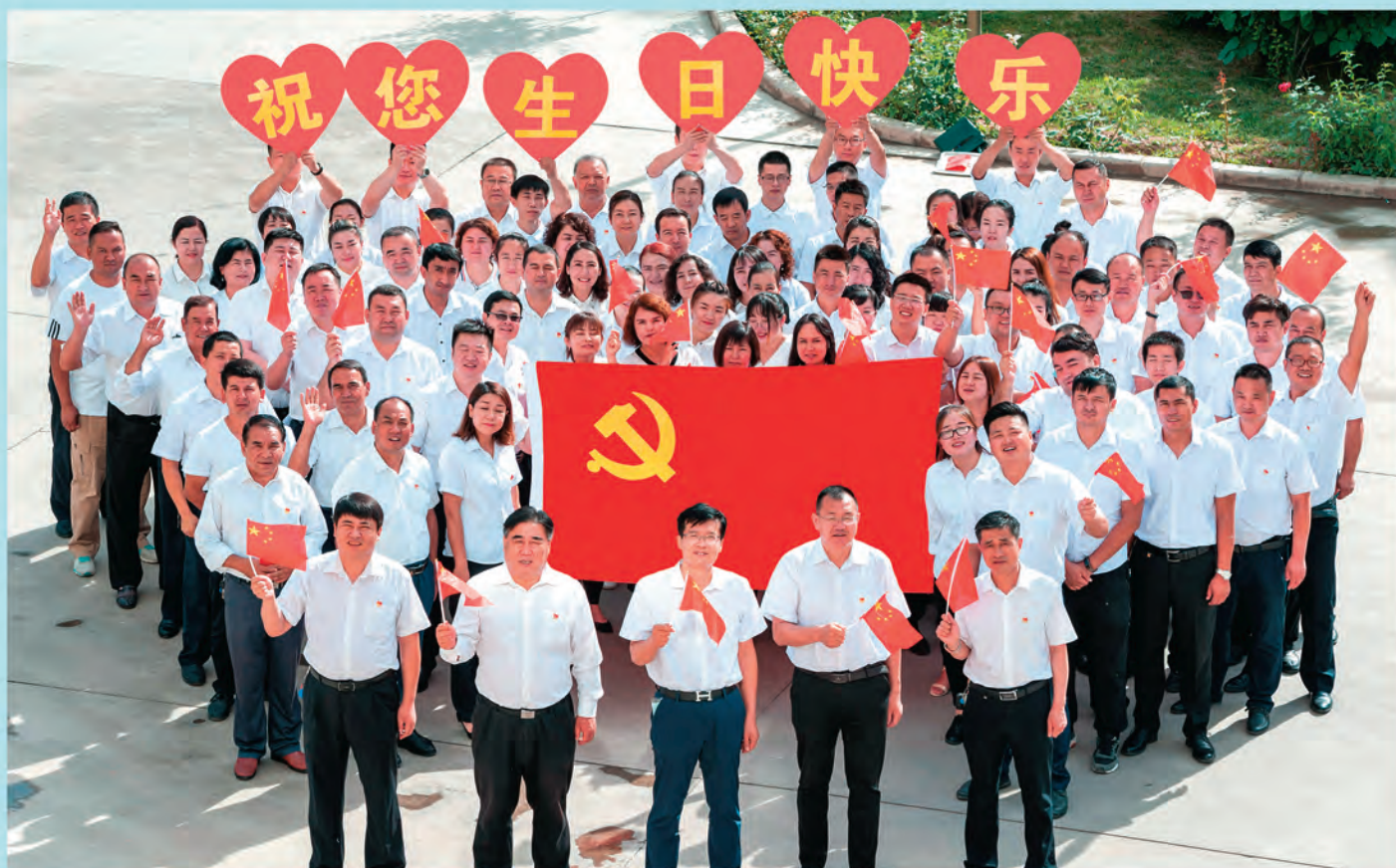
▲新疆库车市纪委监委组织机关党员开展“我和党旗合个影”主题党日活 动,庆祝建党103周年。