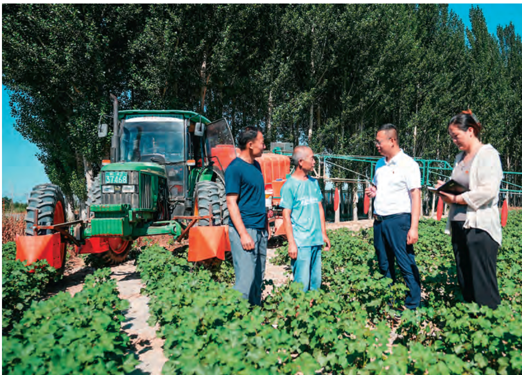
乌苏市委组织部干部在田间地头开展干部考核延伸谈话。