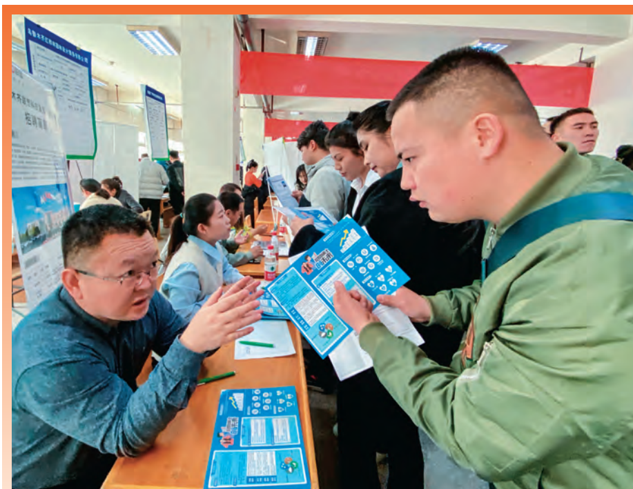
乌鲁木齐市沙依巴克区人社局驻八一街道农大社区工作队联系辖区企业在新疆农业大学组织开展招聘会。

以“防风险保稳定与防返贫促振兴”为重点,谋全局、分领域、按需求选派,实现派驻力量由“全覆盖”到“分类精准”转变。动态调优工作力量,注重调换人选质量,统筹考虑驻点社区(村)实际需求和调换人员年龄、专业、经历等因素,做好选派前谈心谈话,及时掌握选派人员心理动态,做到组织意愿和个人意愿相统一,确保选派人员政治素质好、工作能力强、作风扎实、甘于奉献。压紧压实包联责任,街乡党(工)委主动履行兜底责任,班子成员表率示范,带动街乡干部下沉开展包联帮扶工作。截至目前,累计解决困难问题 3000 余个,为群众办实事好事 3000 余件,实现各项工