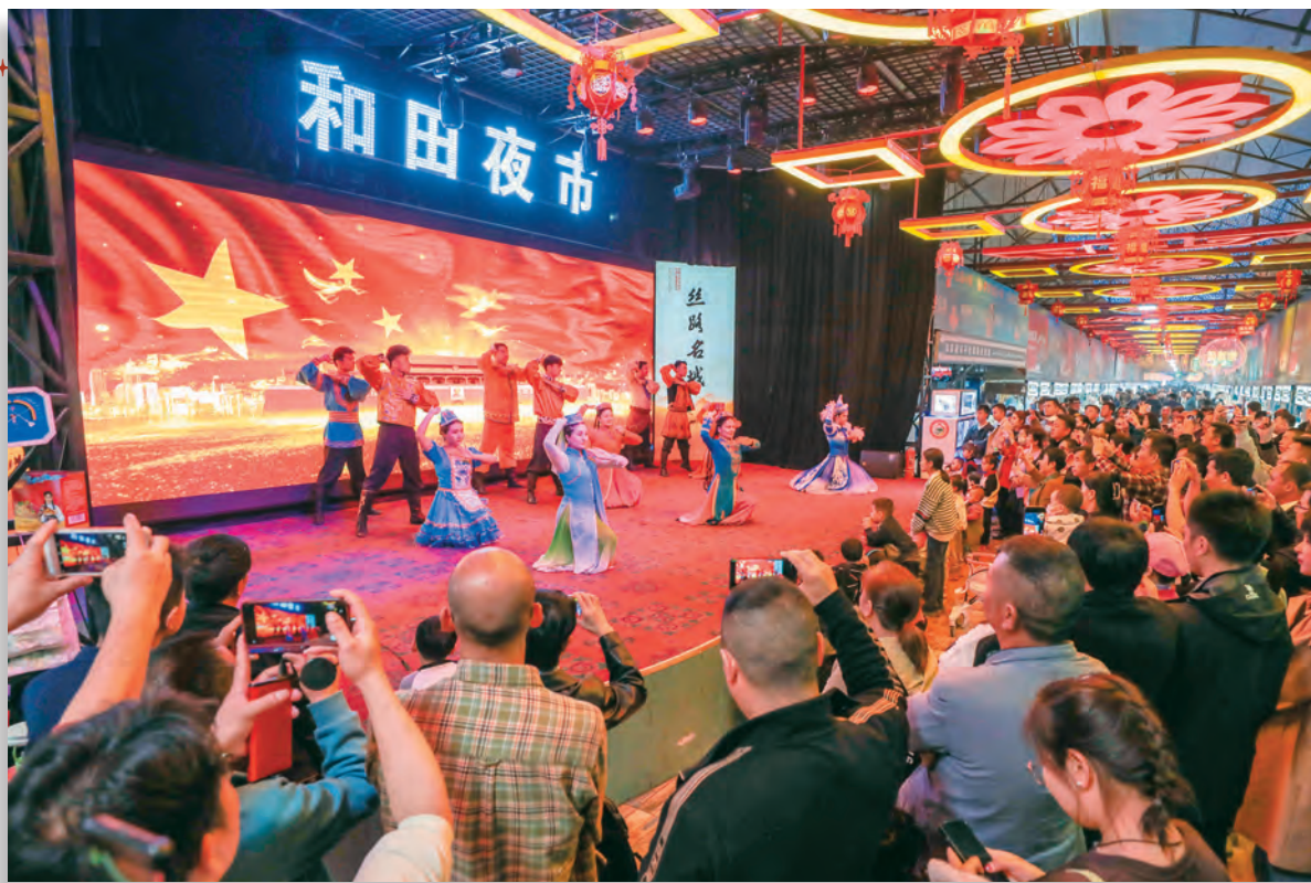
和田夜市是各族群众欣赏歌舞、品尝美食、丰富精神文化生活的好去处。

新疆和田地区坚持以党建为引领,聚焦铸牢中华民族共同体意识这个新时代党的民族工作的主线,全力办好民生实事,不断夯实铸牢中华民族共同体意识根基。