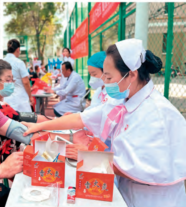
◀新疆乌鲁木齐经济技术开发区(头屯河区)中亚南路街道广州街社区党支部开展“赓续初心颂党恩·凝心聚力建新功”系列活动,庆祝党的生日。