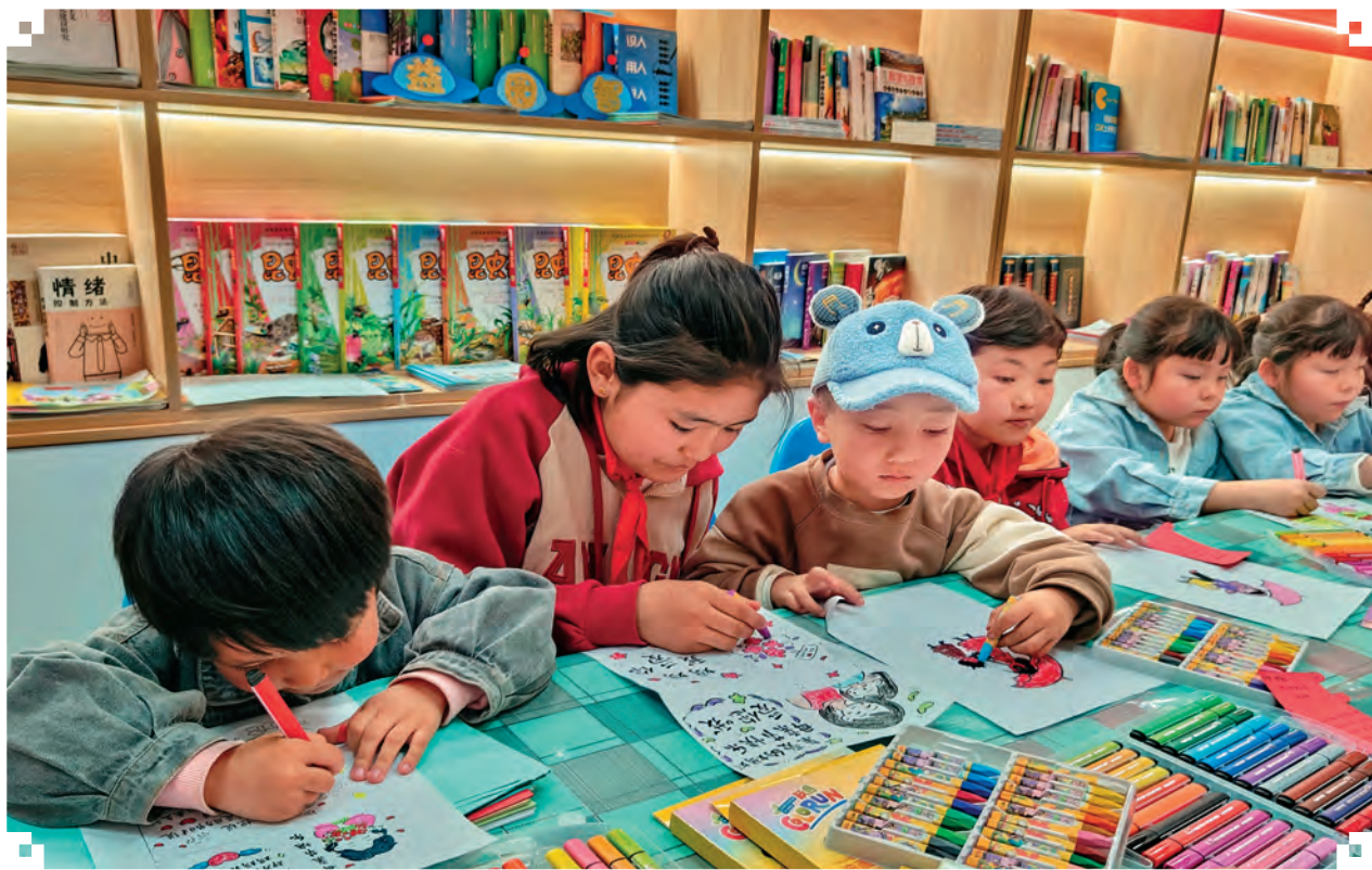
乌恰县乌恰镇巴格恰社区开展课外服务活动。