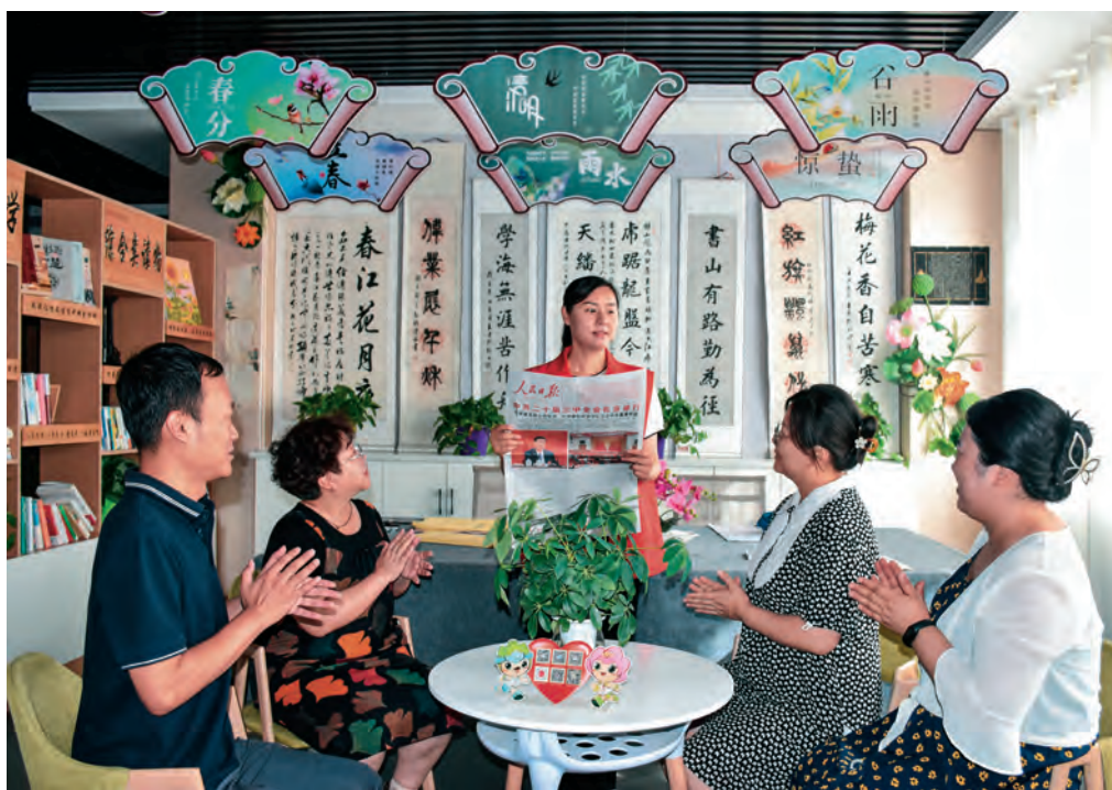
新疆库尔勒市组织党员干部深入村(社区)宣讲党的二十届三中全会精神。

阿勒泰地委组织部充分发挥雪都党建、额尔齐斯网等媒体平台作用,用“线上”党员教育专题栏等,推送会议报道信息,组织在线热评,扩大宣传面,推动党员干部互动交流、学深悟透。克孜勒苏柯尔克孜自治州抓好老党员宣讲,针对行动不便的老党员,开展“上门送学”活动,确保全会精神宣传宣讲全覆盖。和田