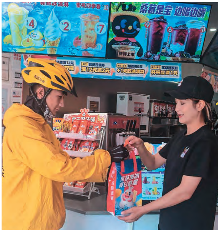
麦盖提县众合领秀商圈党员商户为外卖小哥赠送“清凉一夏”爱心礼包。