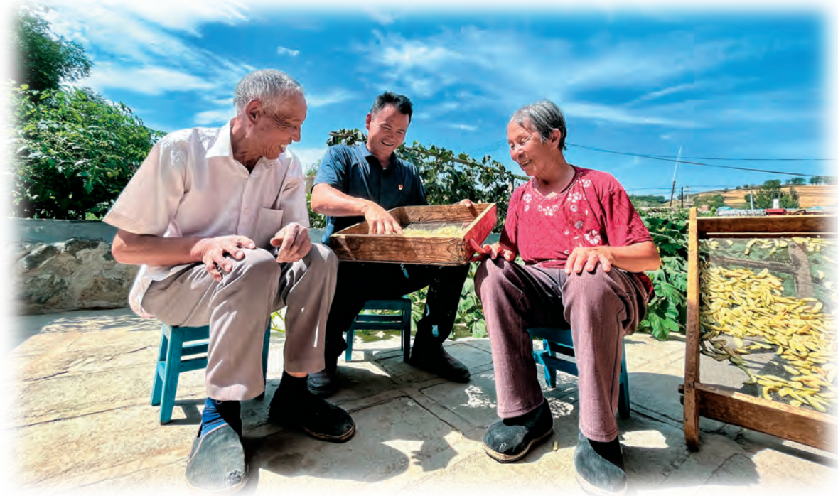
新疆木垒哈萨克自治县常态化入户走访密切党群关系。