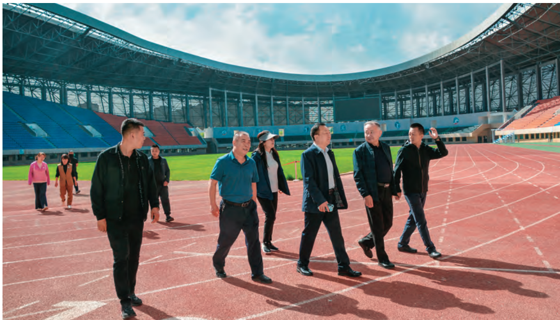
昌吉回族自治州人大常委会执法检查组开展执法检查。

牢牢把握人大“权力机关”定位要求,紧跟党中央重大决策部署,紧贴人民群众美好生活需要,依法履职尽责,提升人大履职质量和水平。有序推进地方立法工作,坚持科学