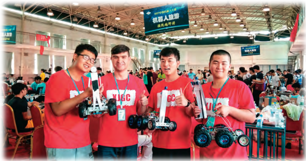
学院自动化专业、测控技术与仪器专业学子在中国机器人大赛中获奖。