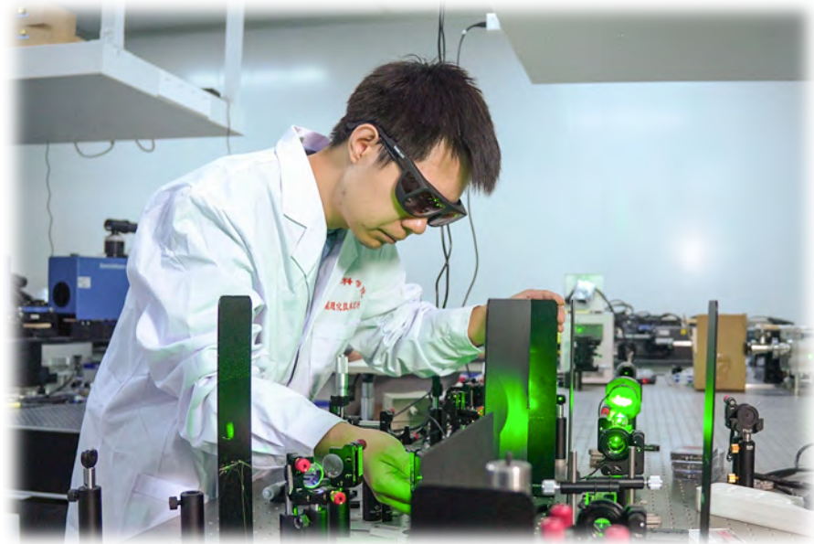
中国科学院新疆理化技术研究所青年科研骨干开展激光实验。