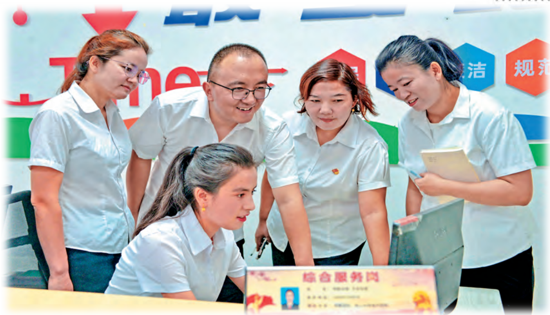
新疆库车市新城街道杏花苑社区党员干部学习讨论业务知识。