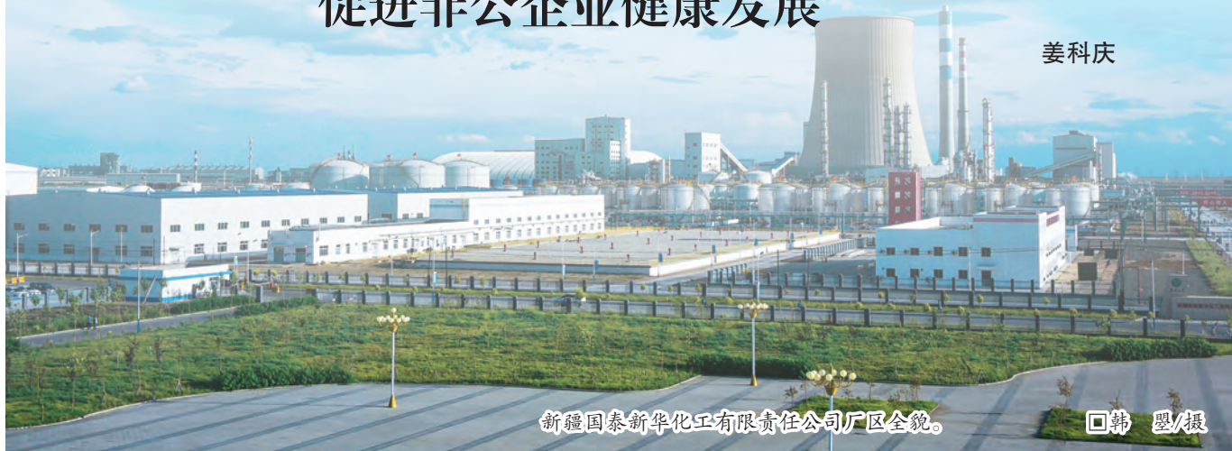
新疆国泰新华化工有限责任公司厂区全貌。