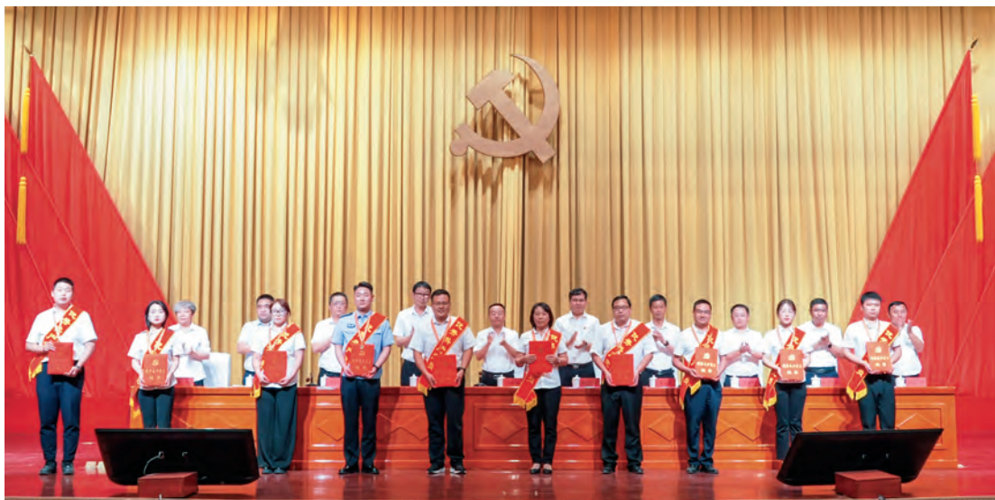
阿图什市召开庆祝中国共产党成立103周年暨“两优一先”表彰大会。