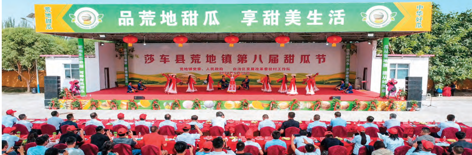
6月29日，自治区发展改革委驻村工作队联合荒地镇党委举办第八届甜瓜节。