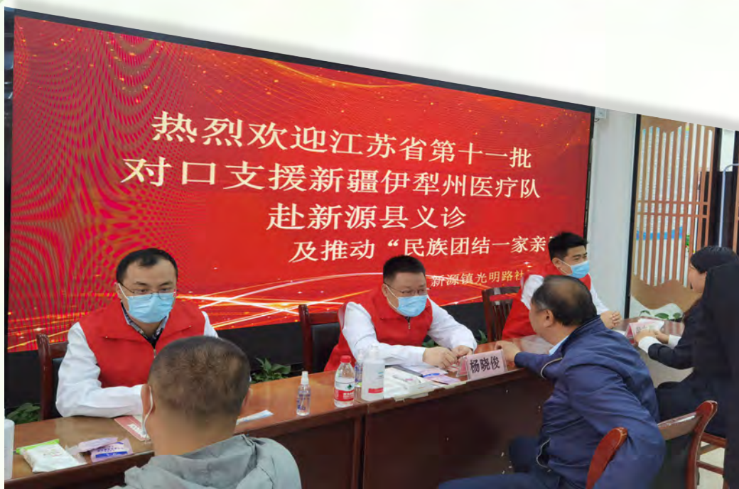
江苏援伊前方指挥部组织医疗援疆专家在新源县光明路社区开展义诊活动。