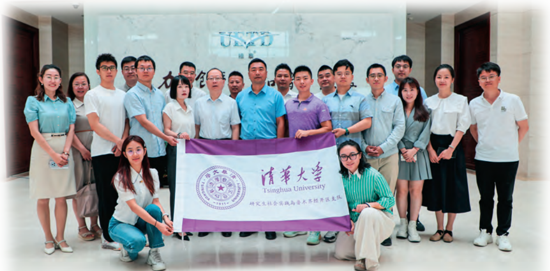
清华大学博士团暑期社会实践队在乌鲁木齐经济技术开发区(头屯河区)中亚南路街道开展社会实践。