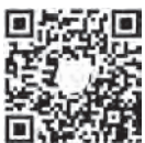
扫描二维码看视频 感受基层党员心声