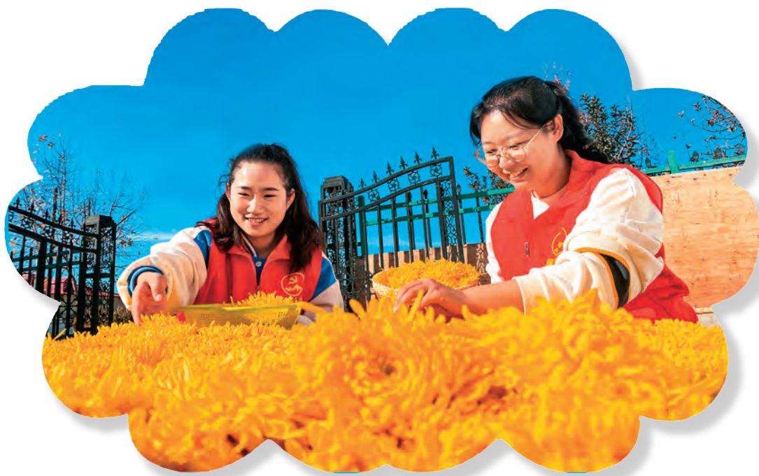
党员志愿者在开干齐村帮助农户采摘金丝皇菊。