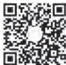
扫描二维码看视频 感受基层党员心声