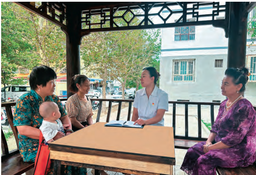
阿图什市光明街道玛纳斯社区干部在“梦涵晗议事点”了解居民需求。

党支部创建体系向常态长效用劲,健全“五个好”党支部创建动态更新标准、研判分析情况、组织观摩交流、抓实进阶升级、随机抽查督促五项长效机制,定向激励反向监督全面挂钩,制定科学有效的标准、流程、措施,编印党组织标准化规范化制度机制汇编,分领域打造坚强战斗堡垒,“一支部一策”推动“五个好”党支部进阶升级。强化党员队伍建设。实施党员队伍“活力跃升”计划,深化党员“三学三亮三比”争当先锋行动,打造“四个合格”过硬队伍,结合开展无职党员设岗定责、