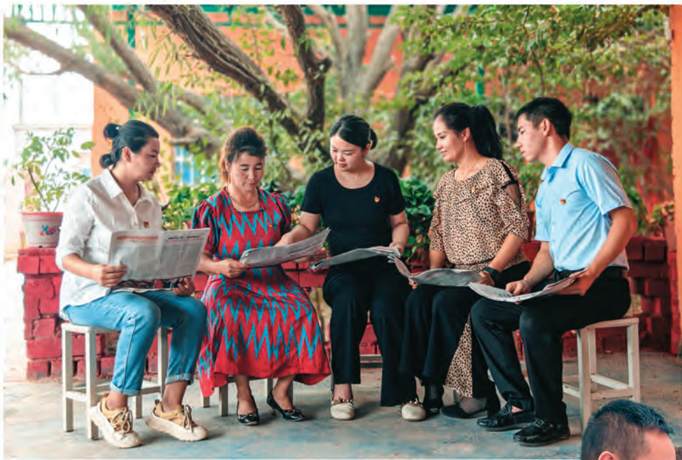
◀新疆巴楚县组织党员干部深入乡村(社区)宣传党的二十届三中全会精神。