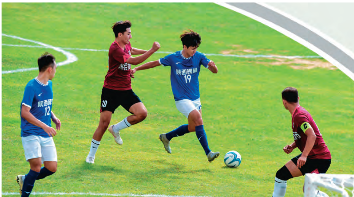
首届全国全民健身大赛(西北赛区)足球比赛在新疆克拉玛依市举行。

建立干部心理健康联席会议制度，由组织部牵头，将卫健、教育、团市委、妇联等多个单位纳入其中，形成“1+N”联动机制，定期收集汇总遭受重大变故、在督评考核或工作中表现不佳等的干部情况，形成重点关爱对象清单。开展人际关系能力、心理健康水平、个性性格等系列测评，形成“体检”报告，根据评估结果依次确定“绿”“黄”“红”三色预警级别，建立“一人一档”，及时关怀、提前介入。实施靶向心理干预计划，组织“绿色”预警人员参加讲座学习、团队活动、心理保健，帮助缓解精神压力，提升心理健康指数；组织“黄色”预警人员进行一对一面谈咨询、专项心理训练、团体心理辅导，提升心理素质和抗压能力；组织“红色”预警人员开展二次评估和筛查，筑牢心理健康防线。截至目前，向全市干部开展专题讲座4场次，团体心理辅导5场次，为广大干部心理健康补充“正能量”。（吴乐）