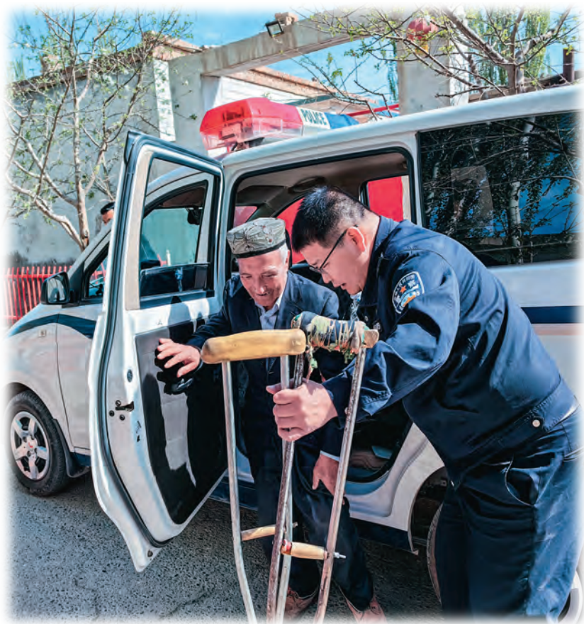
文化路便民警务站民警帮助身体不便的居民群众。

文化路便民警务站位于温宿县城区,警务站党支部成立于2017年,现有党员13人,党支部坚持用党的创新理论武装党员民警,深入开展党支部书记讲党课、党员政治生日、重温入党誓词等,打造平常时候看得出来、关键时刻站得出来、危急关头豁得出来的过硬队伍。