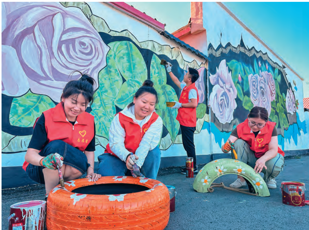
塔城地区组织党员干部开展美化环境志愿活动。

坚持把政治标准放在首位,严把党员发展关口,紧抓党员发展关键环节,从源头上保持党员队伍的先进性和纯洁性。坚持政治标准。在发展党员时重点考察入党动机和政治素质,制定发展党员政治标准“负面清单”,细化暂缓发展和不得发展的20种具体情形,推行党支部、基层党委、执纪执法部门、组织部门联审制度,考准考实发展对象政治素质。严格发展程序。编印《塔城地区发展党员指导手册》,结合党员发展规定步骤,进一步细化发展流程,明确注意事项,确保入党程序严谨规范。加大被发展党员档案随机抽检力度,组织县(市)组织部门、基层党委通过“线上+线下”的方式,开展发展党员培训1200余次,抽检发展党员档案5300余份,