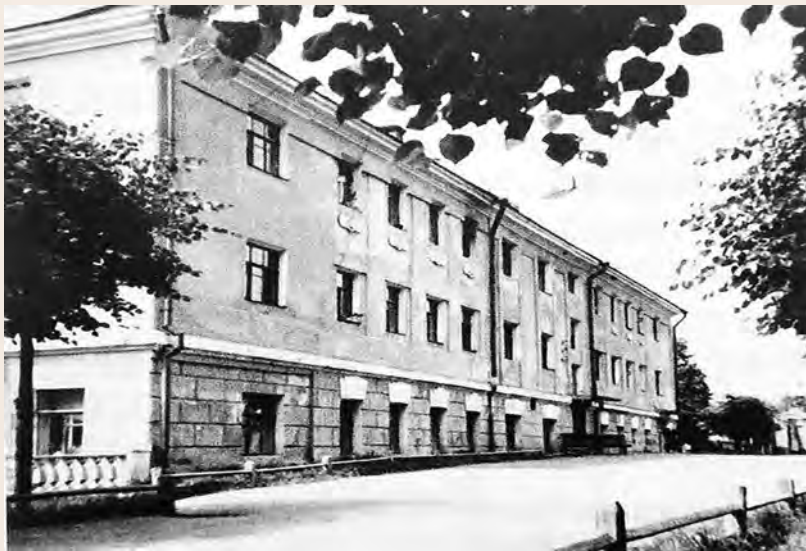
中共六大会议旧址。