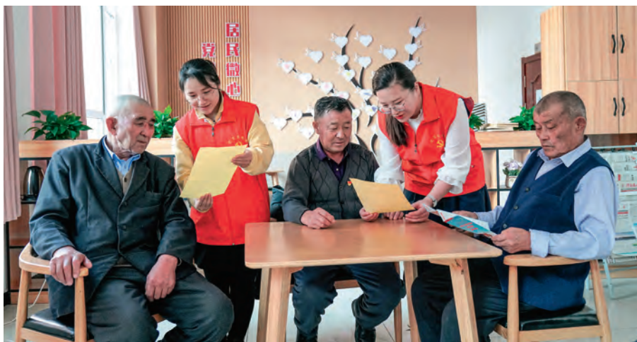
青河县党员志愿者服务队在老干部活动中心为离退休党员讲解涉老政策。