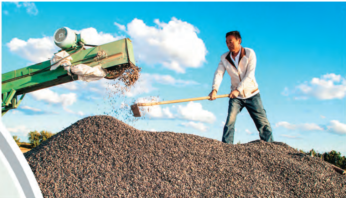
新疆裕民县吉也克镇吉也克村打瓜喜获丰收。