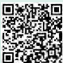
扫描二维码看视频 感受基层党员心声