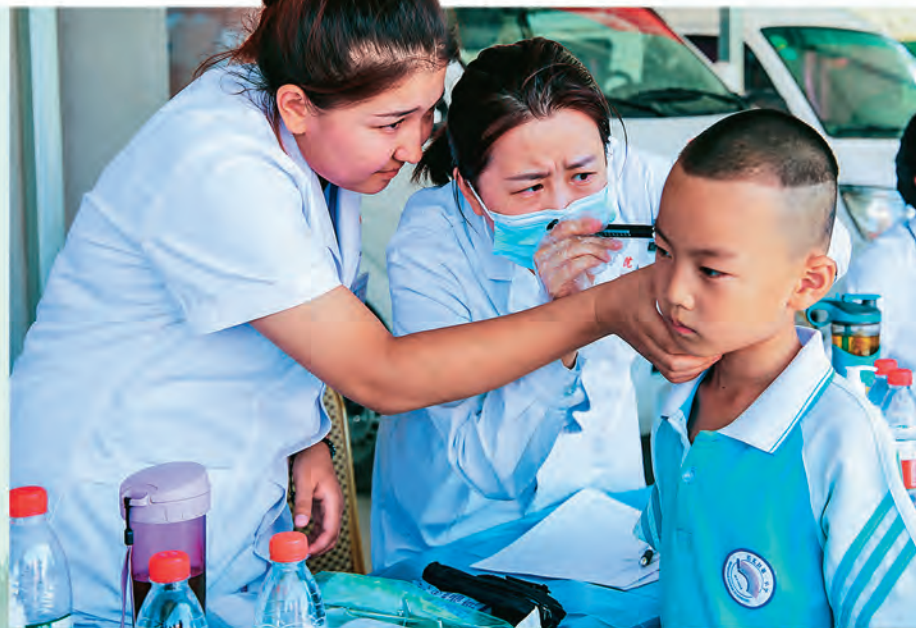
▶喀什市东湖街道东湖社区党总支开展“亮身份、践承诺、当先锋”活动,聚焦急难愁盼倾心服务群众。