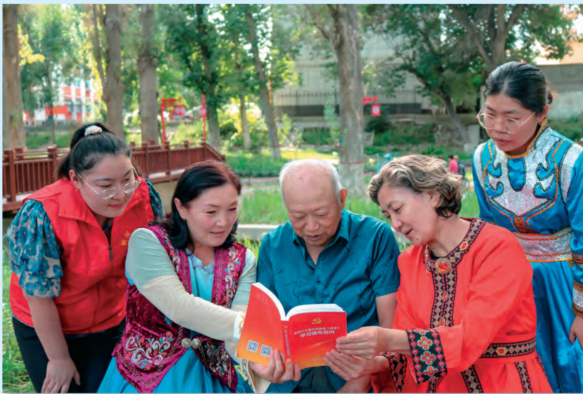
新疆塔城市新城街道新城社区的党员干部在公园给居民宣讲党的二十届三中全会精神。