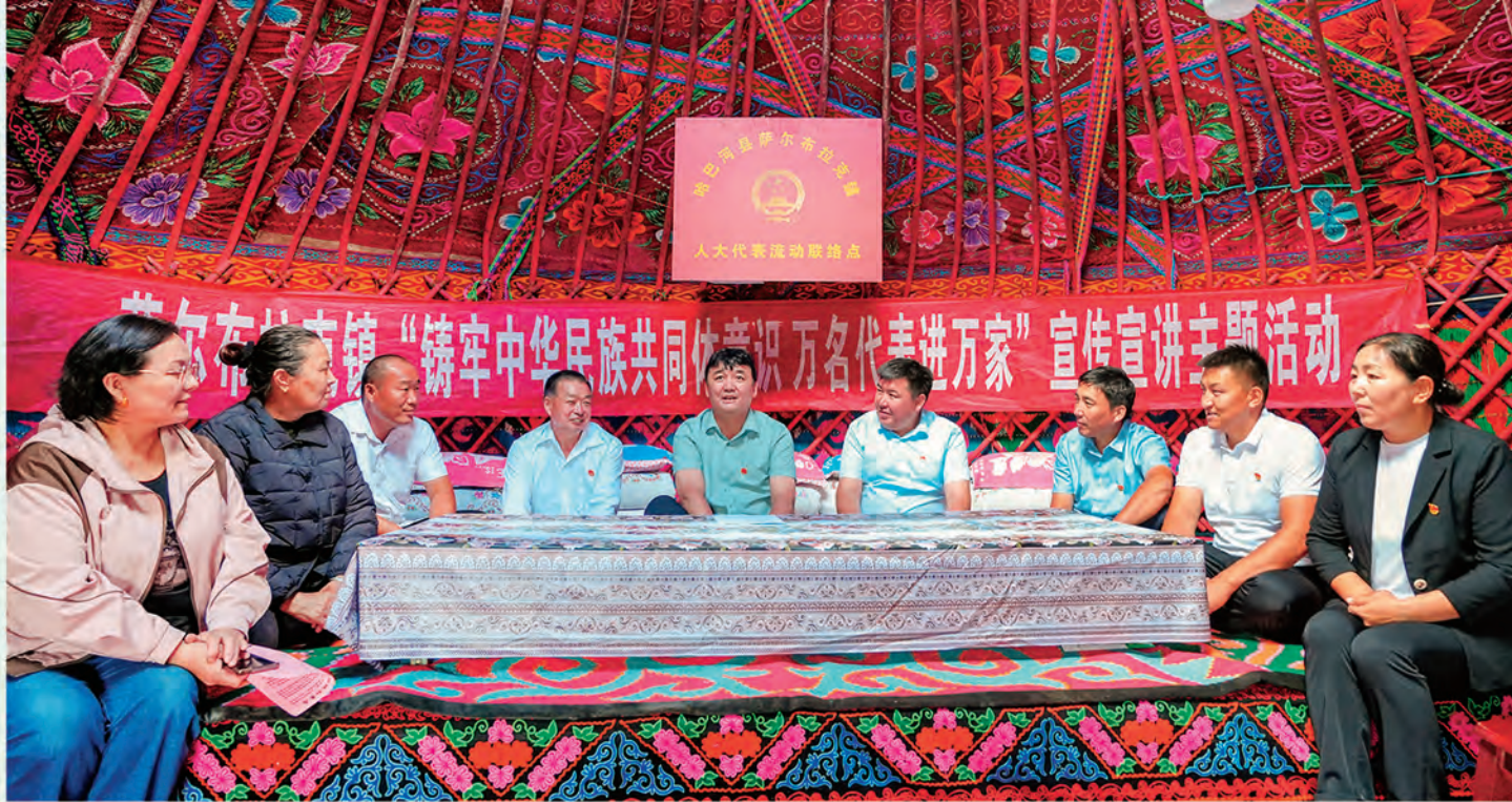
◀乌鲁木齐市天山区团结路街道团结社区党支部携手武警新疆总队某支队举办“同庆建军佳节,共叙鱼水深情”联谊活动。