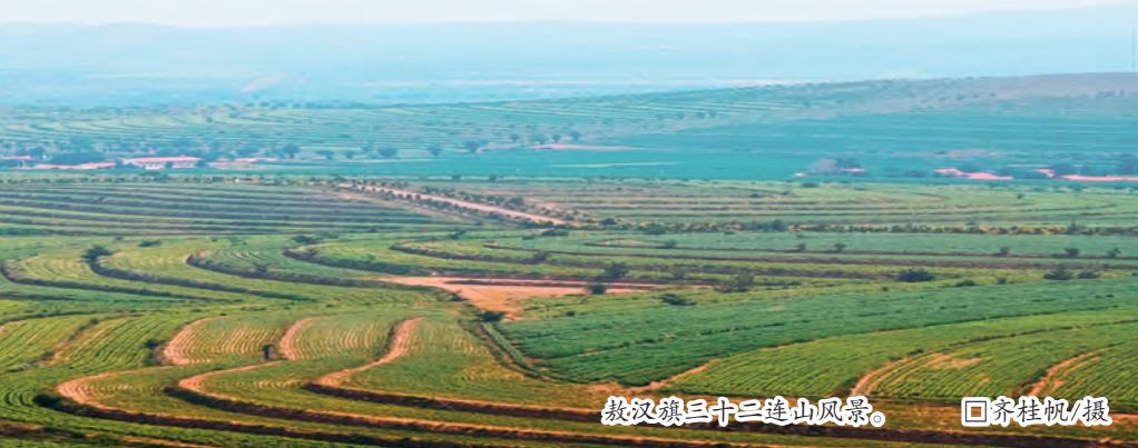
敖汉旗三十二连山风景。

位于浑善达克沙地、科尔沁沙地“两大沙地”结合部的克什克腾旗白音敖包国家级自然保护区，分布着世界罕见的沙地云杉林，云杉林能聚拢散碎细沙、防风固沙，对研究和防治我国北方土地荒漠化、保护京津冀地区周边生态环境具有重要意义，是浑善达克沙地生态修复和防沙治沙工作中的一项重要自然资源。