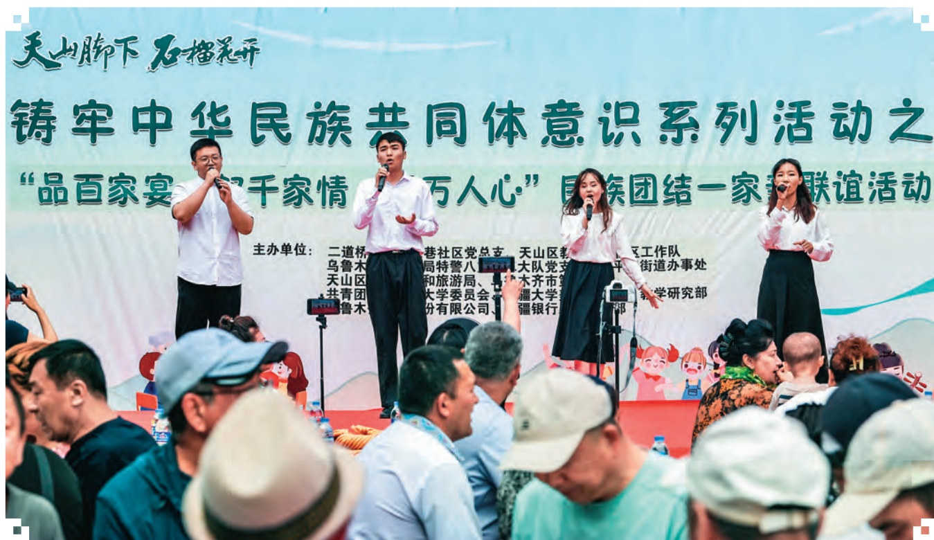
固原巷社区开展“品百家宴·叙千家情·聚万人心”民族团结一家亲联谊活动。