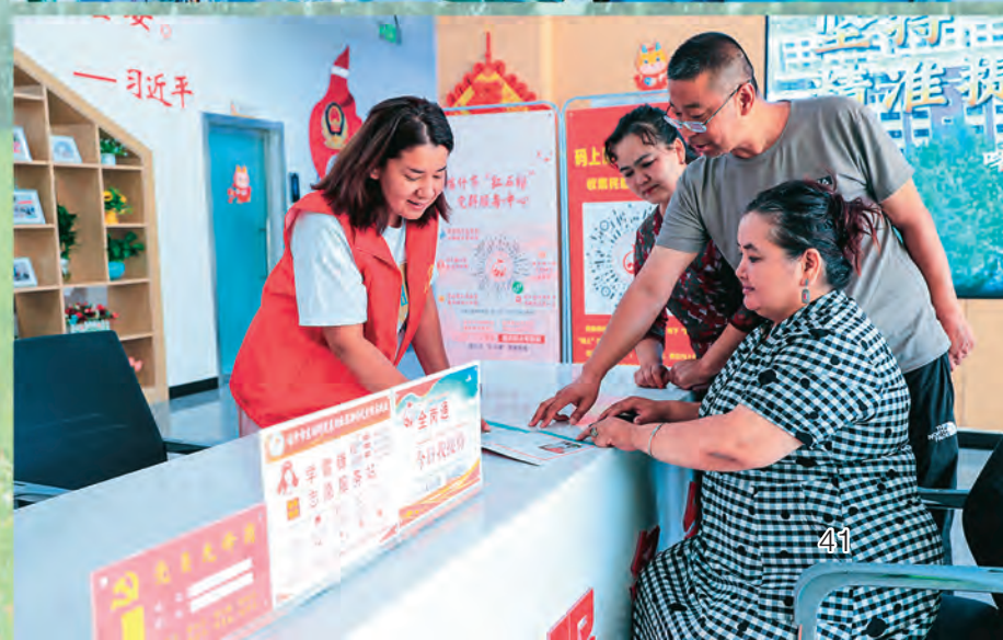
◀伊犁边境管理支队霍尔果斯边境派出所启动“田间警务”模式,组织党员干警开展普法宣讲。