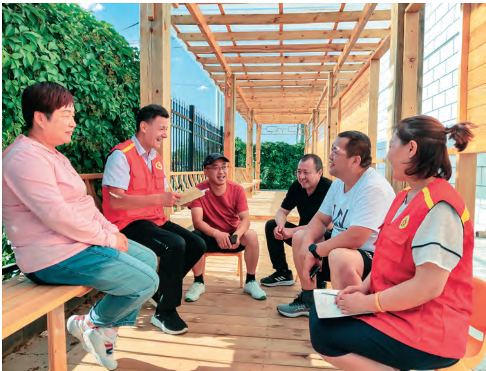
塔城地区组织党员干部深入基层察民情、解民忧、暖民心。

业热情。加强组织关怀。出台《塔城地区建立健全党内激励关怀帮扶机制意见(试行)》,列支党费走访慰问新中国成立前入党的老党员、因公牺牲或殉职的党员干部家属、生活困难党员等2032名,帮助解决生活困难,让党员切实感受到组织的温暖。组织党员集中过“政治生日”,为党龄满50年且表现良好的老党员颁发“光荣在党50年”纪念章,不断增强党员的荣誉感、归属感和获得感。注重典型带动。持续推进窗口单位和服务行业党员佩戴党员徽章全覆盖,农村、社区、商户“共产党员户”挂牌全覆盖,全面开展“党员先锋岗”“学习标兵”“工作标兵”争创活动,引导广大党员当先锋、打头阵。充分发挥先进典型示范引领作用,深化“党课开讲啦”“学习身边榜样”活动,组织各级党组织书记、优秀共产党员、老党员等讲党课,以身边事教育身边人,激励广大党员主动作为、争创先进。突出发挥作用。深化拓展“我为群众办实事”实践活动,用好“在职党员进社区报到”“实施微行动、上好微党课、点亮微心愿、做好微服务”载体,结合开展“地县乡三级示范引领”“万名党员进党校、万名党员讲党课、万名党员进万家”活动,组织广大党员联系走访群众,帮助解决群众急难愁盼问题1.5万余件,让广大党员在服务群众一线显身手、建新功、树形象。