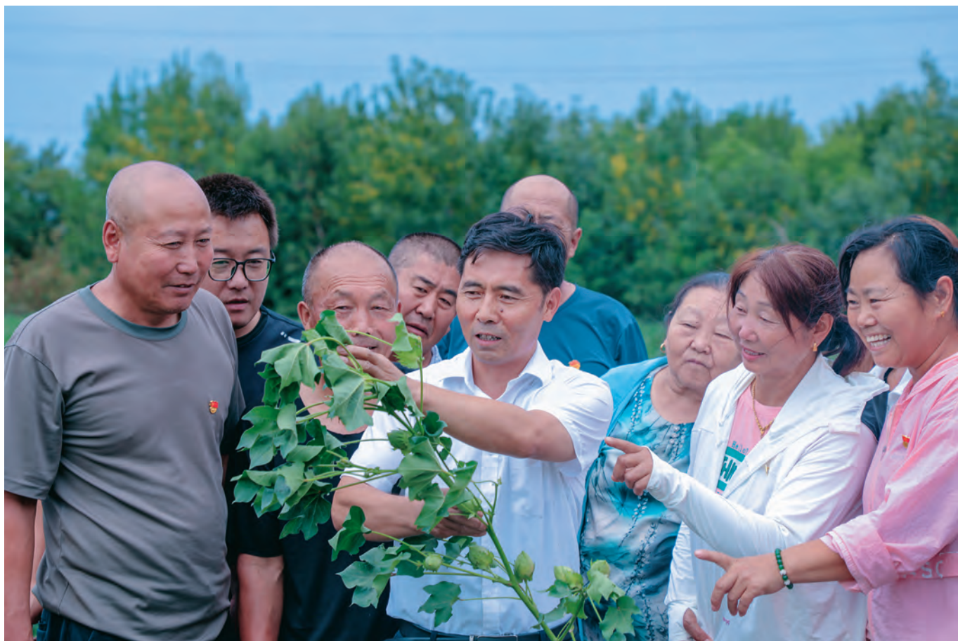
玛纳斯县农技专家为农牧民党员现场授课。