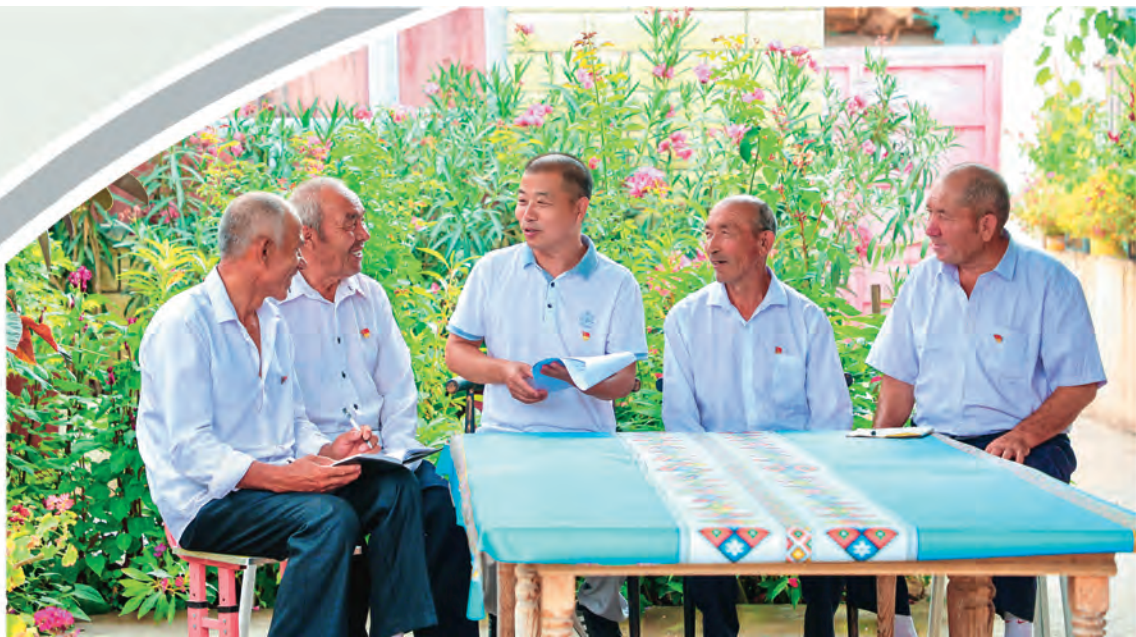
新疆库车市玉奇吾斯塘乡喀拉苏村驻村干部向老党员宣讲党的二十届三中全会精神。