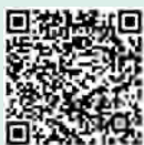
扫描二维码看视频 感受基层党员心声