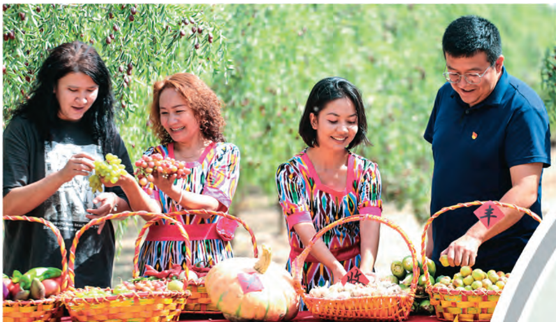
新疆且末县委开展丰收节活动。