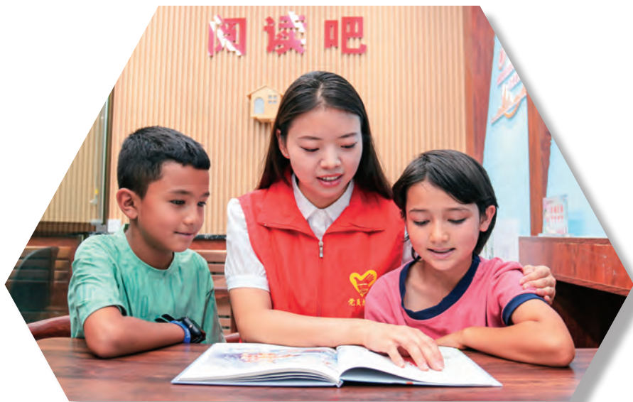
和静县巴润哈尔莫敦镇阿日勒村党员志愿者开展暑期学习辅导。

整合资源聚合力。 紧扣为民服务这个着力点,撬动三个主体参与积分活动,汇聚共建共治共享合力。积分+辖区单位“暖家共建”。组建“红色积分联盟”,统筹辖区单位参与积分管理,开展组团式暖心服务,