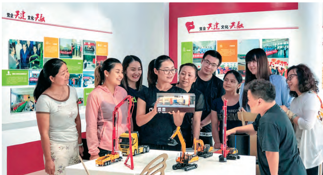
新疆自贸试验区乌鲁木齐片区经开功能区块组织入党积极分子在融北社区党建展厅参观学习。