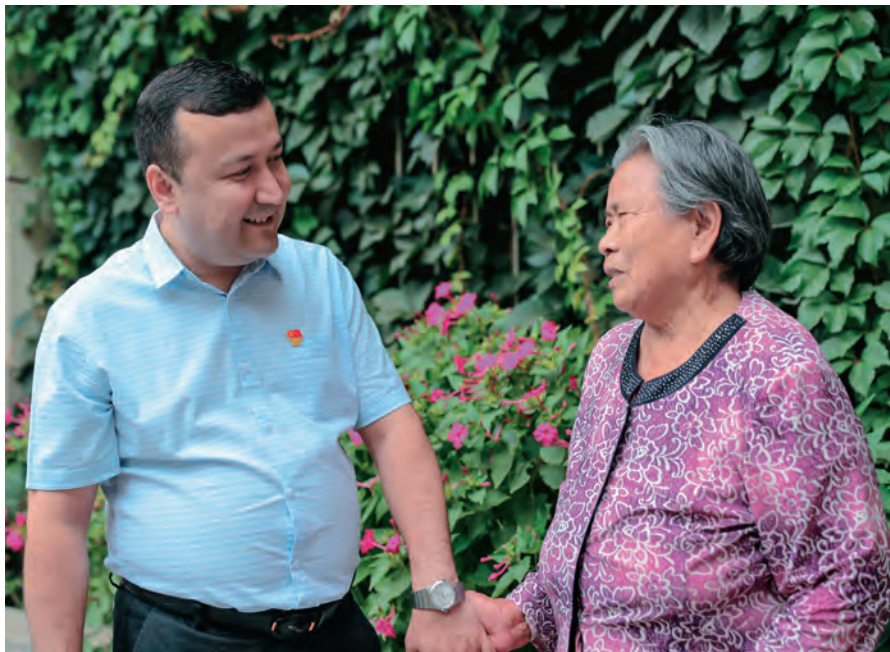
乌鲁木齐市沙依巴克区党员干部走访了解群众急难愁盼问题。

坚持以党建联建推动资源整合、力量聚合,激发各类群体参与治理的积极性,把各方力量拧成“一股绳”。组织共建。积极探索党建共建发展思路,街道、社区党组织牵头,将机关、企事业、“三新领域”等单位纳入共驻共建成员单位,签订共驻共建协议书,采取组织联建、活动联办、家园联建等“七联”方式,形成以社区党组织为统领,辖区各成员单位和全体党员共同联动的区域