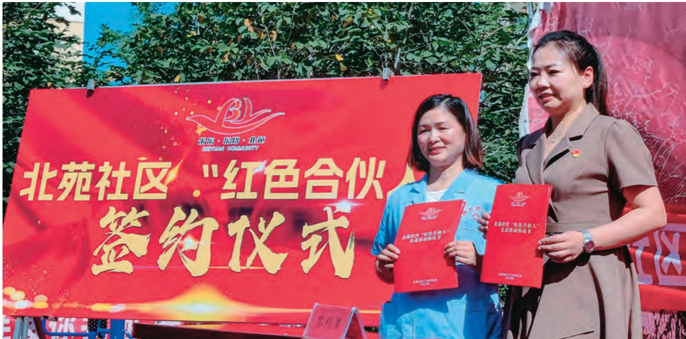
乌鲁木齐市米东区东路街道北苑社区举办“红色合伙人”签约仪式。