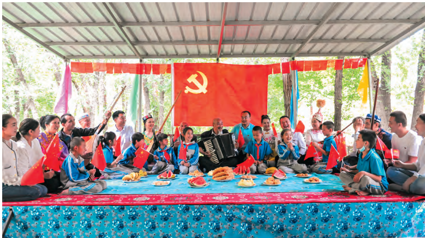
伊宁县愉群翁回族乡中阿布拉什村党支部以喜闻乐见的形式宣讲党的二十届三中全会精神。