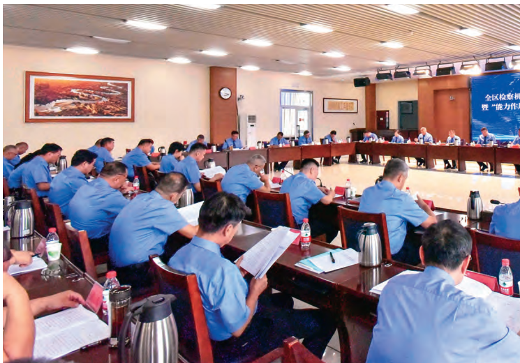
全区检察机关高级检察官研讨班暨“能力作风建设年”活动推进会顺利召开。

坚持以政治建设为统领。以“忠诚始终是第一位的”的职责使命抓实政治建设,持之以恒筑牢全区检察系统干部队伍思想根基。擦亮鲜明政治底色。坚持不懈用习近平新时代中国特色社会主义思想凝心铸魂,深入学习贯彻党的二十届三中全会精神,巩固拓展主题教育学习成果,认真落实领导领学、个人自学、集体研学、群众评学、实战检学“五学”联动制度,以理论上的清醒保持政治上的坚定,坚定拥护“两个确立”、坚决做到“两个维护”。坚定正确政治方向。坚持“从政治上着眼、从法治上着力”,健全完善习近平总书记重要指示和党中央重大决策部署落实机制,做到全面准确贯彻落实。认真落实重大事项请示报告制度,常态化开展政治督察,确保检察工作正确政治方向。强化党建引领作用。推动党建工作与检