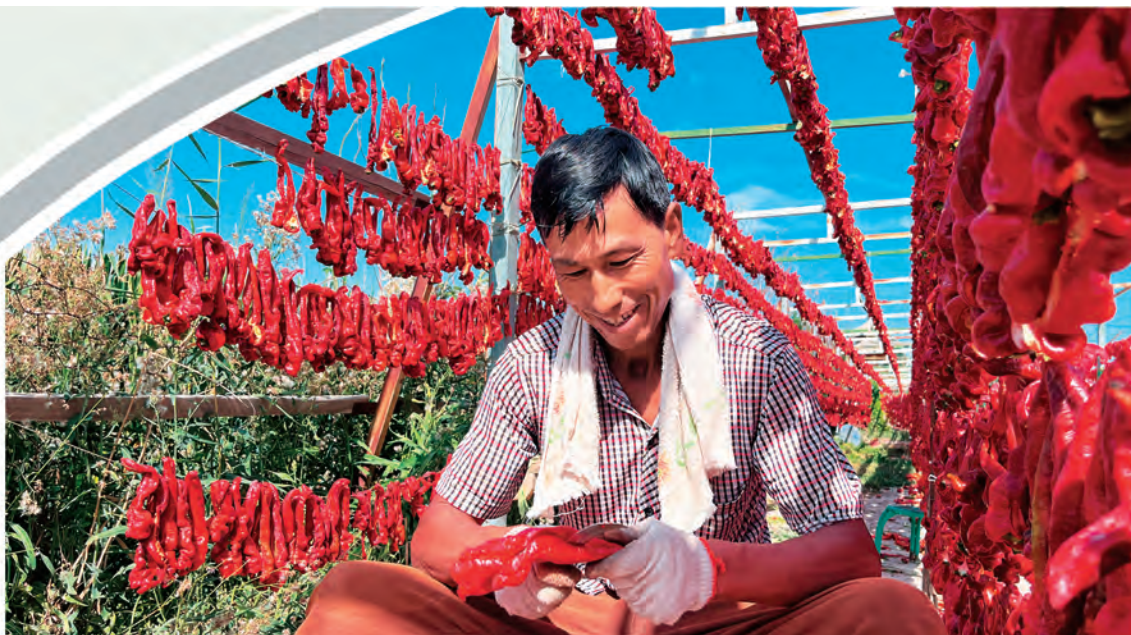
新疆焉耆县五号渠乡农技人才晾晒辣椒。