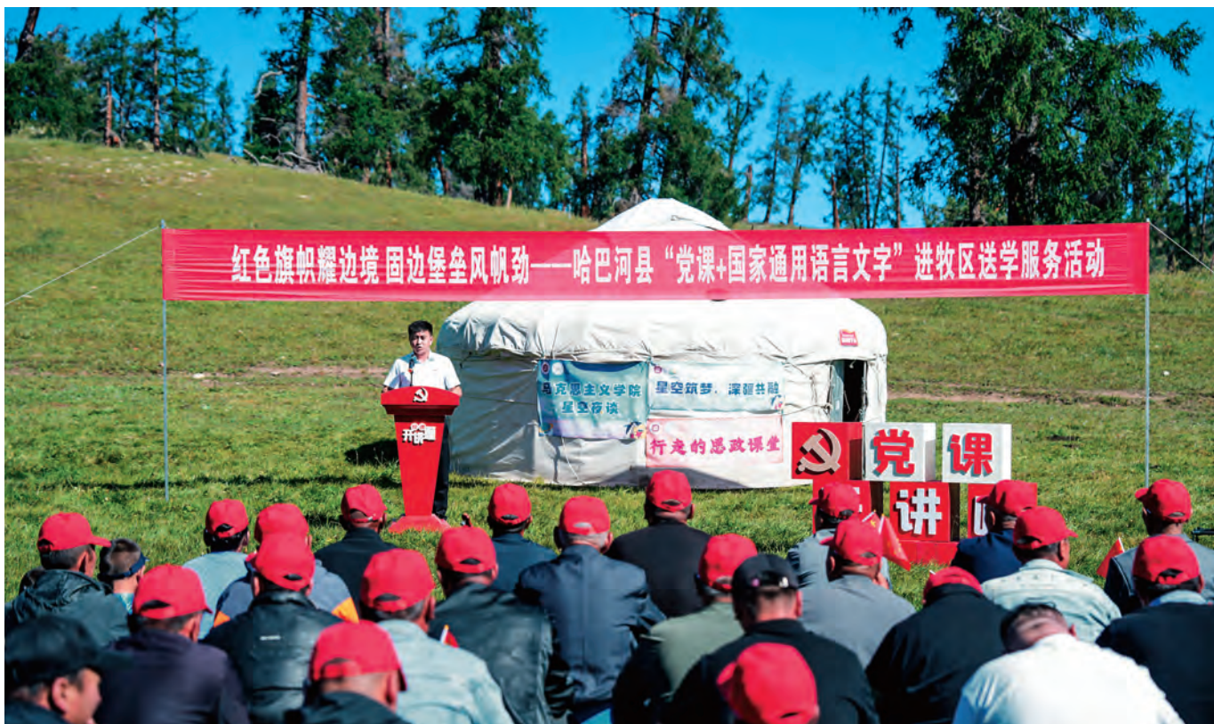
哈巴河县深入开展进牧区送学服务活动,确保广大牧民党员教育培训全覆盖。