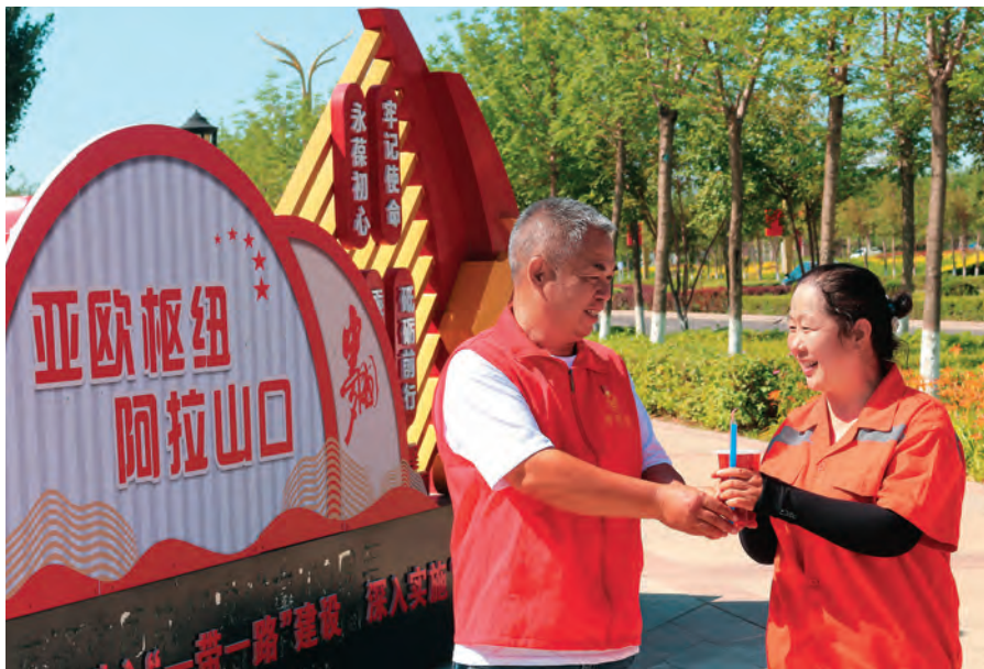
阿拉套街道志愿服务者为环卫女工送清凉。