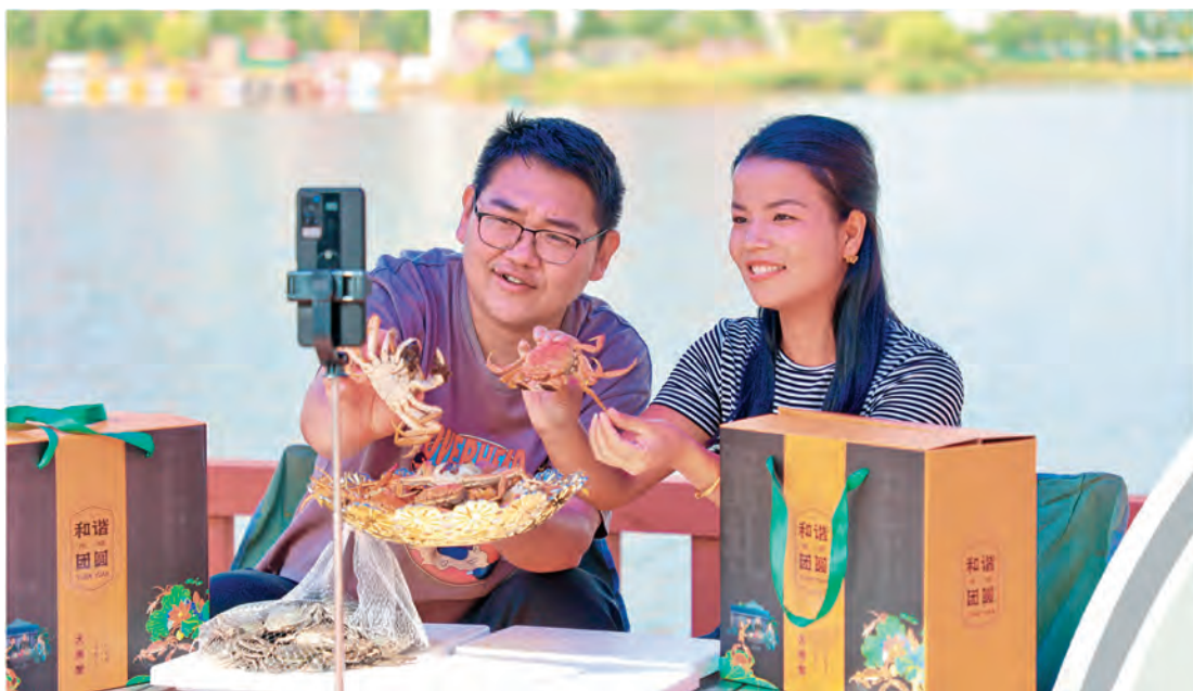
新疆库车市城南街道喀拉玉吉买村电商人才通过网络直播销售螃蟹。