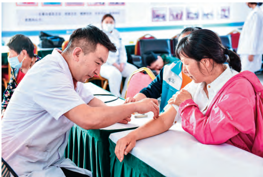
和静县和静镇建设一路社区共建单位开展义诊活动。

各驻村工作队注重建章立制,提升运行效率,推动基层党组织标准化、规范化建设。健全日常工作制度,细化完善村(社区)事务管理、村规民约等16项工作内容,严格规范村(社区)“两委”班子落实“四议两公开”决策议事机制,让干部有规可依、有章可循。推行结对共建机制,引导社区与驻地单位签订共驻共建协议书,明确服务资源、居民需求、民生项目、责任落实四张清单,建立社区党组织、共建单位联席会议制度,召开联席会议,协商处理,层层转交办结,解决各类民生实际问题。推进“积分制”管理,结合村