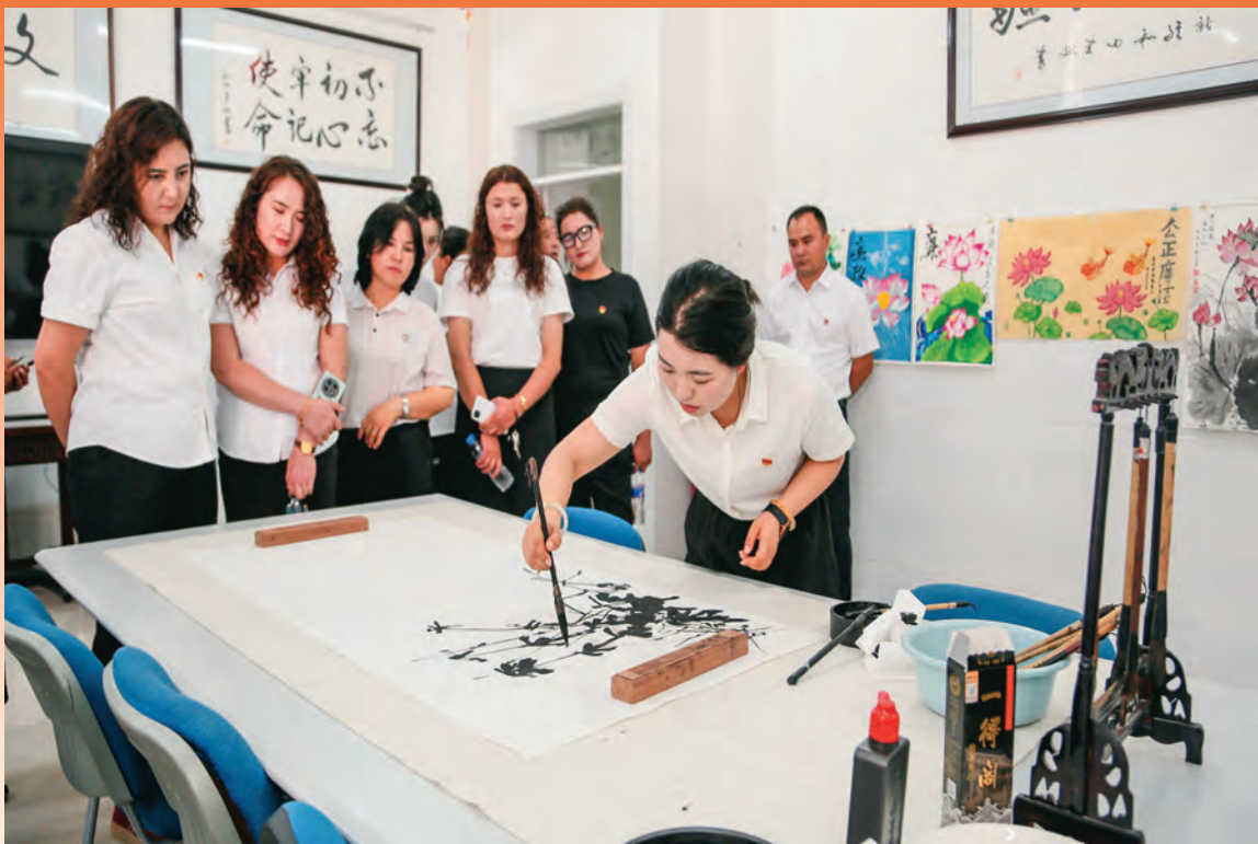
新疆和田县举办党纪学习教育廉政书画展。