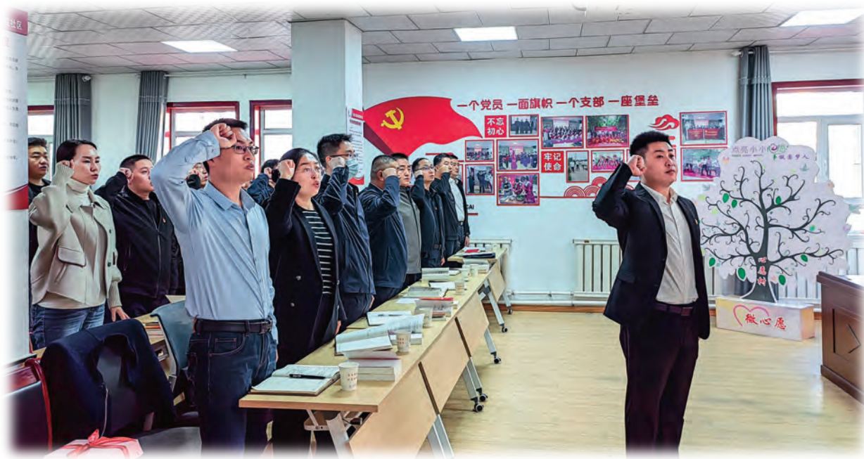
昌吉回族自治州党委组织部机关党总支与社区党组织开展主题党日活动。