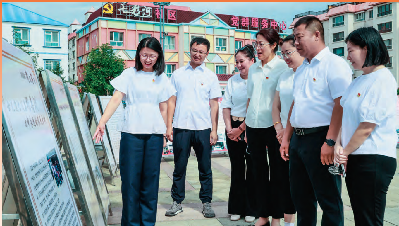
新疆布尔津县融媒体中心党支部组织党员参观“流动家风馆”，引导党员干部传承优良家风。