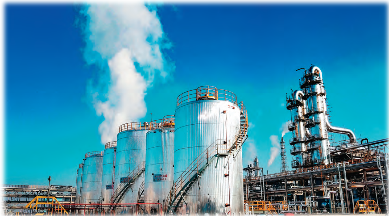
新疆投资发展(集团)有限责任公司所属新疆蓝山屯河科技公司BDO二期项目平稳运行。

伍干事创业、担当作为的活力。要坚持重实干、重实践、重实绩的鲜明导向选干部配班子,完善中层领导人员选拔任用实施办法,明确任职条件、选拔流程、监督管理等事项,推动干部能上能下,进一步提升企业中层管理人员选拔任用规范化科学化水平。要探索推行经理层成员任期制管理,明确聘任期限、岗位职