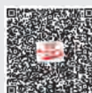
《党员之友》 学习强国号

本刊部分转载文章的稿酬已按法律规定交由中国文字著作权协会转付,敬请作者与该协会联系领取。 地址:北京市西城区珠市口西大街120号太丰惠中大厦1027~1036室 邮编:100037 电话:010-65978906