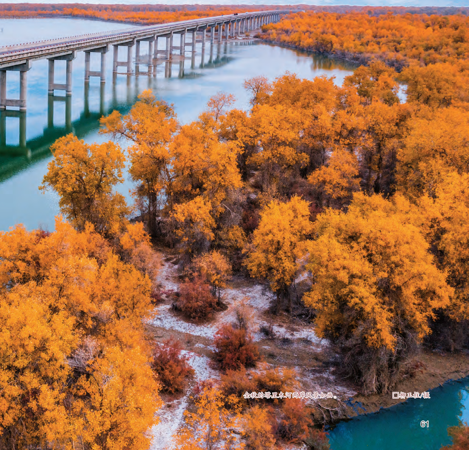
金秋的塔里木河两岸风景如画。