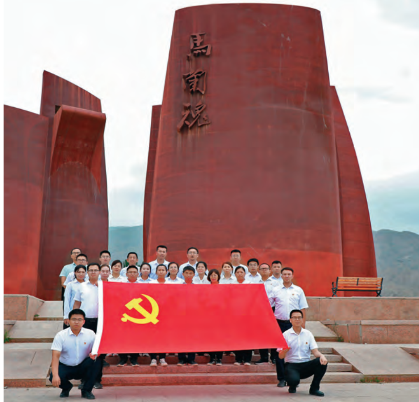
和硕县委组织部组织开展“传承马兰精神赓续红色血脉”主题党日活动。

培训,常态化开展“组工大讲堂”“岗位大练兵”、技能竞赛等活动,部领导班子成员带头讲形势、业务骨干常态讲业务、其他干部定期讲收获,引导组工干部立足本职钻研业务,提升创造性开展工作的能力。注重实践锻炼。建立健全组织部门内部多岗位锻炼制度,加大交流、轮岗力度,促使组工干部全面了解熟悉组工业务。推行组工干部全覆盖包联县直部门单位和乡镇,定期深入包联单位分析干部履职和党组织、党员发挥作用情况,在实践中经受锻炼、丰富阅历、增长才干,成为组织工作的“业务通”。