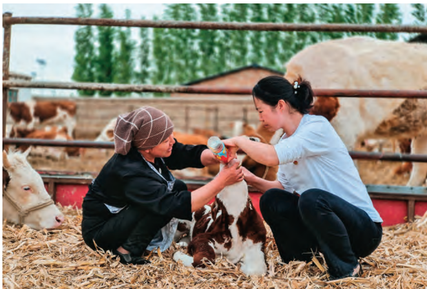
塔城市委组织部年轻干部在喀拉哈巴克乡库勒村帮助养殖户做好牲畜疫病预防工作。

学+分领域政策相关科室学+专业型政策业务科室学”模式,常态化开展每日一学,定期举办组工微讲堂、开展业务大比武,帮助组工干部提升业务水平。坚持“多面培养、多岗锻炼”,组织12名干部跨科室轮岗锻炼,帮助组工干部补短板、强弱项;采取跟班培训、以干带训等方