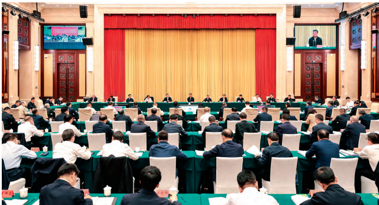
9月13日,自治区召开第十一批援疆干部人才代表座谈会。自治区党委书记、兵团党委第一书记、第一政委马兴瑞出席会议并讲话。

9月13日下午,自治区召开第十一批援疆干部人才代表座谈会,深入学习贯彻习近平总书记关于做好新时代对口援疆工作的重要讲话重要指示精神,认真贯彻落实第九次全国对口支援新疆工作会议部署安排,围绕更好发挥援疆干部人才的独特优势作用,听取意见建议,谋划务实举措,进一步调动广大援疆干部人才的积极性、主动性、创造性,为建设美丽新疆作出新的更大贡献。自治区党委书记、兵团党委第一书记、第一政委马兴瑞出席会议并讲话。