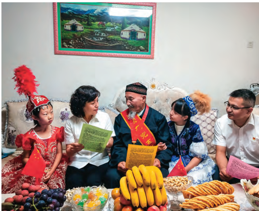
阿勒泰市组织党员干部成立宣传小分队宣讲党的惠民政策。