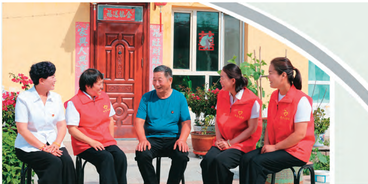
新疆托里县网格员收集群众诉求，解决群众急难愁盼问题。

充分发挥新疆可可托海职业技术学校师资力量，围绕技术原理、作业技巧、操作规程等理论课程，开设“技能人才强基”培训班，切实提升学员理论水平与学以致用的能