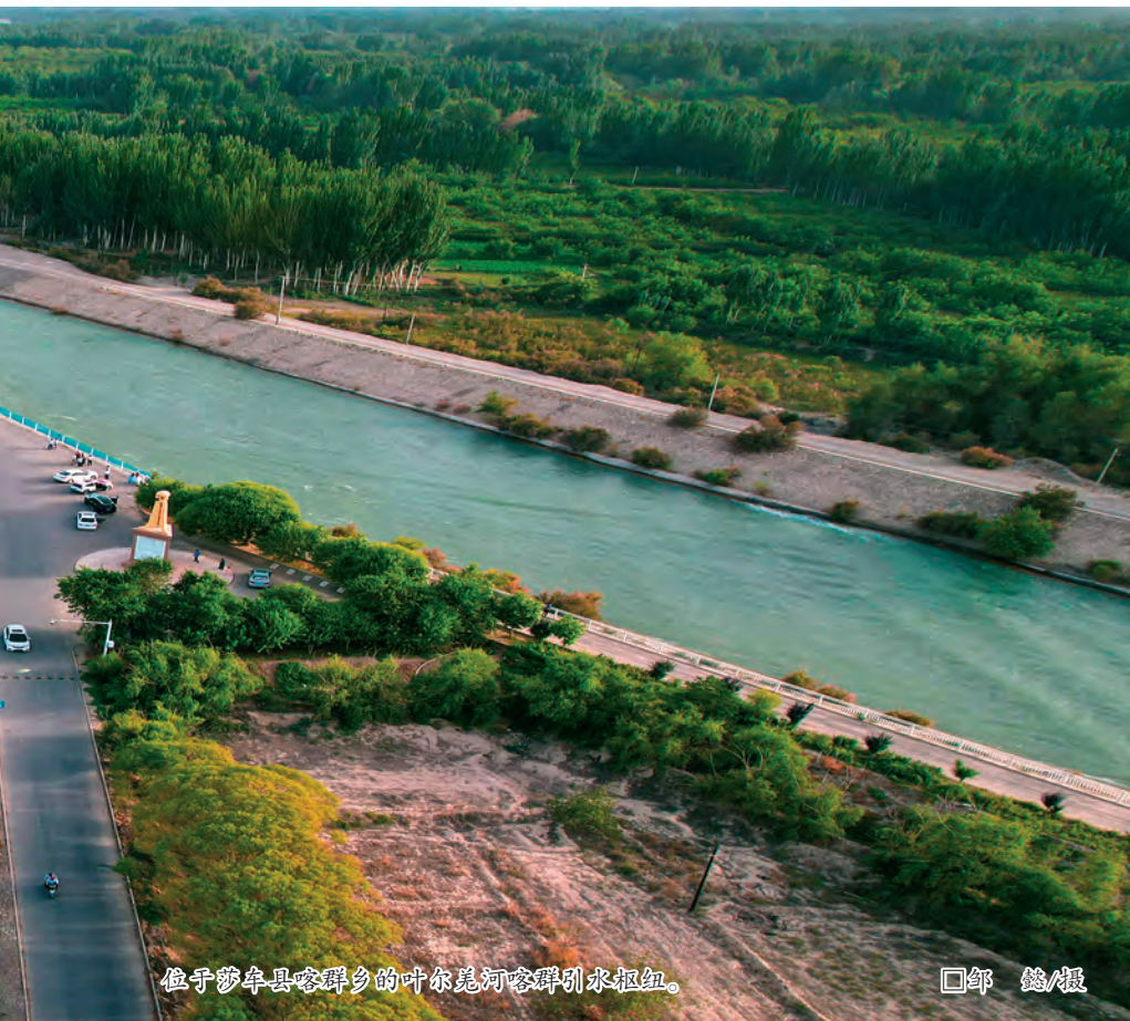
位于莎车县喀群乡的叶尔羌河喀群引水枢纽。