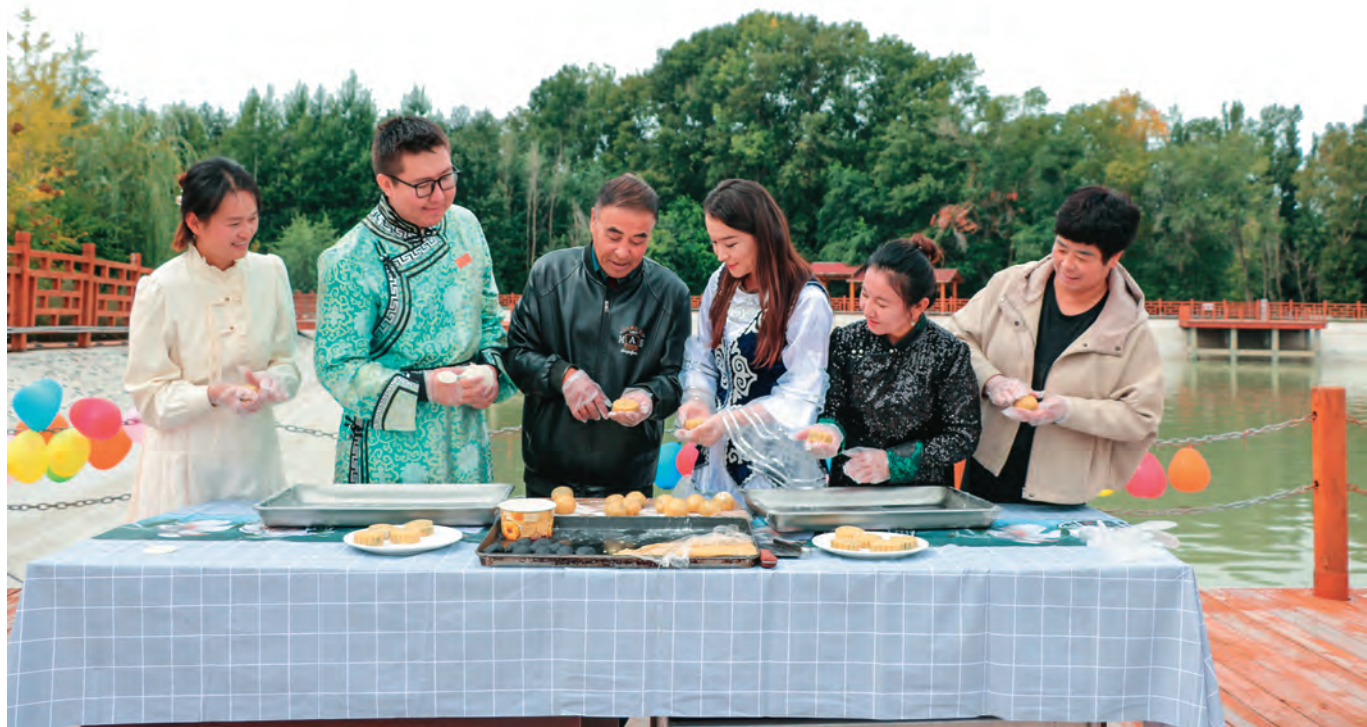
温泉县安格里格镇充分发挥“石榴籽服务站”作用,组织党员干部与结对亲戚一起拉家常、做美食,感受优秀传统文化。

述,纳入各级党校课程体系和干部教育培训办班计划,作为各类培训班必修课、基础课,教育引导党员干部铸牢中华民族共同体意识。发挥基层党组织、驻村工作队等各支力量作用,充分运用“三会一课”“党课开讲啦”等载体,多层次、全覆盖、常态化开展习近平总书记关于加强和