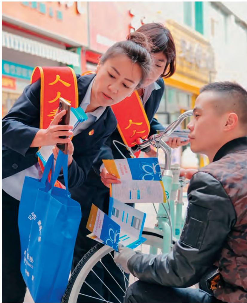
新疆哈密市社保中心宣传小分队宣传社保知识。