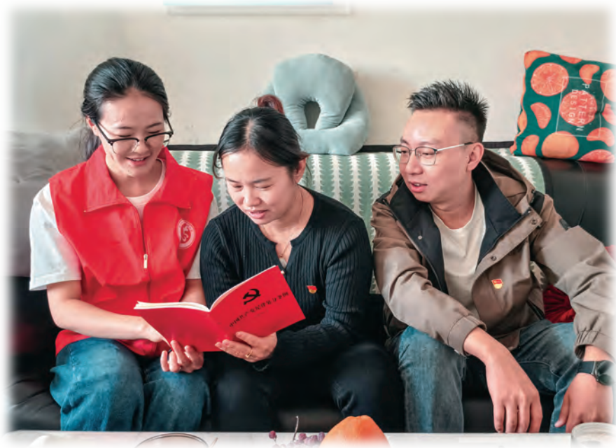
呼图壁县委组织部坚持送学上门,促进基层党员干部素质提升。

恪守公道正派职业品德。坚持组工干部核心价值追求,坚守公道正派组织工作生命线,始终做到公平、公道、公正,树立组工干部良好形象。公平选拔干部。严格执行干部选拔任用工作条例,严把分析研判和动议、民主推荐、考察、讨论决