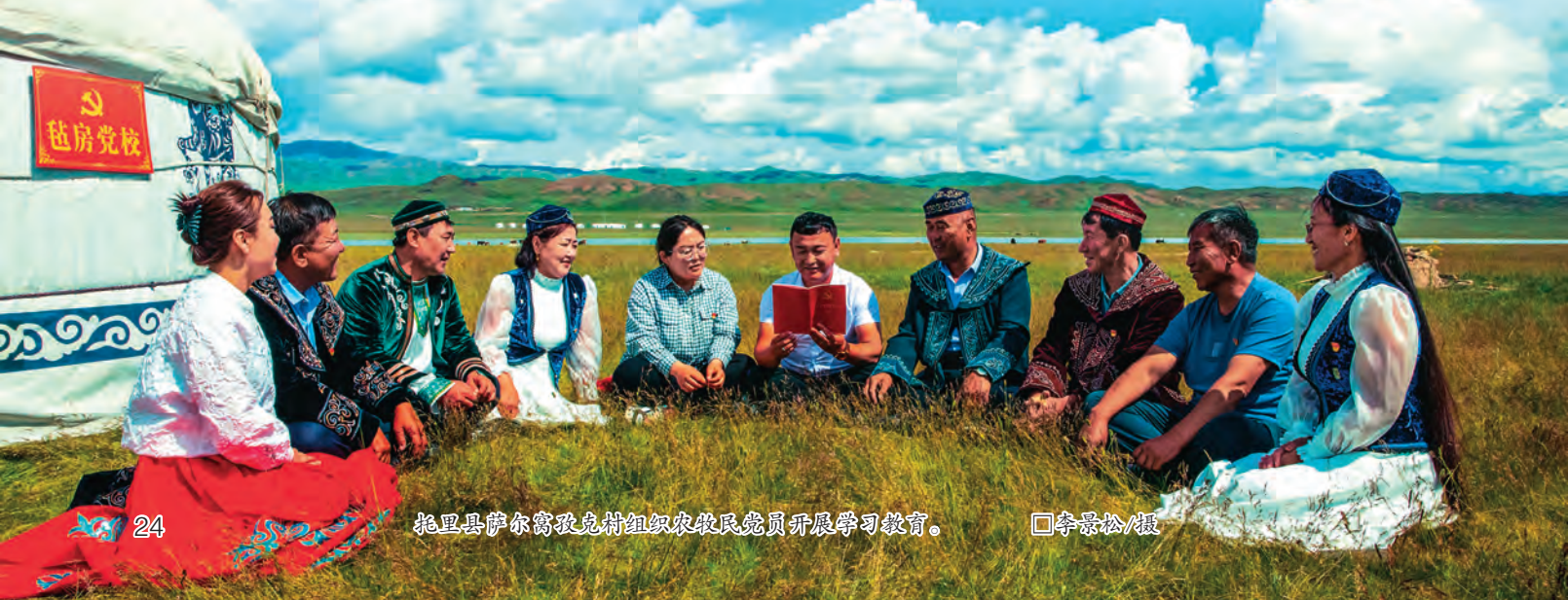
托里县萨尔窝孜克村组织农牧民党员开展学习教育。