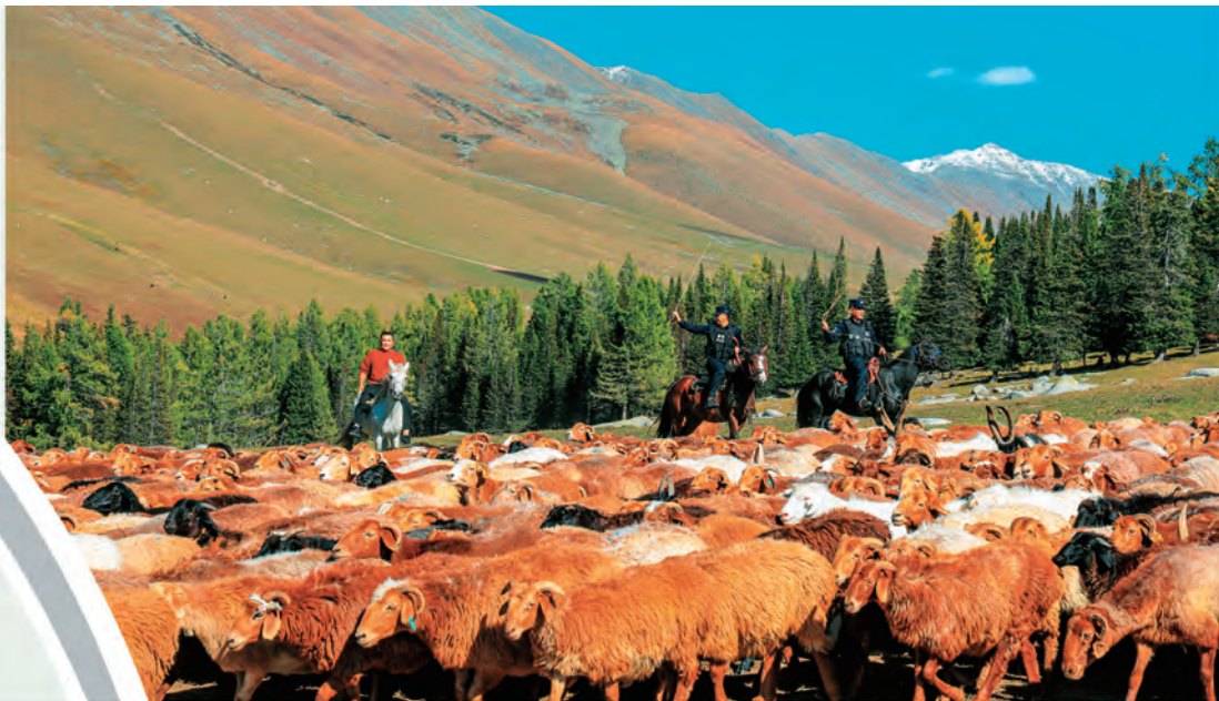
新疆出入境边防检查总站阿勒泰边境管理支队禾木边境派出所组织民警护航牧民秋季转场。