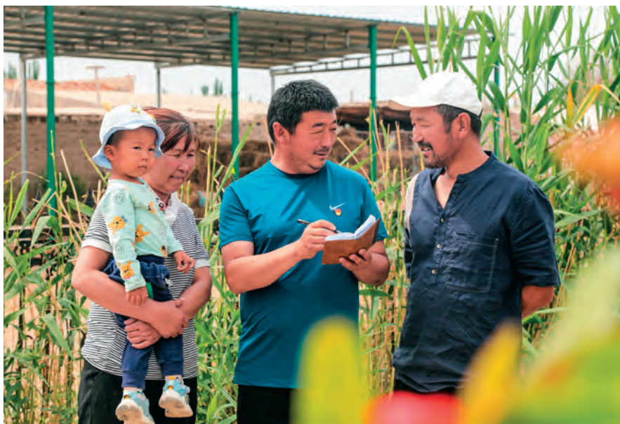
博湖县文体广电和旅游局驻乌兰再格森镇乌图阿特勒村工作队和村“两委”组织村干部、工作队队员开展入户走访活动。