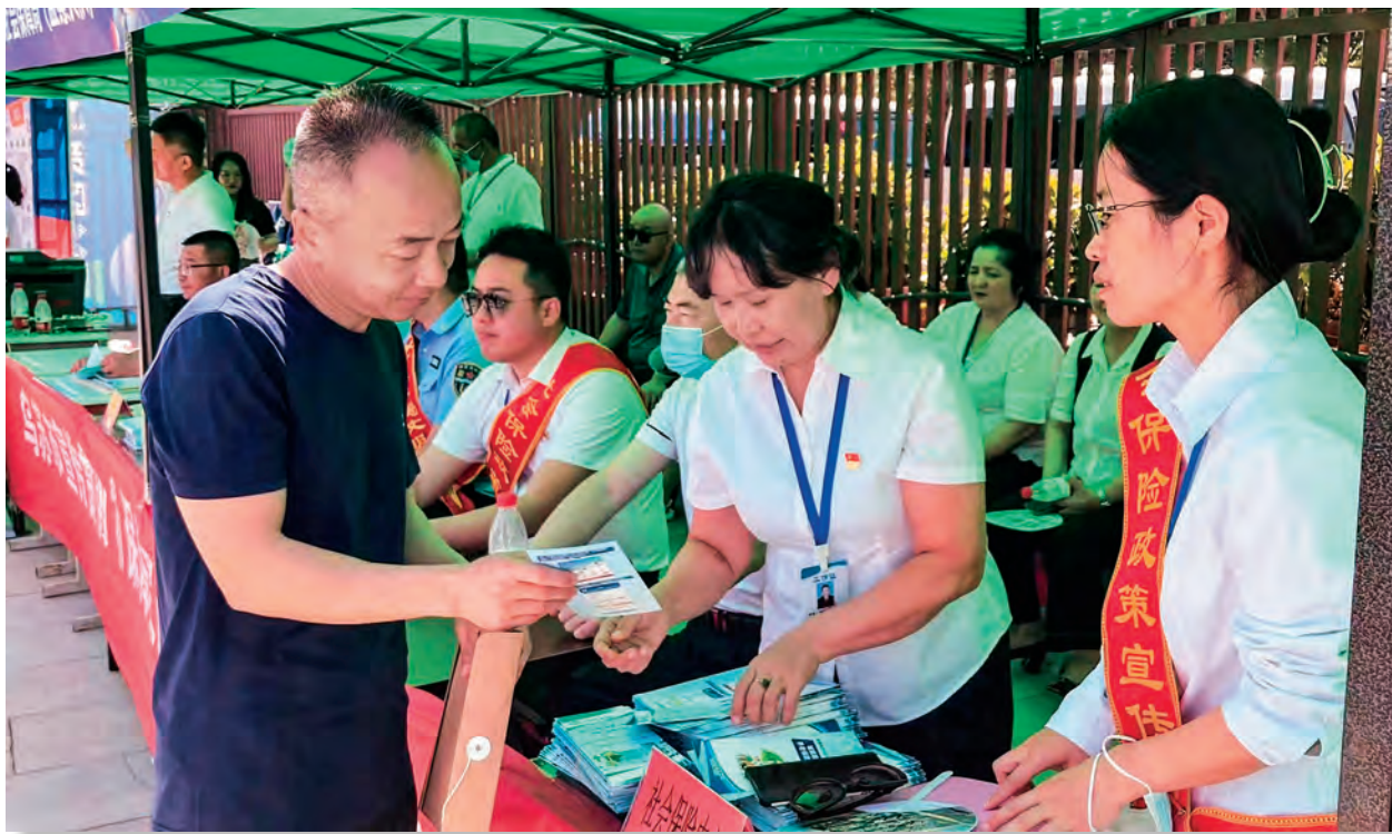
新疆乌苏市开展社会保险政策宣传活动。

自治区人力资源和社会保障厅深入贯彻落实党中央、自治区党委关于群众身边不正之风和腐败问题集中整治工作的部署要求,紧盯群众关切,集中开展行动,压紧压实责任,推进专项整治各项工作落实落细。