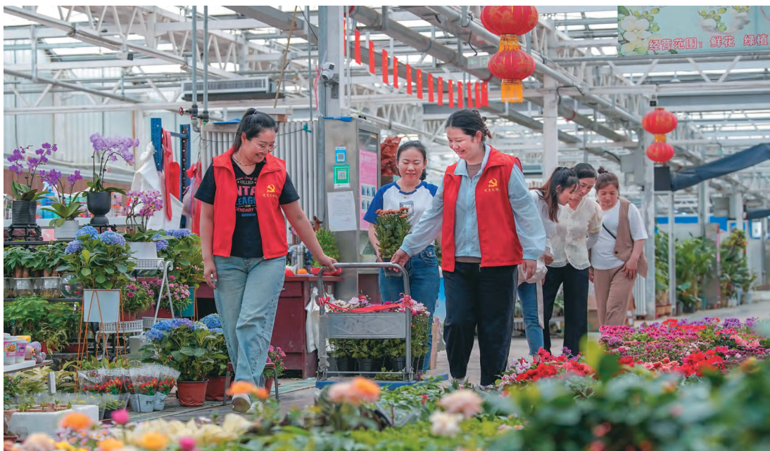
新疆乌苏市党员志愿者帮助花农运输鲜花。