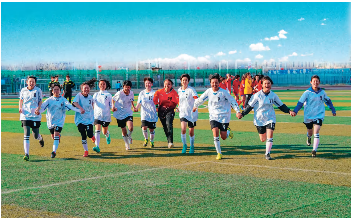
新疆昌吉市通过举办体育赛事促进各族青少年交往交流交融。