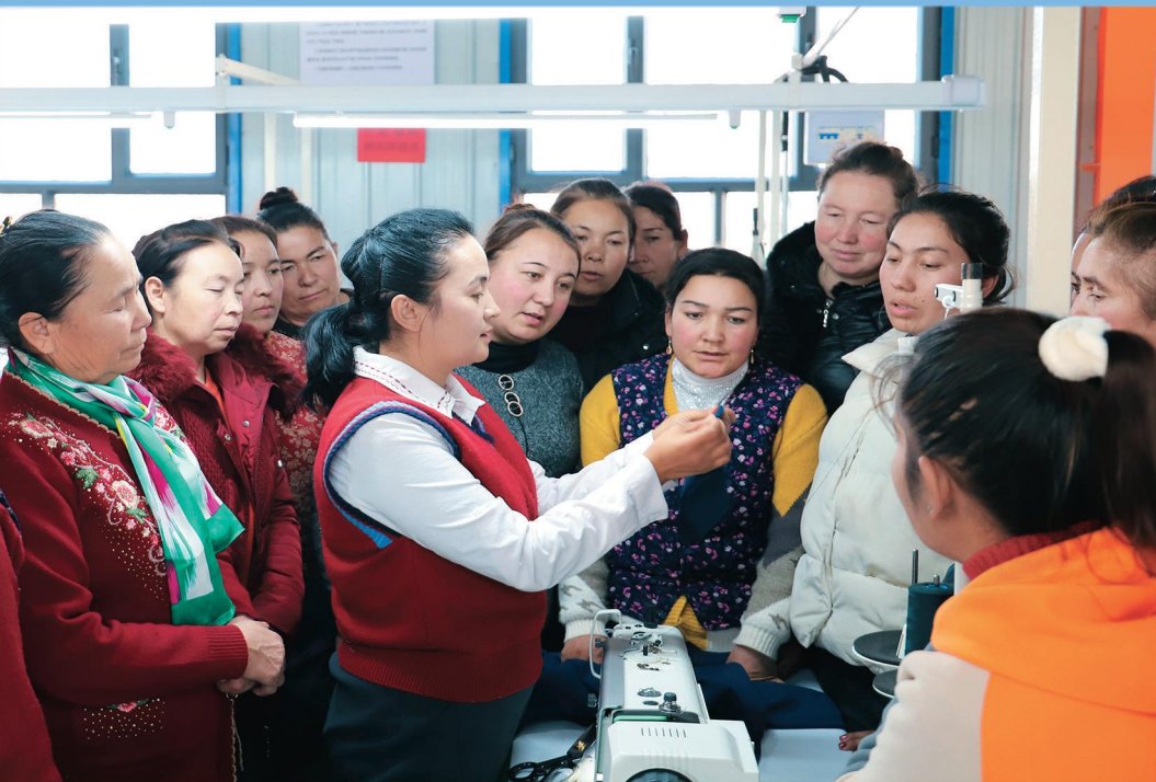
▲疏勒县塔孜洪乡尤喀克其盖图克村利用冬闲开展“冬季大培训”活动,提升群众就业技能。