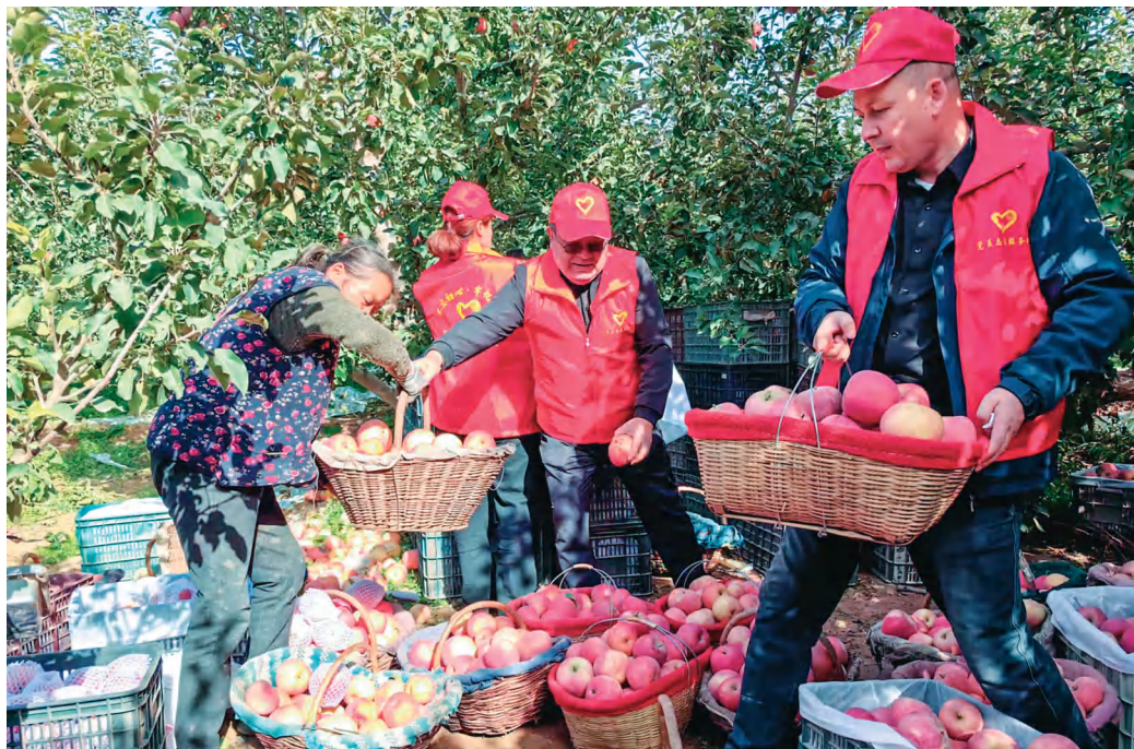
阿克苏地区融媒体中心党员干部到果园开展志愿服务。

委会、编委会、经委会、技委会四个委员会,构建“中心党委—党支部—党小组”组织体系,统辖相关业务中心,优化各业务板块协同发力,推进一体化运作,实现组织架构覆盖统领业务。拓宽传播渠道。筑牢党对意识形态工作的领导权,构建报、台、网、微、端、抖、屏“七位一体”全媒体传播矩阵,形成集约高效的全媒体传播链条,通过技术共融、数据共通、资源共享等功能,建立“党建+媒体”矩阵。强化运