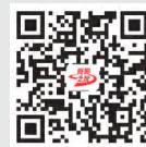
《党员之友》 电子期刊(昆仑网)