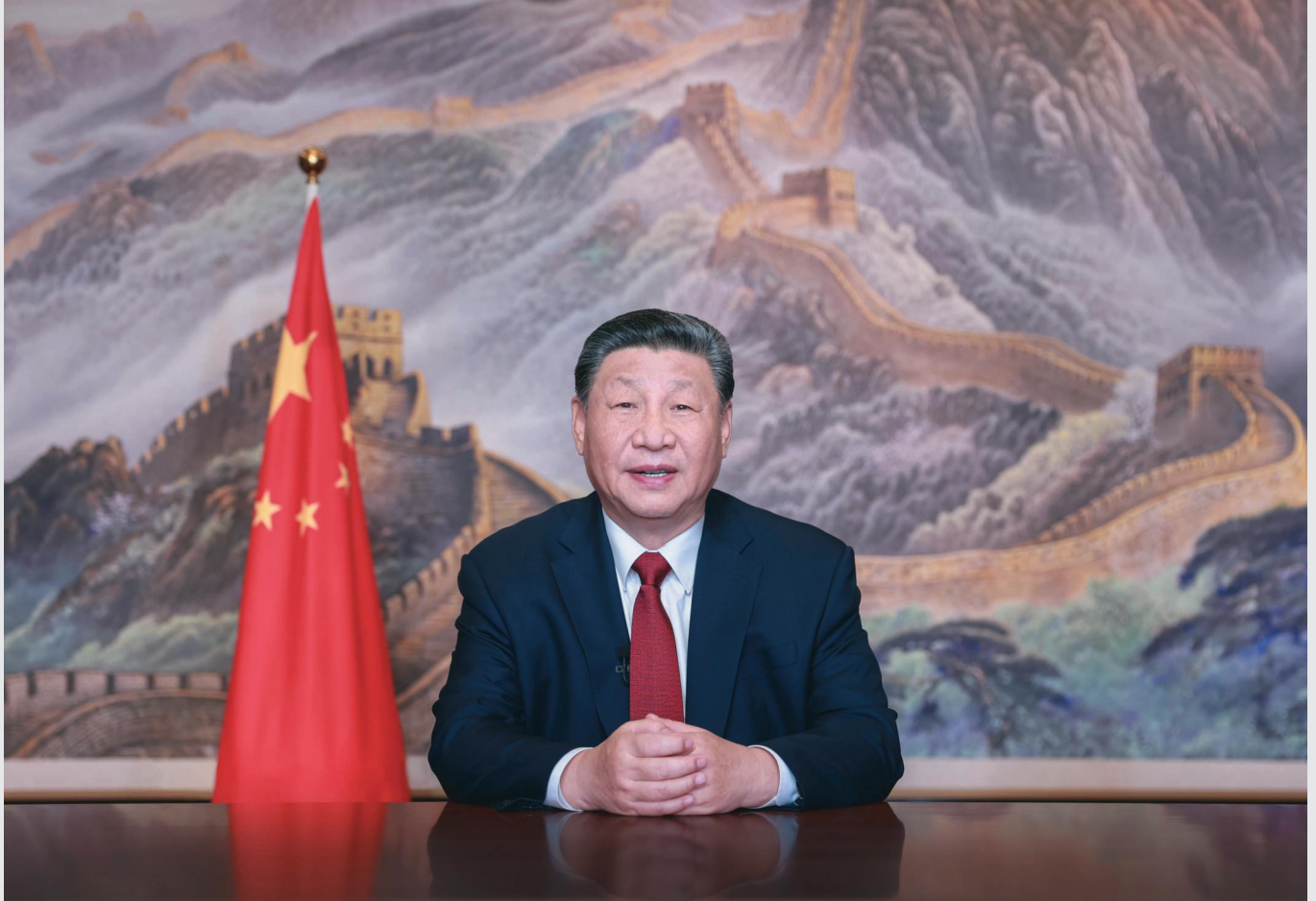
新年前夕,国家主席习近平通过中央广播电视总台和互联网,发表二〇二五年新年贺词。