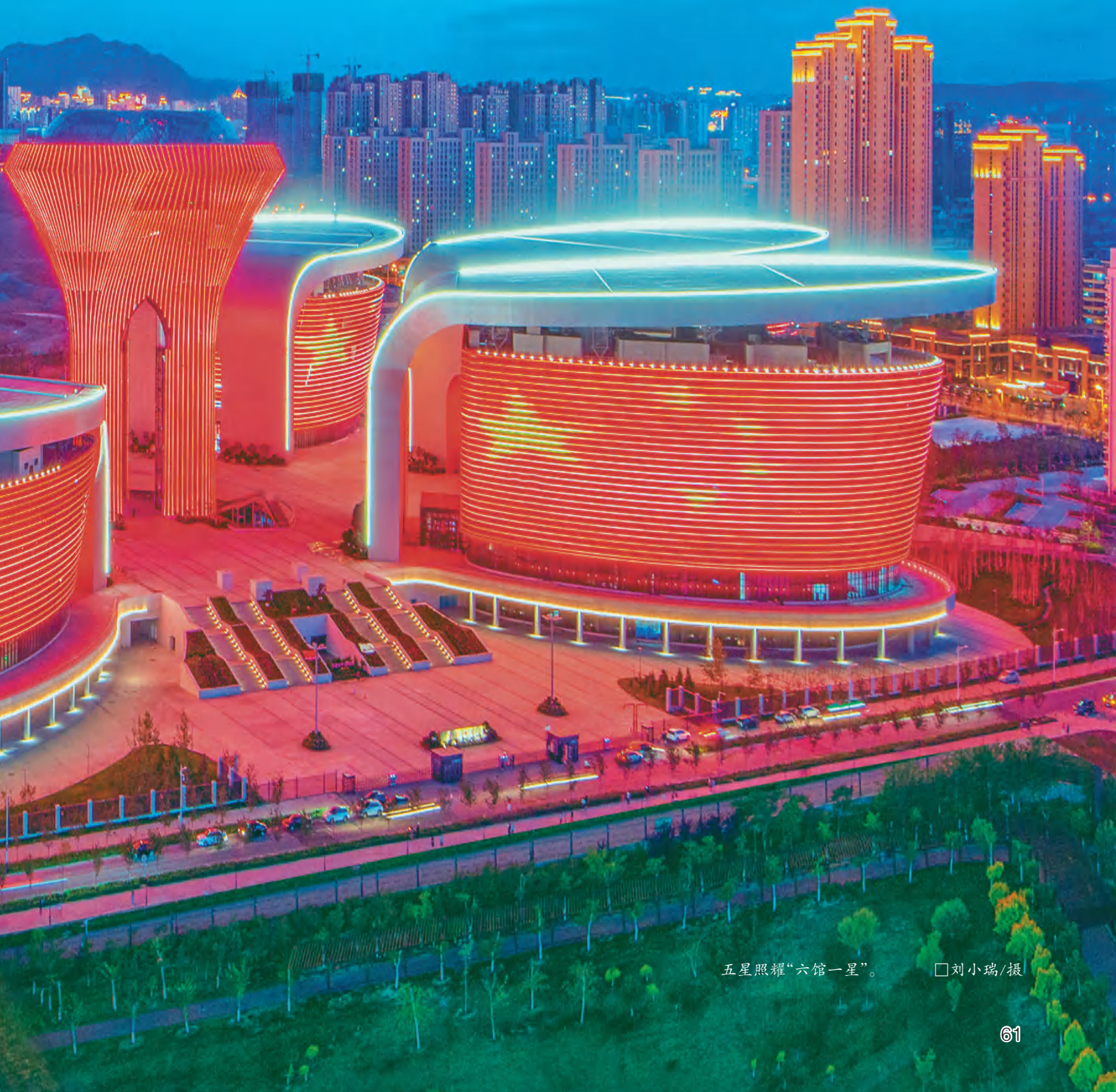
五星照耀“六馆一星”。