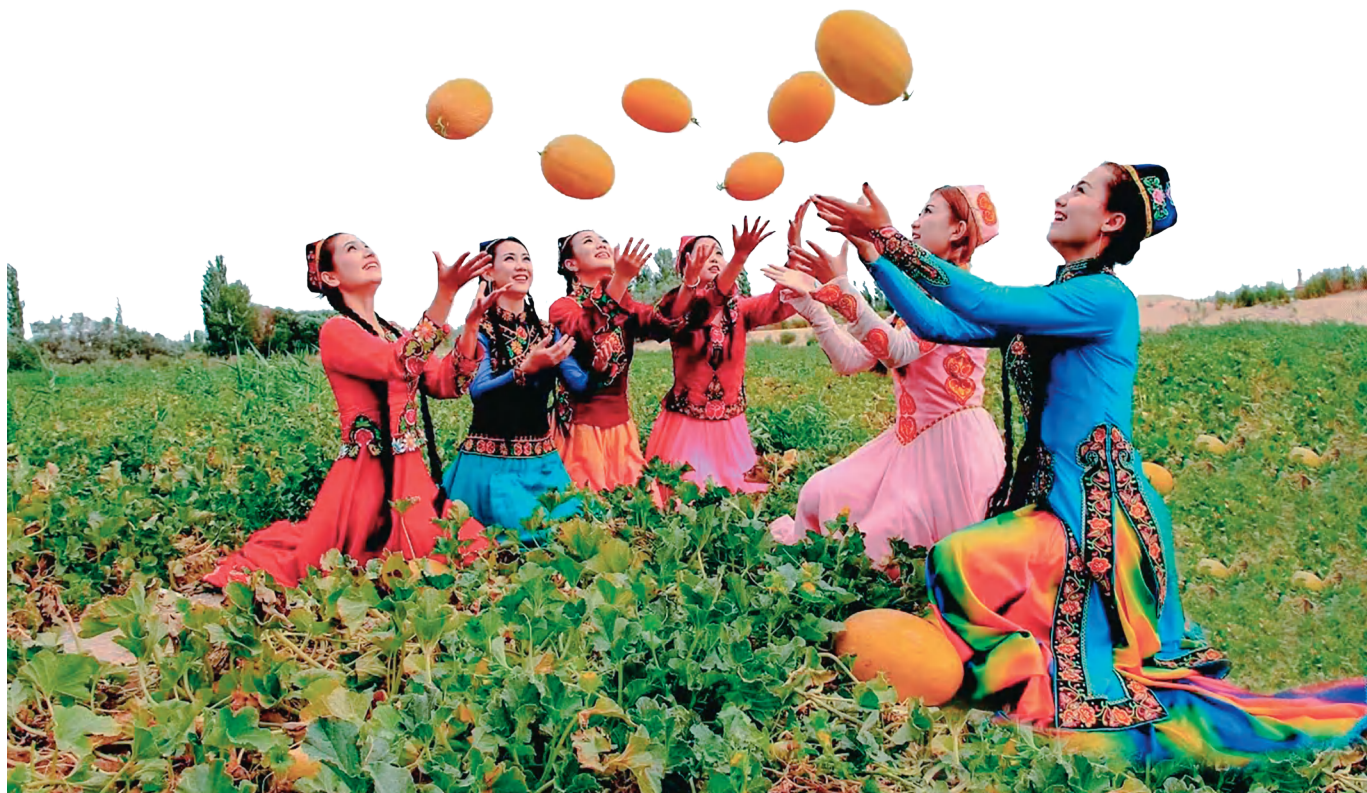
哈密市伊州区花园乡卡日塔里村早熟瓜基地的哈密瓜“甜蜜”上市,瓜乡少女尽享丰收喜悦。