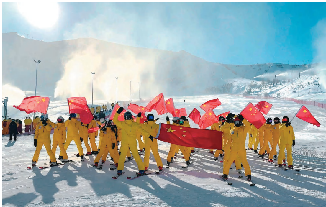
新疆阿勒泰市“温暖雪都”党员志愿服务队在将军山滑雪场开展花样滑雪活动。