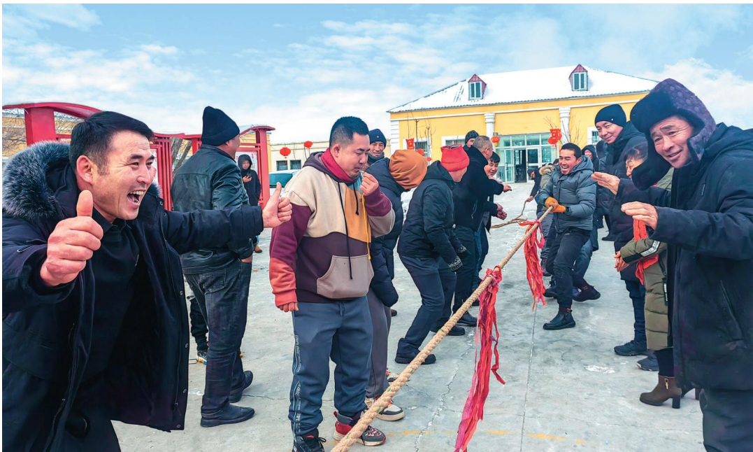
新疆富蕴县喀拉布勒根乡组织党员群众开展拔河比赛。

理论武装铸就对党忠诚政治品质,始终坚持把党的全面领导贯穿人社工作各领域全过程,严格落实“第一议题”、党组理论学习中心组学习等制度,深学细悟习近平新时代中国特色社会主义思想,引导党员干部以实干担当践行为民服务的初心使命。党建品牌造就业务精良战斗集体,坚持以“三学三亮三比”争当先锋活动为契机,创设党员干部“每周之星”综合激励品牌,结合每周科室长、业务骨干“大讲堂”,围绕重要业务经办、重点技能延展、群众疑难解惑,开展全方位讲解,提高党员干部综合素质,营造学业务、强素质、练技能浓厚氛围。责任落实确保惠民政策落地有声,将推动实现高质量充分就业摆在突出位置,创新服务举措,推动就业服务下沉村(社区),重点打造“就业驿站”一站式服务平台,扩大线上线下招聘范围,加大人社惠企惠民政策解读、了解企业用工引才需求,全力打通服务企业“最后一里”,为温宿经济高质量发展贡献人社力量。(张艳侠)