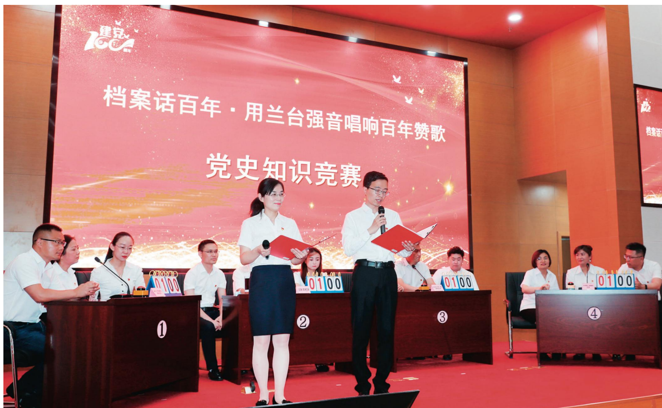
自治区档案馆开展党史知识竞赛。