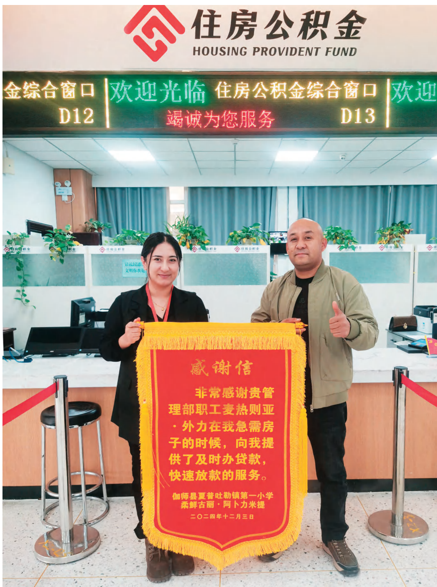
喀什地区住房公积金管理中心伽师县管理部工作人员收到群众感谢信。

以服务民生为根本出发点与落脚点,扎实创建“惠民公积金、服务暖人心”党建品牌,聚焦群众急难愁盼问题出新招、解难题,切实增强缴存群众的获得感与满意度。优化服务流程。制定实施全区统一的归集、提取、贷款、资金管理业务规范,公开业务办理指南,实施“跨省通办”“全区通办”“一窗通办”,实现住房公积金业务线上线下无缝衔接;推行“管办分离”业务委托模式,将住房公积金业务交由受委托银行的营业网点办理,打造“十五分钟公