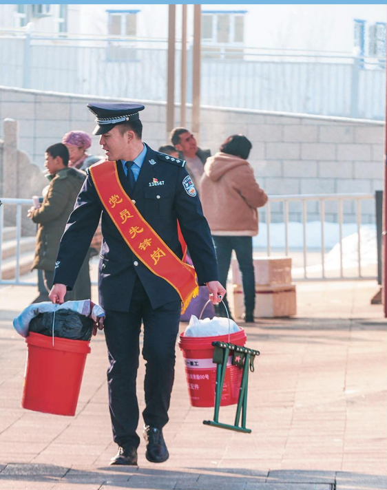
机场、汽车站等地,开展“温暖回家路,心系归乡人” □于苏甫·艾尼/摄