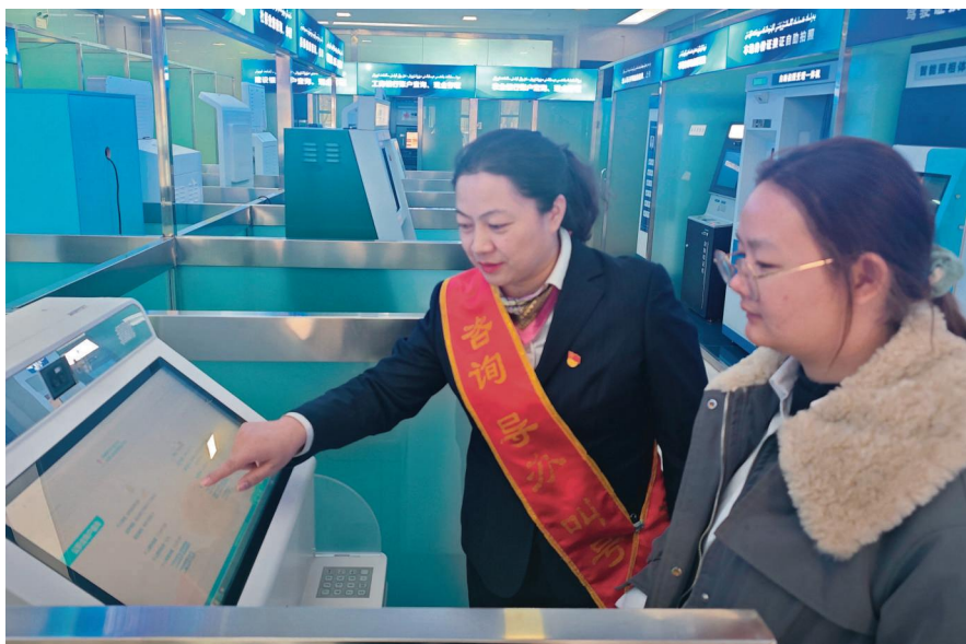
阿克苏地区住房公积金管理中心党员志愿者帮助群众办理业务。

坚持围绕中心抓党建、抓好党建促业务,推行支部书记领办、党员骨干领衔重点项目,推进住房公积金管理数字化改革。构建信息平台。落实加强数字政府建设要求,成立“党员先锋突击队”开展业务攻