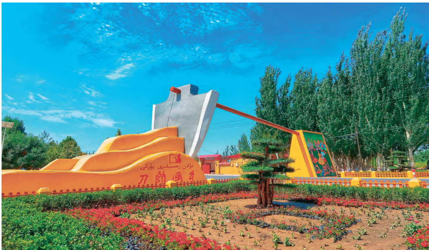
日照援疆全力支持麦盖提县打造“刀郎画乡”景区。