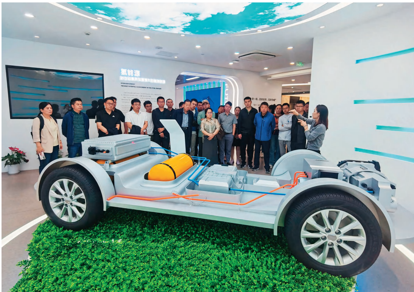
克拉玛依市组织油气、化工行业干部赴上海开展专题培训。