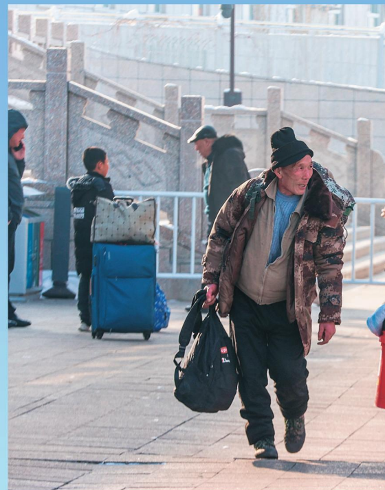
▲博乐市组织党员干部深入火车站、飞机场志愿服务活动。