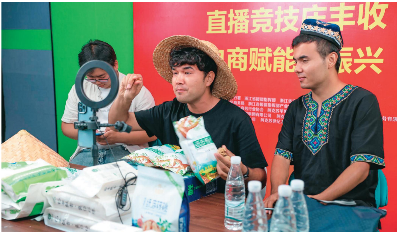
阿克苏地区融媒体中心党员干部开展公益助农直播。