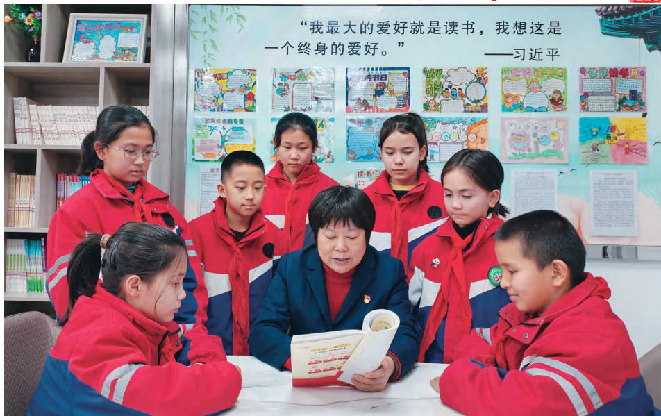
若羌县第二小学师生在思源卫士图书室开展“同读一本书”活动。