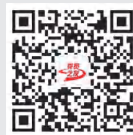
《党员之友》 微信公众号