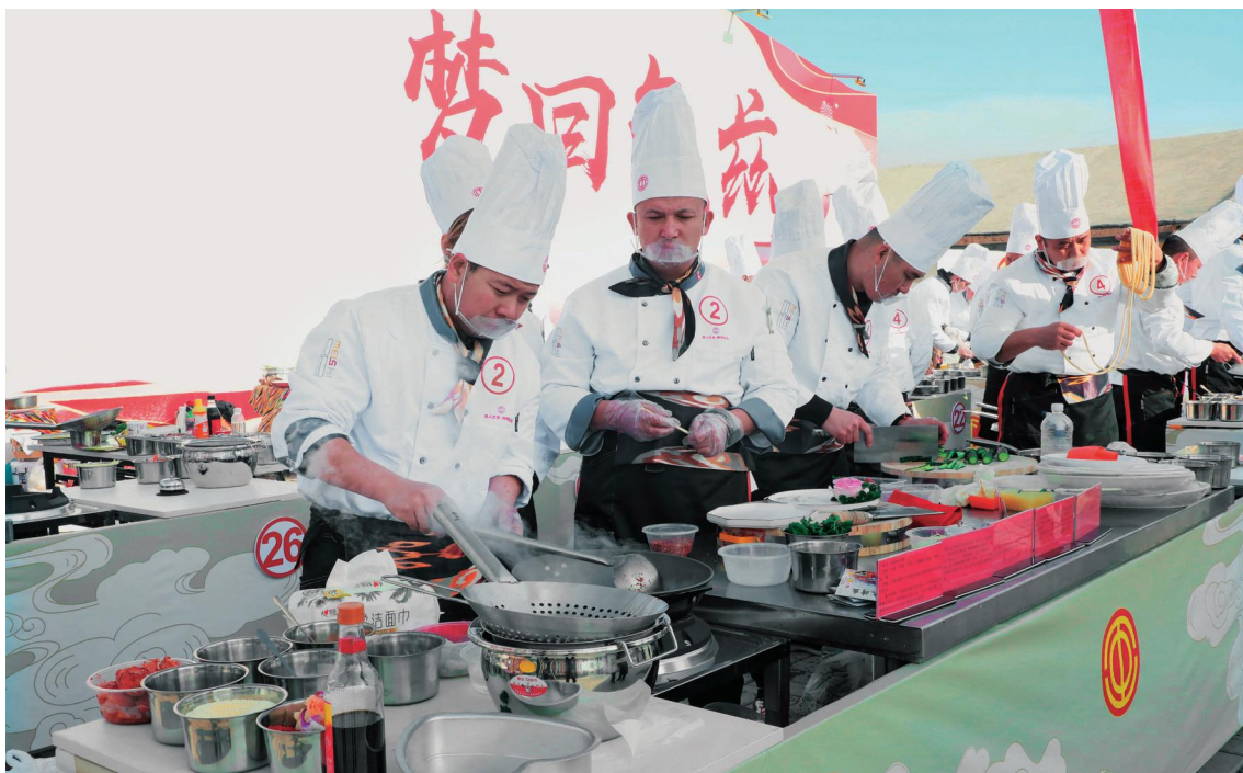
新疆库车市特色美食厨王争霸赛现场,技能人才正在制作当地特色美食。