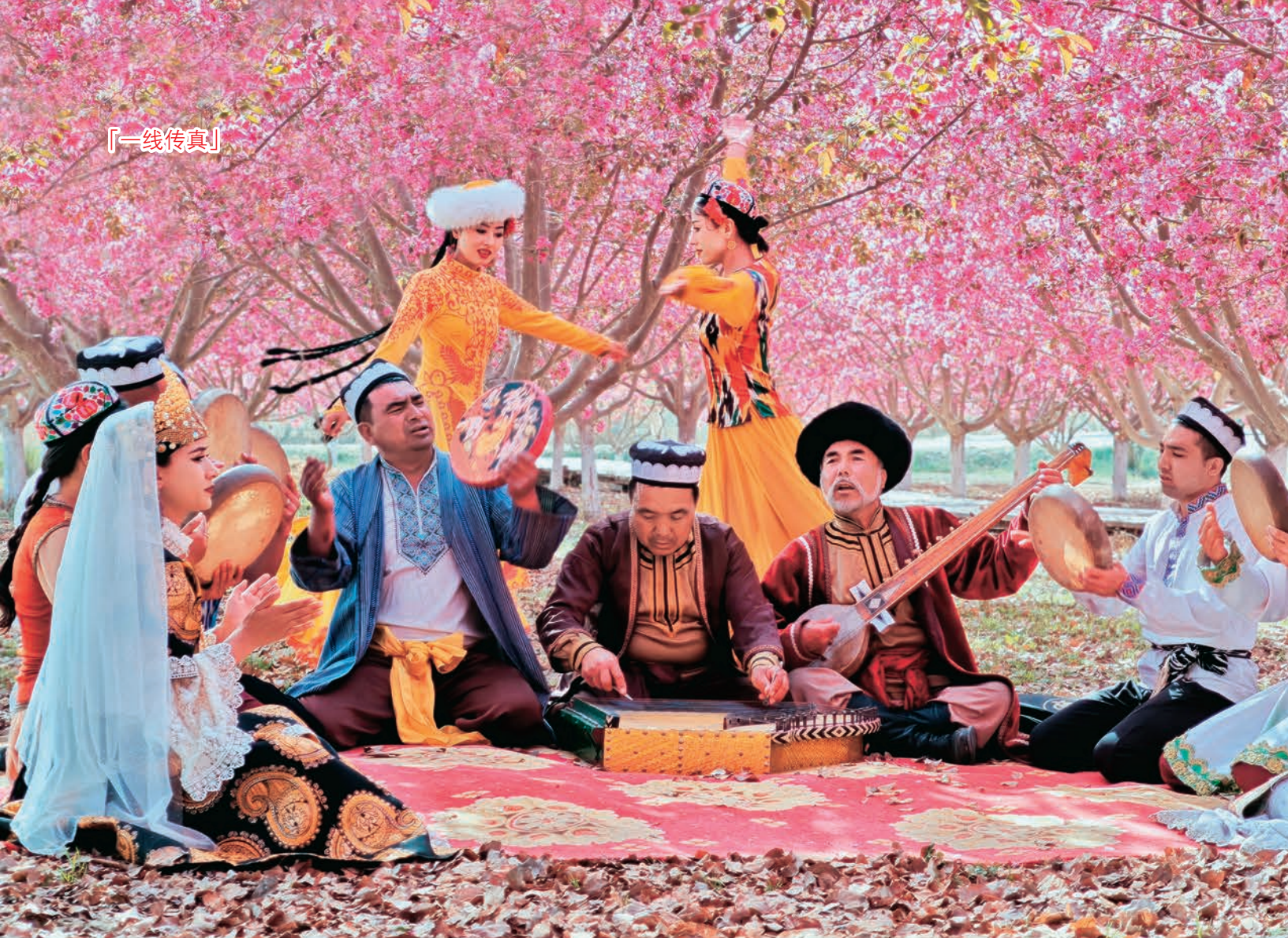
▲阿瓦提县通过开展非遗文化进景区等系列活动,推动文旅和非遗产业融合发展。图为刀郎部落景区演奏自治区级非物质文化遗产项目刀郎