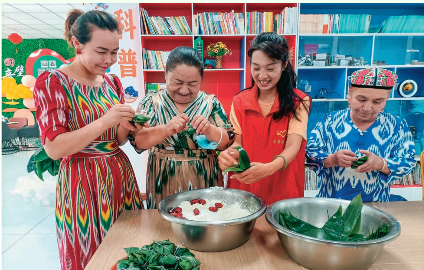
库尔勒市希望街道富民社区干部与居民同包“连心粽”，共度端午节。