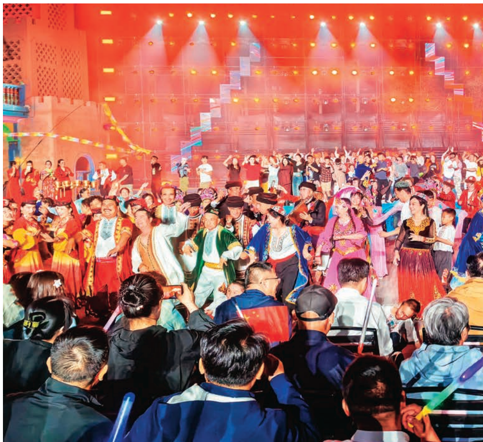
新疆“群众村晚”主会场活动在吐鲁番市高昌区葡萄乐园景区精彩启幕。

新疆吐鲁番市坚持党建引领，大力实施文旅融合发展战略，统筹文旅产业布局，丰富文旅产品和服务供给，戈壁绿洲变身富民热土，交出一份党建引领文旅产业高质量发展的亮眼答卷。