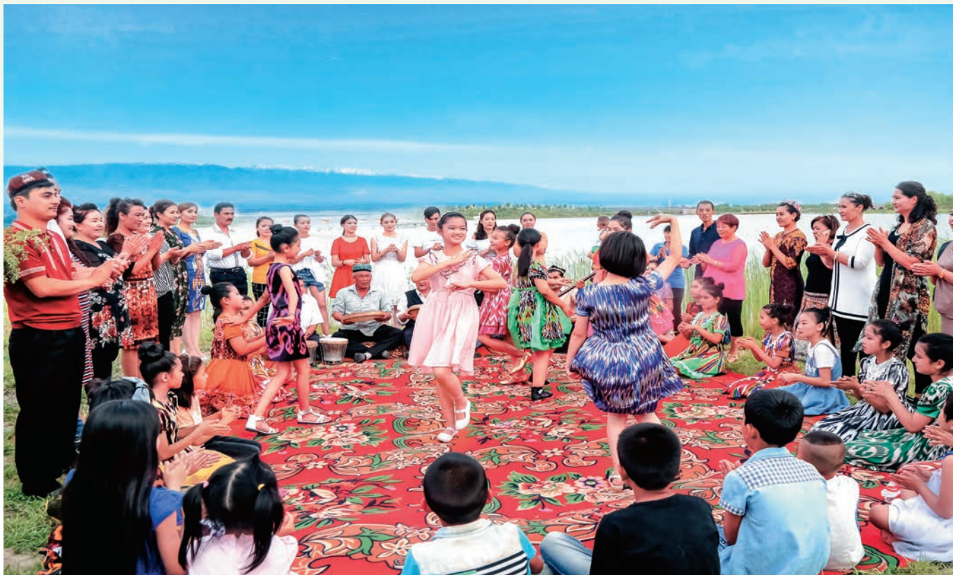
库尔勒市第一小学组织开展“大手拉小手·同心话团结”主题活动。