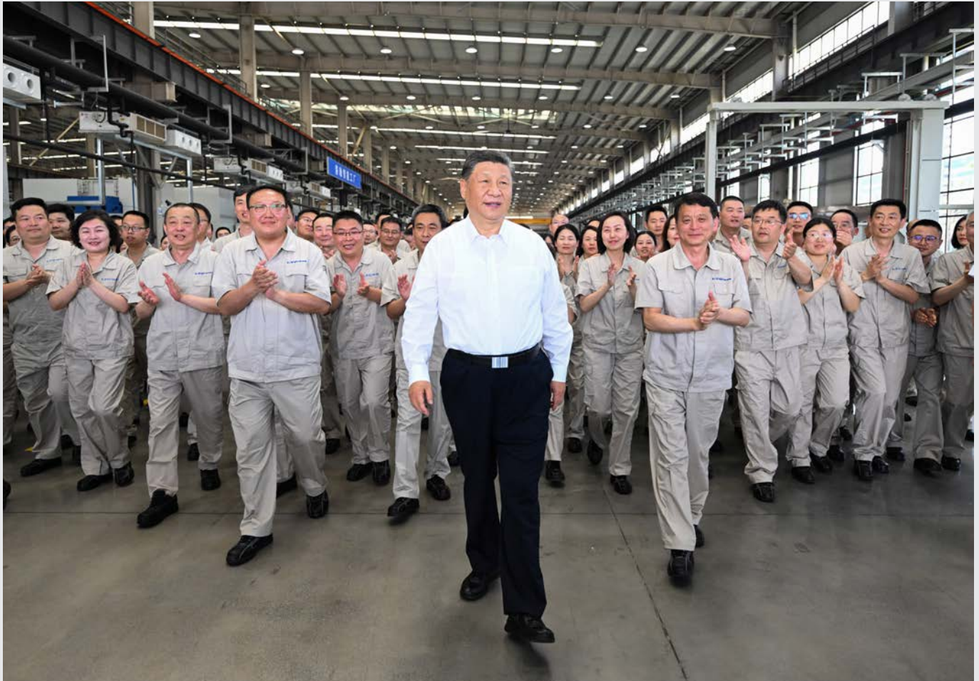
5月19日至20日,中共中央总书记、国家主席、中央军委主席习近平在河南考察。这是19日下午,习近平在洛阳轴承集团股份有限公司智能工厂考察时,同企业职工在一起。