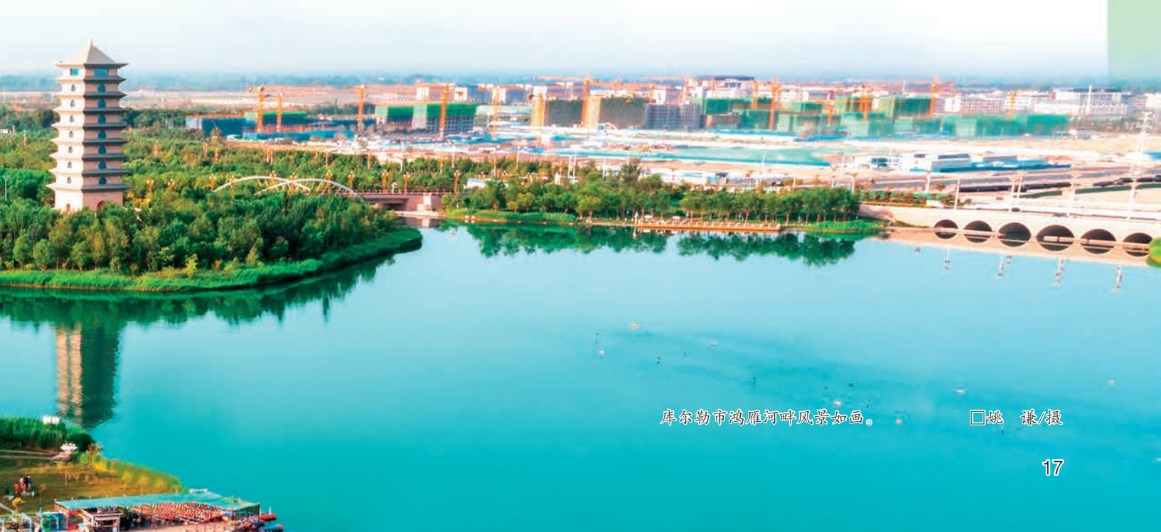
库尔勒市鸿雁河畔风景如画。