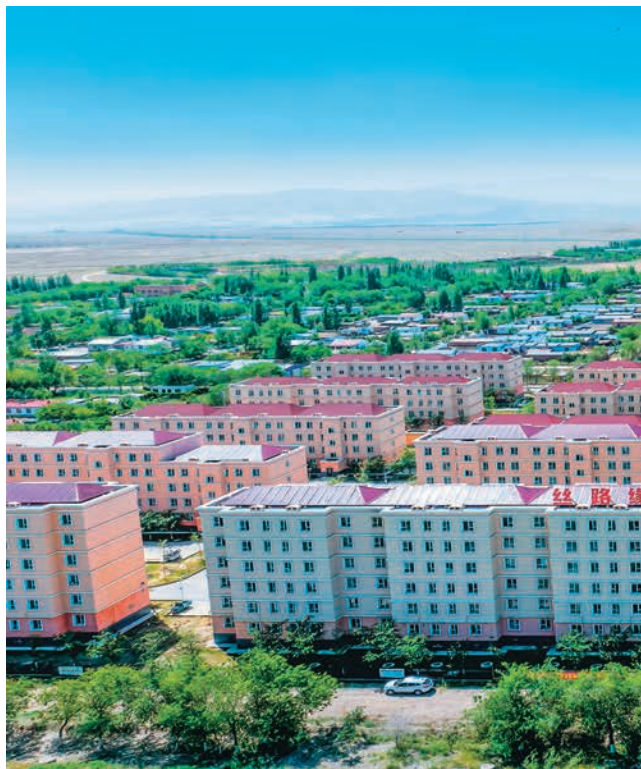
福建援疆标志性示范项目——昌吉市阿什里哈萨克民族乡“

夯实民生保障。加大资金投入,重点推进定居兴牧、安居富民、教育医疗等一批民生援疆工程建设,组织援疆干部人才与呼图壁县二十里店村农牧民结对帮扶,推动发展成果惠及民生、凝聚人心。建设昌吉市阿什里哈萨克民族乡“天鹅小镇”,帮助1700余名牧民实现定居安居,成为“民族团结一家亲”样板。