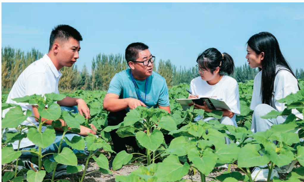
博湖县乌兰再格森镇在农业生产一线开设“田间课堂”,由农技人员为年轻党员干部讲解农业知识。

撑”责任链条。采用课程准入负面清单、教学质量评估指标、培训效果跟踪反馈等方式,实施“课前审查、课中督导、课后评价”全流程监督,巡回指导与动态评估相结合,确保办学质量持续提升。加强经费统筹管理,通过上级划拨培训经费、党费等方式,多元保障党校标准化建设和基层党员教育培训工作,不断提高基层党校规范化水平。