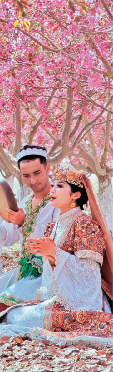
刀郎木卡姆。