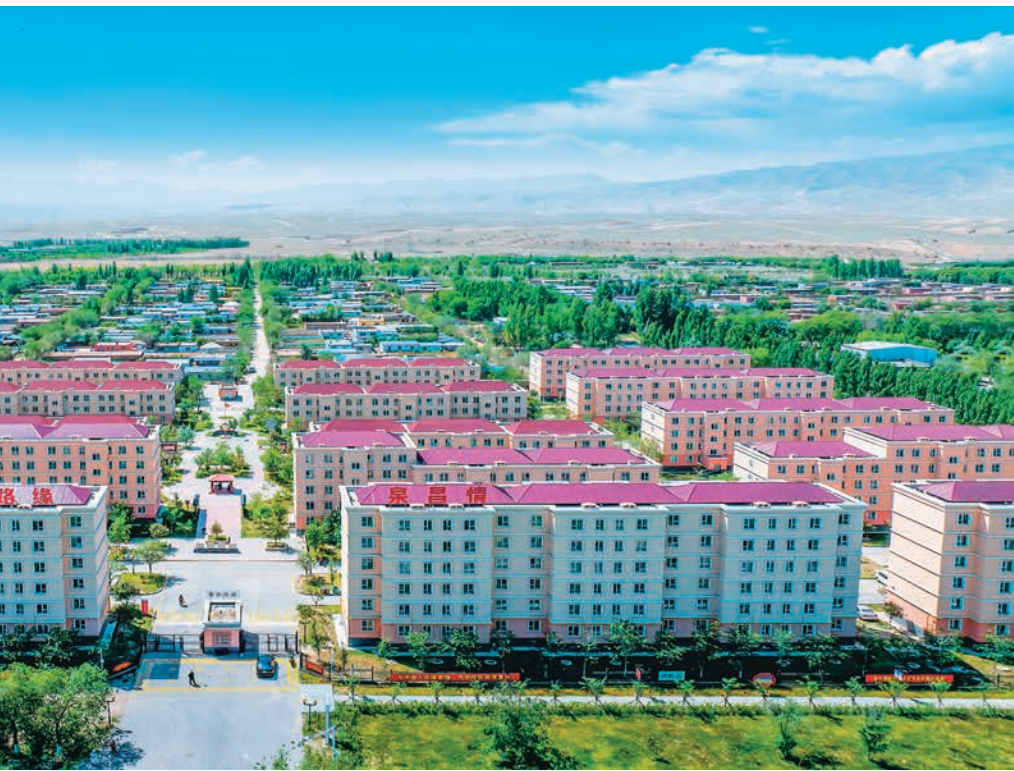
乡“天鹅小镇”牧民定居项目俯瞰图。