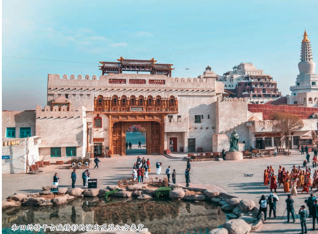
和田约特干古城精彩的演出吸引八方宾客。

深挖历史文化内涵,探索文化与旅游共生共荣的创新路径,推动文化遗产、非遗技艺与新兴旅游业态深度融合。文化遗产活态传承。利用现代科技手段对文化遗产进行