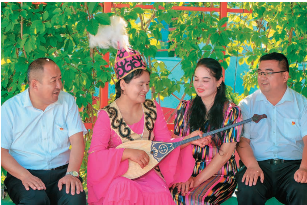
新疆博尔塔拉蒙古自治州教育局驻精河县阿合其农场农业三队工作队与群众共弹乐器、共话民族团结。