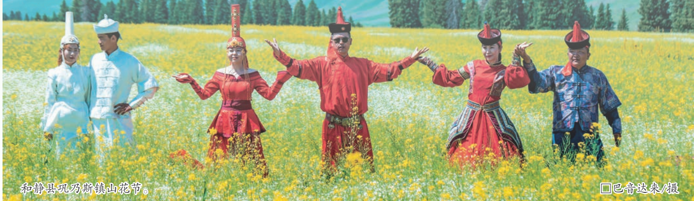
和静县巩乃斯镇山花节。