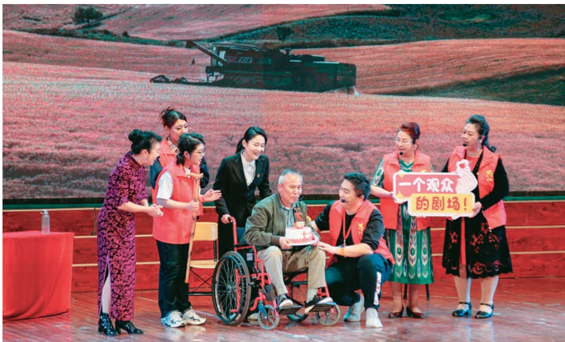
新疆乌鲁木齐市沙依巴克区开展“城市先锋”党员教育集中展演活动。