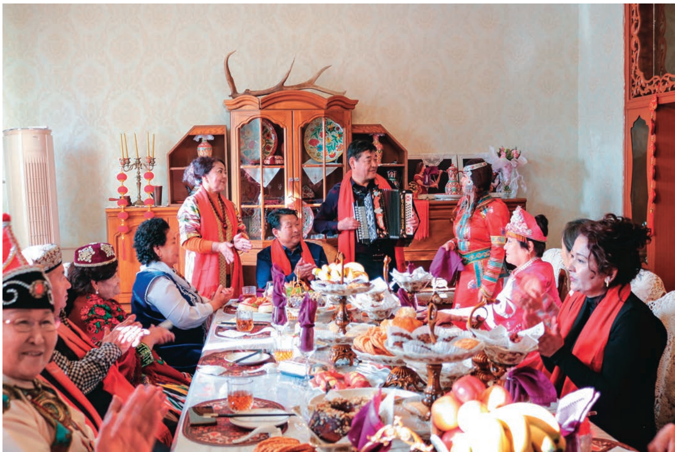
塔城市新城街道哈尔墩社区开展“邻里节·百家宴”活动。