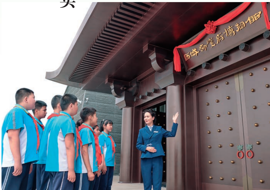
轮台县第一小学开展西域都护府博物馆游学活动。

“组织联建+课程联研+师资联培”模式,推出3门精品课程,其中1门入选教育部铸牢中华民族共同体意识教育资源库,为提升育人质量夯实教学基础。注重家校协同。广泛开展“三进两联一交友”活动,促进各族师生相互学习,相互帮助,共同成长。线上线下相结合,及时向家长反馈学生学习生活与思想情况,面向家长开展爱国主义教育、民族团结进步教育主题讲座等,提高家校共育能力,为青少年成长成才共同