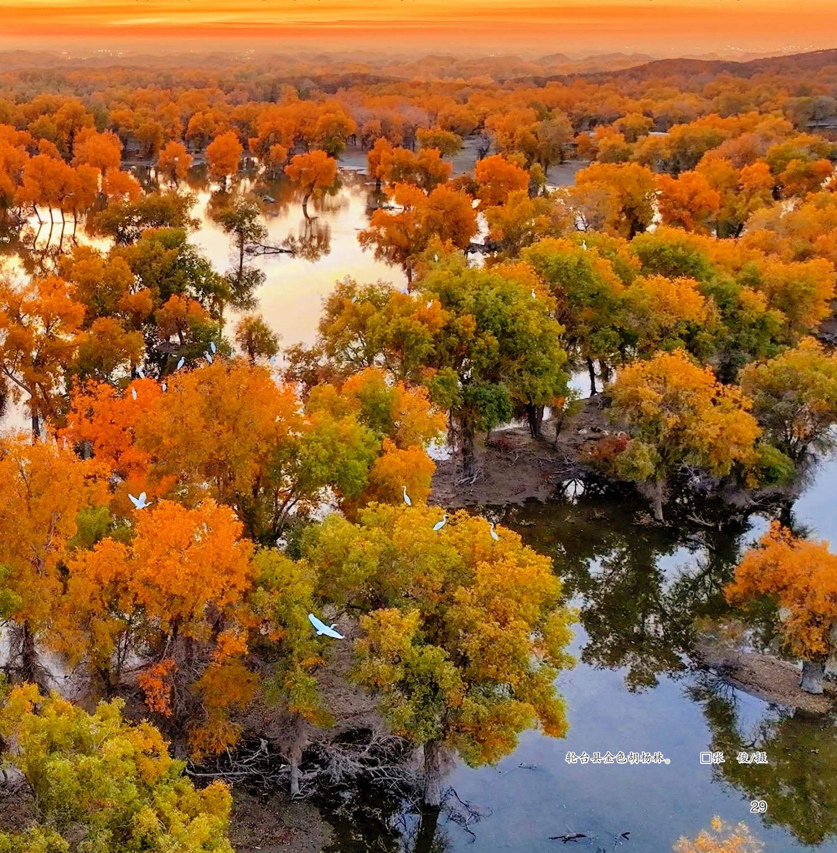
轮台县金色胡杨林。