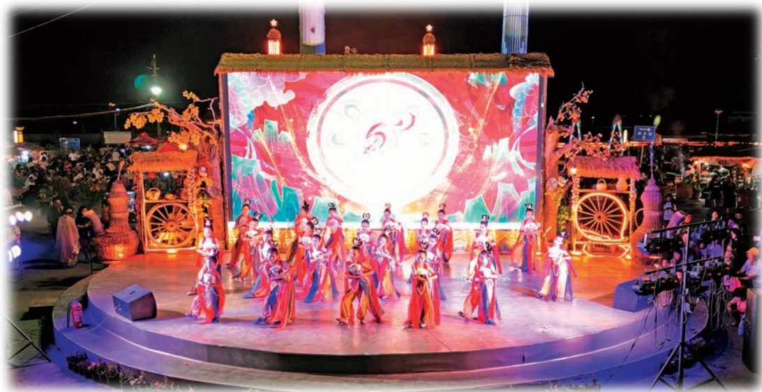
库车老城龟兹乐舞表演。