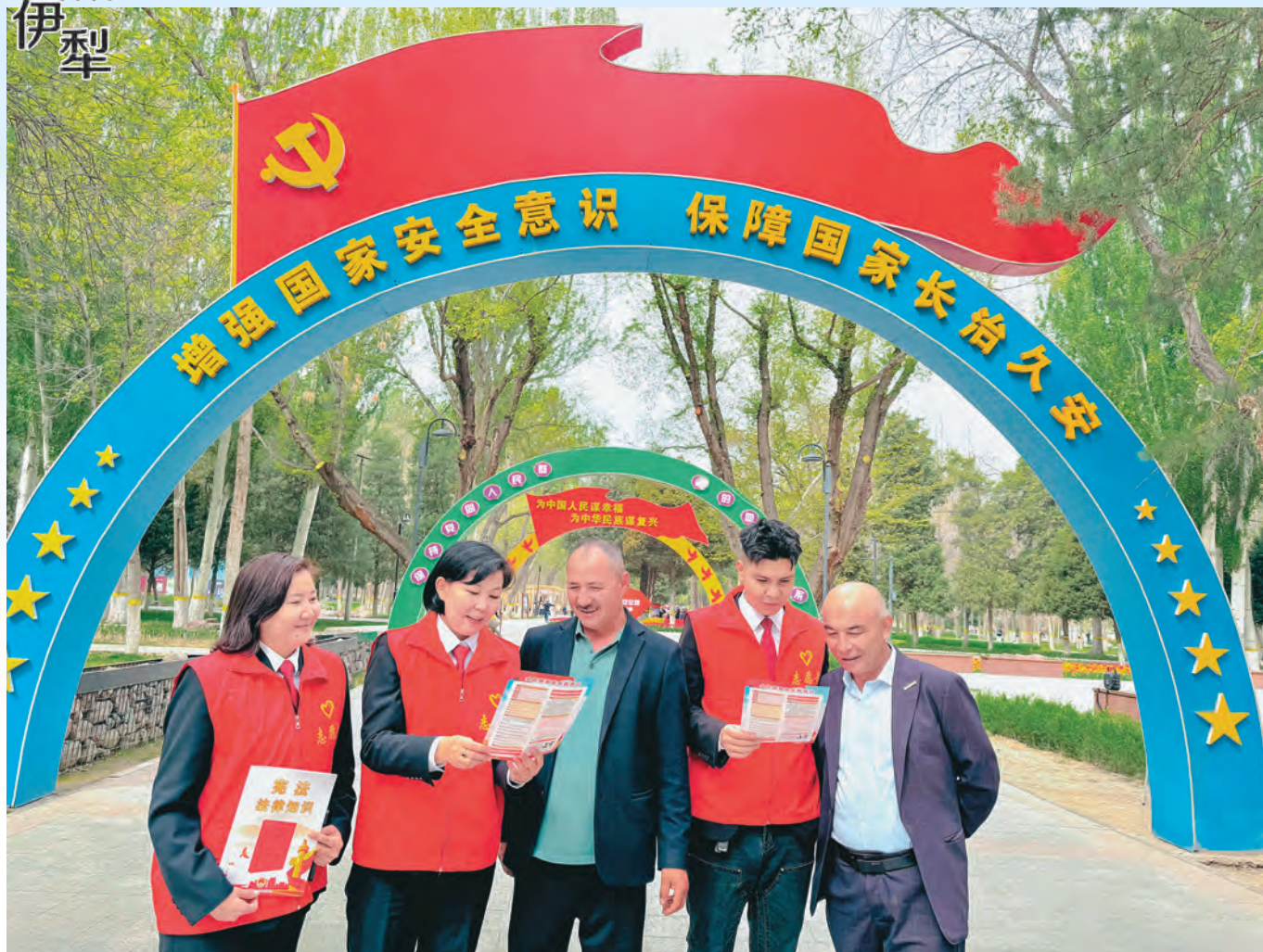
自治区高级人民法院伊犁州分院“石榴籽志愿者”开展普法宣传。