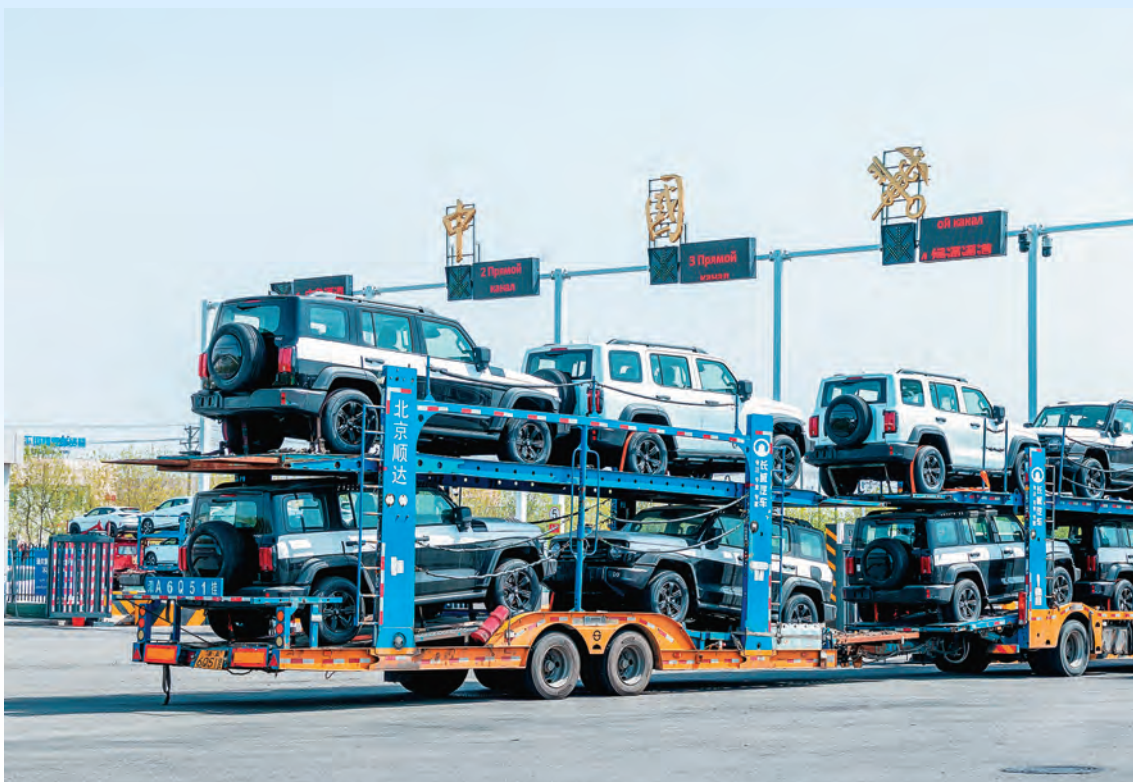
牵引车排成长龙有序驶入霍尔果斯公路口岸集中查验场。

近年来,新疆伊犁哈萨克自治州坚持把党建工作作为促进发展的“红色引擎”,以政策支持企业、以服务护航企业、以发展赋能企业,筑牢“主阵地”、打好“服务牌”、构建“新局面”,为经济社会高质量发展提供坚实支撑。