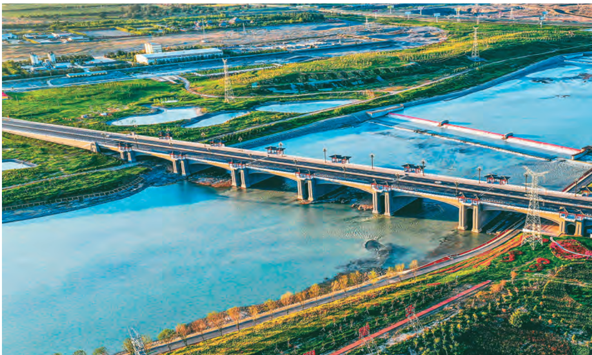
兵地融合交通枢纽石玛大桥。

新疆生产建设兵团第八师石河子市树牢“兵地一盘棋、兵地一家亲”思想,积极探索兵地融合机制,形成兵地深度交往交流交融,各族干部职工群众共同团结奋斗、共同繁荣发展的良好局面。