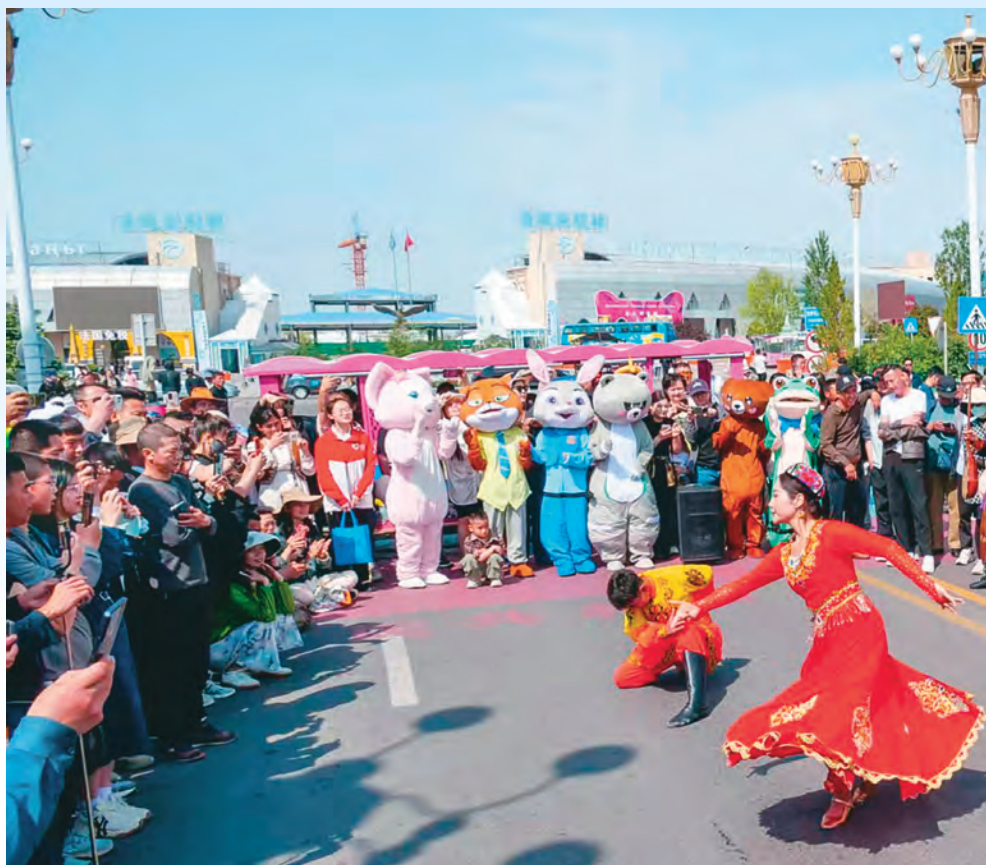
中哈霍尔果斯国际边境合作中心举办快闪活动。

国家对外文化贸易基地(伊犁)深入贯彻习近平文化思想,依托丝绸之路经济带核心区优势,锚定“一平台六中心”(基地公共服务平台、国际会展中心、国际传播中心、中医康养中心、版权交易中心、跨境电商中心、国际文化艺术中心)建设,积极探索“文化贸易+文化出海”发展之路,推动对外文化交流、传播与贸易相互促进、协调发展。