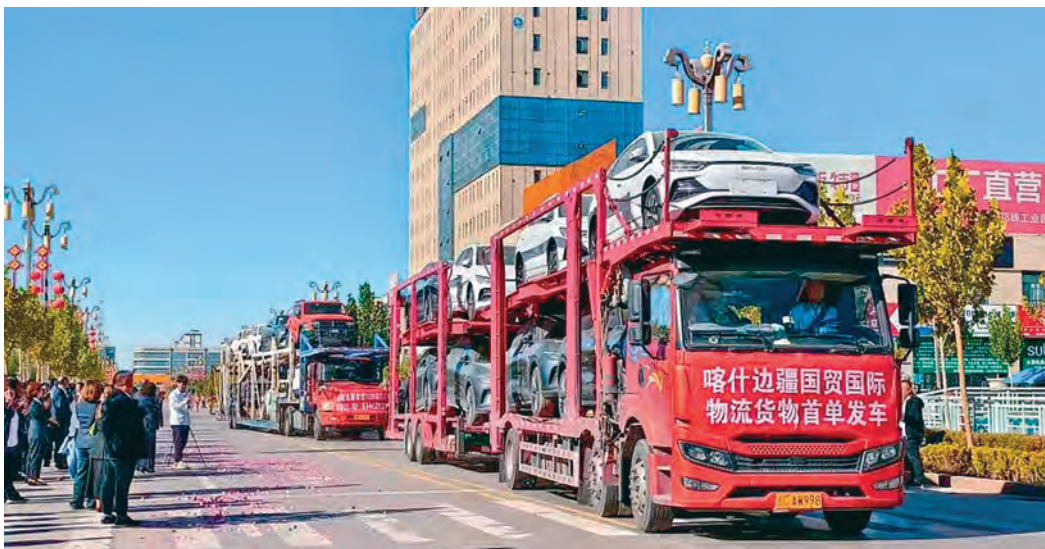
满载货物的货车从喀什边疆国贸交易中心缓缓驶出。