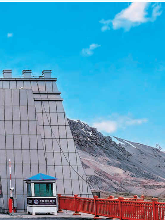
□塔什库尔干塔吉克自治县融媒体供图