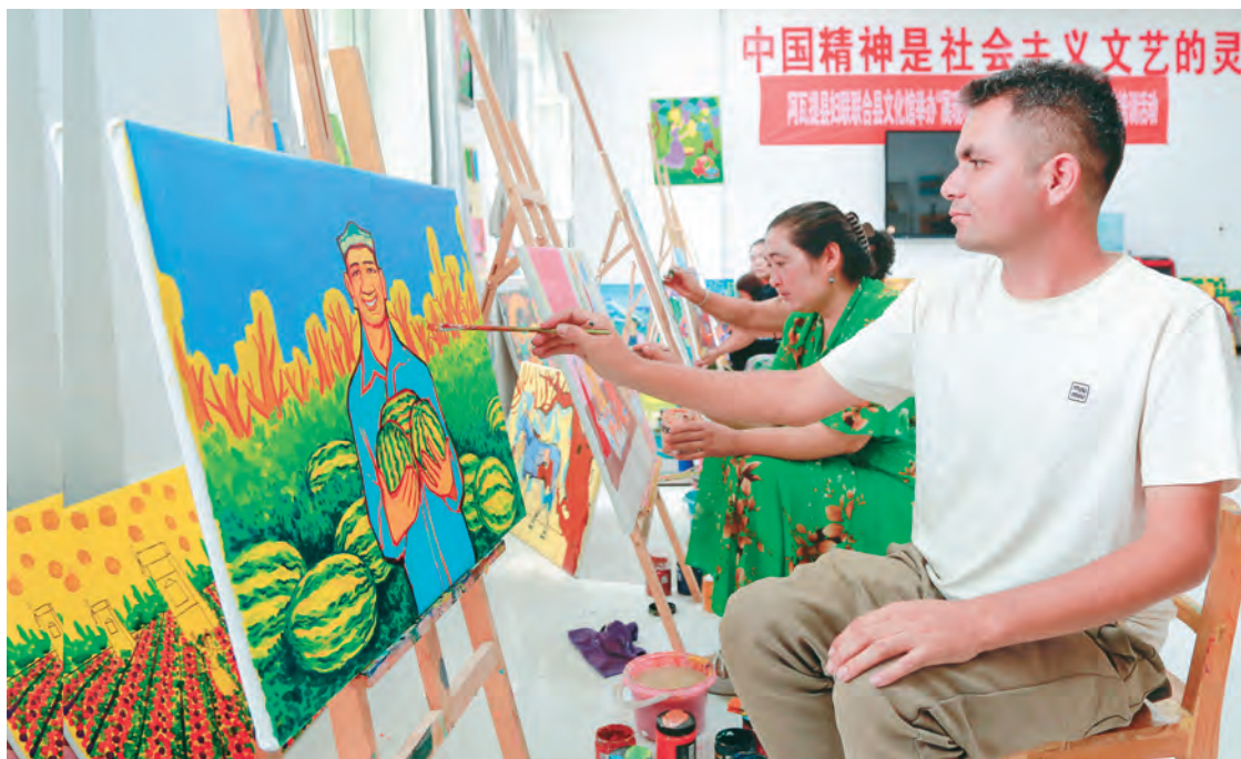
新疆阿瓦提县发挥民间技能人才“传帮带”作用,教授群众绘制农民画拓宽致富门路。