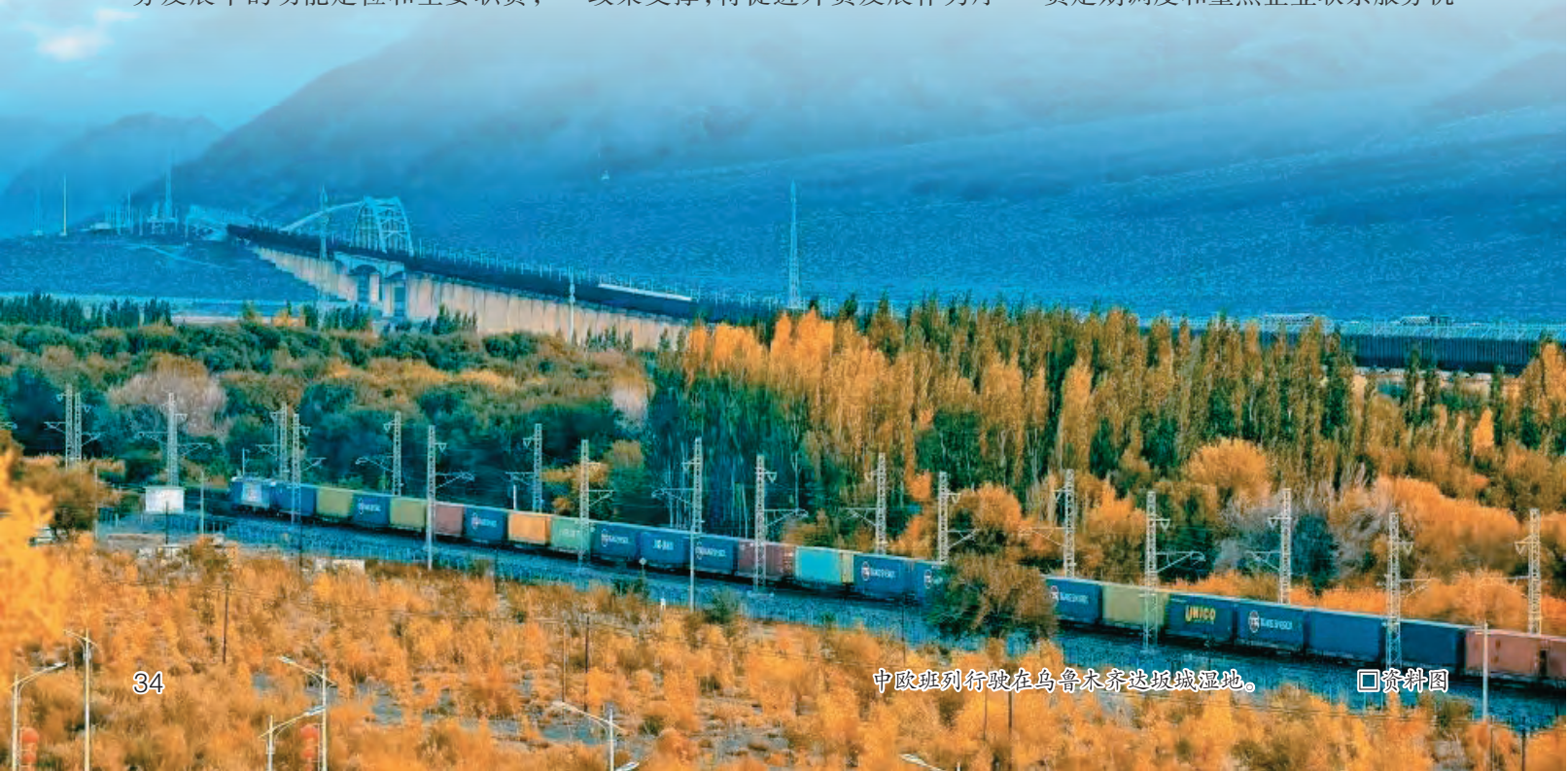
中欧班列行驶在乌鲁木齐达坂城湿地。

党组理论学习中心组、党组会议的重要议题,会同多部门出台促进外贸稳定增长、提升贸易便利化、加快发展外贸新业态新模式等系列政策措施,出台二手车出口、加工贸易发展、金融信保支持、积极扩大进口、边民互市创新发展5轮稳外贸措施,加快拓展外贸新动能,2022年至2024年连续三年保持年均1000亿的增长规模,为全国外贸稳增长、提质量作出新疆贡献。注重协调联动,健全上下贯通、执行有力的组织体系,推动各地制定促进外贸高质量发展“一地一策”,建立地州市外贸定期调度和重点企业联系服务机