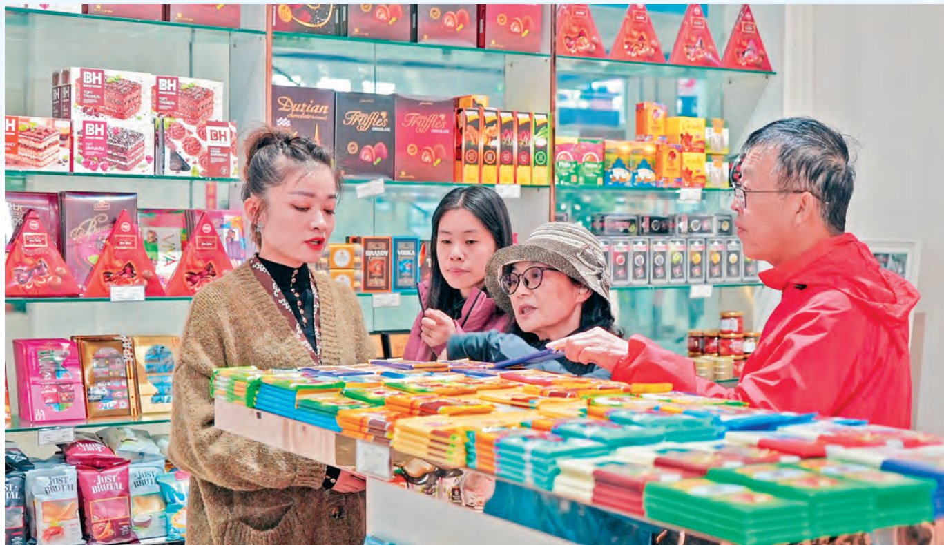
游客在中哈霍尔果斯国际边境合作中心挑选商品。

决机制,积极构建双方调解协议与仲裁裁决互认路径,为“走出去”企业筑牢法治“防火墙”,稳定国际经贸合作预期与信心。通联互促惠民,大力推动跨境民生改善和文旅交流,促成“国门医院”门诊部、东