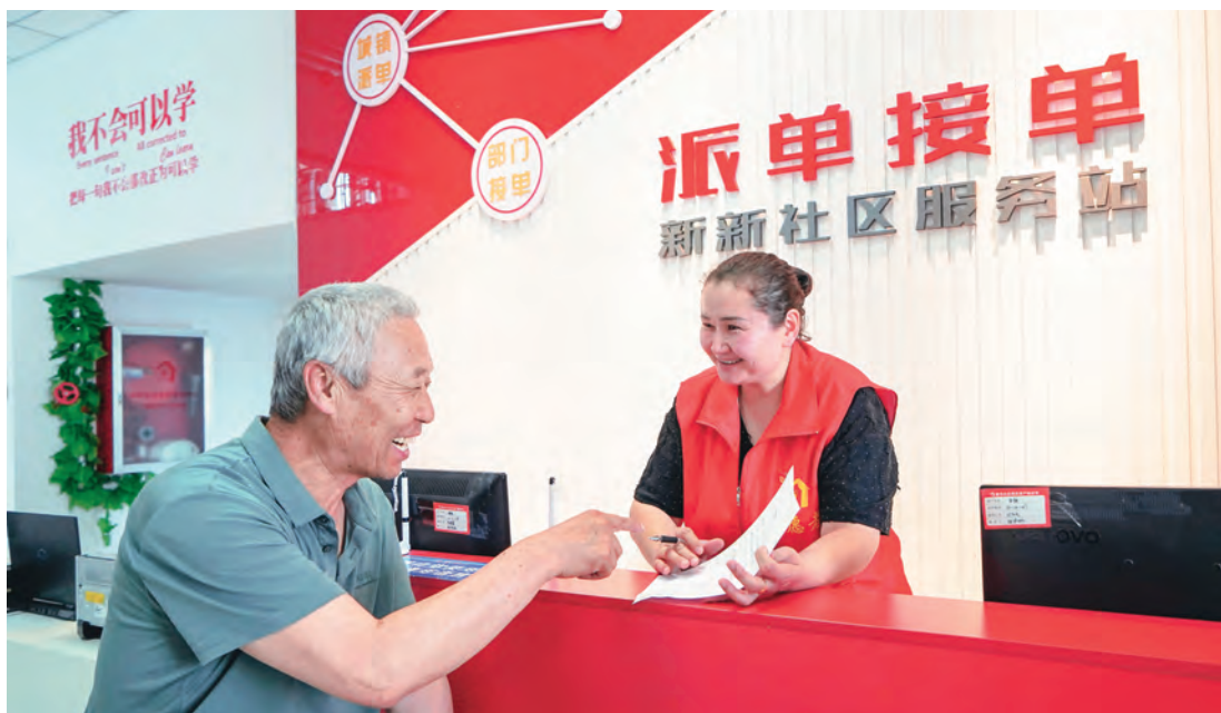
新疆富蕴县库额尔齐斯镇新新社区居民对诉求事项办结情况给予评价。