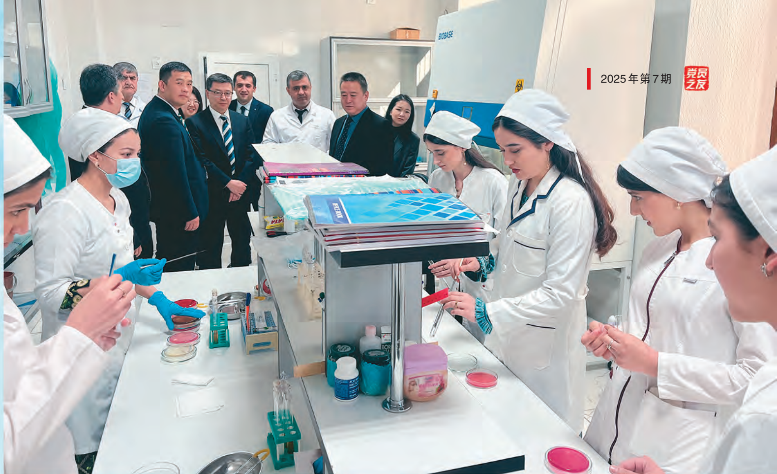
▲新疆医科大学主动融入和服务共建“一带一路”，深入推进对外交流与合作，组团赴塔吉克斯坦与阿维森纳医科大学、哈特隆医科大学相关院系开展交流。 □何丽娟/摄