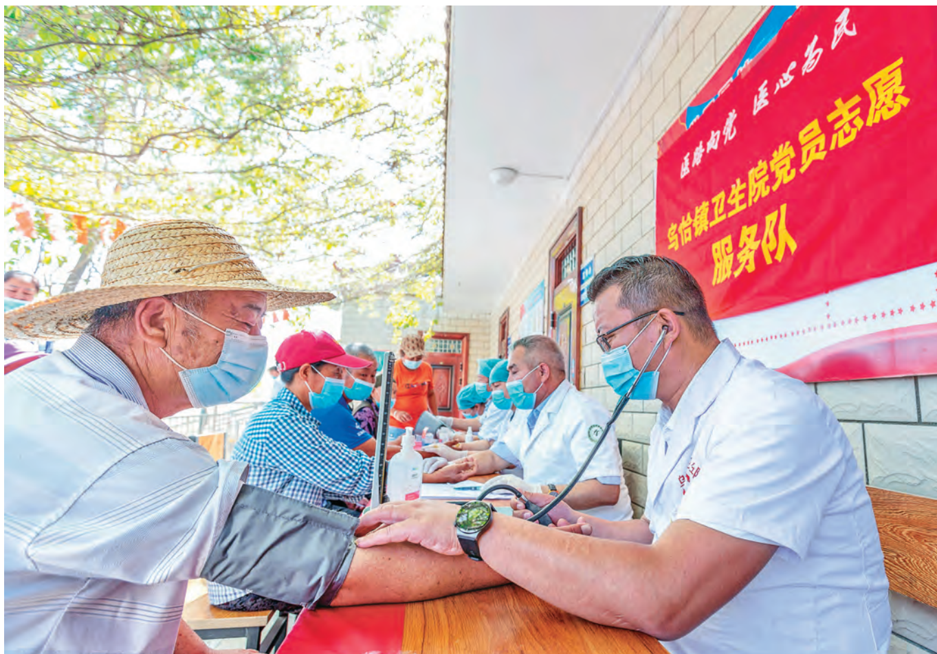
浙江省医疗援疆专家走进库车市乌恰镇开展义诊。