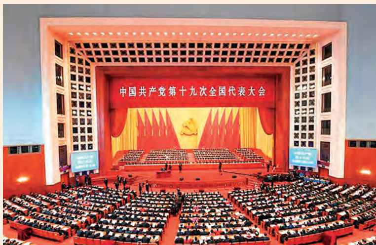
中国共产党第十九次全国代表大会会场。