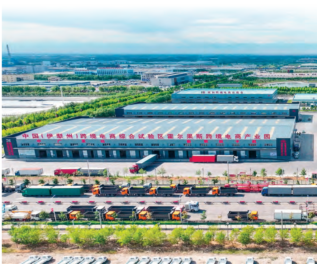
中国(伊犁州)跨境电子商务综合试验区霍尔果斯跨境电商产业园。