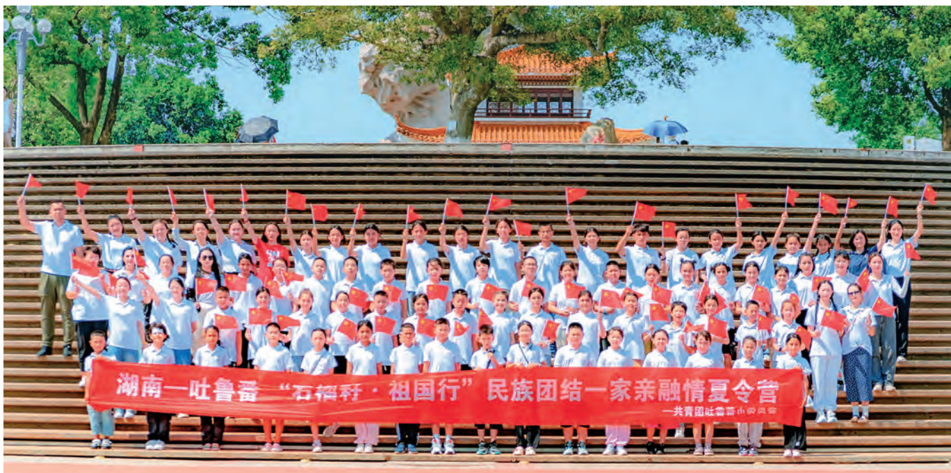
吐鲁番市组织青少年开展“石榴籽·祖国行”民族团结一家亲融情活动。