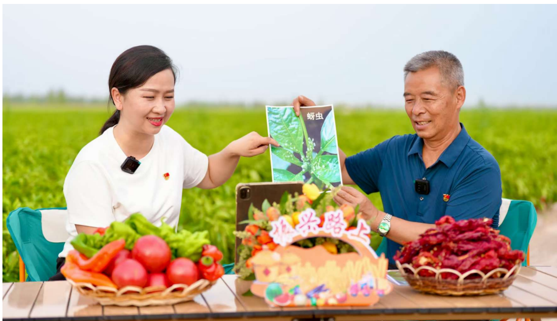
新疆焉耆回族自治县举办“振兴路上·‘耆’力同耕”党员教育网络直播活动,农技专家在线讲解辣椒种植管理技术。