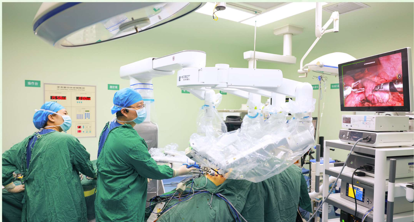
▲阿克苏地区推进公立医院改革,提升医疗服务能力。图为阿克苏地区第一人民医院医生操作微创机器人为患者做手术。