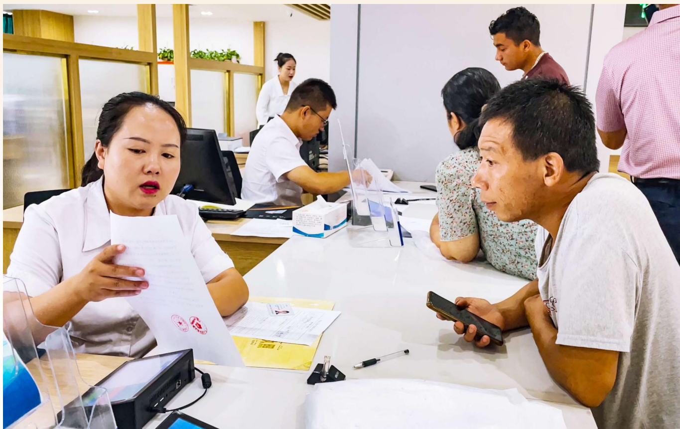
喀什市政务服务中心工作人员为群众办理相关业务。