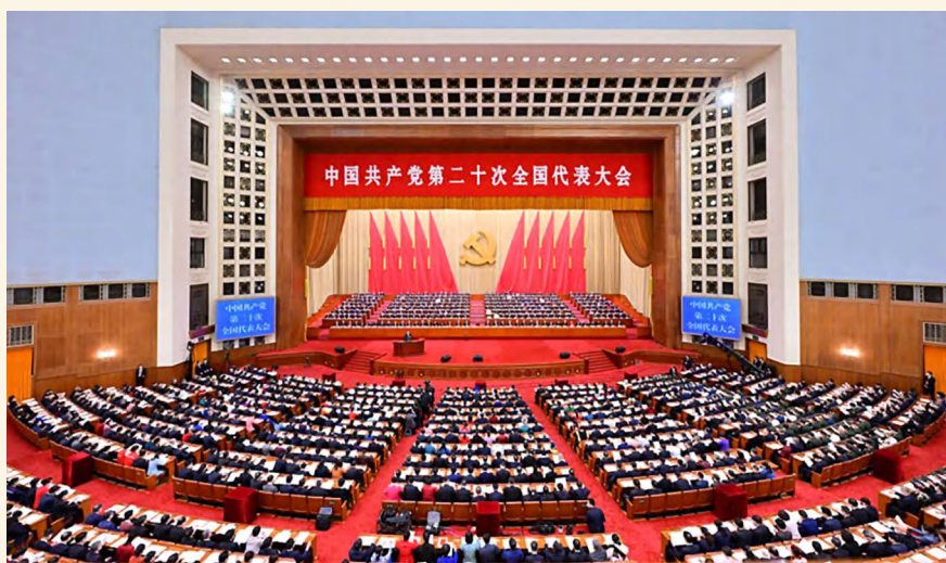
中国共产党第二十次全国代表大会会场。

大会选举产生新一届中央委员会和中央纪律检查委员会,通过关于十九届中央委员会报告的决议、关于十九届中央纪律检查委员会工作报告的决议、关于《中国共产党章程(修正案)》的决议。