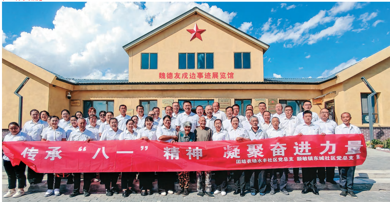
额敏县额敏镇东城社区党总支联合第九师白杨市团结农场水丰社区党总支共同开展“传承‘八一’精神 凝聚奋进力量”党日活动。