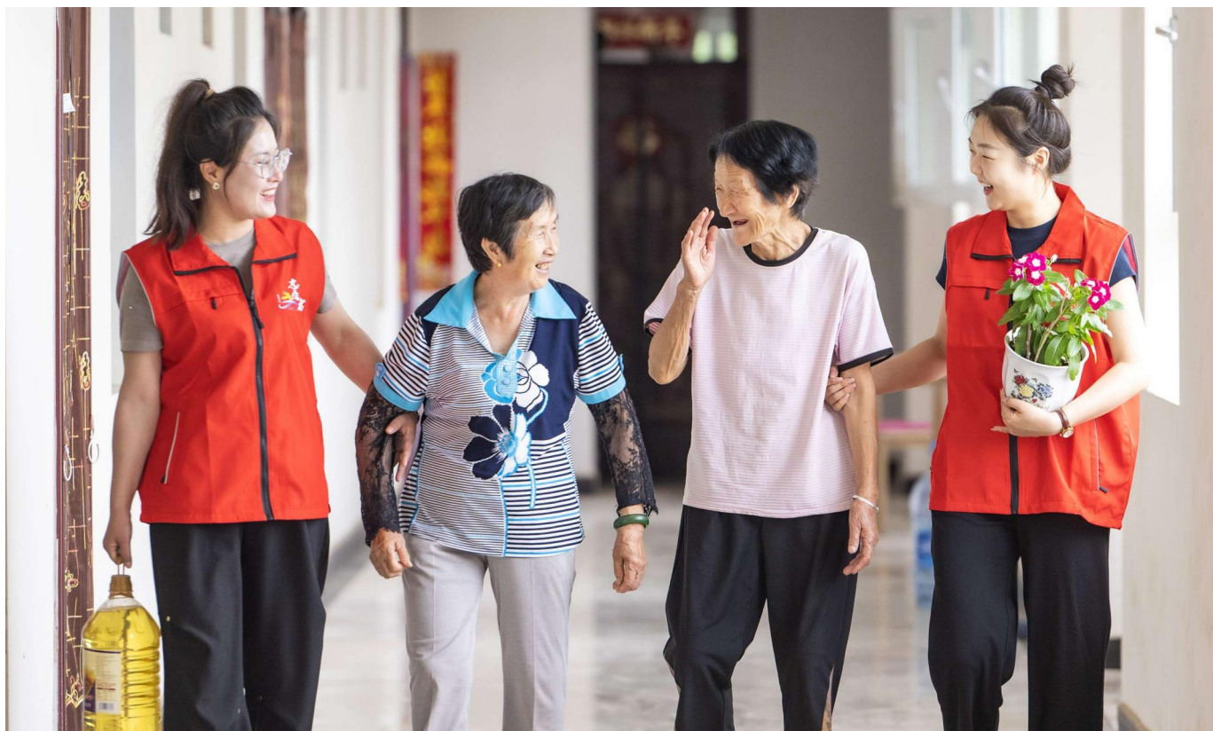
新疆吉木萨尔县进一步发挥社会救助兜底保障作用,推进农村互助幸福院建设。