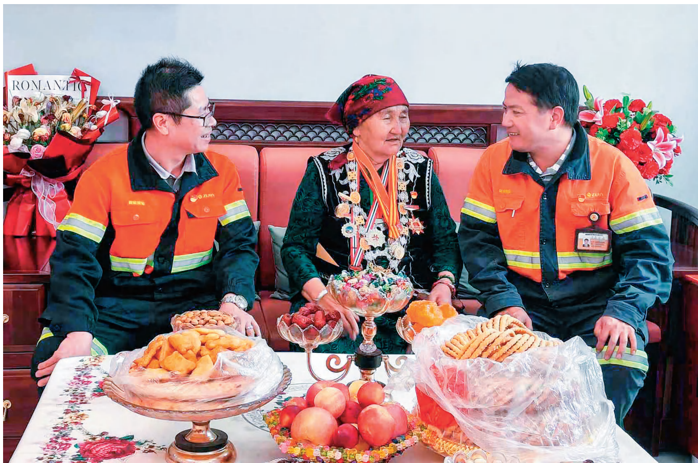
克州党员干部向“人民楷模”布茹玛汗·毛勒朵学习取经。