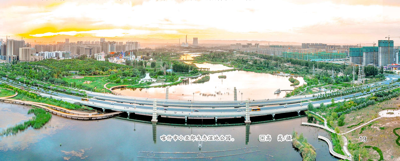
喀什市小亚郎生态湿地公园。