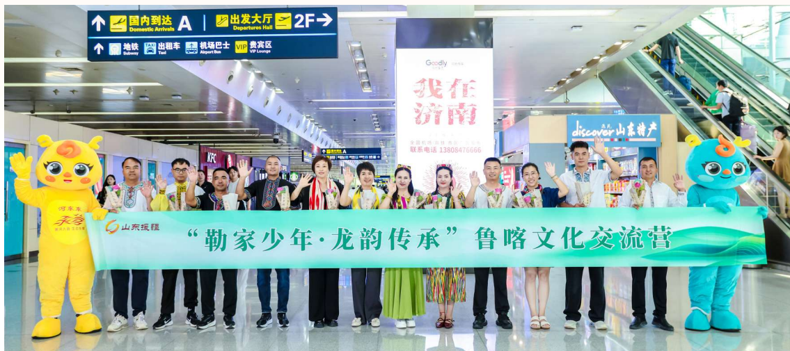
东营援疆工作指挥部联合疏勒县开展“勒家少年·龙韵传承”鲁喀文化交流活动。