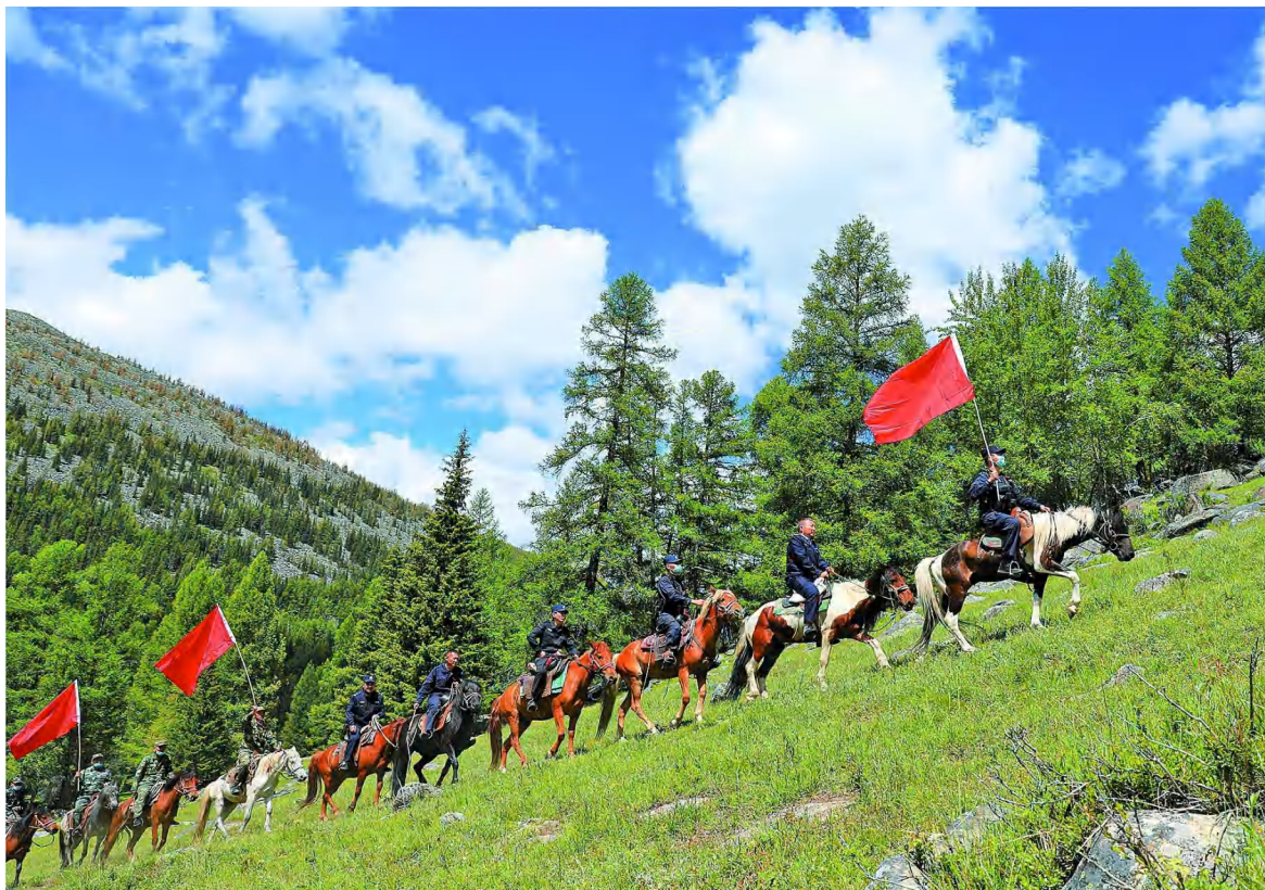
富蕴县库卫边境派出所民警带领护边员开展巡逻。

近年来,新疆阿勒泰地区着力打造“雪都筑堡垒·边关党旗红”党建品牌,健全基层组织体系,强化惠民安边举措,积极拓宽兴边路径,扎实推动党建引领强边固防、基层治理、兴边富民。