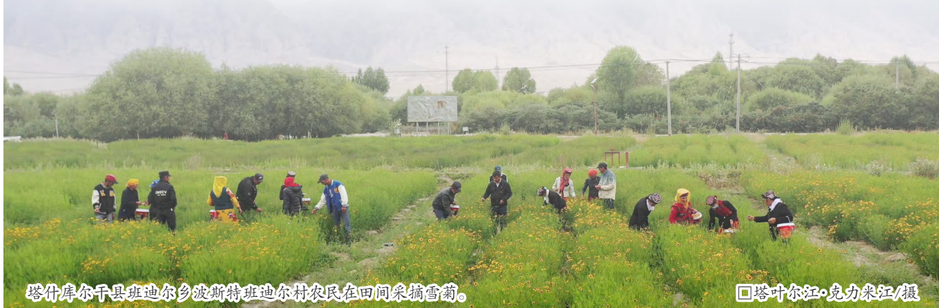
塔什库尔干县班迪尔乡波斯特班迪尔村农民在田间采摘雪菊。