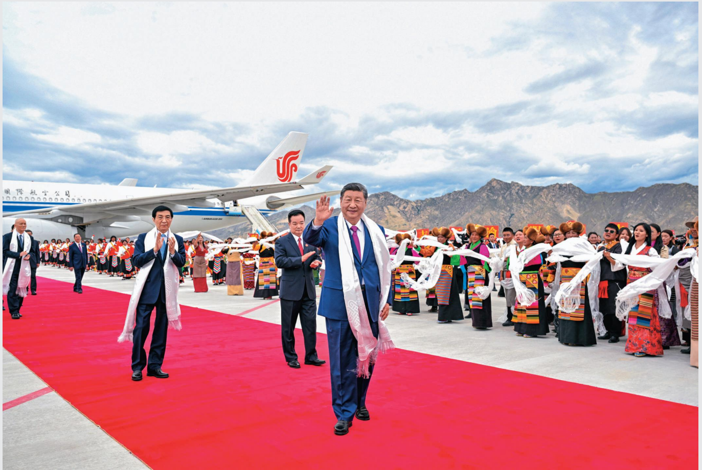
8月20日中午,中共中央总书记、国家主席、中央军委主席习近平率中央代表团乘专机抵达拉萨,出席西藏自治区成立60周年庆祝活动。这是习近平向欢迎群众挥手致意。