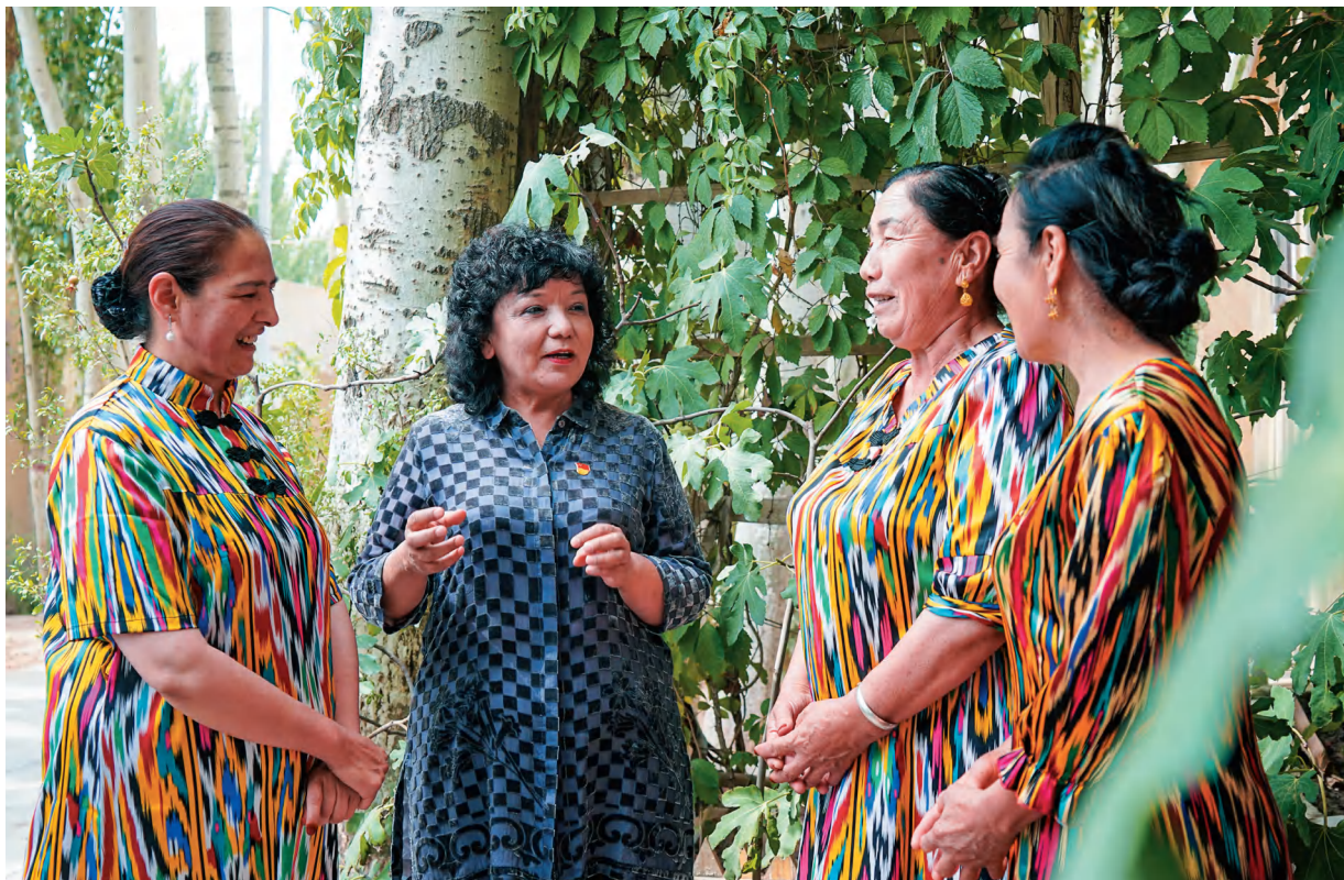
喀什市乃则尔巴格镇前进村党支部书记向志愿服务队成员传授工作方法。

大讲堂”等专题培训,增强干部实干本领。组织触角深扎基层,健全“社区党组织—网格党支部—楼栋(巷道)党小组”和“行政村党组织—村民小组党小组—党员中心户”三级架构,完善村(社区)运行工作机制,将组织触角延伸至每个基础单元,形成统一指挥、职责清晰、高效联动的治理格局。工作力量直达一线,