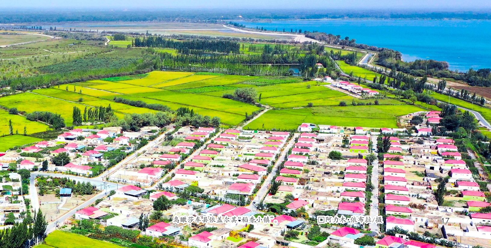
鸟瞰莎车县依盖尔其“稻香小镇”。