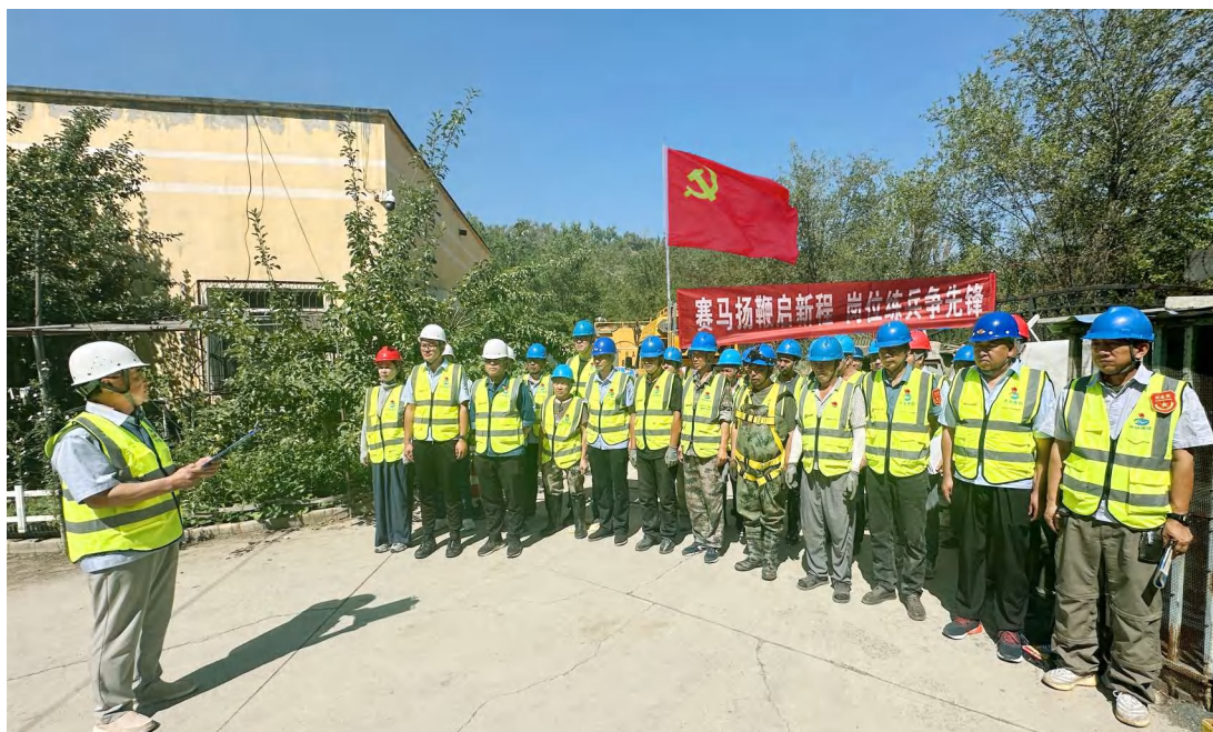
乌鲁木齐水业投资发展集团有限公司排水公司党支部组织开展岗位练兵活动。

联防联控,建立“火山口边境党建联建”工作机制,与相关单位签订联建协议,定期召开联席会,搭建学习交流、研究聚智、信息通报、会商攻坚四大协作平台,实现大事共议、要事共决。延伸触角,在抵边乡设立红旗党支部、党小组和党员驿站,采取“党员中心户+抵边牧民户”模式,科学划分“红色微网格”,推动基层党建、民生服务、边防事务等“一网通办”。