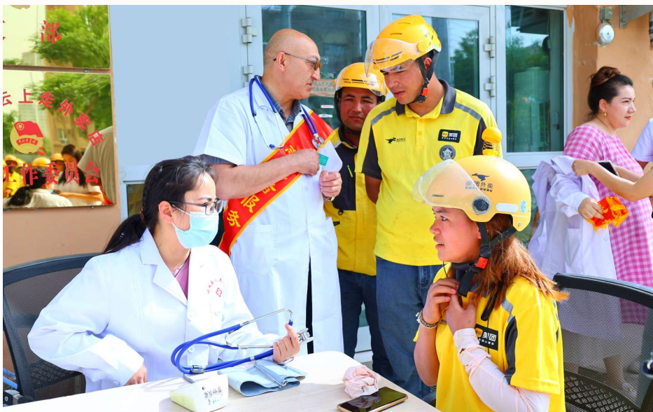
叶城县人民医院志愿服务医疗队在社区开展义诊活动。