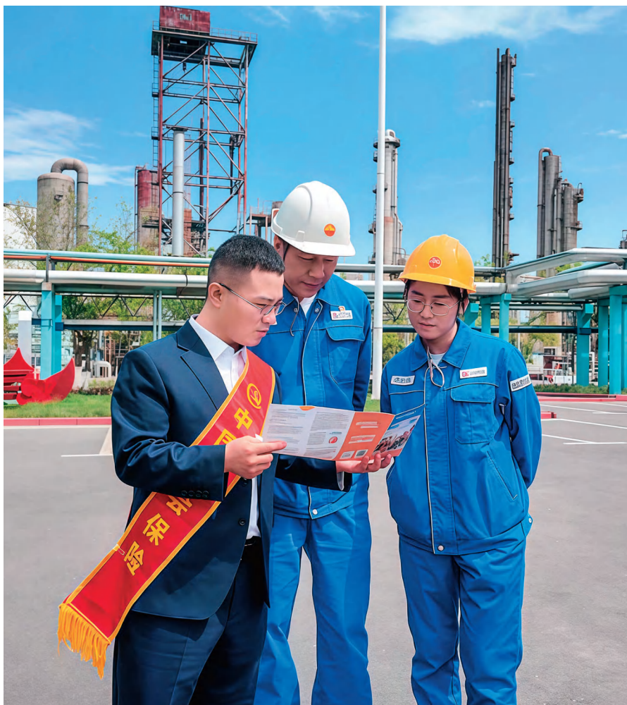
自治区人力资源和社会保障厅组织党员志愿者为企业职工宣传社保政策。