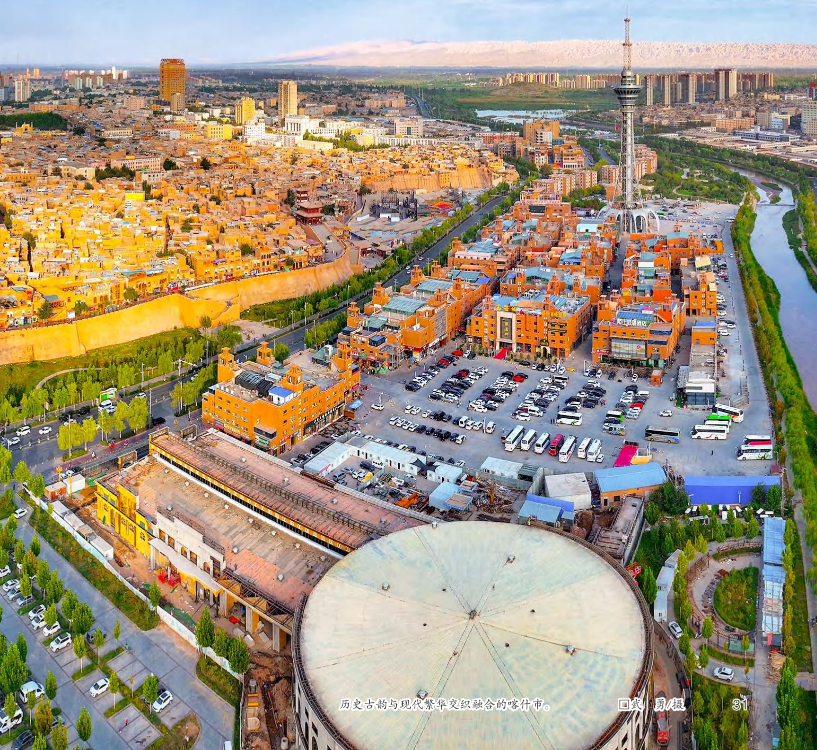
历史古韵与现代繁华交织融合的喀什市。

夜幕降临,古城里热闹非凡,烤包子、烤羊肉等美食香气扑鼻,民宿里飘来悠扬的乐曲声,游客们在这里品尝美味,感受喀什的烟火气。而城市的灯光也亮起,到处流光溢彩,车水马龙。喀什,这座历史古韵与现代繁华相得益彰的城市,以其独特的民俗风情,吸引着越来越多的人前来探访。 [责任编辑:陆海涛]