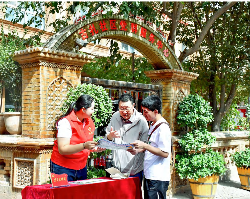
博依街道古扎社区组织党员为游客提供服务。