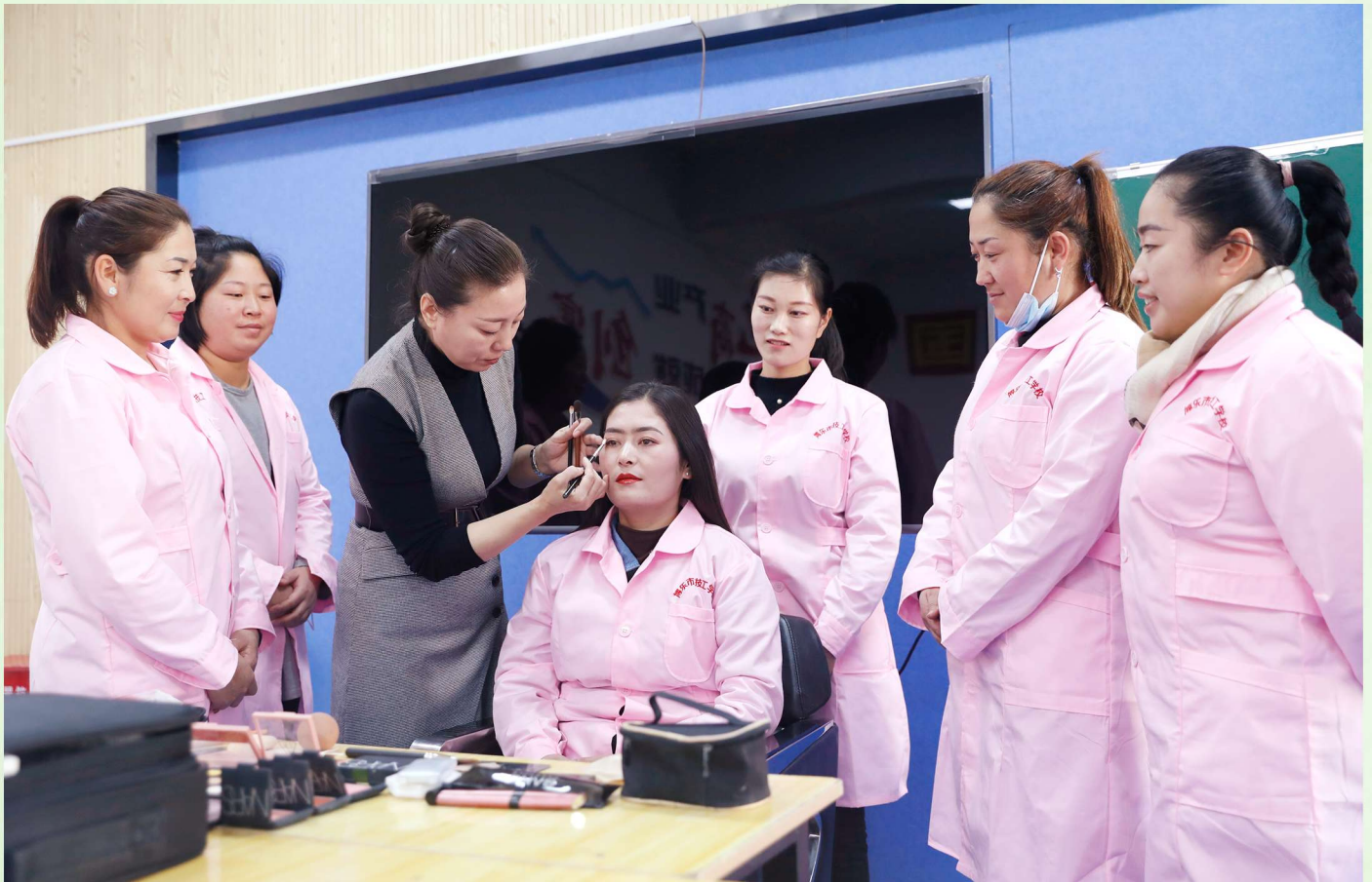
▲精河县抓住稳就业这个关键,开办各类就业技能培训班,千方百计拓宽群众就业渠道。