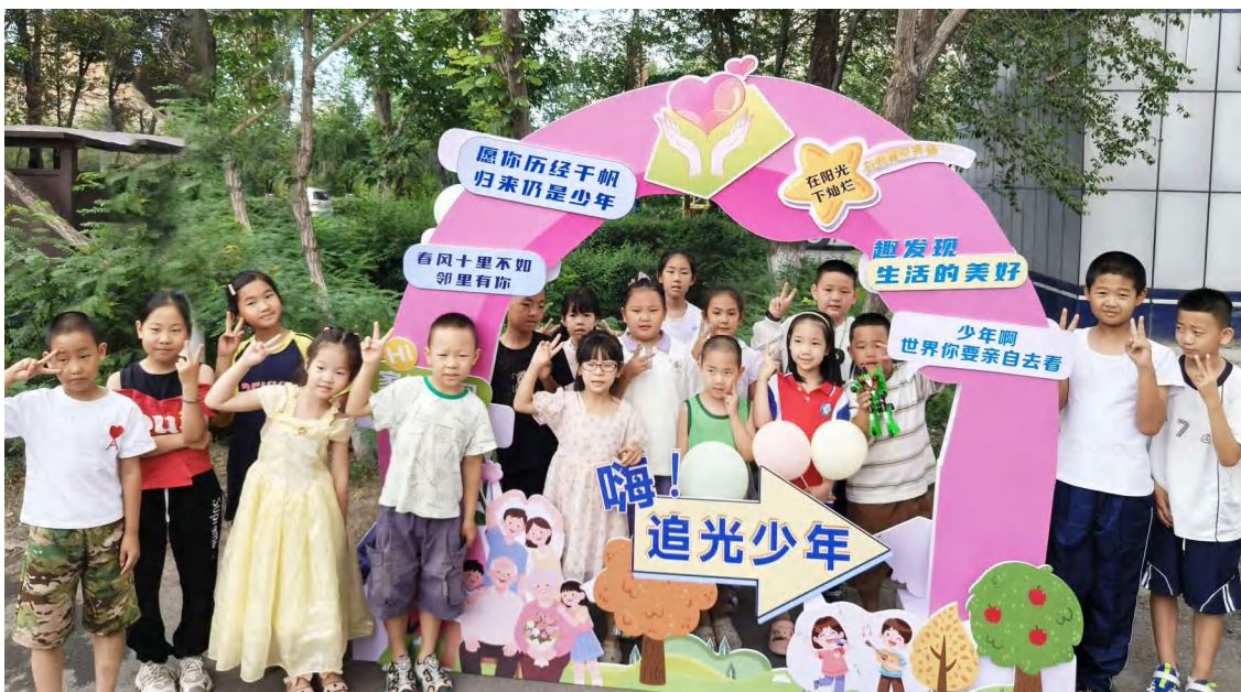
乌鲁木齐市米东区地磅街道东瑞北路社区党总支开展青少年闲置物品共享公益活动。

新疆乌鲁木齐市米东区地磅街道东瑞北路社区党总支积极整合各类资源,搭建多元服务平台,创新手段服务居民,让社区治理效能、居民生活幸福指数节节攀升,2021年6月荣获“自治区先进基层党组织”称号。