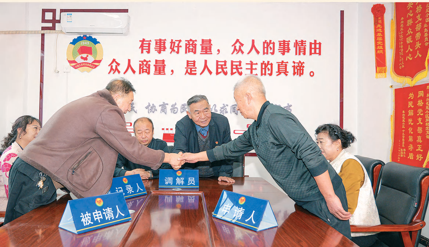
▲阜康市阜新街道迎宾路社区党委充分发挥人民调解员作用,筑牢矛盾纠纷化解的“第一道防线”。