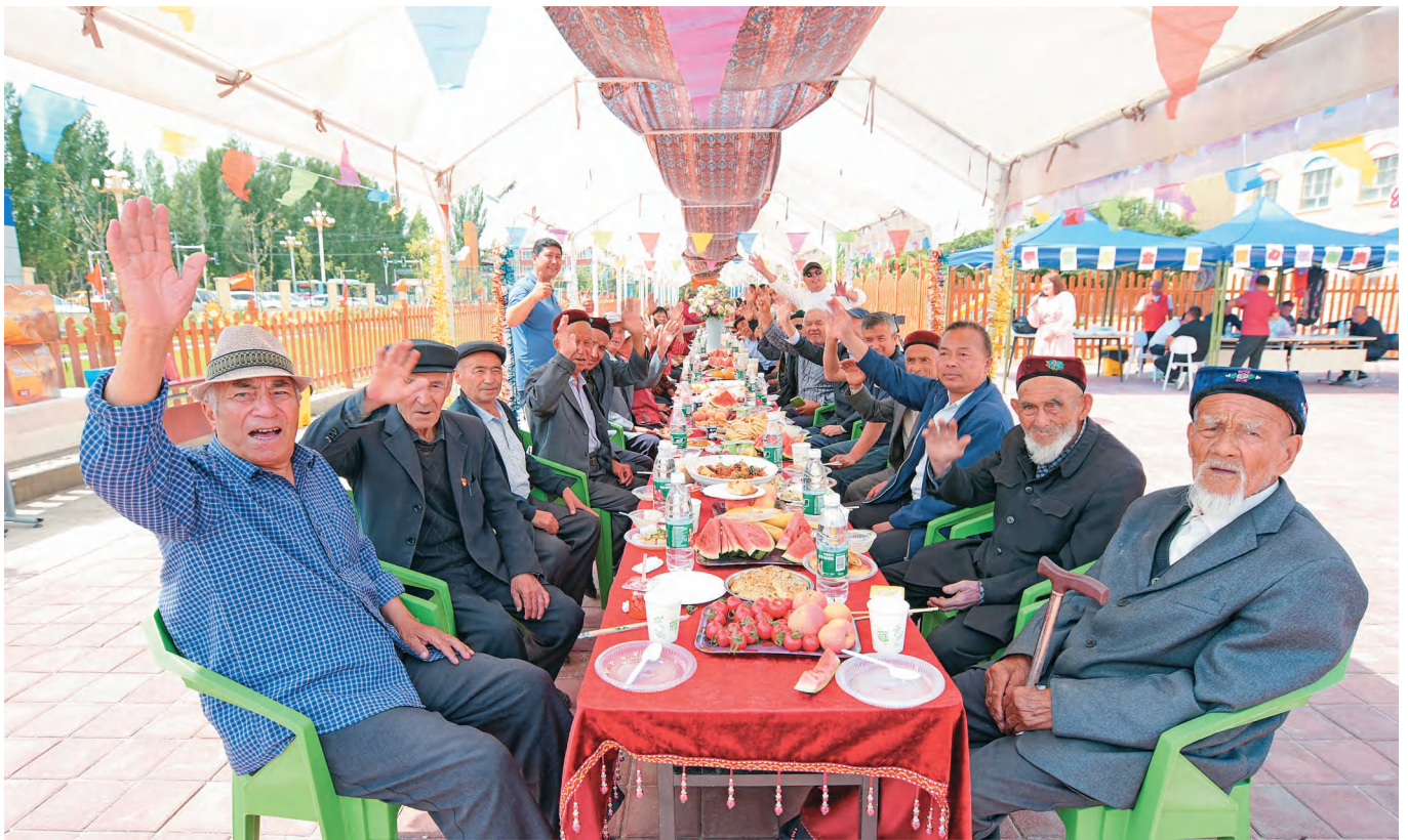
博乐市青得里镇阿里翁白新村举办“民族团结一家亲”和民族团结联谊活动。