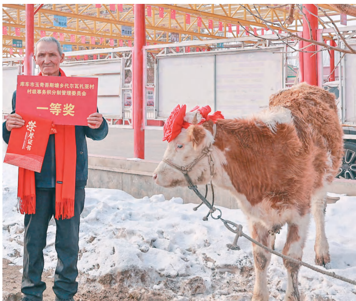
库车市玉奇吾斯塘乡为年度积分排名第一的村民奖励育肥肉牛。