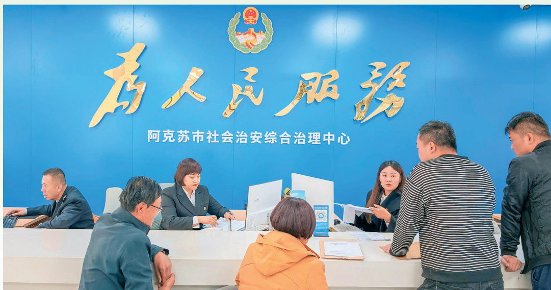
群众在阿克苏市社会治安综合治理中心办理业务。