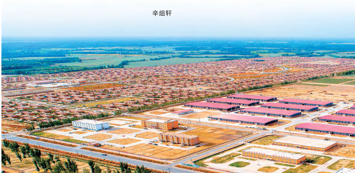
新疆叶城县阿克塔什镇乡村新貌。

新疆奇台县半截沟镇腰站子村通过党组织牵头,探索现代农业产业多元化发展有效路径,推动乡村旅游等融合发展,2024年实现总产值5.1亿元;拜城县老虎台乡托普鲁克村依托民兵骑兵团红色资源和传统养马习俗,大力推动马产业与其他产业融合发展,带动就业30余人,脱贫户分红62.85万元……放眼全区,在党建引领下,一幅村美民富产业旺的和美乡村新画卷正在天山南北徐徐展开。