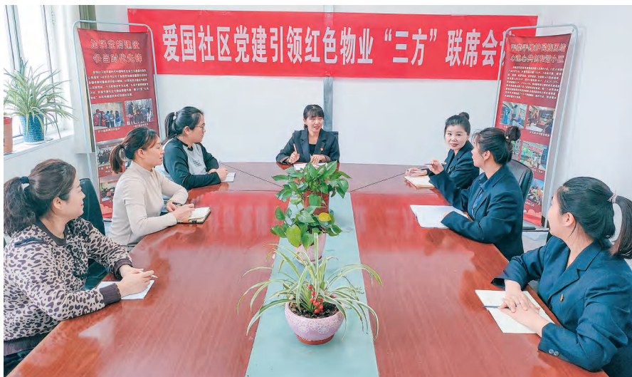
塔城市新城街道爱国社区召开党建引领红色物业“三方”联席会议协调解决治理难题。

筑牢“红色堡垒”。 健全组织体系,搭建“街道党工委—社区党组织—居民小区党组织”三级组织架构,推动党组织触角向小区、楼宇末梢延伸,进一步织密组织体系。精准摸排排查,针对商圈新业态集聚、新就业群体多、党员流动性强等特点,通过实地走访、电话核实等方式,开展全覆盖摸排,动态掌握党组织与党员情况,夯实党建工作基础。凝聚党建合力,发挥商圈党群服务