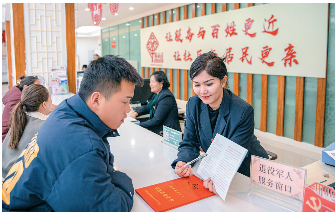
新疆托里县镜泉社区党群服务中心工作人员为退役军人解读返乡创业优惠政策。