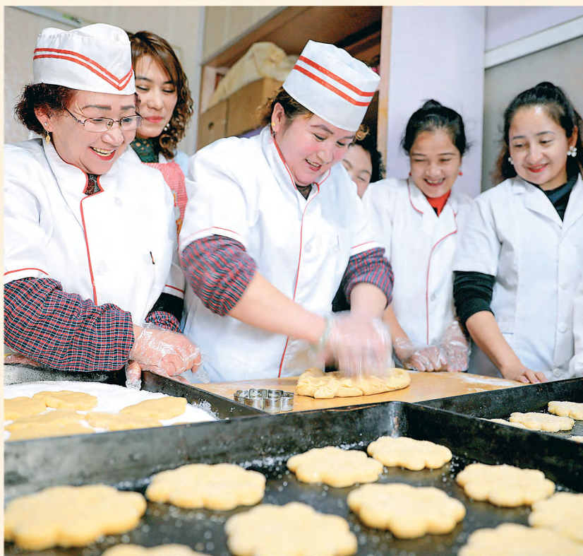
▲且末县且末镇却格里买亚社区开展糕点制作技能培训,帮助居民掌握一技之长,提升就业创业能力。