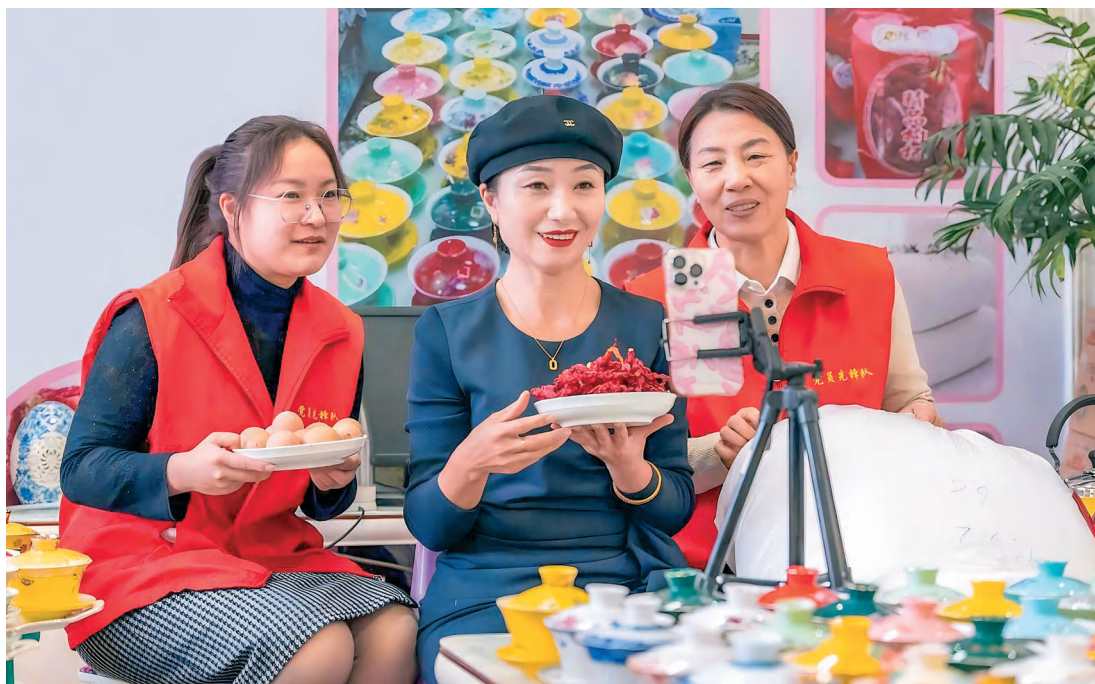
新疆乌苏市政务服务中心党员先锋队通过直播帮助农户销售农产品。

搭建培训矩阵,打造“1+6+X”党员教育培训阵地,以干部教育培训基地为主,联动纪念馆、乡村示范点、企业实践点等6类现场教学点,延伸打造若干特色教学点,形成全域覆盖的党员教育网络。用好本土资源,优选县域内产业发展、铸牢中华民族共同体意识等线上教育资源,开发《情满于田》等精品党课、《山海情深 石榴花开》等特色教学案例,打造《浪漫治沙人》典型,让党员教育“走新”更“走心”。创新载体形式,开展“学习身边榜样”活动,举办短视频创作大赛,以赛促学、以学促用,推动党员教育融入日常、抓在经常。(艾青)