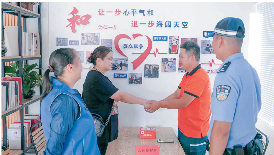
克拉玛依市公安局克拉玛依区分局胜利路街道派出所民警成功调解一起矛盾纠纷。

新疆克拉玛依市公安局克拉玛依区分局胜利路街道派出所党支部深入践行新时代“枫桥经验”，深耕基层沃土，全力守护一方平安，派出所被命名为自治区“枫桥式公安派出所”。