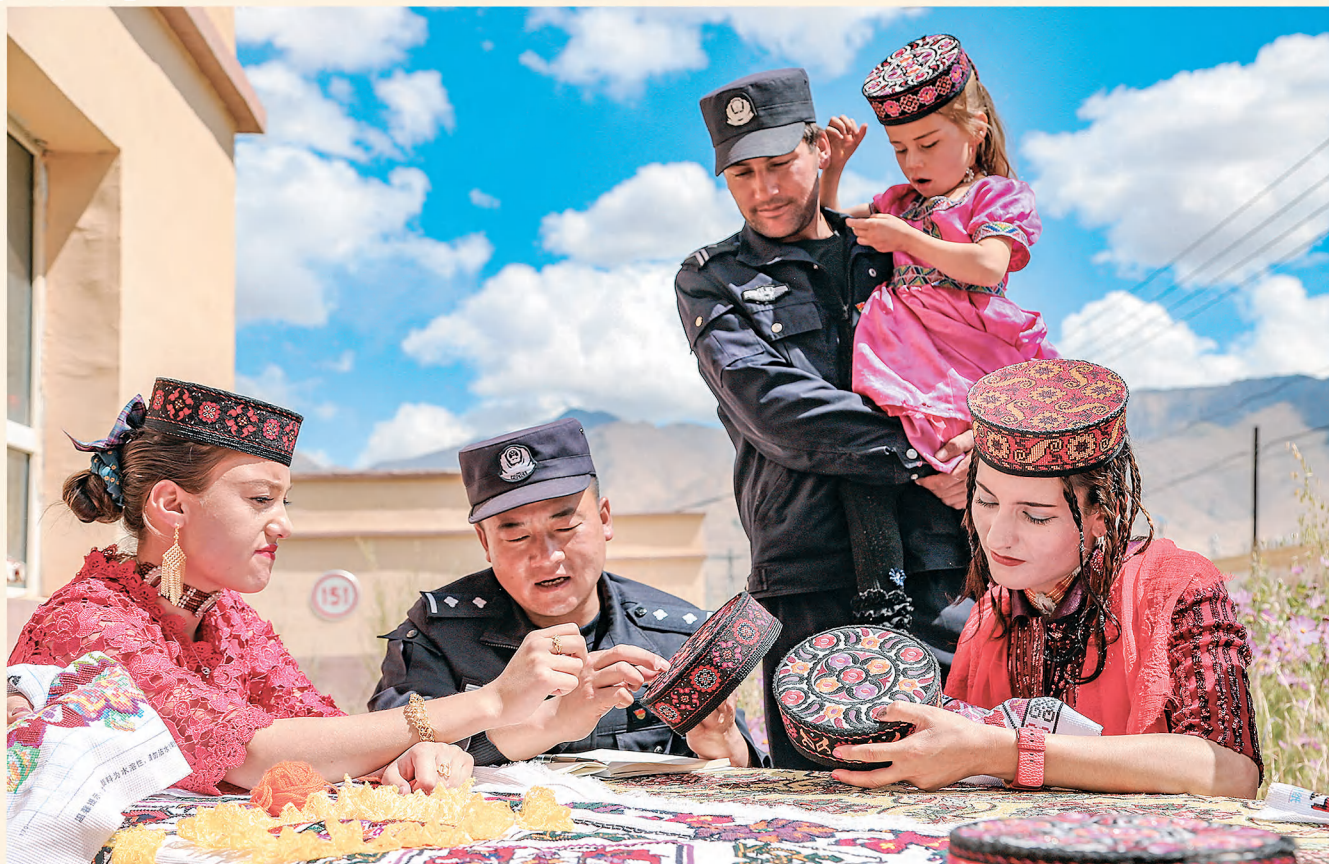
▲喀什边境管理支队塔什库尔干边境派出所民警与牧民一起拉家常、听心声、话平安,帮助群众解决实际困难,着力建设平安边境牧区。